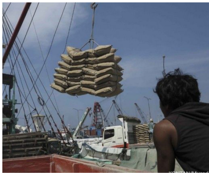
工人正在船上装载Surya Tata Alam Raya公司生产的砂浆水泥(Mortal Semen)。