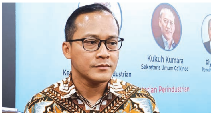
工业部海事、交通工具及国防装备产业司司长马哈迪·通古尔·维恰克索诺。

【本报讯】工业部表示, 已享受整车 (CBU) 电动汽车进口优惠政策的企业, 须自2026年起履行在印尼生产的义务, 并达到规定的本地化率 (TKDN)。