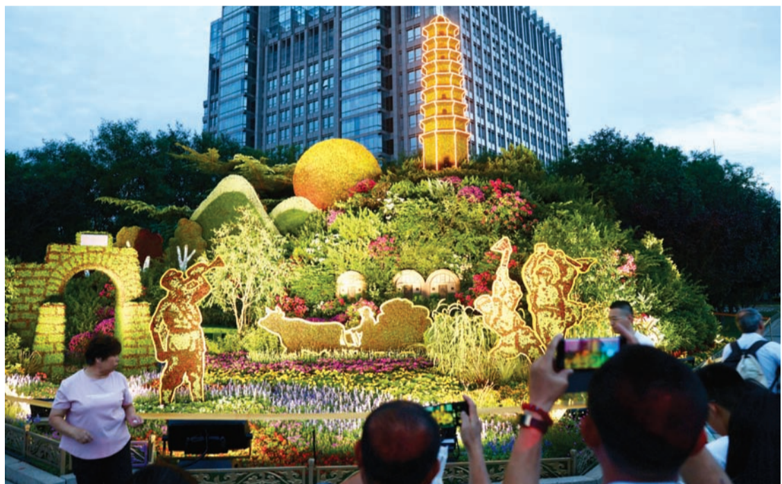
8月22日, 亮灯的纪念抗战胜利80周年主题花坛扮靓北京长安街, 吸引民众参观打卡。中新社记者 易海菲 摄

【中新社北京讯】8月26日, (记者 徐婧) 中国人民抗日战争暨世界反法西斯战争胜利80周年纪念活动期间, 北京在长安街沿线布置10组立体花坛。记者26日从北京市园林绿化局获悉, 目前花坛花卉布置已完工, 10组花坛亮相。