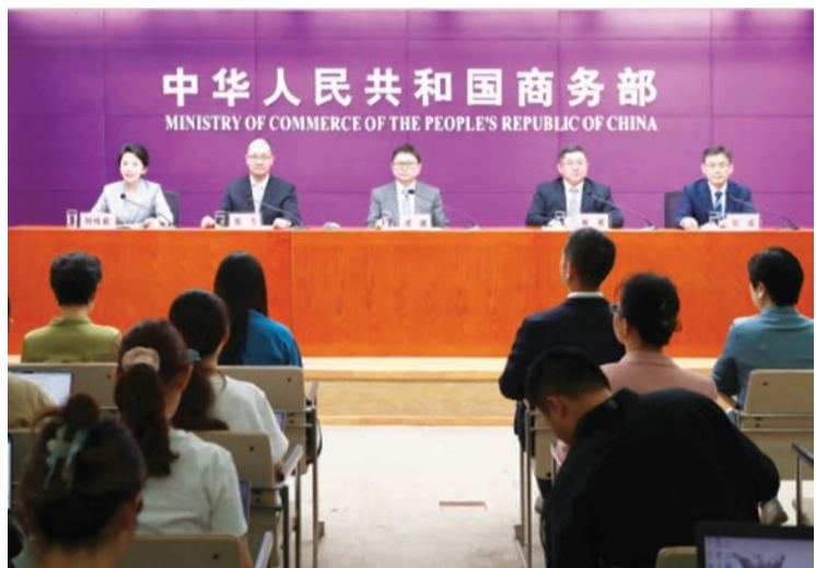
商务部召开上海合作组织经贸合作专题吹风会。

【中新社北京8月27日电】当前上海合作组织经贸合作持续深化，中国商务部副部长兼国际贸易谈判副代表凌激27日在北京称，未来将与更多成员国、观察员国、对话伙伴升级投资和贸易方面协定。