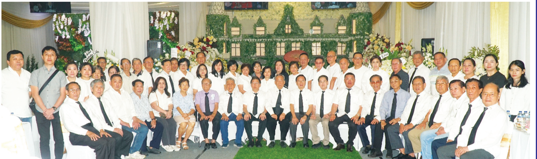
与会各社团领导及代表出席吊唁仪式后合影。