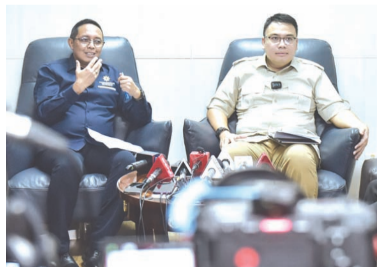
2025年8月26日,印尼总统府通信办公室主任哈桑·纳斯比(左)与通信与数字部副部长安加·拉卡(右)在雅加达发表新闻声明。

【本报讯】印尼政府要求包括TikTok和Meta在内的社交媒体平台管理者共同保护公众免受不实信息侵害,特别是虚假信息、诽谤和仇恨言论。政府认为这些内容可能侵蚀民主根基。 通信与信息技术部副部长安加·拉卡·普拉博沃于2025年8月26日周二晚间在雅加达总统府通讯办公室主任哈桑·纳斯比讨论时表示:“这些内容正在破坏民主基础。比如当我们试图表达观点时,社交媒体上却充斥被篡改或添加的不实信息,这严重挫伤了我们的表达诉求的积极性。”据其透露,政府已邀请亚太区TikTok及Facebook、Instagram母公司Meta共同商讨这一问题,唯独未邀请平台X的管理者,因其在印尼未设立办事处。 副部长补充称:“必须告知公众,平台X在印尼没有设立办公室。他们理应遵守印尼现行法律法规。”安加同时呼吁全体民众包括媒体机构共同维护数字空间,对传播信息