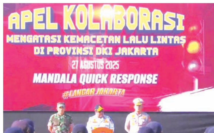
2025年8月27日,雅加达副省长拉诺·卡尔诺在国家纪念碑广场主持“交通拥堵协同治理”雅加达省政府、国军和国警三方联合集会。

用智能技术。雅加达省政府正在开发基于人工智能的智能交通控制系统(ITCS),该系统已在全省321个交叉路口中的65个投入应用。他解释称:“实践证实该系统能降低15-20%的车辆等待时间,同时成为车辆税费和排放监管基础。我们还与雅加达警方通过曼达拉快速响应系统合作,依托与交通部门监控摄像头集成的地理信息系统(GIS)技术实现实时交通监控。未来将扩大系统覆盖范围,让更多市民受益。” 此外,省政府还通过基于GIS的曼达拉快速响应系统与警方协作,该集成系统可实时监控路况,后续将持续扩展技术覆盖范围。拉诺总结道:“这