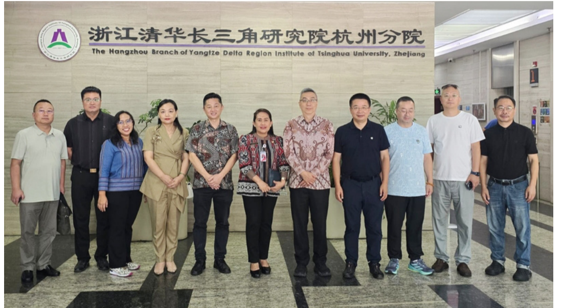
雅加达工业、贸易、合作社及中小企业局局长伊丽莎白访问浙江清华长三角研究院杭州分院。

伊丽莎白局长还突出雅加达取得的多项经济成就,如2024年第四季度经济增长率达5.01%,对全国经济贡献度达16.71%;2024年累计