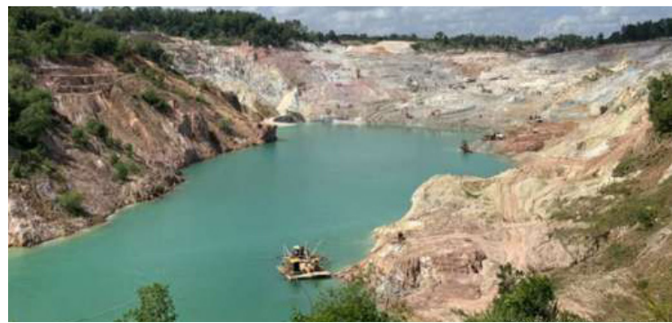
锡矿(Timah/TINS)公司计划, 在冲积层锡储量枯竭后开发原生锡矿。

根据过去五年的发展情况, 2020-2024年锡金属资源量和储量价值将比2023年增加1.95亿吨, 锡矿总储量将增加6900万吨。(sl)