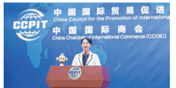
中国贸促会举行8月例行新闻发布会。

她还提到，中国德国商会发布的调查报告显示，92%的德企愿继续深耕中国市场，超过半数德企计划未来两年增加对华投资。中国美国商会2025年度《中国商务环境调查报告》显示，近一半的会员企业仍将中国列为全球前三大投资目的地之