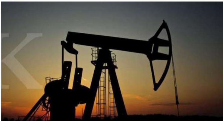
Pertamina Hulu Sanga Sanga (PHSS) 公司石油钻井设施。

【本报讯】Pertamina Hulu Sanga Sanga (PHSS) 是北塔米纳上游印尼 (Pertamina Hulu Indonesia/PHI) 旗下子公司, 其石油日产量从1月份的12,500桶(BOPD)至2025年6月底提高7.2%, 成为每日生产13,400桶。 与此同时, 天然气日产量从8679万标准立方英尺(MMSCFD)提高13.4%, 成为9843万标准立方英尺。