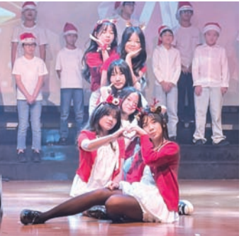
小学生们精彩表演。