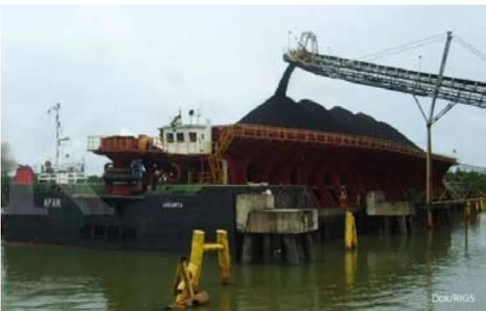
因中国、印度和韩国能源转型导致需求疲软，印尼煤炭出口量在2025年下降7%—8%。

迪、北汽、宝马、比亚迪、长安、奇瑞、雪铁龙、腾势、东风小康、福特、广汽、吉利、长城、本田、现代、i-CAR、Jaecoo、吉普、捷途、起亚、Lepas、大通、马自达、MG、梅赛德斯-奔驰、Mini、三菱、日产、赛力斯、铃木、丰田、大众、五菱和小鹏。该名单还将继续增加。 “在两轮车方面，截至目前已有AHM、Alva、Aprilia、Benda、Benelli、Indomobil E-Motor、Keeway、Morbidei、Moto Guzzi、Pacific、Piaggio、Pyltron、QJ Motor、Royal Enfield、Scomadi、United、Vespa和雅马哈。该名单还将继续增加。” (lcm/mm)