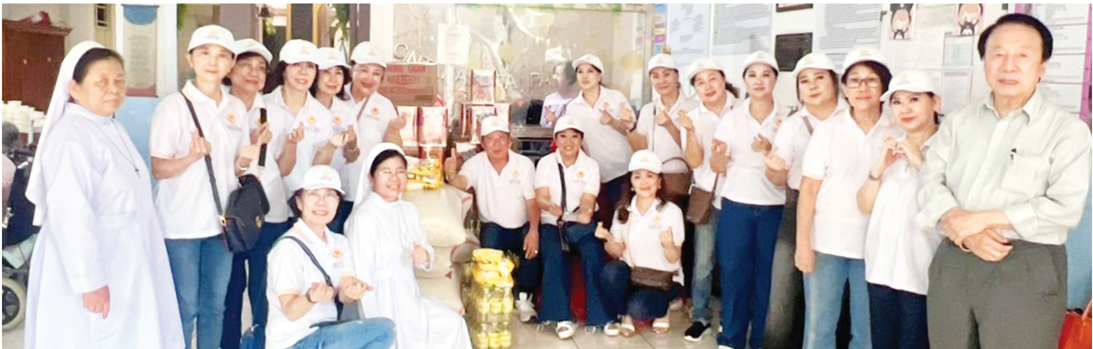
爱心之光慈善基金会与风云代表与St.Stefani和St.Felisia合影。