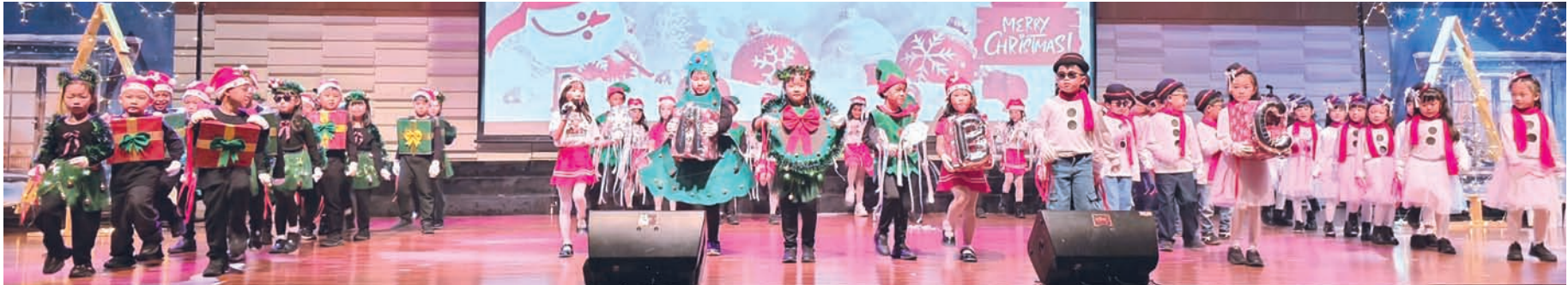
小学一年级学生精彩表演。