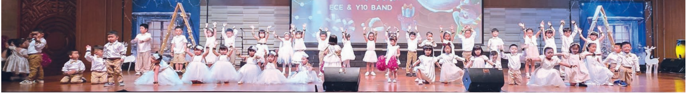
幼儿园学生精彩表演。