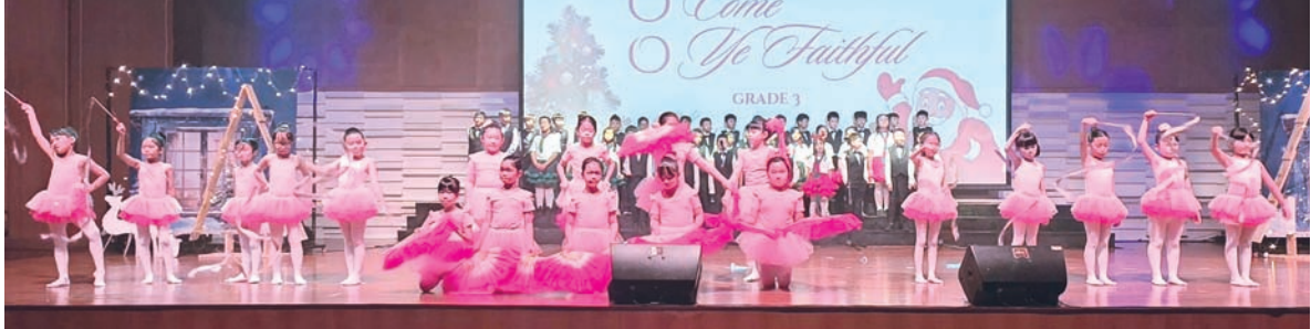
学生们呈献精彩表演。