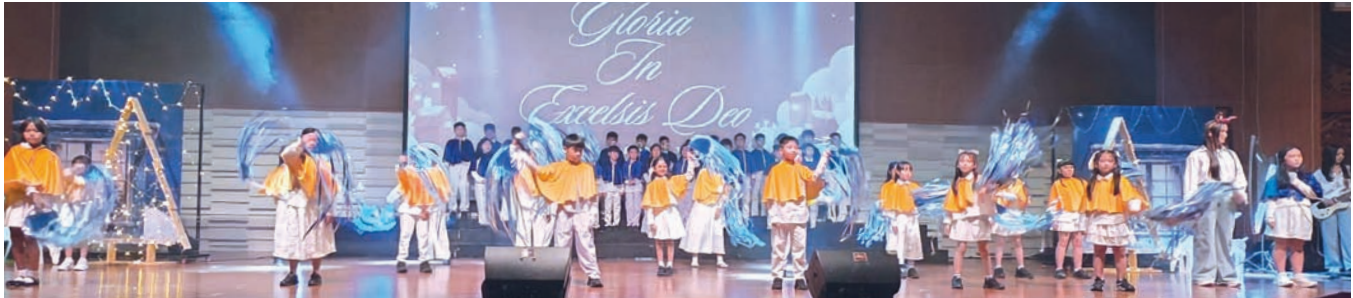
小学生们呈献精彩表演。