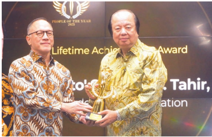
12月4日，在雅加达Metro TV第一演播室，国信集团创始人拿督斯里翁俊民教授、博士（右）接受由Metro TV董事总经理Arief Suditomo颁发的“2025年度人物——终身成就奖”。

【本报雅加达讯】国信集团（Mayapada Group）及翁俊民（Tahir）基金会创始人、拿督斯里翁俊民博士被Metro TV电视台评为2025年度人物，荣获终身成就奖。他被誉为位变革性人物，从洒水的贫困根源起步，建立起不朽的遗产，最终成为亚洲最