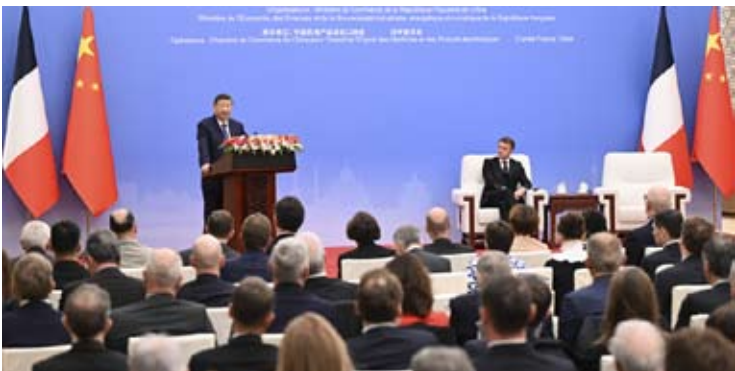
12月4日中午，中国国家主席习近平在北京同法国总统马克龙共同出席中法企业家委员会第七次会议闭幕式并致辞。

【中新社北京12月4日电】12月4日中午，中国国家主席习近平在北京同法国总统马克龙共同出席中法企业家委员会第七次会议闭幕式并致辞。