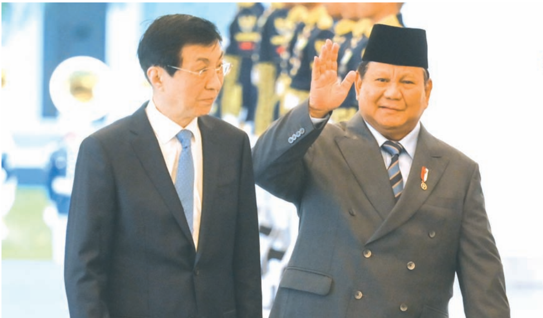
2025年12月4日，印尼总统普拉博沃（右）与中国全国政协主席王沪宁（左）在雅加达独立宫举行会晤，共同出席接待活动。

会上，双方讨论了需要国家间协作应对的国内外战略性议题，包括正侵袭印尼及其他东南亚国家的洪涝与山体滑坡灾害，以