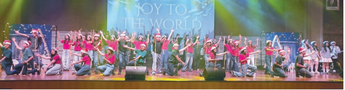
学生们呈献精彩表演。