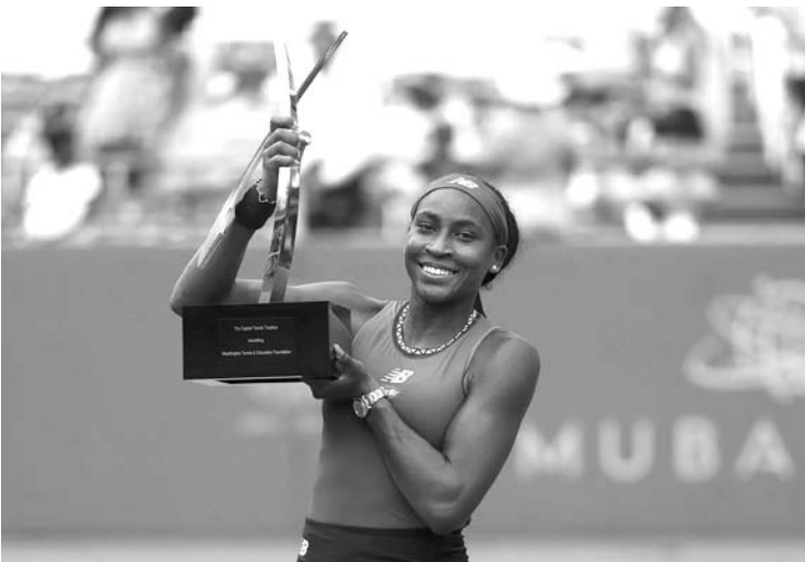
美国网球名将高芙以3100万美元，成为过去1年收入最高的女运动员