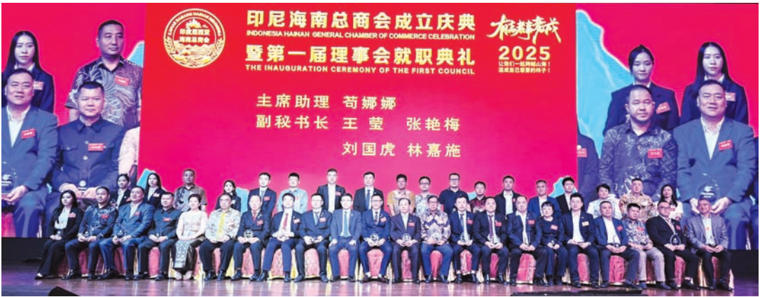
印尼海南总商会第一届理事会合影留念。