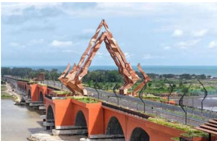
位于爪哇岛南部高速公路上的Kabanaran大桥项目

Kabanaran大桥在设计上采用多拱桥结构，结合波纹钢板(CSP)和泡沫砂浆。据称，该结构强