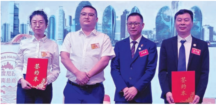
印尼海南总商会与赛轮集团签署合作协议。