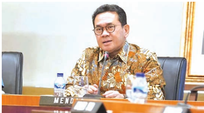
贸易部长布迪·桑托索。

正积极推进各自国内审批程序。该协议有望在即将举行的欧亚经济联盟峰会期间，由各成员国贸易部长在各国元首见证下共同签署。