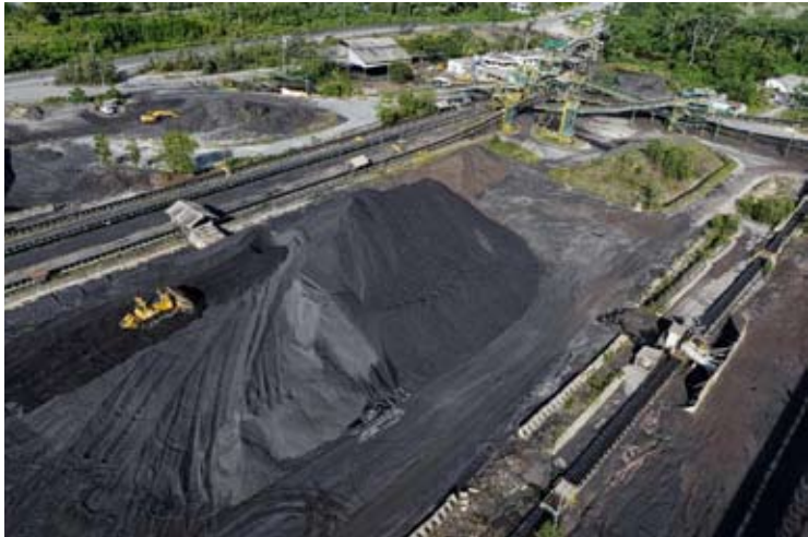
Indo Tambangraya Megah (ITMG) 公司煤矿活动。

【本报讯】今年首九个月，Indo Tambangraya Megah (ITMG) 公司的煤炭销量为1790万吨。