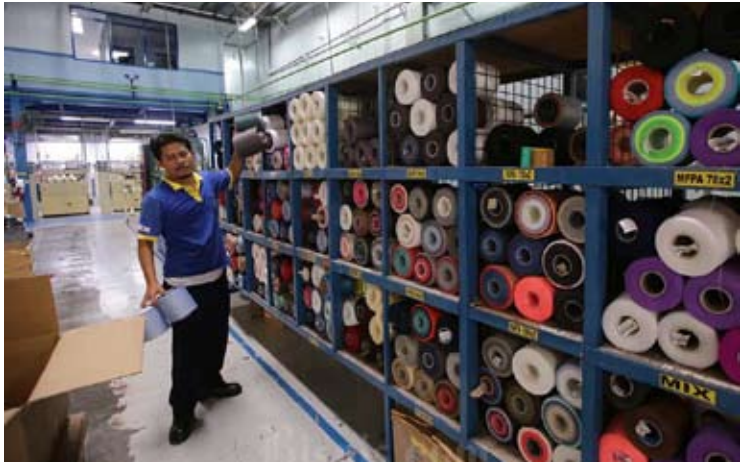
在西爪哇的一家纺织厂，工人们正在搬运成卷的线。

【本报讯】印尼长丝纤维和纱线生产商协会 (APSyFI) 认为，在美国与印尼关税贸易协定谈判据传可能破裂的背景下，加强国内市场成为首要任务。