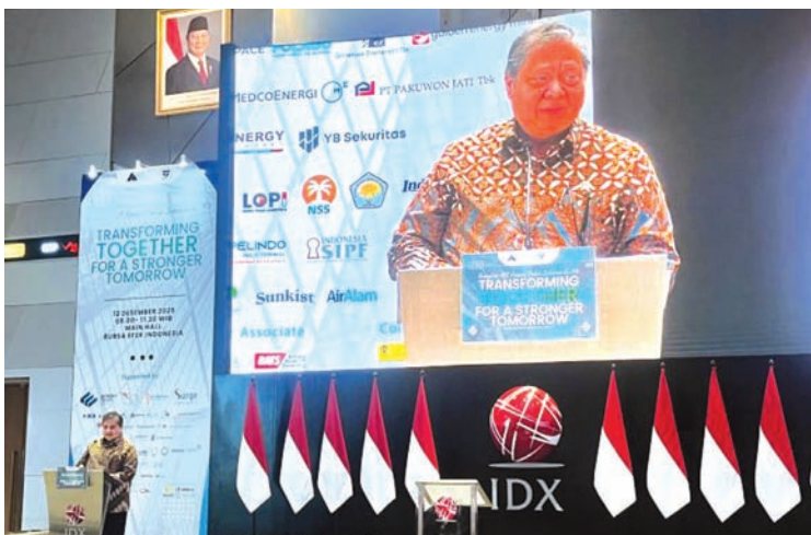
2025年12月12日，印尼经济统筹部长艾尔朗卡在雅加达证券交易所举行的印尼上市公司协会成立37周年庆典活动上致辞。

据其介绍，三省共99.6万微企贷款债务人中，预计约14.1万债务人将受影响，涉及贷款余额约7.8万亿盾。其中包括超过6.3万农业领域微企贷款债务人，贷款余额达3.57万亿盾。