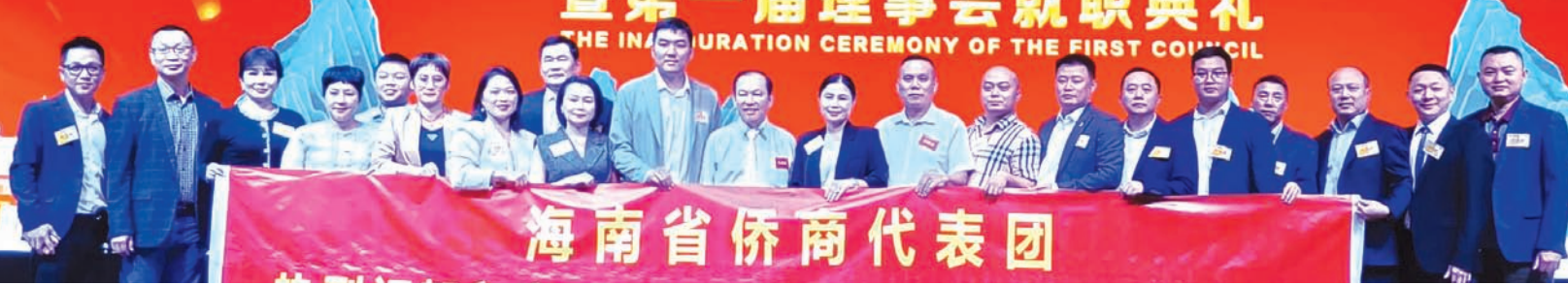
海南省侨商联合会庆贺团合影留念。