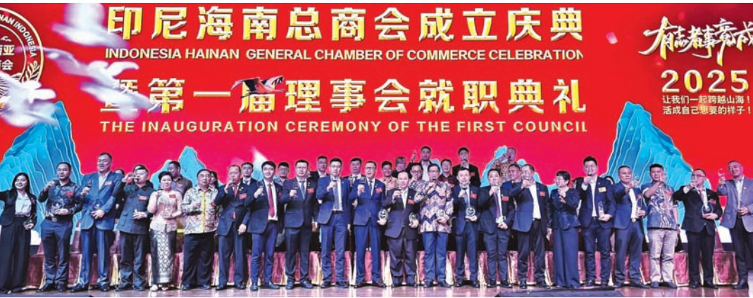
印尼海南总商会第一届全体理事会向大家敬酒。