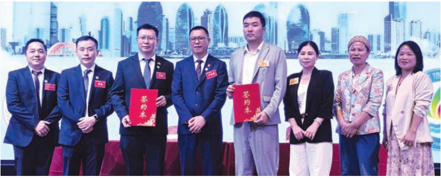
印尼海南总商会与海南省侨商联合会签署合作协议。