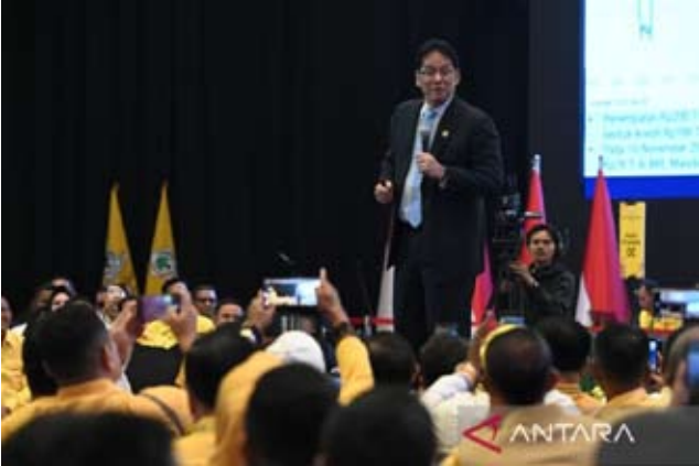
图为：2025年12月11日（周四），财政部长普尔巴亚 尤迪 萨德瓦在雅加达出席一场互动对话活动。

印尼国会地方议会（DPRD）是监督地方预算（APBD）的关键主体，必须确保每一盾币都用得负责任。DPRD被要求成为地方财政守门人”，确保支出不泄漏并推动建设项目有效落地。 除预算管理外，普尔巴亚还强调地方需营造健康的营商环境，以加快经济运转。他指出，改善投资环境是“智慧财政策略”的组成部分。他说：“如果目前经济有些疲软，只要营商环境改善，经济活动就会更快恢复。企业会更积极展开业务。如果环境