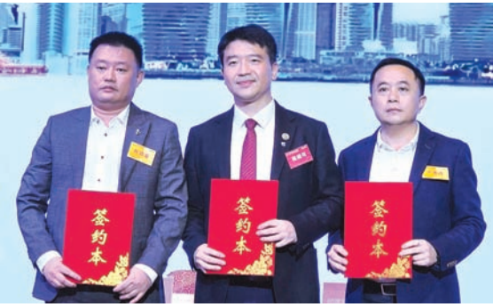
印尼海南总商会与厦门市海南商会、路易科技集团代表签署合作协议后合影。