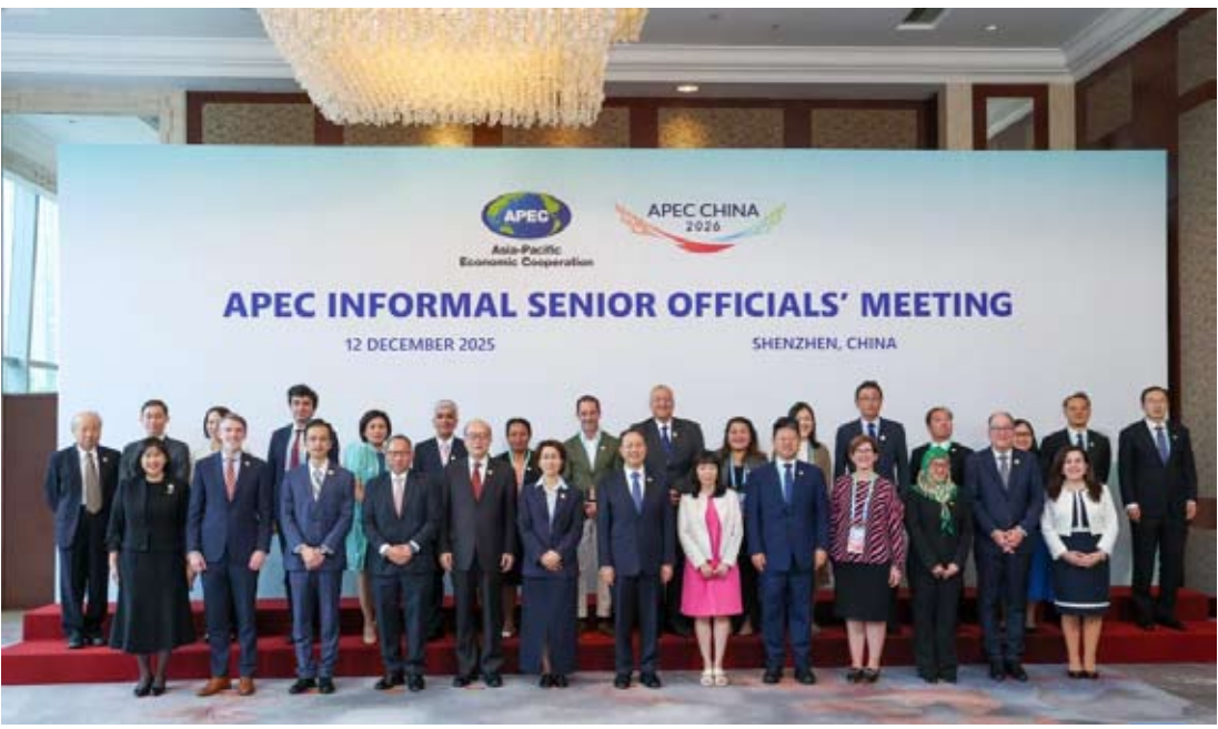
12月12日，与会嘉宾合影。新华社记者 梁旭 摄

与会各方高度赞赏中方推动亚太共同体建设的努力，表示愿积极支持中方主办2026年APEC会