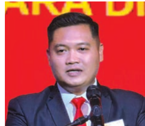
印尼建筑协会会长Gus-tiara Diaz贺辞。