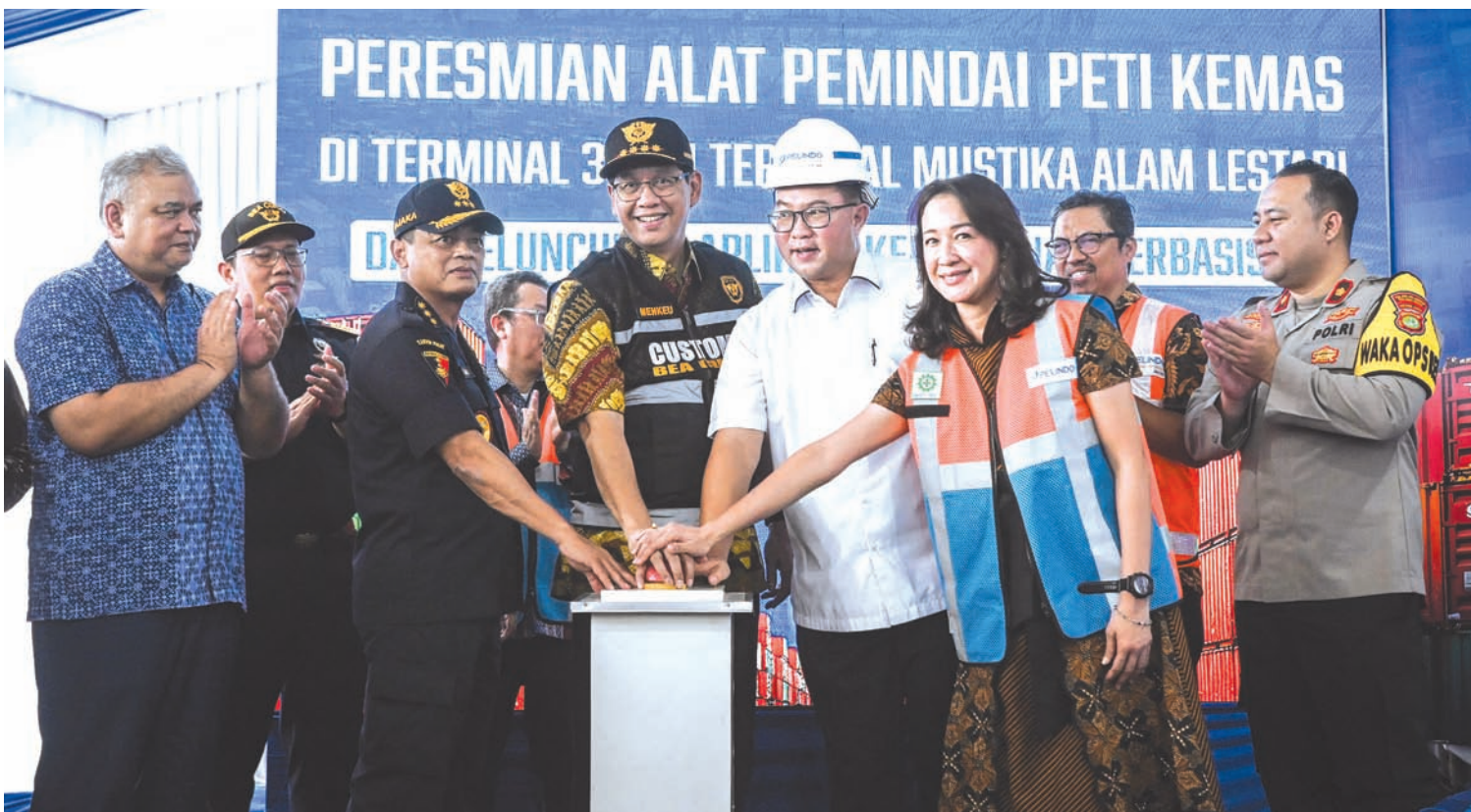
2025年12月12日，印尼财政部长普尔巴亚(左三)与国家研究创新署署长阿里夫(左四)、海关总署署长贾卡(左二)等共同出席了在雅加达丹戎不碌港举行的集装箱扫描仪启用仪式及人工智能海关应用系统发布会。

此外，海关已开始通过CEISA 4.0移动应用程序的自主申报功能(SSR-Mobile)推行自主报告机