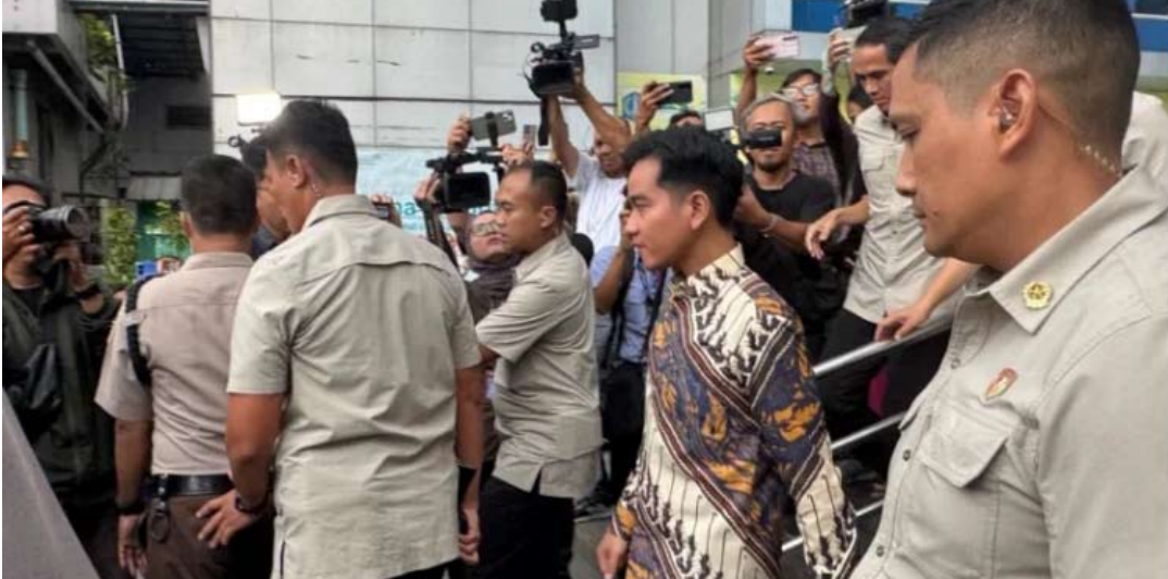
副总统吉布兰探望MBG配送车事故受害者。

副总统吉布兰强调了为所有受害者提供迅速而全面的救治的重要性，并要求必须提供最优质的医疗服务，包括为受影响的学生和教师