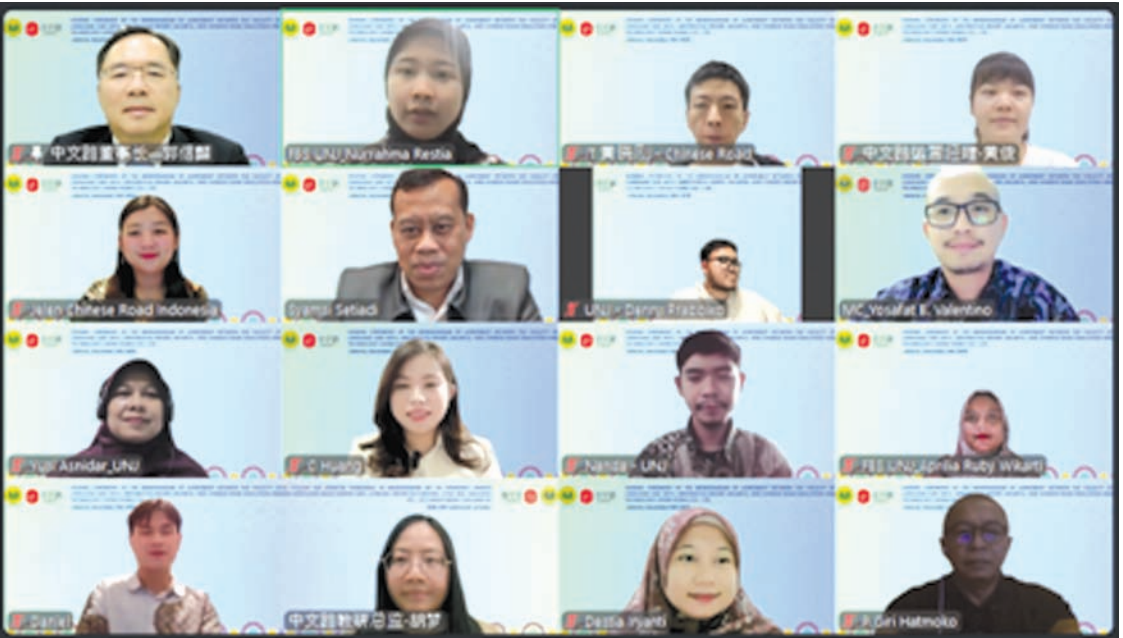
中文路与雅加达国立大学战略合作线上签约仪式

业后的国际竞争力。 布局深化：科技赋能，扎根东南亚教育沃土 中文路自2018年成立以来，始终致力于通过科技推动中文教育的全球化发展。如今，中文路的服务已拓展至中国香港、中国澳门、越南、印尼、泰国、中东等多个国家和地区，累计服务学员超20万人，中文路APP下载超34万次。 此次中文路与雅加达国立大学的合作，是中文路深化东南亚布局、拓展高校合作网络的关键一步。通过与高水平学术机构共建教育体系，中文路进一步巩固了其在科技赋能语言教育领域的领先地位。 此次合作不仅标志着中文路在印尼高等教育体系中的深度融入，也为更多国际高校提供了可借鉴的中文教育合作模式。中文路正以“语言连接机会，教育塑造未来”为理念，推动更多人通过中文走向世界舞台，拥抱全球化机遇。 撰稿人：胡梦