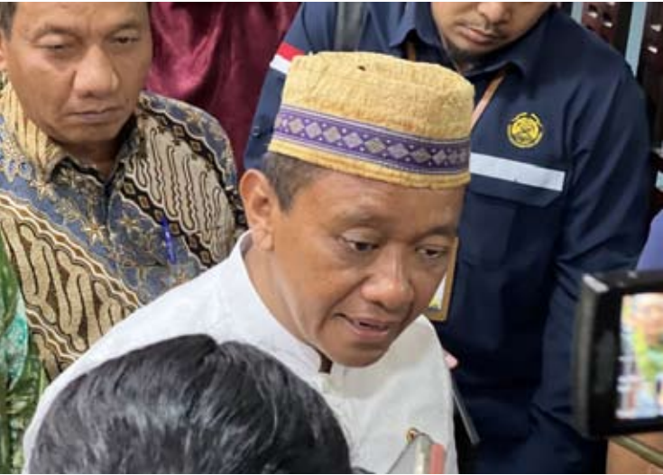
12月19日，能源与矿产资源部长巴赫利尔·拉哈达利亚在雅加达出席新闻发布会后，就能源与矿产领域相关问题向媒体发表讲话。

他表示，下调镍与煤炭产量的主要考量在于通过加强供需调节，缓解当前价格下行压力，维护产业链整体稳定