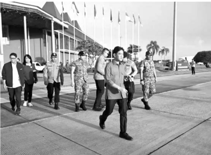
副总统吉布兰及其随行人员于周日（12月21日）上午6时30分搭乘总统专机从雅加达启程飞往北苏门答腊省。

周一（12月22日），副总统将继续在北苏门答腊省北打巴努里（Tapanuli Utara）县展开工作访问。按计划，副总统将视察阿迪安·科廷（Adian Koting）镇西巴兰加（Sibalanga）村的山体滑坡影响，确保灾民获得最佳的救助服务，以及协调有序的灾后应急措施。