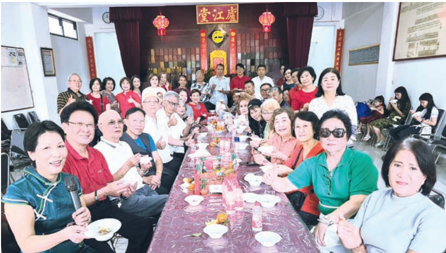
雅加达何氏宗亲会諸理事与宗亲们在品尝汤圆时合影。