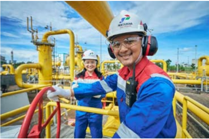
印尼国家天然气 (PGN) 公司员工在Tanjung Enim工作区。