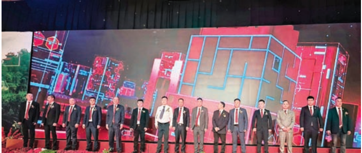
开幕启动仪式一景。