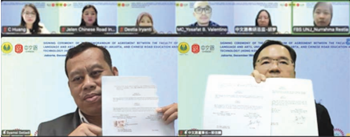
中文路董事长与印尼雅加达国立大学语言与艺术学院院长在线签字