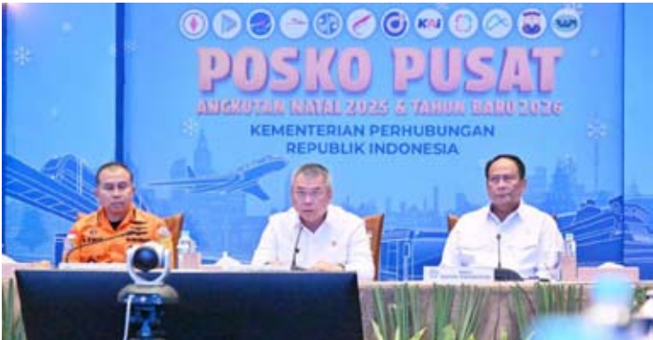
2025年12月18日，印尼交通部长杜迪（中）与农业部副部长孙塔纳（右）在雅加达为2025年圣诞节及2026年新年运输中心指挥部主持揭牌仪式。

【本报讯】印尼交通部长杜迪·普尔瓦甘迪确保2025年圣诞节和2026年新年期间货运车辆运营限制措施顺利实施。周六（12月20日）晚间，部长在西爪哇省勿加西市的Jasa Marga收费公路指挥中心进行了实地监测。