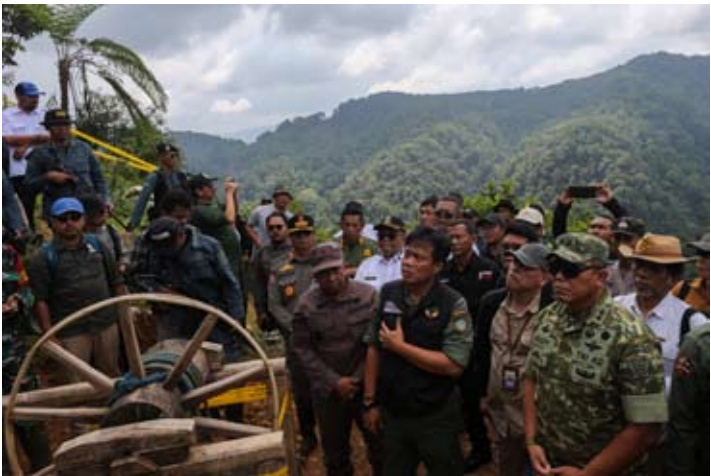
12月3日，林业部森林执法总局局长德维·贾努安托·努格罗霍（右四）与森林区域整治“加鲁达”行动指挥官、国军少将多迪·特里维纳托（右二）等官员，在万丹省勒巴克县哈利蒙—萨拉克山国家公园区域实地查看非法采矿点。

公平公正，不得选择性执法。无论是否涉及国家官员或其他特定利益关联方，均须一视同仁、严肃处理。