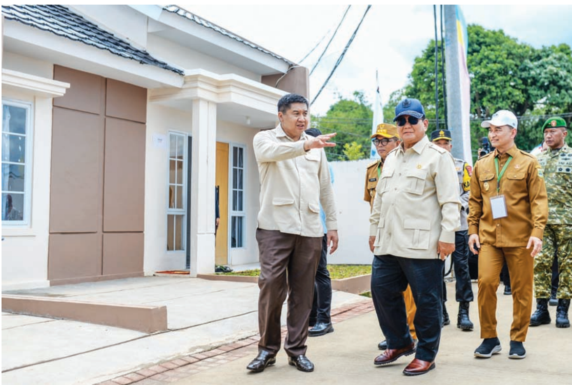
2025年12月20日，普拉博沃总统（前右）在住房部长西莱特（前左）及万丹省副省长迪米尼亚蒂·纳塔库苏马（右二）陪同下，在万丹省西冷市Pondok Banten Indah住宅区，视察“点亮补贴住房”大规模签约仪式中的安居房。

周六（12月20日），该机构专员赫鲁·普约·努格罗霍解释称，虽然今年参与补贴住房项目的开发商数量较去年略有下降，但这种情况并不会直接对建筑质量产生负面影响。