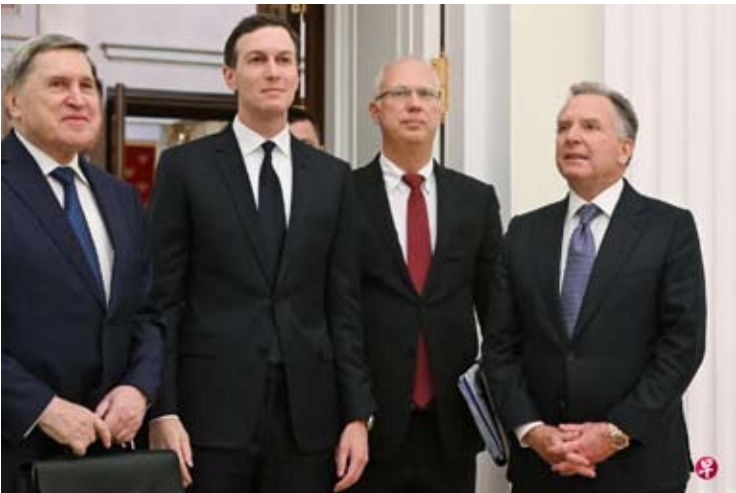
美俄官员目前正在迈阿密就和平方案进行磋商。图为12月2日，俄总统外交政策顾问乌沙科夫（左一）、俄总统特使德米特里耶夫（左三），与美国总统特使威特科夫（右一）及特朗普女婿库什纳会晤。

与此同时，俄罗斯方面面对三方会谈的说法作出澄清。综合法新社和路透社报道，俄罗斯总统外交政策顾问乌沙科夫21日表示，目前并无无人认真讨论举行俄美乌三方会谈的提