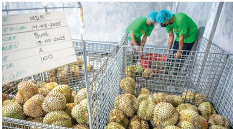
2025年2月17日，在中苏拉威西省帕卢的努山达拉王果公司（Nusantara King Fruit），工作人员正在清理新鲜榴莲果实。

【本报讯】临近年底，东南亚贸易竞争版图持续升温。作为印尼的近邻与强劲竞争对手，越南预计将创造新的历史。