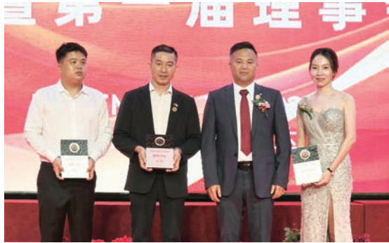
罗丙会秘书长给予副秘书长授牌后合影。