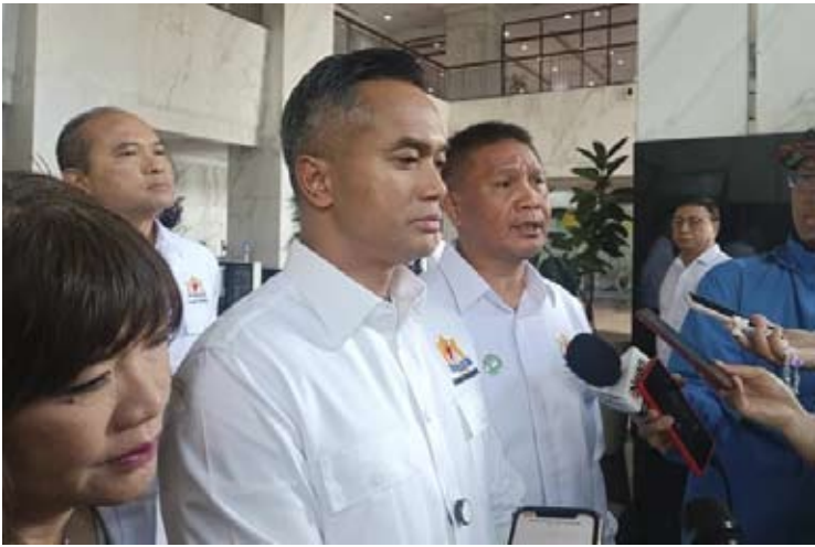
12月19日，印尼工商会（Kadin）主席阿宁迪亚·巴克里（中）在雅加达财政部就相关议题回答记者提问。

【本报讯】印尼工商会（Kadin）表示，呼吁政府通过完善激励政策、推进去管制改革及提供更具竞争力的融资支持，推动国家家具和电子产业扩大出口规模、提升国际竞争力。