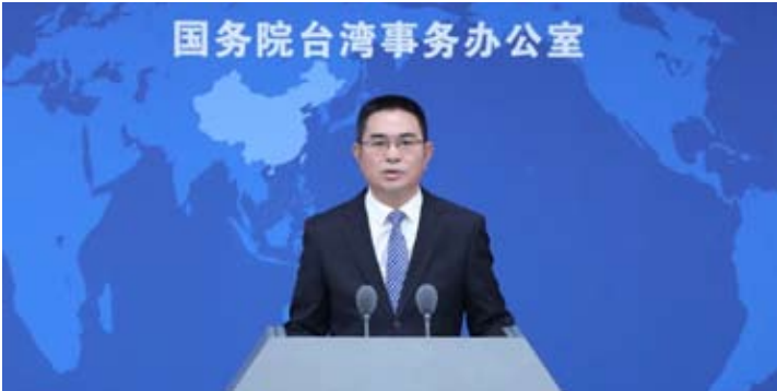
国务院台办发言人陈斌华

陈斌华还指出，大陆海警部门在相关海域开展常态化执法巡查行动，有利于维护海上作业秩序，保障两岸渔民生命财产安全。