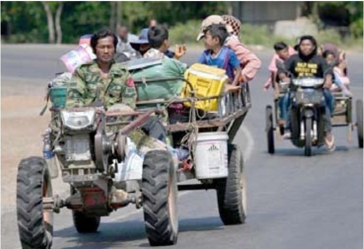
资料图：当地时间12月9日，柬埔寨和泰国边境发生冲突后，居民们撤离家园，驾车沿街行驶。