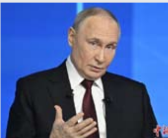
资料图：12月19日，俄罗斯总统普京举行“年度盘点”活动，回答提问。

【中新社莫斯科12月19日电】俄罗斯总统普京19日在莫斯科举行年度大型记者会和“直播连线”活动。在持续约4个半小时里，普京共回答了80多个问题，涉及乌克兰问题、与西方关系，以及俄经济、人口、科教、社会和民生等热点问题。