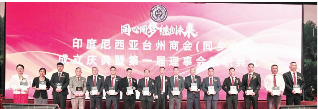
李官富会长向执行会长、监事长、理事长、秘书长、常务副会长、常务单位、会长助理授牌后合影。