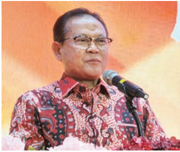
印尼国会议员Prof. Dr. Ir. Rokhmin Dahuri, MS致辞。