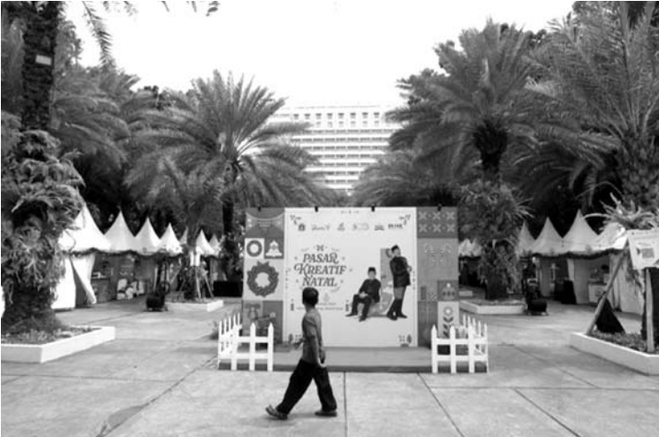
雅京省政府通过旅游与创意经济局在雄牛坪（Lapangan Banteng）公园举办2025年圣诞节创意集市（Pasar Kreatif Natal）。

（Manado）市Bersehati市场，以确保年底假期前的食品价格与供应稳定。最后，副总统将在万鸦佬的萨姆·拉图朗义（Sam Ratulangi）教堂与儿童共同参加圣诞节庆典，以此彰显政府对社会与宗教服务的重视。完成系列工作访问后，副总统将于当天返回雅加达。（pl）