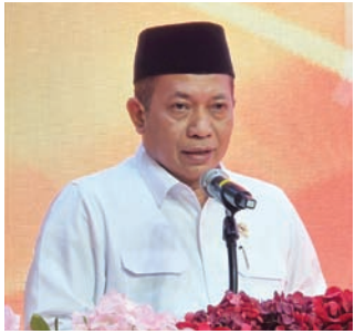
印尼合作社部长费里·朱利安托诺致辞。