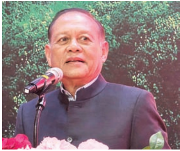
印尼国防部国防外交司特别顾问苏德嘉致辞。