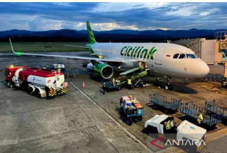
资料照片——连城航空航空公司客机停靠在东南苏拉威西省肯德里哈鲁奥莱奥机场。（2025年11月21日摄）

假期期间机票价格保持在合理区间，政府已推出一系列价格稳定与市场刺激措施。其中包括由政府承担6%的增值稅（PPN DTP），下调喷气式飞机和螺旋桨飞机的燃油附加费，并对机场相关服务收费实施优惠政策。