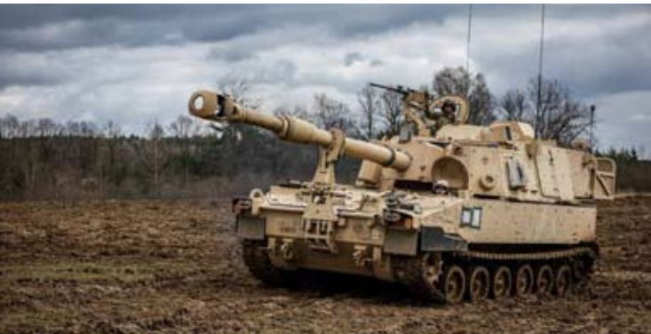
美国政府近期同意向中国台湾出售价值约3500亿元武器，其中包喊M109A7自走炮（见图）等装备。

我要再次强调，台湾问题是中国核心利益中的核心，是中美关系第一条不可逾越的红线。任何在台湾问题上越线挑衅的行径都将遭到中方的有力回击，任何参