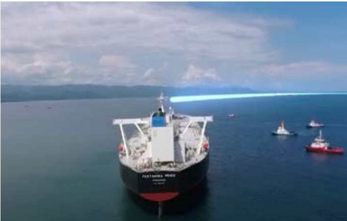
印尼国家石油航运(Pertamina International Shipping/PIS)公司船只正在航行。

也强调，与Sonatrach的坚实协同作用，为优化405A区块潜力创造了法律和运营上的确定性，同时也为印尼和阿尔及利亚带来利益。