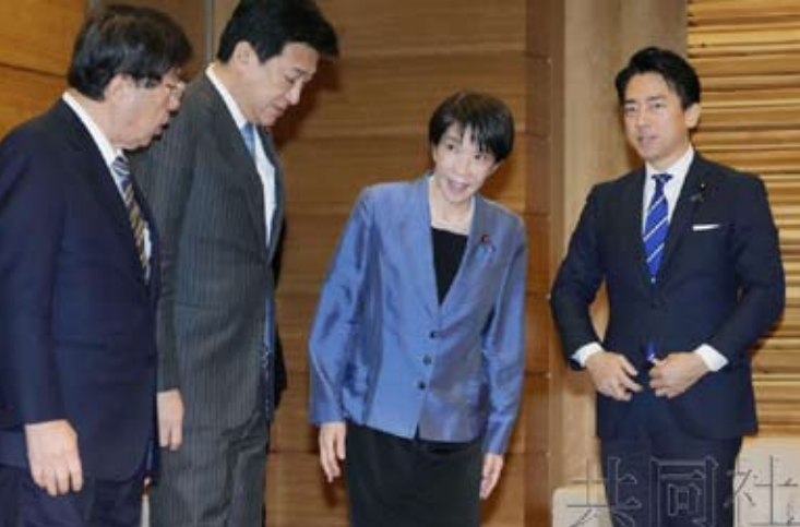
日本首相高市早苗（右二）出席内阁会议。12月23日上午摄于官邸。

近年，日本大幅扩建网军，新出台的网络法案和战略名为“主动防御”，实则为主攻进攻松绑。日本在历史上曾多次以遭