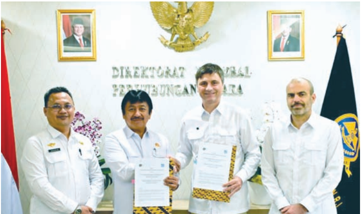
印尼交通部航空总局局长卢克曼（左二）签署了与法国航空总局之间的《民用航空技术合作附件五》。

【本报讯】印尼交通部航空总局与法国航空总局（DGAC）通过签署第五附件，进一步加强民用航空技术合作。印尼交通部航空总局局长卢克曼表示，第五附件的签署是更新和加强印尼与法国技术合作框架的战略步骤，顺应了持续发展的民用航空领域需求动态。