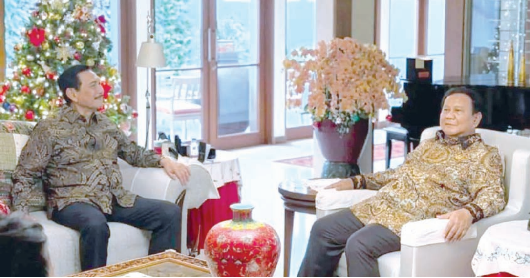
2025年12月25日，印尼总统普拉博沃（右）前往位于雅加达的国家经济委员会主席卢胡特（左）的私人住所进行友好交流。