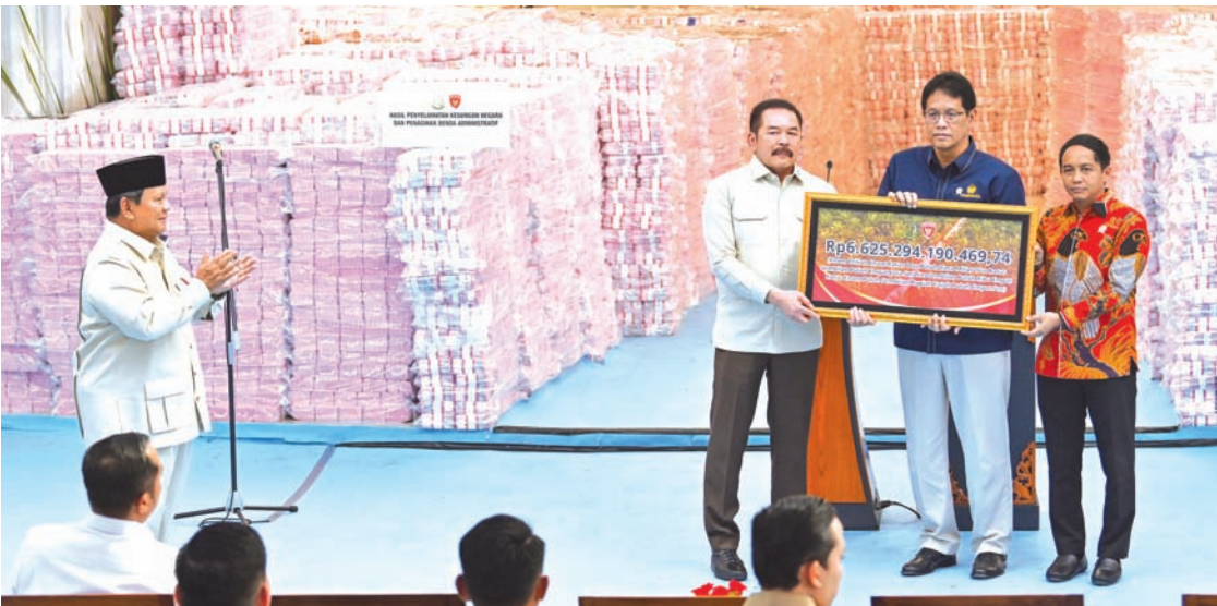
2025年12月24日，在雅加达最高检察院办公区，普拉博沃总统（左）见证总检察长布汉努丁（左二）向财政部长普尔巴亚·萨德瓦（右二）和林业部长拉贾·朱利·安东尼（右）象征性移交林业行政处罚款及涉腐案件追回的6.62万亿盾国家资金。

情况。这些资金来自森林区域整治专项工作组征收的行政处罚款，以及从腐败案件中追回的国家财政资金。