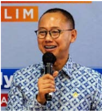
人协副议长埃迪·苏帕诺（Eddy Soeparno）。

【本报讯】人民协商会议简称人协（MPR）副议长埃迪·苏帕诺（Eddy Soeparno）推动尽快批准《气候变化管理法案》，作为2025年气候变化影响日益扩大的反映。在进入2026新年之际，埃迪敦促加速讨论该法案，以预防和缓解社会各界日益感受到的气候变化影响。 埃迪周五（12月26日）在雅加达的书面声明中说，“2025年我们已经感受到气候异常，在旱季竟