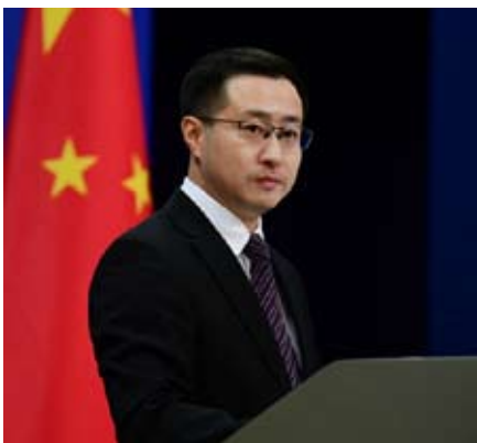
外交部发言人林剑。

近年来，日方自我松绑集体自卫权，发展所谓“对敌基地攻击能力”，强化“延伸威慑”合作，将沿海岛屿打造为“前沿阵地”，明显超出“专守防卫”的范畴。所谓“防御”“反击”成为日本右翼势力煽动民意、欺骗舆论、突破