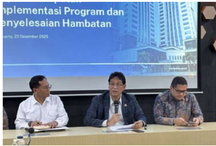
12月23日，在雅加达财政部举行的新闻发布会上，财政部长普尔巴亚·尤迪·萨德瓦介绍政府通过提振国内需求以防范裁员风险的相关政策安排。

她指出，部分被裁劳动者在申请失业保障金（JKP）过程中仍面临制度执行和信息获取方面的障碍。因此，与推出新的刺激措施相比，进一步完善失业保障金实施机制、强化融资支持渠道，被认为是当前更为紧迫的政策重点。（er）