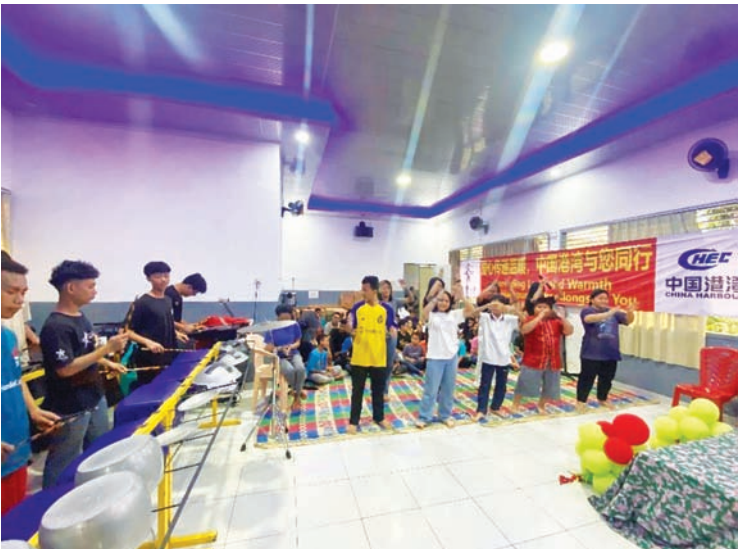
Yayasan Griya Asih 福利院的孩子们以打击乐演奏与舞蹈表演，展现自信与活力，为活动现场增添温馨氛围。