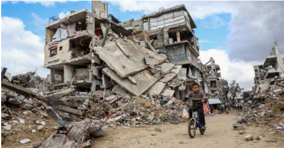
2025年12月28日，一名流离失所的巴勒斯坦男孩在加沙地带北部贾巴利亚难民营骑自行车。加沙地带民防部门周日宣布，一场强风暴袭击加沙地带，造成一名儿童和一名妇女死亡。

【中新网12月29日电】当地时间29日，加沙地带卫生部门发布通告称，一名2个月大的婴儿因严寒天气于当天死亡，使得加沙地带进入冬季以来因暴风雨和严寒天气死亡的人数增至3人。此外，当天还有一名加沙地带民众因建筑物倒塌而死亡。至此，自进入冬季以来，加沙地带已经有17人因暴风雨引发的建筑倒塌而死亡。