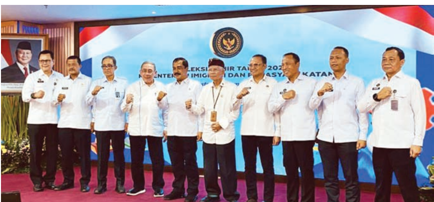
2025年12月29日，在雅加达移民与监狱事务部举行的2025年终总结活动结束后，阿古斯部长（左五）与部门领导层合影。

【本报讯】印尼移民与监狱事务部确定了15项将作为2026年重点的行动计划，这些计划是2025年已实施的13项加速计划的延续。 移民与监狱事务部长阿古斯·安德里安托解释称，这15项行动计划融合了2025年的各项计划，并参考了正副总统的愿景和执政纲领。 周一（12月29日），阿古斯在雅加达举行的2025年终总结活动上表示：“已签署2026年绩效协议的人员，应将其工作重心转向移民与监狱事务部制定的15项行动计划。” 他指出，这些行动计划涵盖移民总局、监狱安置总局、移民与监狱事务部秘书处以及