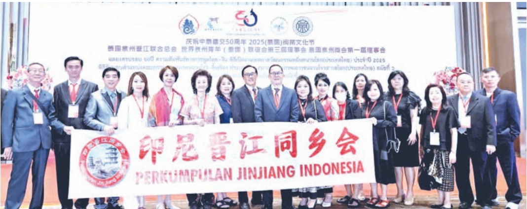
印尼晋江同乡会代表团一行在庆典大会上合影。