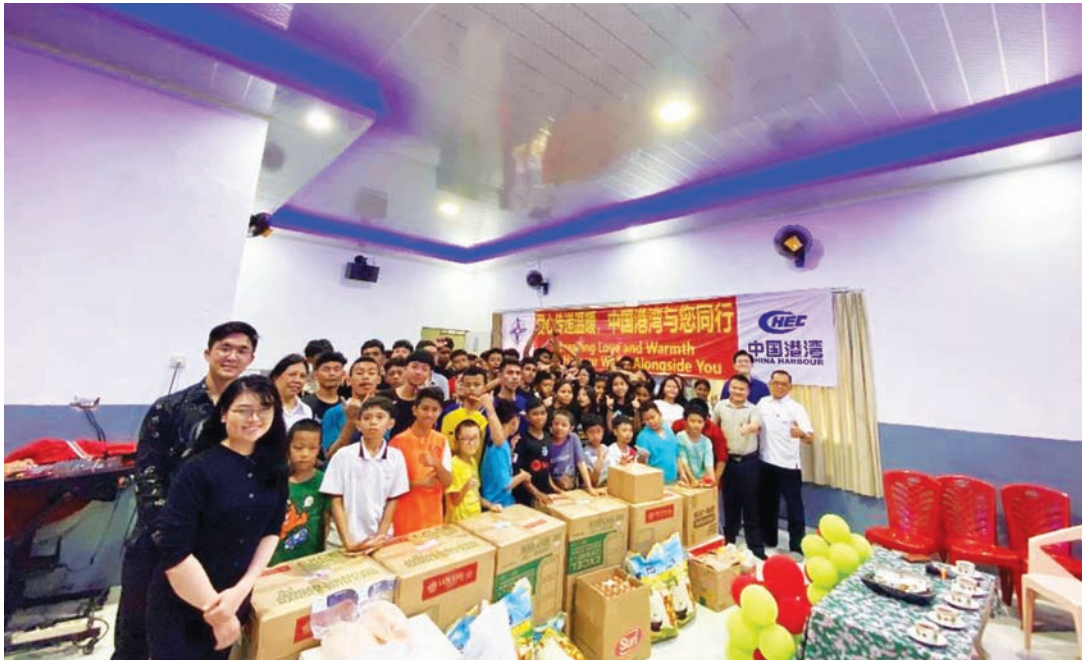
中国港湾(印尼)有限公司到 Yayasan Griya Asih 福利院移交爱心物资,传递社会关怀与温暖。