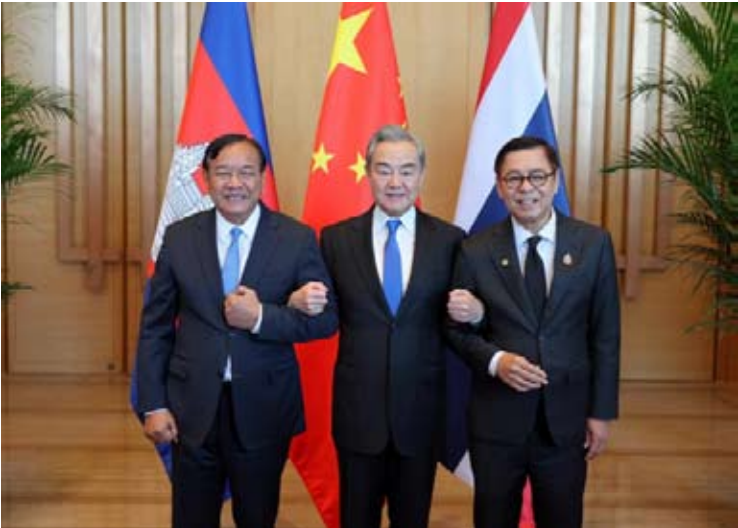
2025年12月29日，中柬泰外长会晤在云南玉溪成功举行。

循序渐进不停留。停火安排的落实执行需要保持沟通协商，恢复两国关系也要逐步推进，但只要双方保持信心，平等对话，就一定能够达到目标；三是重建互信最重要。冲突造成信任缺失，但柬泰是永远的邻国，拥有悠久友好交往史。这次聚首抚仙湖，希望能抚平冲突带来的