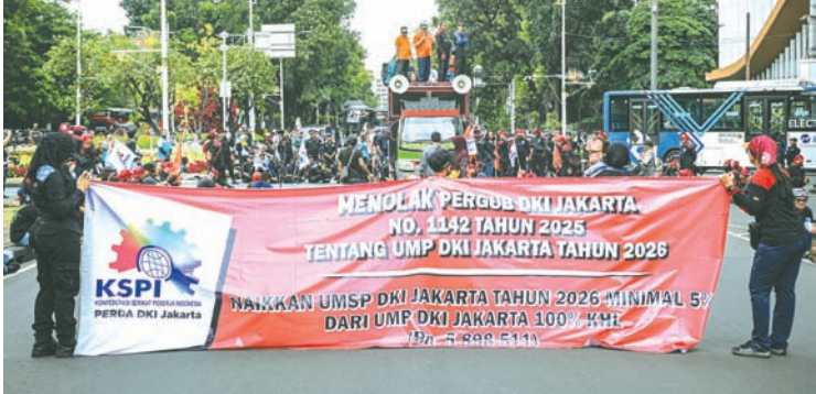
2025年12月29日，雅加达南独立大道上，工人们举行示威活动抗议雅加达特区省级最低工资标准。多个劳工组织发起此次行动，反对2026年雅加达最低工资仅上调至570万盾，因其仍低于中央统计局设定的580万盾的雅加达体面生活水平标准。

与此同时，印尼工会联合会主席赛义德·伊克巴尔在新闻发布会上表示，拒绝2026年雅加达省级最低工资标准，并敦促雅加达省长立即批准2026年雅加达省级行业最低工资标准。他说道：“我们拒绝不符合体面生活需求标准的2026年省级最低工资标准。”