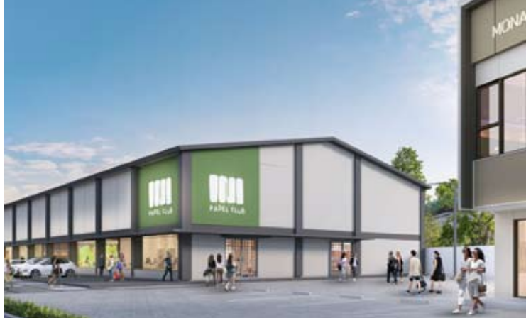
丹格朗Paramount Petals的Indica Grande商业区板式网球俱乐部设施草图。

要的主力租户，即INI Padel Club。这是一个占地3,550平方米的壁球和羽毛球运动场馆，并配备咖啡馆作为舒适的聚会点。该运动场馆将