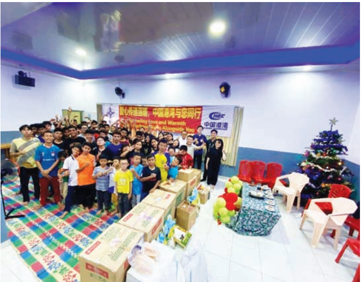
中国港湾（印尼）有限公司与Yayasan Griya Asih 福利院长及孩子们一起合影