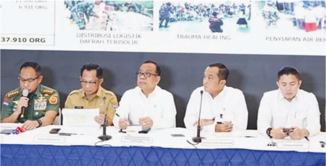
2025年12月29日，在雅加达哈林空军基地的综合指挥所，人类发展与文化统筹部长普拉蒂克诺（中）、内政部长狄托（左二）、国务秘书普拉塞蒂奥（右二）、印尼国军总司令阿古斯（左）、内阁秘书泰迪（右）共同就“年末灾后恢复与战略规划”召开新闻发布会。

在哈林空军基地的苏门答腊灾害处理综合指挥所，国务秘书普拉塞蒂奥主持新闻发布会，介绍政