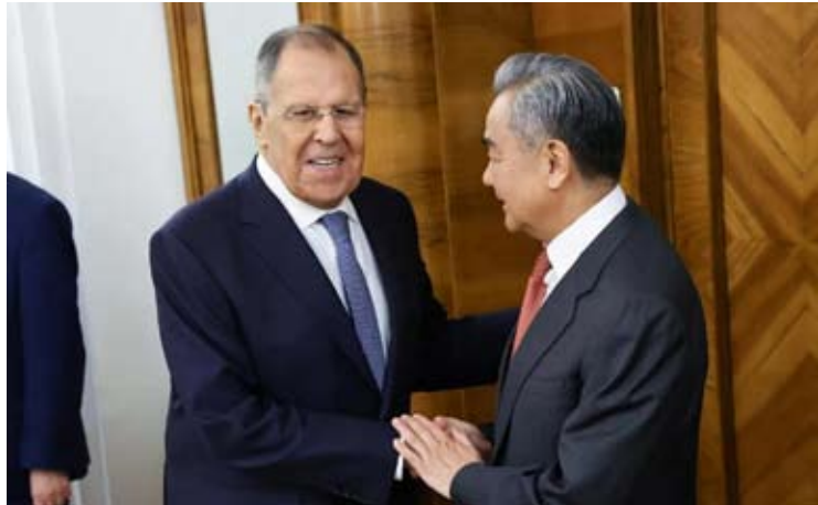
俄罗斯外长拉夫罗夫（左）在塔斯社12月28日发布的专访中强调，台湾问题是中国内政。图为拉夫罗夫12月2日在莫斯科与中国外长王毅会面。