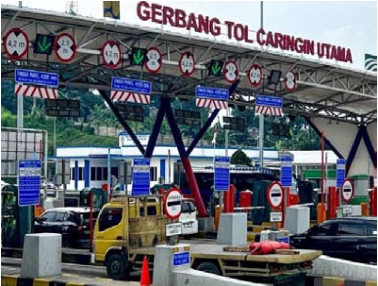
图为，位于西爪哇省茂物县查林金乌塔玛高速公路收费站的情景。