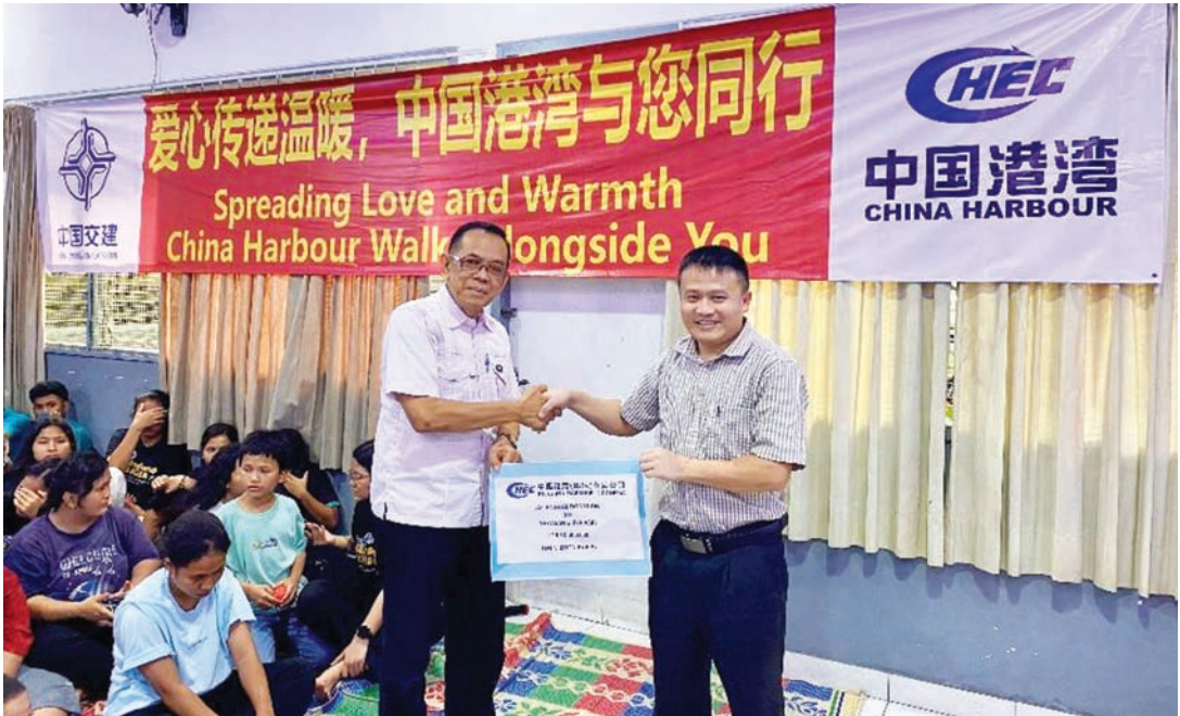
中国港湾（印尼）有限公司向 Yayasan Griya Asih 福利院捐赠善款，开展第十四届捐赠活动。