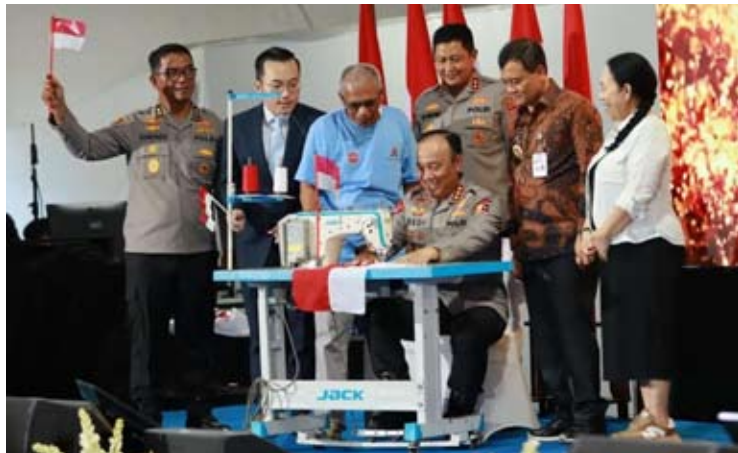
Wong Hang Bersaudara (WHB) 公司服装厂恢复运营。

【本报讯】位于八马冷(Pemalang)县的服装生产厂，因破产而暂时停产之后，现已重新投入运营。