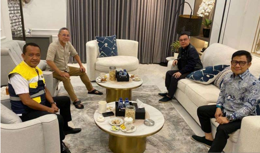
左起，从业党总主席巴赫利尔、国民使命党总主席祖尔基弗里、大印尼行动党常务主席苏夫米·达斯科、民族复兴党总主席穆海敏在雅加达巴赫利尔的住所进行联谊交流。