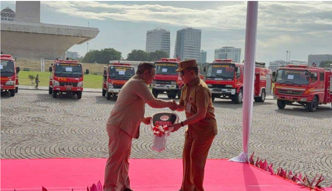
图示，雅加达特区省长普拉莫诺·阿农（左）于周一（12月29日）在雅加达中心区民族纪念碑移交消防车捐赠的情景。