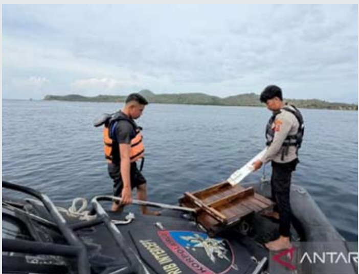
图示，周二（12月30日），联合搜救小组在西芒加莱县拉布安巴焦帕达尔岛水域发现了“KM Putri Sakinah”的游船的船体碎片。

据安塔拉社在帕达尔岛海域的监测显示，联合搜救队于周二早上8时45分左右（印尼中部时间）发现了漂浮的残骸。