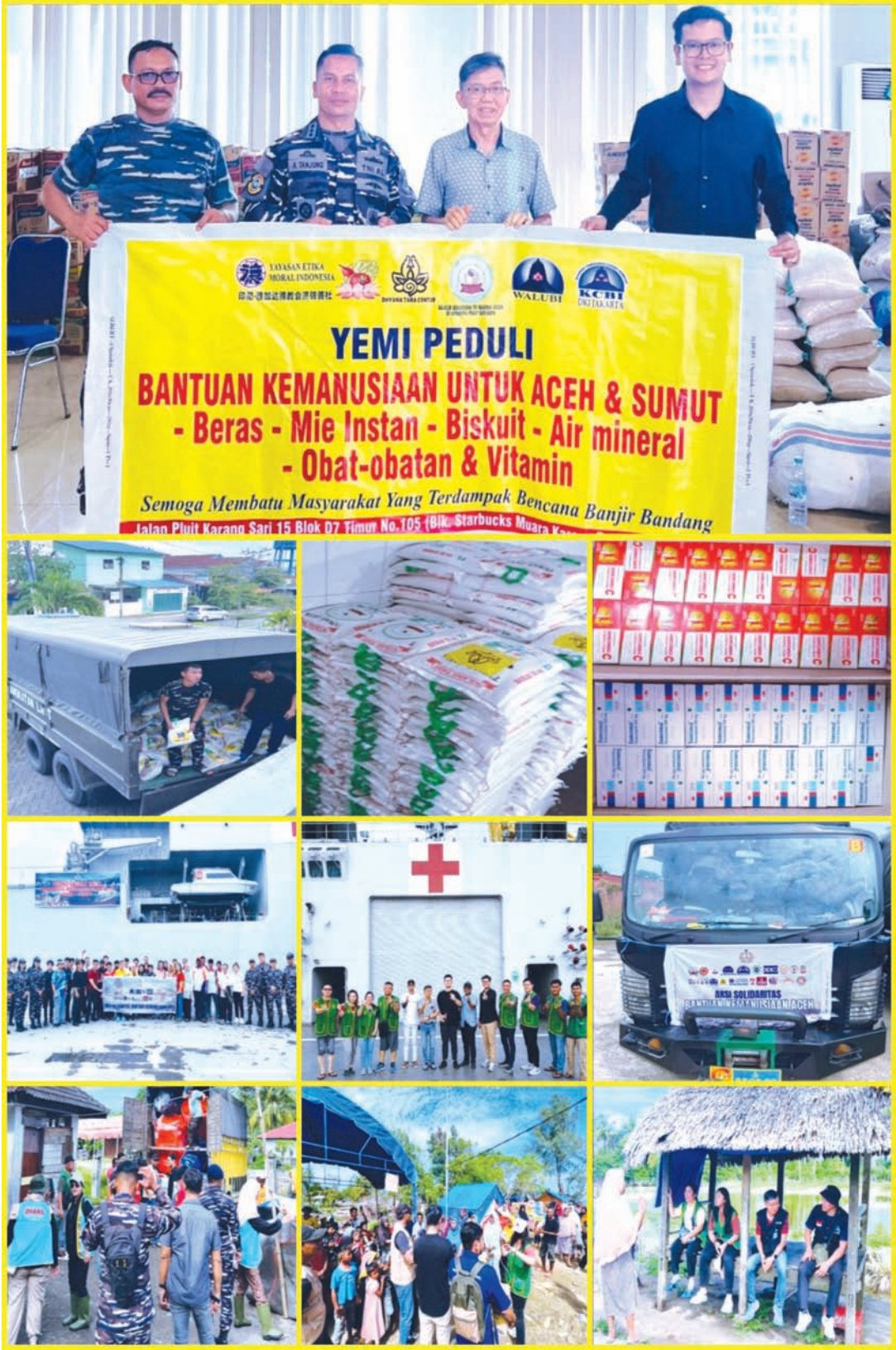
YEMI向苏北开展救济援助系列援助情况。