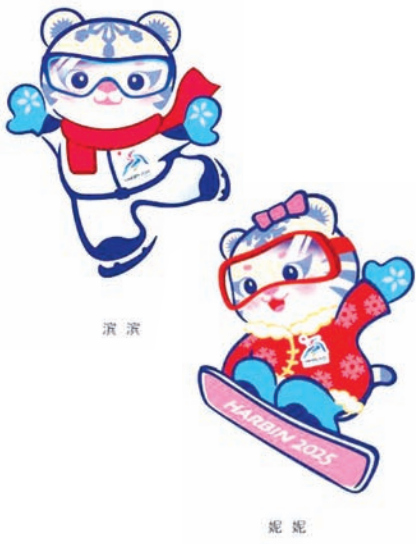
第九届亚洲冬运会吉祥物是“滨滨”和“妮妮”。

这届亚冬会是印尼第二次参赛。上次印尼只有一名运动员参加，而这次印尼派出了6名运动员参赛。无论在人数上，参赛项目上都增加了许多。