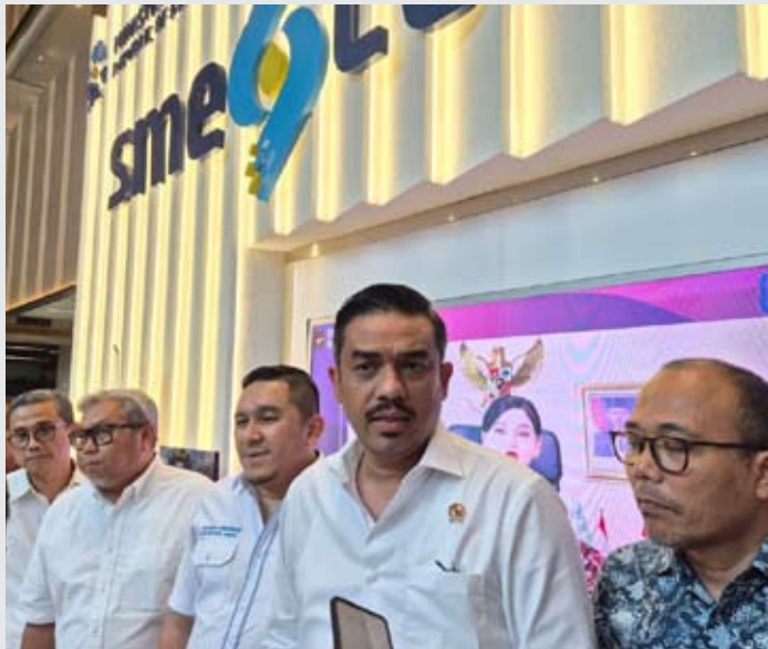
12月29日，中小微企业部长马曼·阿卜杜勒拉赫曼在雅加达办公室举行新闻发布会。

【本 报 讯】政府正计划对部分长期以明显低价在国内市场销售的进口商品设定销售指导价，以防止低价倾销行为扰乱市场秩序，并保护本国产业的可持续发展。