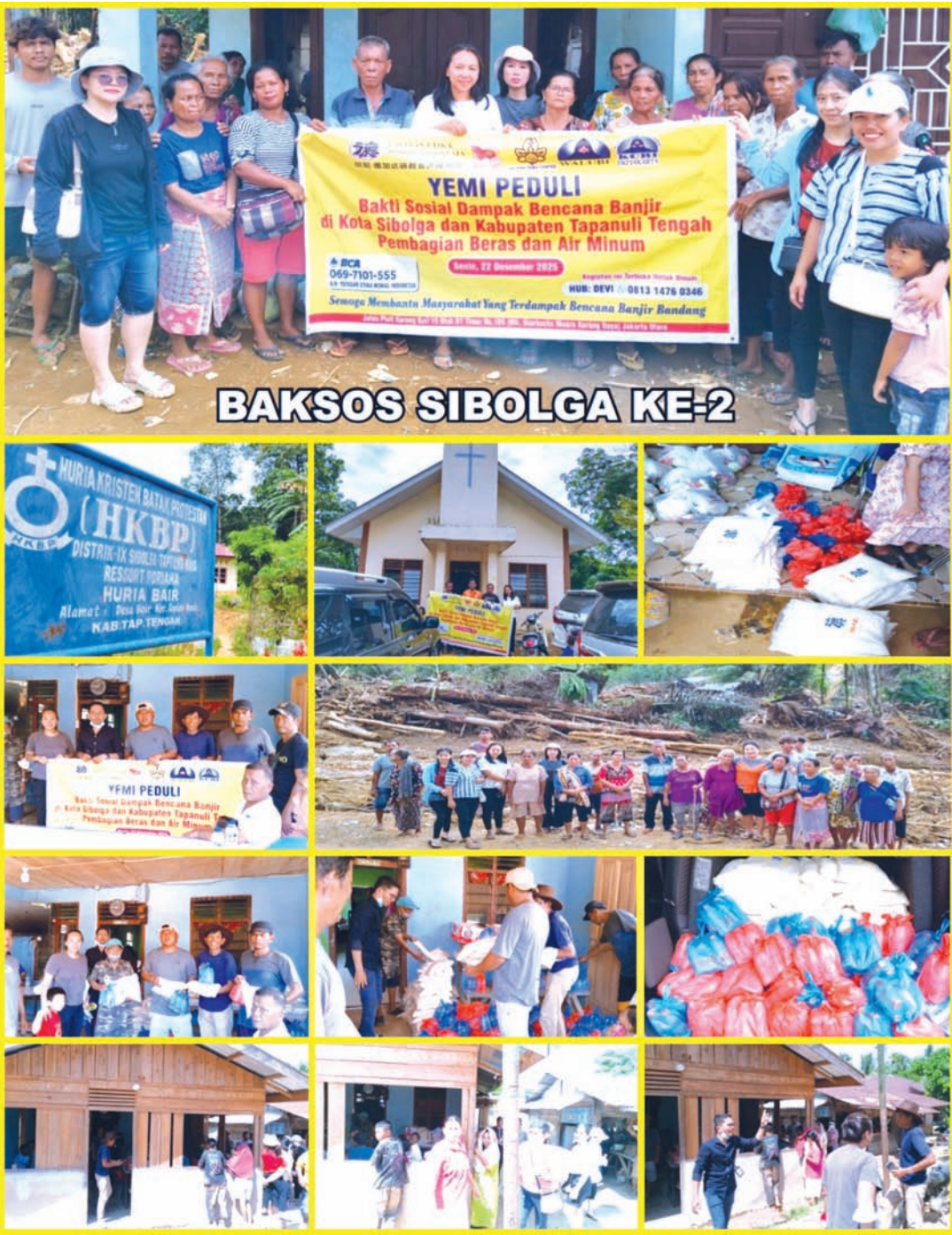
YEMI向实务牙地区开展第二次救济援助。