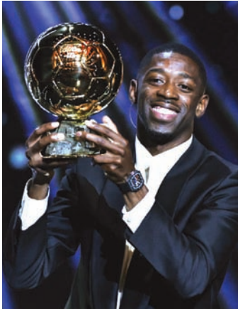
巴黎圣日耳曼队的奥斯曼·登贝莱赢得男子金球奖。

凭借赛季表现，登贝莱获得本年度男足金球奖，成为继科帕、普拉蒂尼、帕潘、齐达内、本泽马之后，第六位获此奖项的法国球员。他也达成世界杯冠军、欧冠冠军与金球奖的“金满贯”成就，成为史上第10位“金满贯”球员。