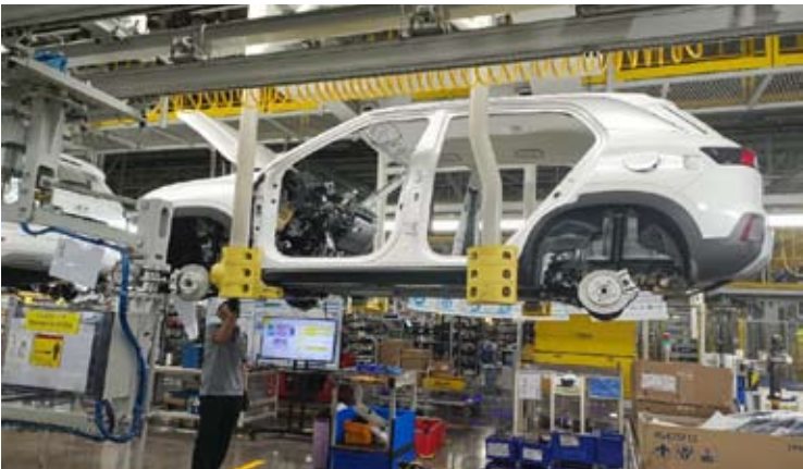
一名员工正在印尼现代汽车制造公司 (HMMI) 的工厂内组装现代汽车。

变得更加谨慎。 “我们认为，食品、健康、可再生能源、自然资源下游化以及数字经济产业拥有最大的增长机会。” 相对稳定的基本需求以及能源和粮食安全政策是主要推动力。然而，Saleh 强调，并非所有行业都能轻易摆脱压力。 “像纺织、服装和鞋类这样的劳动密集型行业，由于进口竞争、全球需求疲软以及地缘政治和气候风险，仍将面临严峻挑战。” 若没有结构性竞争力的增强和有针对性的市场保护，预计这些行业在 2026 年仍将处于压力之下。 (lcm)