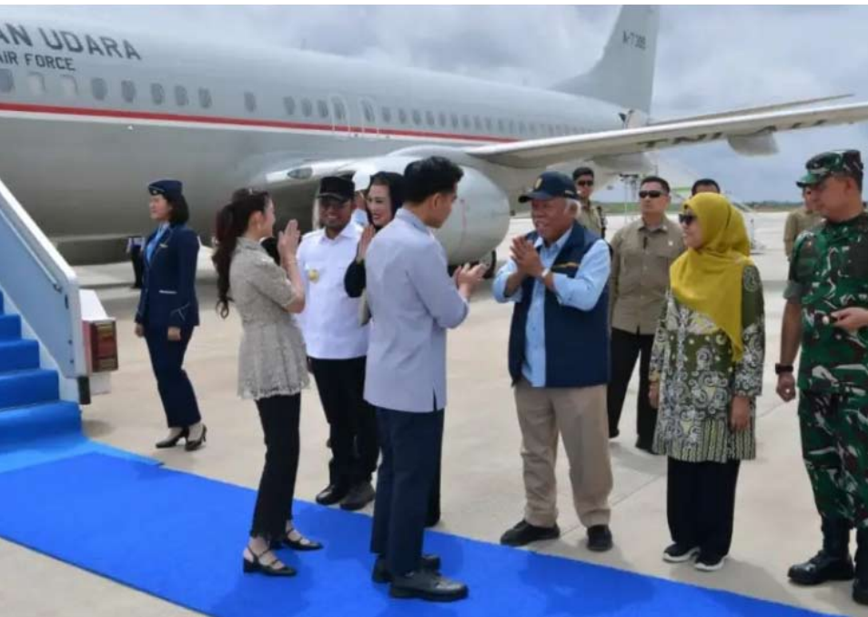
副总统吉布兰与夫人Selvi于周二（12月30日）抵达IKN国际机场时，受到OIKN局长巴苏基、东加省长鲁迪、穆拉瓦曼第六军区司令克里多，以及东加省警察局长恩达尔的迎接。

次日（12月31日）周三，副总统将继续视察IKN教育园区、立法/司法大楼建设项目，以及位于北佩纳詹·巴塞罗（Penajam Paser Utara）县塞帕库（Sepaku）镇的塞帕库市场。