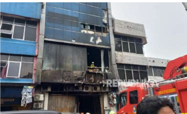
周二，（12月9日），雅加达中心区Cempaka Putih村的Terra Drone大楼发生火灾，造成22人死亡。