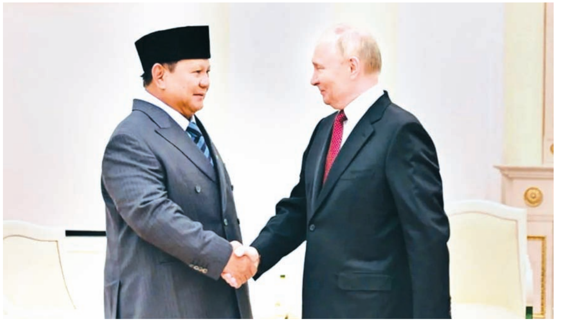
2025年12月10日，印尼总统普拉博沃在俄罗斯莫斯科克里姆林宫与普京总统举行双边会晤时握手致意。(资料存档)

据俄新社报道，普京回应称：“非常感谢。我一定会到访。十分荣幸，衷心感谢。” (cx)