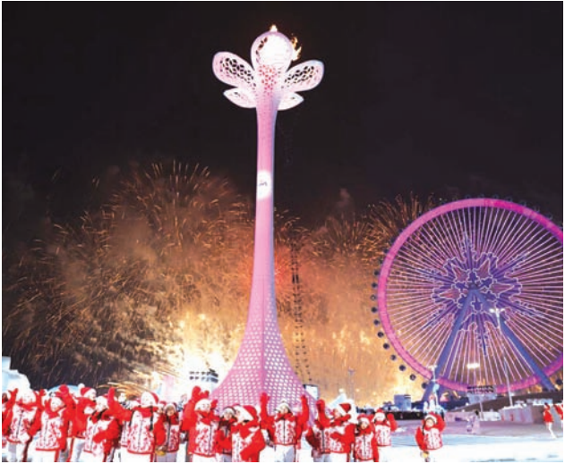
2月7日，第九届亚洲冬季运动会开幕式在哈尔滨举行。图为主火炬点燃。