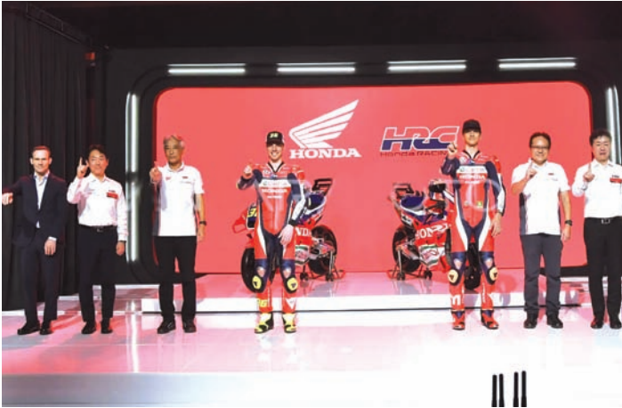
Honda Castrol Team正式发布。

2月2日，将参加2025 Castrol Team 摩托车赛车年MotoGP赛事的Honda 队在印尼正式推出。本