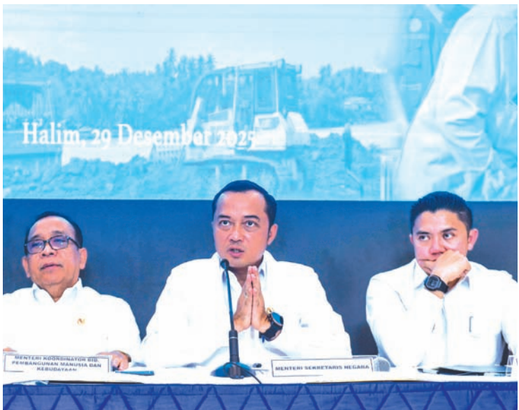
2025年12月29日，国务秘书普拉塞蒂奥·哈迪（中）在雅加达哈林空军基地综合指挥所举行的定期新闻发布会上，就亚齐省、北苏门答腊省和西苏门答腊省洪水与山体滑坡影响处理问题回答记者提问。

社会各界随后呼吁政府对三个省份涉嫌非法采伐的行为展开调查和执法。多家企业及个人被指为商业或私利滥伐森林。普拉塞蒂奥表示：“此举旨在通过核查，审视是否存在违规经营活动。”他同时强调政府也将打击林区非法采伐的个人或非企业实体。除执法行动外，政府将重新开展林区保护宣传教育工作。(cx)