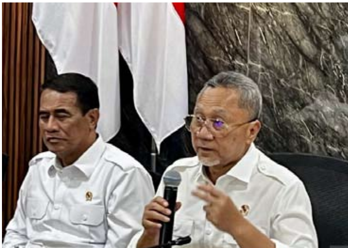
12月29日，在雅加达粮食统筹部办公楼，粮食统筹部长祖尔基夫利·哈桑（右）与农业部长安迪·阿姆兰·苏莱曼出席2026年国家粮食储备（CPP）协调会议。

营养餐项目用粮需求增长等因素，会议决定将政府大米储备规模由此前的300万吨上调至400万吨，以更好支撑粮食供应与价格稳定计划、粮食援助等政策实施。