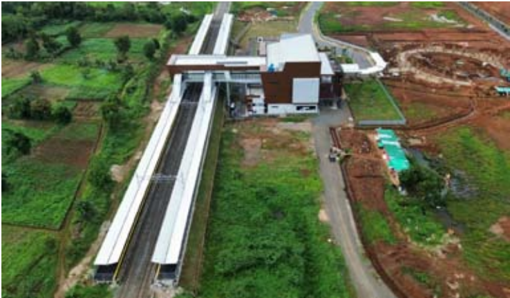
位于丹格朗县帕格当安镇贾塔克-卡杜西戎村的贾塔克车站。

【本报讯】印尼铁路公司 (PT Kereta Api Indonesia, 简称KAI) 确认，位于丹格朗县帕格当安 (Pagedangan) 镇贾塔克-卡杜西戎 (Kadusirung) 村的贾塔克车站 (Stasiun Jatake) 已做好运营准备。 KAI 总裁 Bobby Rasyidin 称，这座位于 Tanah Abang-Rangkasbitung 线路上的新车站，目标是在 2026 年 1 月开始运营，届时将完成与交通部铁路总局 (DJKA) 的共同最终验收阶段。 据他说，贾塔克车站的建设是加强雅加达缓冲区公共交通服务战略的一部分。该公司记录显示，近年来 Rangkasbitung 线路的通勤列车用户数量持续显著增长。 2022 年，用户数量为 4331 万人次，2023 年增至 6208 万人次。增长趋势在 2024 年持续，用户达 6999 万人次，并在 2025 年 1 月至 11 月期间达到 7049 万人次。 “贾塔克车站的建设是为了让铁路服务更贴近快速发展地区的社区。它的出现有望加强区域联通性，并支持更有序、高效的日常出行。” 贾塔克车站按照公共交通导向型开发 (TOD) 理念开发，将交通功能与区域活动相结合。