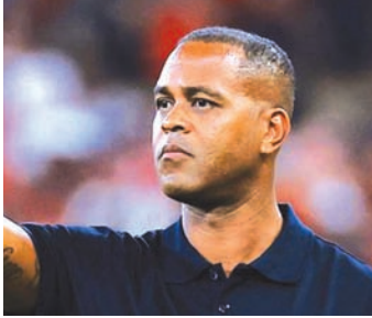
帕特里克·克鲁伊维特

1月6日，印尼足协在公告中表示，这一决定是对印尼队近期的表现以及未来长期目标进行长期、认真的考虑和评估后做出的。