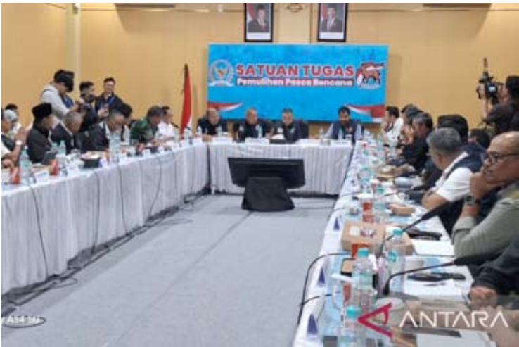
亚齐省长穆扎基尔·马纳夫与国会副议长、红白内阁部长，以及陆军参谋长一同出席国会关于灾后重建的协调会议，讨论亚齐省的洪灾和山体滑坡治理问题。

此前，穆扎基尔·马纳夫与国会副议长、红白内阁部长，以及陆军参谋长一同出席国会关于灾后重建的协调会议，讨论亚齐省的洪灾和山体滑坡治理问题。会上，他请求相关部门和陆军参谋长参与修建连接各村庄的桥梁，以加快物流流通和经济复苏。