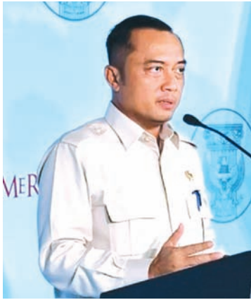
国务秘书长普拉塞蒂奥·哈迪于1月6日在西爪哇省茂物市汉巴朗地区由普拉博沃·苏比安托总统主持的年初简报会后发表声明。