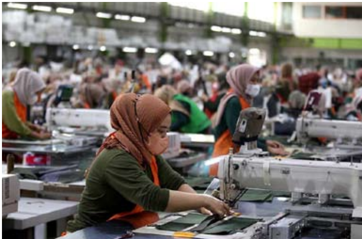
西爪省一家工厂内，员工正在进行生产作业。

【本报讯】印尼纺织业协会（API）呼吁政府在推进印尼—美国关税互惠协议谈判过程中，进一步争取将印尼纺织品和服装产品对美出口关税降至零，以切实维护劳动密集型产业的可持续发展。 该协会指出，目前印尼与美国的关税互惠协议已接近完成，但现有谈判框架主要为热带型自然资源类商品提供零关税待遇，而包括纺织品和成衣在内的制造业产品，仍拟适用19%的互惠关税水平，相关安排尚未充分体现对吸纳大量就业的产业支持。 印尼纺织业协会主席杰米·卡尔蒂瓦（Jemmy Kartiwa）表示，在协议技术细节尚处于最终磋商阶段的背景下，政府仍具备政策空间，可进一步为纺织和成衣等劳动密集型产业争取更具竞争力的关税条件。 他在近期于雅加达发布的书面声明中指出，政府在推进对外经贸合作的同时，有责任统筹兼顾国家产业发展与社会民生保障。纺织和成衣产业不仅关系到企业经营，更直接涉及数百万劳动者及其家庭的生计，应在谈判中获得充分重视。 他强调，零关税或更低关税政策不应仅限于农业及资源型商品，制造业，特别是纺织和服装产业，同样应被纳入重点争取范围，至少应获得低于19%的关税待遇。 杰米指出，在普拉博