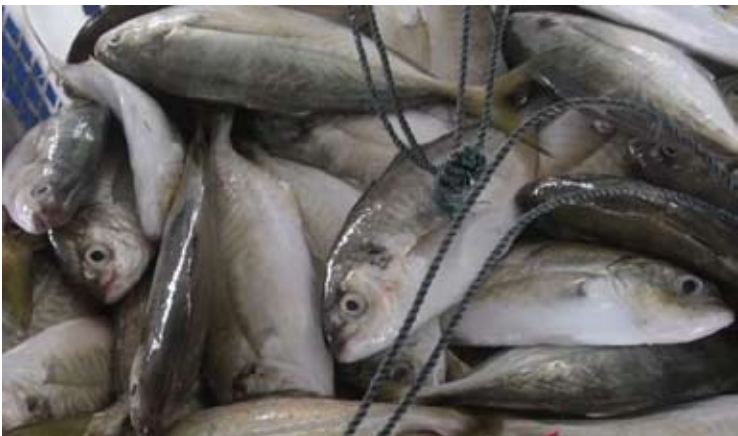
2025年，邦加一勿里洞群岛渔业出口额达到6290亿盾，比上年的5000亿盾有所增加。

如果普拉博沃总统不进行全面纠正并改组其内阁成员，汉巴朗的务虚会将意义不大。因为面临的挑战日益严峻，如果不采取所需的果断行动，普拉博沃总统可能无法实现其高经济增长和建立造福人民的经济体的梦想。公众正拭目以待，普拉博沃总统必须毫不含糊地明确其未来的步骤。