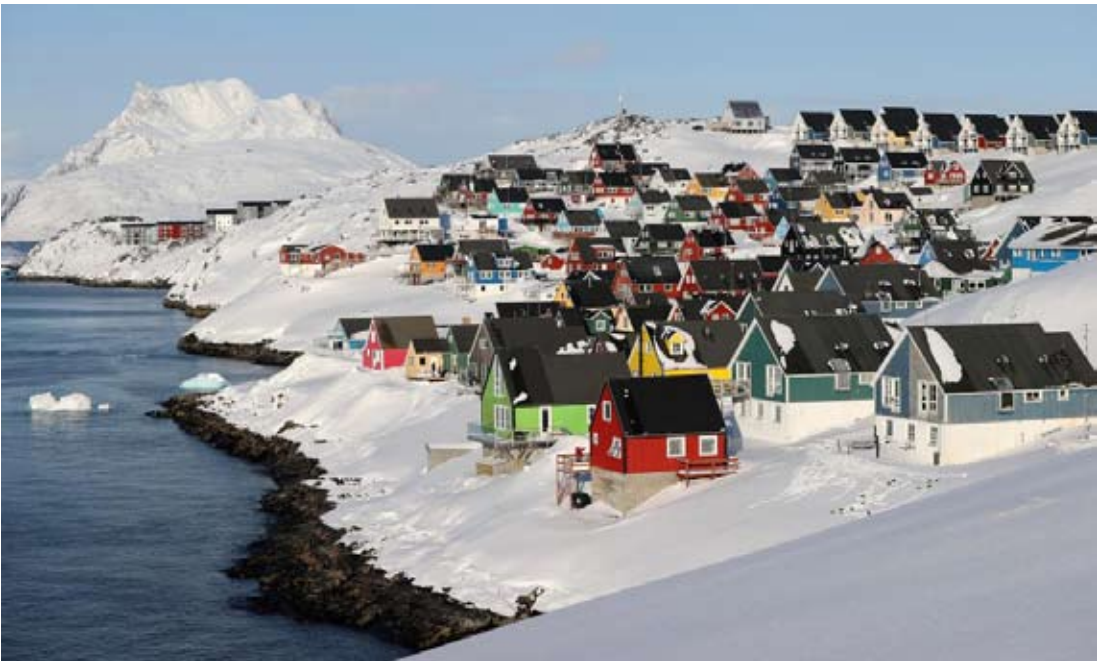
这是2025年3月20日拍摄的丹麦自治领地格陵兰岛首府努克景色。

国家，并称“我们绝对需要格陵兰岛”。美国有线电视新闻网称，特朗普“希望获得格陵兰岛控制权”的想法早在2019年其第一个总统任期内已经提出。