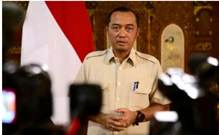
1月6日，国务秘书部长普拉塞蒂约·哈迪在总统普拉博沃·苏比延多位于西爪省茂物县汉巴朗的私人官邸出席内阁集训后，向媒体发表声明。

设，随后于2月和3月持续推进，整体完成约18个已达成共识的下游化重点项目。” 在具体项目方面，普拉塞蒂约介绍称，垃圾处理发电项目（PSEL）是即将启动的重要项目之一。该项目计划在全国34个地点同步建设，每个项目的日处理垃圾能力约为1,000吨。 他指出，相关垃圾处理设施的建设具有迫切性，有助于防止垃圾长期堆积，减少由此带来的环境与社会问题。 在能源领域方面，普拉塞蒂约表示，政府亦将推进多项煤炭气化制二甲醚（DME）下游化项目。其中，国有矿业企业武吉阿萨姆（PT Bukit Asam, PTBA）将参与相关项目的实施。