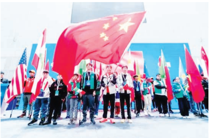
来自全球各国代表入场后合影。