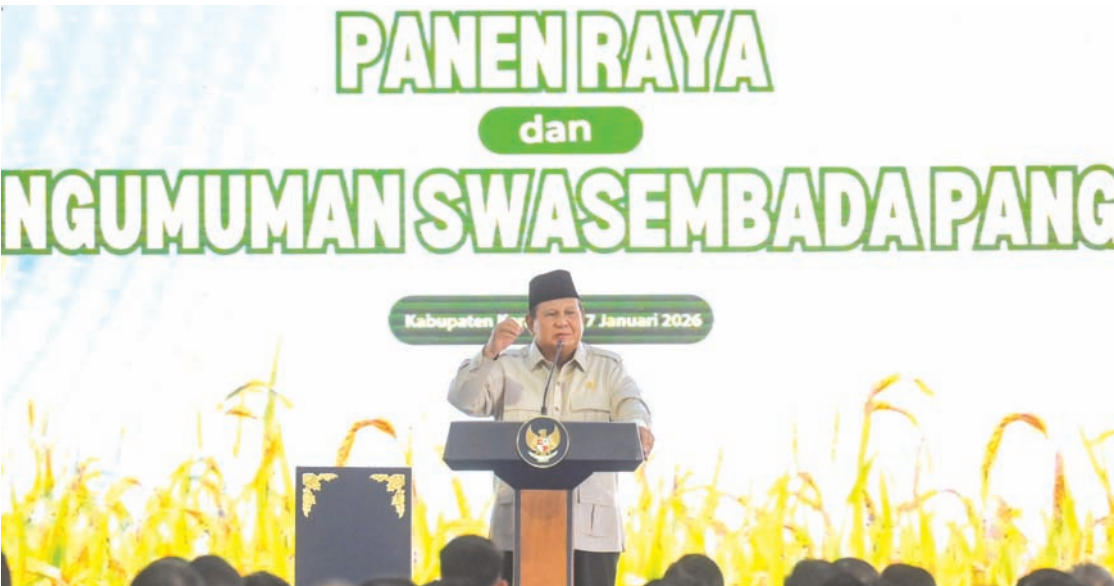
2026年1月7日，印尼总统普拉博沃出席在西爪哇省加拉横县齐勒巴尔举行的全国丰收盛典暨2025年粮食自给自足公告仪式上发表讲话。

今年大米产量或将下降 政府宣布已实现大米自给自足。然而，农业观察家库杜里指出，2026年印尼将面临严峻考验。因为预计全国大米产量将较2025年的成就出现下降。 库杜里援引美国农业部的预测称，2026年印尼大米产量预计仅为3360万吨，低于2025年估计的3410万吨。据美国农业部分析，下降由双重因素导致：收获面积减少和单位产量下降。预计收获面积将从1140万公顷降至1130万公顷，而单位产量将从每公顷4.71吨稻谷降至每公顷4.68吨。 库杜里表示，这一预测应视为对政府的早期预警。因为在宣布自给自足后若大米产量反而下降，将引发政治和政策风险。周三（1月7日），他在书面声明中表示：“总会有