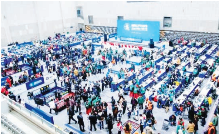
2025世界机器人大赛总决赛一景。