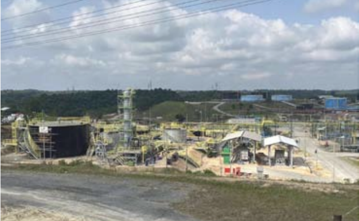
Pertamina Hulu Rokan（PHR）公司Minas油田—Rokan区块。