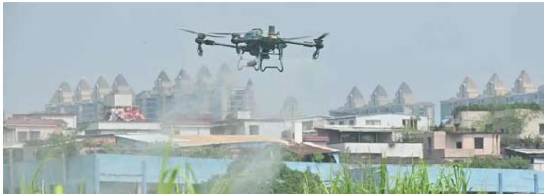
无人机和导航系统等属于军民两用产品，可能将在中国对日出口管制之列。

去年4月4日，根据《中国出口管制法》等有关法律法规，中国商务部会同海关总署发布公告，对钐、钕、铽、镱、铕、钆、铈等七类中重稀土相关物项实施出口管制措施，并于发布之日起正式实施。