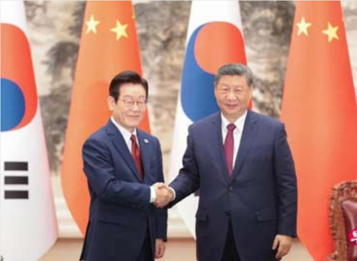
中国国家主席习近平（右）星期一（1月5日）下午在北京人民大会堂同赴华进行国事访问的韩国总统李在明举行会谈。

另据路透社、法新社报道，韩国总统李在明近日在接受媒体采访时表示，他在与中国国家主席习近平会晤期间，曾就朝鲜核问题同中方交换意见，并希望中方在推