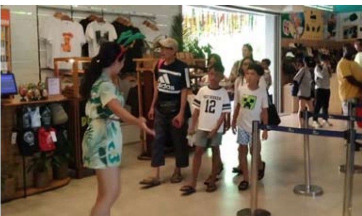
图为周三（7/1），游客到访巴厘岛巴东县库塔的一处旅游景点。

他补充说，旅游从业者可通过专业认证机构（LSP）申请符合国家标准（SNI）9042:2021的CHSE认证，目前该认证已成为强制性要求。