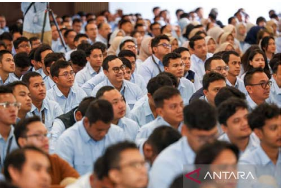
在东加里曼丹省北佩纳扬·巴塞尔（Penajam Paser Utara）县塞帕库（Sepaku）镇努山达拉首都管理局（OIKN）任职的公务员。