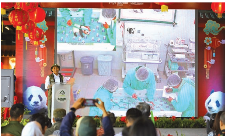
1月6日，印尼林业部长拉贾·朱利·安东尼拉出席“新出生大熊猫幼仔媒体发布会”。中新社记者 李志全 摄

大熊猫“彩陶”和“湖春”于2017年9月抵达“千岛之国”印尼，开启中印尼大熊猫保护合作。茂物野生动物园负责人表示，印尼首只大熊猫幼仔的诞生具有里程碑意义，将进一步推动印尼与中国在生态保护和科研交流方面的合作。