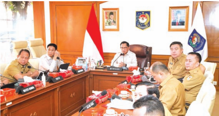
印尼内政部长狄托主持召开了苏门答腊地区灾后房屋损坏、公共设施及最新难民人数统计协调会议。

“我们希望此次研讨会能促成印尼的需求与日本的技术优势实现对接，同时借助NEDO的计划和资金支持，加快建立具体的研究合作，”Kikuo Kishimoto如是说。（fd）