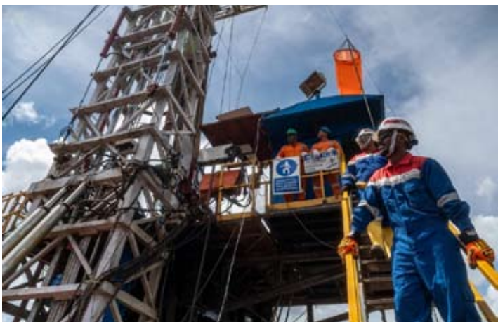
国油公司Pertamina EP巴布亚油田的工作人员在巴布亚西南省索龙县克拉塞法特区，对Buah Merah（BMR）-001勘探井钻探区域设施进行检查。

国务秘书部长普拉塞蒂约·哈迪（Prasetyo Hadi）在随后通过线上方式举行的新闻发布会上表示，能源与矿产资源部确认，2025年石油提升量（衡量准备出售的原油产量的指标）已达到国家预算（APBN）既定目标，即605000桶/日。 他转述称，政府已将2026年石油提升量目标设定为610000桶/日，较2025年进一步提高；同期，天然气提升量目标区间为5338万至5695万标准立方英尺/日。 普拉塞蒂约指出，基于一揽子既定推进措施，政府对实现2026年石油提升量目标保持审慎乐观态度。总统普拉博沃已要求能源与矿产资源部自2026年2月起，启动75个油气工作区（WK）的公开招标工作。