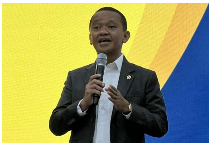
1月8日，能源与矿产资源部长巴赫利尔·拉哈达利亚在雅加达能源与矿产资源部举行的2025年部门工作成果新闻发布会上发表政策说明。

根据政府规划，未来将新增发电装机容量69.5吉瓦（GW）。其中，新能源和可再生能源装机容量42.6吉瓦，占比61%；储能系统装机容量10.3吉瓦，占比15%；化石能源发电装机容量16.6吉瓦，占比24%。