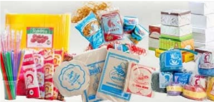
Panca Budi Idaman (PBID)公司生产的产品。