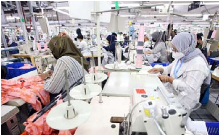
在西爪哇省万隆市的一家服装厂，员工正在生产成衣。

【本报讯】纺织和服装厂及企业的关闭潮仍在持续。业内人士甚至预测，若今年劳动密集型工业部门没有改善，工厂关闭的可能性依然存在。