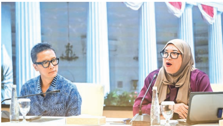
2026年1月8日，印尼外交部人权与移民事务司司长英达·努里亚·萨维特里（右）与外交部新闻媒体司司长哈尔托·哈尔科莫约（左），在雅加达外交部帕拉帕厅举行新闻发布会。外交部表示，当前委内瑞拉局势趋于正常，暂无对37名在委印尼公民实施撤离的打算。