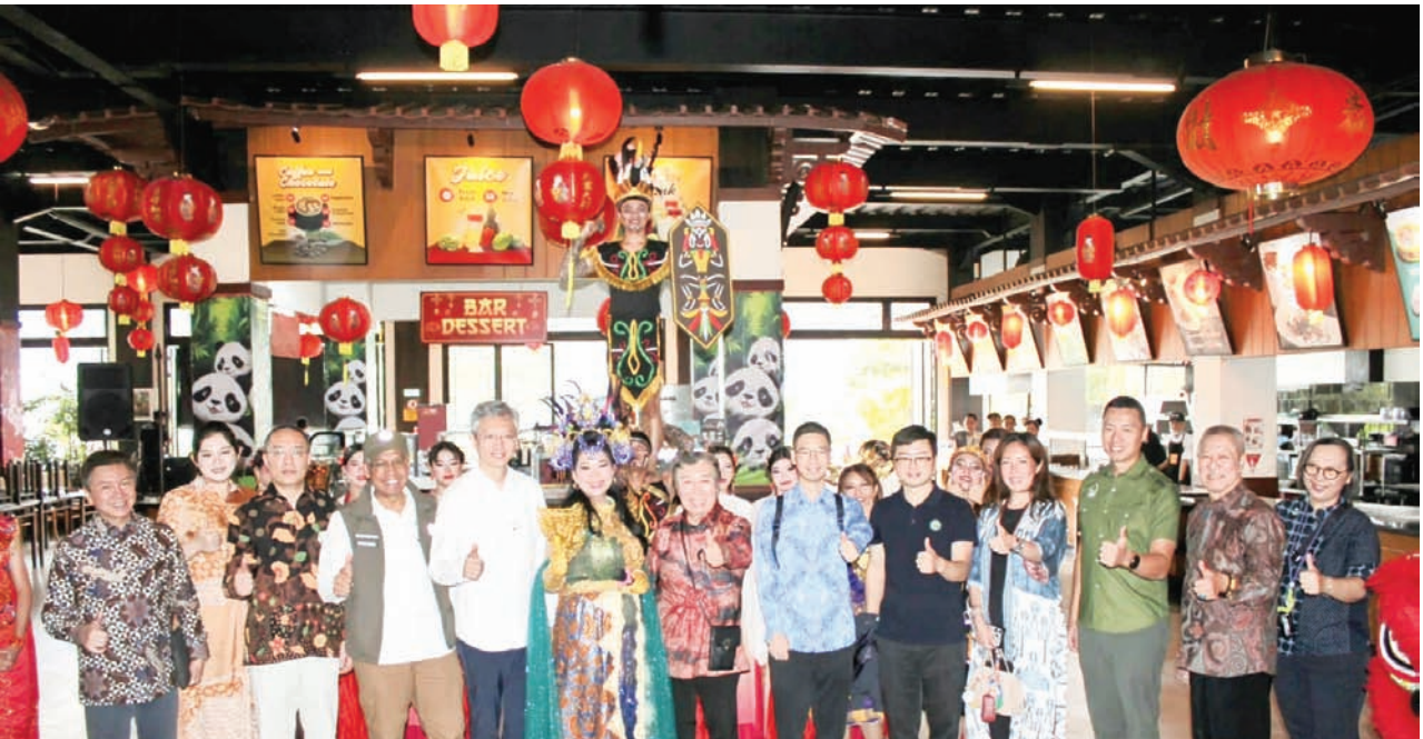
感恩庆祝活动结束后合影留念，活动在印尼野生动物园熊猫宫 (Istana Panda TSI) 共进午餐圆满落幕。