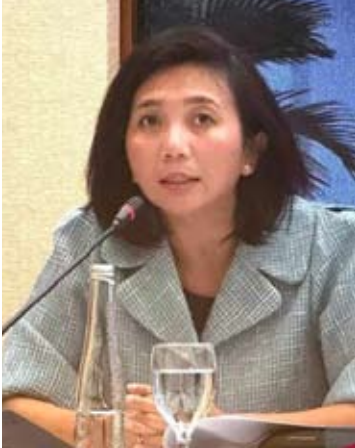
外交部发言人Yvonne Mewengkang在雅加达举行的媒体吹风会上致辞。

多方乐观地认为，将房地产行业的增值税优惠延长至2026年底，将成为保持国内制造业增长势头、同时加强工业领域对印尼经济贡献的重要工具之一。