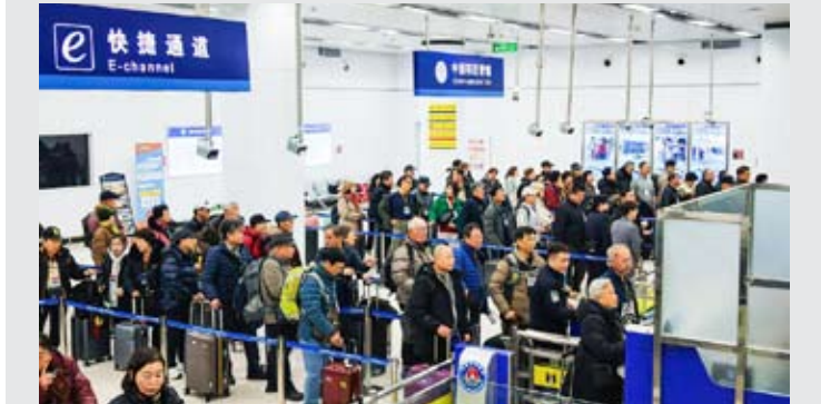
2025年12月28日，在江苏连云港国际客运站入境大厅，韩国游客在进行通关，开启5天中国跨年之旅（无人机照片）。

【中新社北京1月8日电】中国公安部新闻发言人张明8日在北京表示，240小时过境免签政策正式实施一年来，全国各口岸入境外国人4060万人次，同比增长27.2%。 公安部8日在北京召开新闻发布会，通报2025年公安机关全力维护国家政治安全社会安全稳定及第六个警察节有关安排。 张明在会上介绍，2025年公安机关加快推进移民管理领域制度型开放，240小时过境免签政策正式实施一年来，全国各口岸入境外国人4060万人次，同比增长