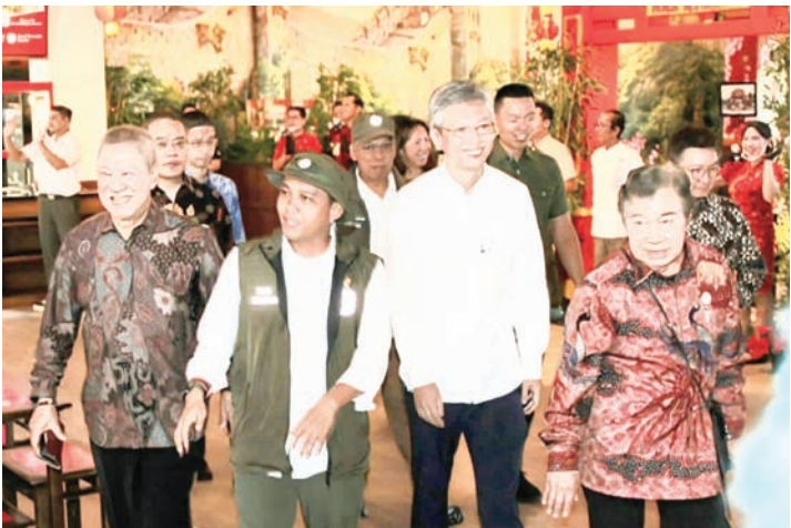
中国驻印尼大使王鲁彤与林业部长拉贾·朱利·安托尼、蔡亚声及李常足一同步入在印尼野生动物园举行的感恩庆祝活动会场。