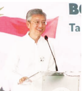
中国驻印尼大使王鲁彤发表致辞。

是两国科学家的合作成果。大熊猫成功繁育，是印尼与中国在辅助生殖技术 (ART) 领域开展科研合作的具体体现，参与机构包括印尼野生动物园、中国大熊猫保护研究中心 (CCRCGP)、德国莱布尼茨野生动物研究所 (IZW)，以及印尼茂物农业大学。”他解释道。 尽管出生在Bogor，但根据合作协议，大熊猫即便在海外出生，最终仍需在合作期结束后返回中国。目前合作期限为10年，双方可根据协议协商续约。