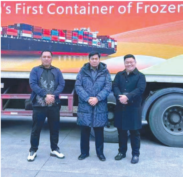
印尼首柜冷冻榴莲

【中新网01月06日】近来，多份国际知名科创榜单显示：中国在科研产出、学科贡献、技术研发能力等方面名列前茅，得到全球范围内广泛认可。 比如，最新发布的《自然》杂志增刊显示，“自然指数—科研城市”十强中，中国城市占据六席，全球200强有数十个中国城市上榜；世界知识产权组织《2025年全球创新指数报告》显示，中国跻身全球最具创新力的十个经济体之一；美国《国家科学院学报》发表的研究数据显示，中国科学家在国际合作中担任领导角色的数量迅速增长；科睿唯安公司发布的高被引研究者奖项，其中五分之一被授予中国大陆的研究人员…… 这些数据深刻反映出，中国在全球创新体系中的位势显著提升，在全球创新格局中地位正发生实质性变化。 在快速演进的全球科技生态中，一些重要的科创榜