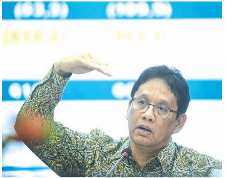
2026年1月8日，印尼财政部长普尔巴亚·萨德瓦在雅加达出席2026年1月版国家收支预算（APBN KiTa）新闻发布会时表示，截至2025年12月31日，印尼财政部执行的国家收支预算实际录得赤字695万亿盾，占国内生产总值的2.92%。

该法第31条第2款进一步规定，为支持政府政策、维持财政可持续性并应对市场风险和不确定性，财