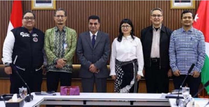
高教与科研部副部长斯特拉·克里斯蒂（右三）与约旦驻印尼大使苏德基·阿塔拉·阿卜杜·阿尔卡德尔·阿尔·奥穆什（左三）举行会晤后合影。

除医学教育外，合作还将为包括护理人员在内的医疗卫生工作者提供培训机会，使其具备全球竞争