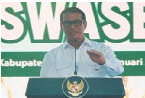
农业部长安迪·阿姆兰·苏莱曼在普拉博沃·苏比安托总统主持的全国粮食丰收暨粮食自给自足成果发布活动上发表讲话。该活动于1月7日在西爪哇省卡拉旺县举行，约5000名农民和农业推广人员线下参与，另有约200万名农民通过线上方式参加。

他强调，政府将坚定推进建设高效、现代、具备国际竞争力的农业体系，把农业现代化作为实现国家粮食自主和可持续发展的重要基础。