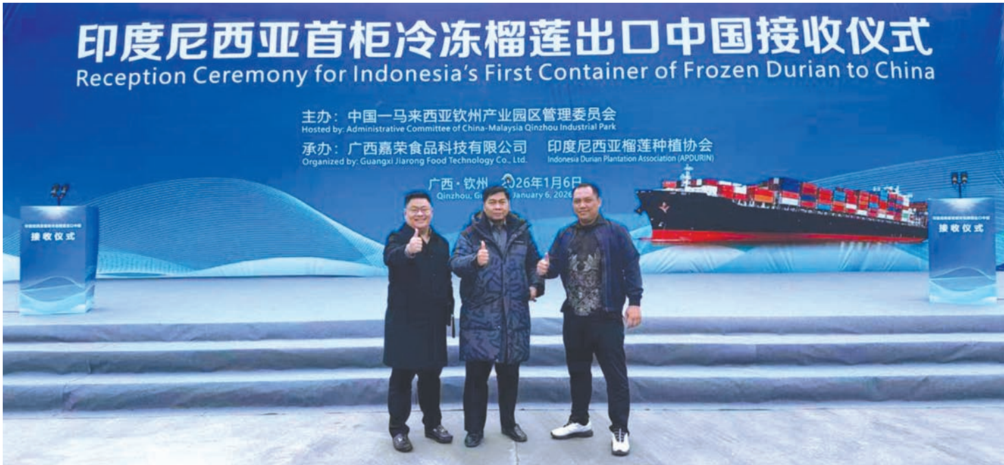
印尼首柜冷冻榴莲出口中国接收仪式后合影