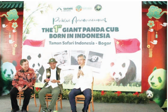
“印尼首只大熊猫幼崽诞生公众发布会”活动结束后举行新闻发布会。