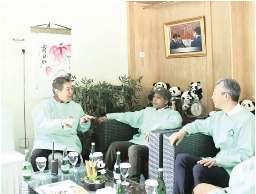
左起：印尼野生动物园创始人蔡亚声、印尼林业部长拉贾·朱利·安托尼，以及中国驻印尼大使王鲁彤在印尼野生动物园通过监控画面 (CCTV) 讨论并观看大熊猫宝宝“里奥”。