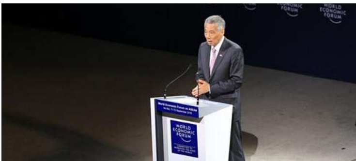
资料图：李显龙。

李显龙称，“美国军事干预委内瑞拉的行为，相当清楚是违反了国际法。” 李显龙表示，新加坡反对对他国的军事干预，因为“这违反国际法，违反联合国宪章”。