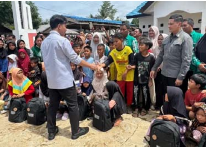
副总统吉布兰访问南加里曼丹省巴朗岸（Balangan）县受洪水影响的Ju’uh国立小学。

【本报讯】周四（1月8日），副总统吉布兰实地视察南加里曼丹省巴朗岸（Balangan）县洪水造成的灾情。抵达马辰（Banjarmasin）机场后，副总统立即前往灾区，以实际行动体现了国家在民众遭受灾害时的同在。