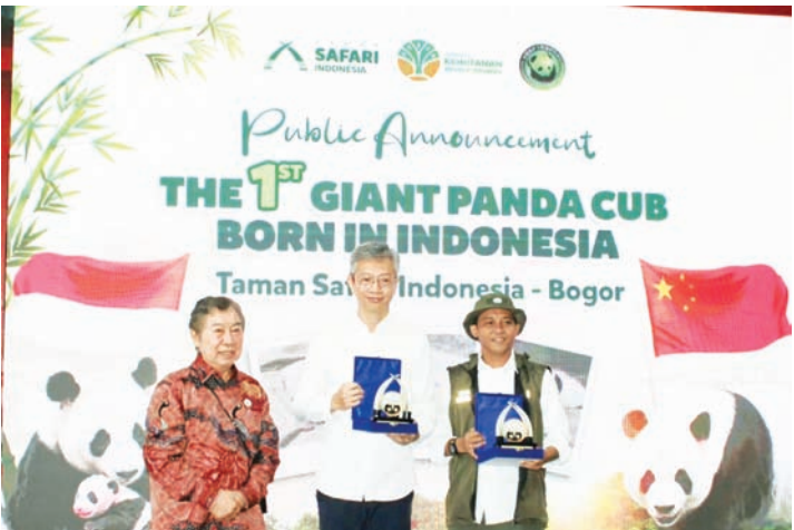
中国驻印尼大使王鲁彤与印尼林业部长拉贾·朱利·安托尼，在接受由印尼野生动物园创始人蔡亚声赠送的纪念品后合影留念。