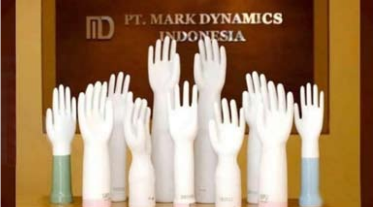
Mark Dynamics 印尼公司 (MARK) 出品的手套模具。

【本报讯】Mark Dynamics 印尼公司 (MARK) 正积极寻求机会，力争在今年实现两位数的销售增长率。