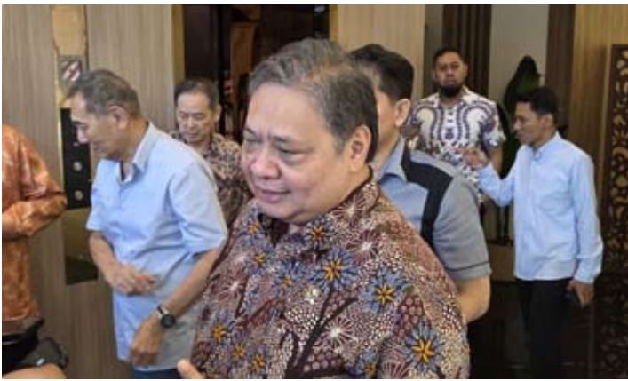
经济统筹部长艾尔朗加·哈尔塔托

绍，1月11日（周日）在汉巴朗举行的会议上，普拉博沃·苏比安托总统强调，在当前全球贸易环境不确定性上升的背景下，纺织工业作为印尼传统优势产业和高度外向型产业，具有重要的战略意义，需要通过针对性政策加以巩固和发展。