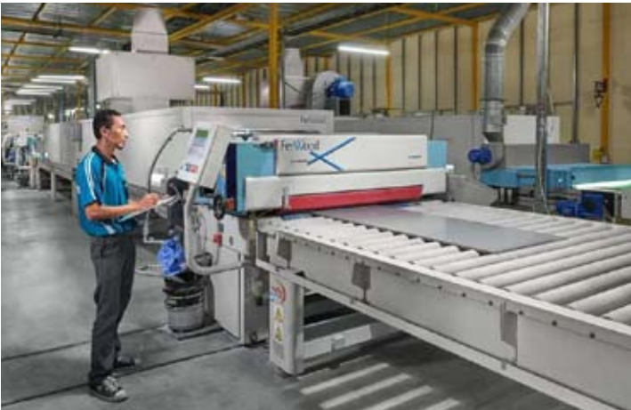
Integra Indocabinet (WOOD)公司家具厂。

今年，WOOD定下指标，在持续不断推出口市场多元化战略的同时，充分利用美国市场不断增长的需求。 Integra Indocabinet 公司投资者关系负责人 Ravenal Arvense 仍未透露 WOOD 去年的业绩详情。 他仅描述出口市场仍是 WOOD 的主要收入来源，占比稳定在 90% 以上。 Ravenal对记者称，美国市场仍占据主导地位，贡献约 80% 的收入。 “美国市场是全球最大的木制家具和建筑构件市场，甚至超过其他四大市场的总和。” 建筑构件出口是 WOOD 业务的关键驱动力。截至2025年第三季度，WOOD 的建筑构件出口额达1.76万亿盾。该数字相等于 WOOD 同期间2.15万亿盾总销售额的81.86%。 按价值计算，WOOD 的建筑构件出口额比2024年同期增长18.12%。 Ravenal 对 WOOD 2026年的业务前景持着乐观的态度，主要得益于美国房地产市场改善对建筑构件的需求。