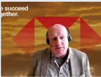
Herald van der Linde

【本报讯】汇丰投资环球研究部首席亚洲股票策略师 Herald van der Linde 预测，印尼证券交易所的 IHSG 有望在2026年升至 9,700点。他认为，印尼股市整体前景偏正面，但仍需关注盾汇率波动以及外资流入流出的不确定性所带来的风险。“我们对IHSG设定的目标为 9,700点，高于当前约8,600点的水平。这意味着市场仍具备良好的上行空间。当然，风险因素主要包括汇率波动以及全球资金流向。”Herald于1月12日（周一）在雅加达出席“印尼宏观经济展望及2026年投资前景”主题活动时表示。