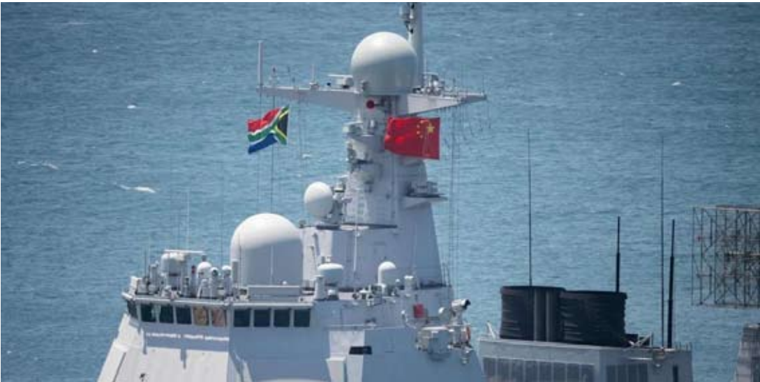
中国、俄罗斯、伊朗、南非等金砖国旗星期六（1月10日）在南非国旗展开一周的海上联合演习。图为解放军派出导弹艇唐山舰参演，舰上悬挂南非和中国国旗。

丰富的安全合作经验。本次联合演习聚焦非传统安全领域，贴合发展中国家实际需求，更具针对性、务实性。长此以往，金砖国家间必将探索出一套更符合地区和平稳定大局的安全合作新模式。与某些国家和国际组织主导下的军演不同，金砖联演不是耀武扬威，而是一个增进交流互信的外交平台。众所周知，海上通道是全球贸易的生命线，包括好望角航线在内的南非附近海域多条航道，一直是全球能源资源和大宗商品运输的关键通道。金砖国家在这一海域举行以海上搜救、反海盗巡逻、国际航道护航等重点课目的联合训练，不仅意在打击海上跨国犯罪，合力维护国际航道安全，更具有创新国际水道联合管理新范式、构建全球海