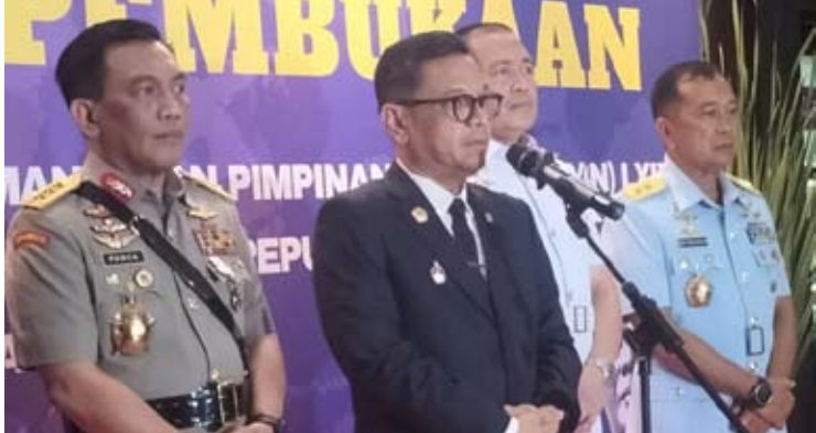
国家安防机构主任艾斯·哈桑·夏迪里在位于雅加达中区的国防研究院大楼接受采访一瞥。

我们必须信任政府。目前，达南塔拉（Danantara）投资机构拥有雄厚的资金，并有能力吸引国内外主要投资者。因此，炼油厂建设项目的资金不成问题。虽然资金到位，但我们仍然需要建设这些炼油厂的决心和毅力。如果这些炼油厂得以建成，不仅有助于减少燃油补贴，还能显著惠及消费者。因为生产成本可以降低，从而减轻消费者的购买压力。