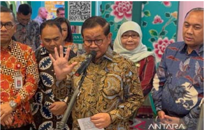
雅京省长普拉莫诺周二（1月13日）在雅加达中区发表声明。达的洪水问题得到更有效的控制。（pl）

【本报讯】副总统吉布兰于1月13日（周二）上午启程前往巴布亚（Papua），对多个地区进行工作访问。此次访问是政府为促进包容、公平和公正的发展，并确保国家优先计划在印尼东部地区得以优化实施。