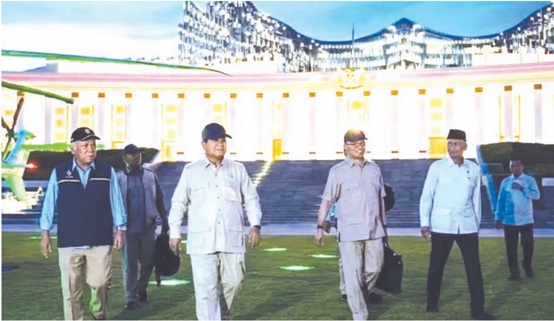
2026年1月12日下午，印尼总统普拉博沃乘直升机抵达位于东加里曼丹省北佩纳扬巴塞尔县的新首都雄鹰宫直升机停机坪。

巴苏基强调，普拉博沃政府全力承诺继续推进新首都建设和迁移。他表示新首都项目已不仅是构想，而是明确的国家政策。据他透露，普拉博沃已在G20等多边国际场合持续表态，以消除领导层过渡期间市场与投资者对项目延续性的疑虑。