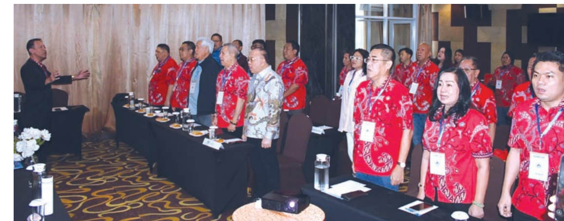
齐唱印度尼西亚国歌。