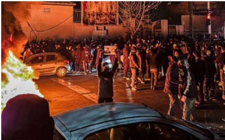
2026年1月9日，伊朗民众聚集在德黑兰街头，封锁街道，举行抗议活动。