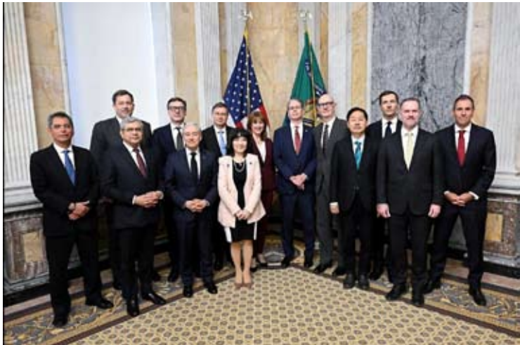
以七大工业国组织（G7）为首的财长们12日在华盛顿召开关键矿物会议。