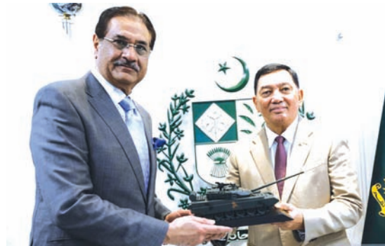
2026年1月12日，印尼国防部长夏弗里（右）在巴基斯坦国防生产部会见了巴基斯坦国防生产部长哈拉吉。

在多项军购谈判中取得进展，包括与利比亚国民军和苏丹武装部队达成的协议，旨在巩固其作为重要区域角色的地位。