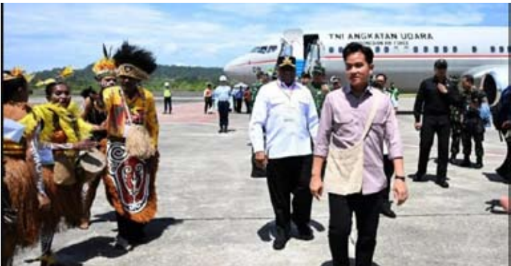
副总统吉布兰于1月13日（周二）访问巴布亚。

作为访问首站，副总统吉布兰前往巴布亚省比亚克·努姆富尔（Biak Numfor）县。在比亚克，副总统计划视察教育