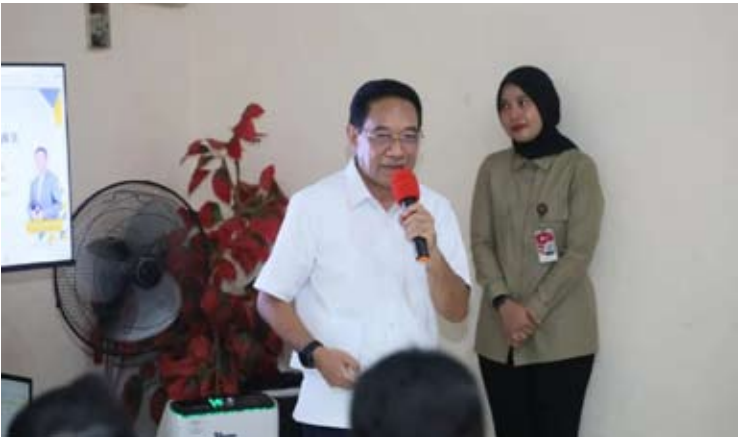
卫生部副部长Benyamin Paulus Octavianus博士在望加锡巴拉萨朗社区健康中心实地考察结核病防治创新工作。

“感谢总统和教育文化部为我们提供了获得这项非凡援助的机会。希望我们能最大限度地利用这些设施，让我们的学生能够具备竞争力，”阿斯特里亚尼如是说。（fd）