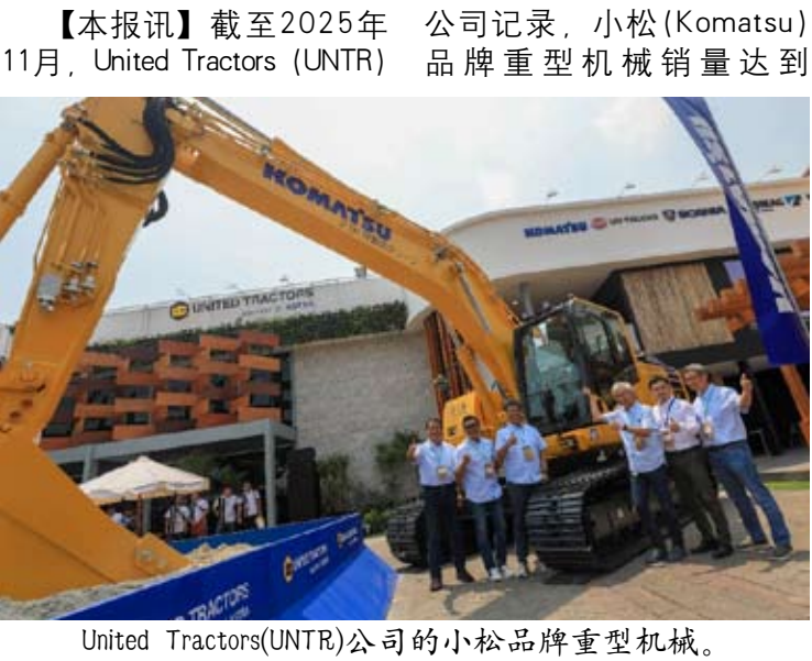
United Tractors(UNTR)公司的小松品牌重型机械。

【本报讯】截至2025年11月，United Tractors (UNTR) 公司记录，小松(Komatsu) 品牌重型机械销量达到