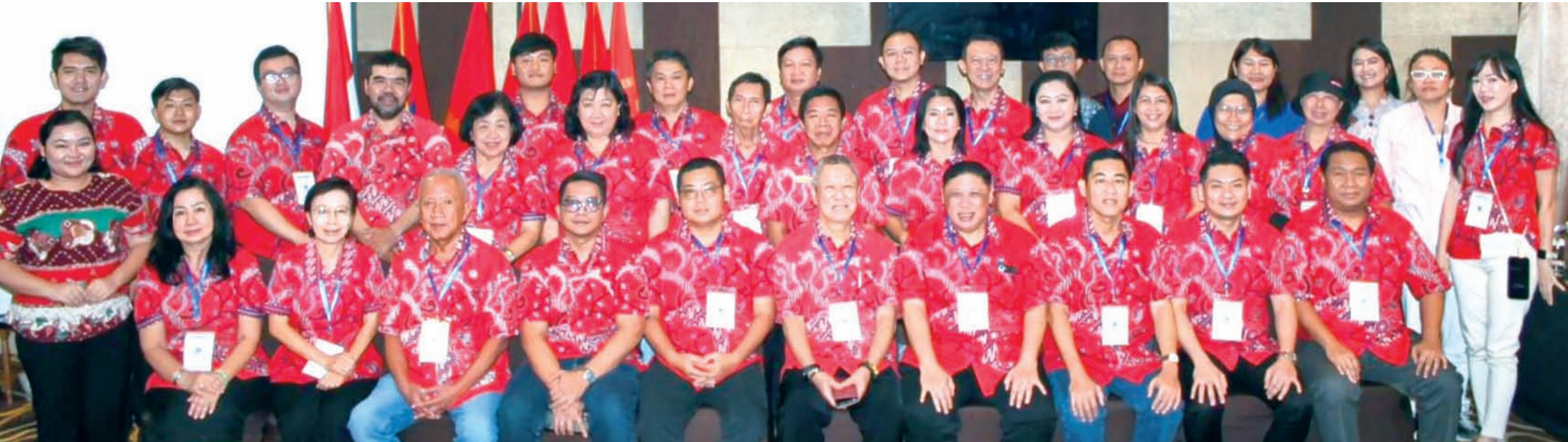
第二届省工作会议、省代表大会暨PSMTI Cilegon市理事会就职典礼圆满结束后合影。