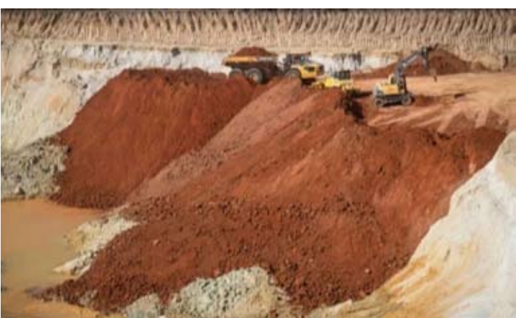
乌克兰总理斯维里坚科12日宣布，有美国政府背景的多布拉锂业控股公司获得乌克兰多布拉锂矿开采权。

道以及企业官网信息，“科技金属”公司总部设在爱尔兰首都都柏林。美国总统特朗普首届总统任期内成立的联邦机构美国国际开发金融公司是“科技金属”的重要股东，支持该公司开展符合西方利益的“关键矿产供应链”投资业务。另据美国《纽约时报》本月早些时候报道，“科技金属”的股东之一是特朗