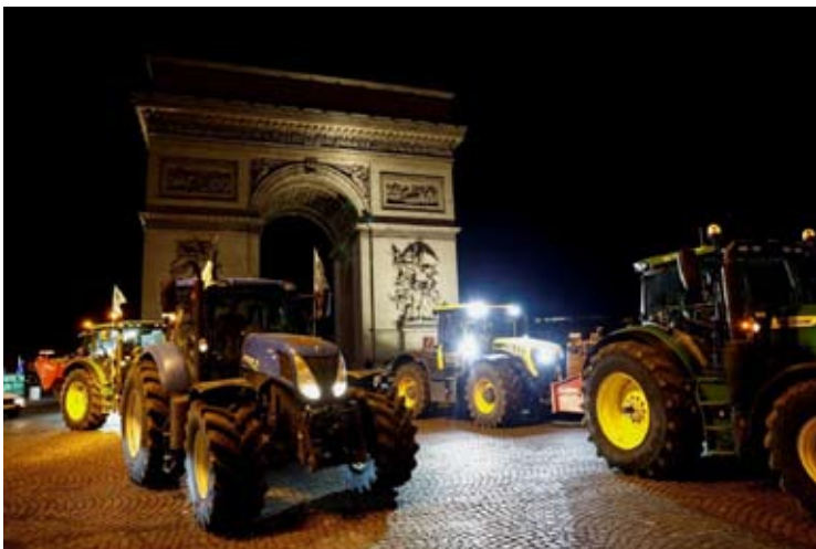
因不满欧盟—南共市自贸协定及法国政府其他相关农业政策，部分法国农民13日早驾驶拖拉机进入巴黎市区示威。

法国国民议会左翼和极右翼部分议员，分别在9日和12日提交不信任动议，批评政府未采取有效措施阻止欧盟—南共市自贸协定。左翼动议同时也抗议政府未能有力谴责美国袭击委内瑞拉。