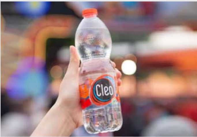
Sariguna Primatirta (CLEO) 公司生产的1公升瓶装CLEO饮用水。

【本报讯】纯净饮用水生产企业Cleo在巴厘岛Kedonganan海滩地区发起了一项海滩清洁活动，配合2026年1月10日世界环保日。这次活动由Cleo与巴厘岛省政府和Bendega环保组织合作开展，旨在履行其保护沿海环境的承诺。