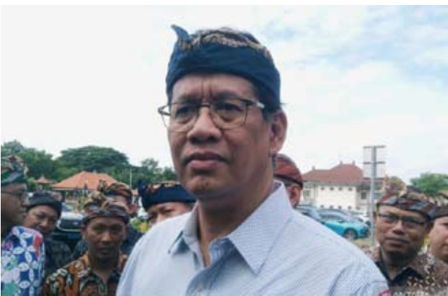
财政部长普尔巴亚·尤迪·萨德瓦

数据显示，2026年APBN框架下，国家收入规模设定为3,153.58万亿盾，其中税收收入为