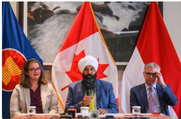
周二(1月13日)，加拿大国际发展国务部长兰迪普·萨雷(中)，与加拿大驻印尼大使Jess Dutton(右)，和加拿大驻东盟大使Ambra Dickie(左)陪同下，在雅加达向记者发表声明。

第四项倡议是提供390万加元或约合472亿盾、为期四年的资金，用于支持妇女主导的气候行动，为加强妇女在气候减缓和适应方面的领导力，并推进性别响应型气候治理。