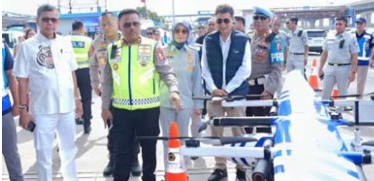
1月9日，国家交通警察队长 阿古斯·苏里约努格罗霍少将（中左）与交警总局执法部门官员一同视察Cibubur主干道区域无人机ETLE系统的首次运行。

政府重申承诺，将立即实现多个价值数百万亿盾涵盖多个发展领域和行业的下游项目。这些重大项目自去年以来就已宣布，尤其是根据报道吸引了众多外国投资者的浓厚兴趣，因此公众正翘首以盼这些项目的落实。 去年，能源和矿产资源部长巴赫利尔·拉哈达利亚（Bahliil Lahadalia）向达南塔拉（Danantara）首席执行官提交了18个下游项目规划的可行性研究报告。作为下游产业加速发展和国家能源安全工作组组长，巴赫利尔表示，这些项目的投资额已达386.3亿美元，相当于618.13万亿盾。 达南塔拉首席执行官罗桑·罗斯拉尼（Rosan Roeslani）也于2025年6月表示，达南塔拉已通过与另一家主权财富基金的合作，获得70亿美元的融资。值得注意的是，即将实施的项目数量有所变化。 普拉博沃·苏比安托总统于周一（1月12日）在巴厘巴板（Balikpapan）表示，六个项目（可能多达十一个）即将启动。总统说，“我们将在未来几周内启动这些项目。我们希望至少启动六个下游项目，或许最多能启动十一个。总价值约为60亿美元。” 普拉博沃总统解释说，这些下游项目将伴随着大量海外投资的涌入。总统强调，下游产业发展对于印尼应对日益激烈的全球竞争至关重要。总统认为，丰富的自然资源若不辅以产业强化，将无法为国家带来最佳效益。 此外，下游产业发展计划的成功，很大程度上取决于资金的到位和有效的管理。政府对通过专业化和目标明确的管理，实现国家下游产业发展目标充满信心。 根据国家下游产业和能源安全工作组的初步研究，在18个项目中，矿产和煤炭的下游项目规模最大，共有8个项目，总价值达201亿美元。能源安全领域的项目投资额为145亿美元，农业、海事，以及能源转型领域的项目投资额为25亿美元。 我们注意到，这是普拉博沃总统访问多个国家期间，获得多项外国资金承诺的重要后续行动。几个月前，普拉博沃总统访问北京期间，见证了印尼和中国企业在粮食安全、能源安全、下游产业、可再生能源、先进制造业，以及医疗保健等领域签署谅解备忘录。据悉，投资额超过100亿美元。 在访问俄罗斯期间，双方就未来能源发展合作达成协议，将共同建设一座500兆瓦的小型模块化反应堆（Small Modular Reactor /SMR）。小型模块化反应堆是一种尖端核技术，被认为更安全、更高效，也更适合满足印尼偏远地区的能源需求。 此外，印尼和新加坡已对多项合作达成一致，包括在廖内群岛省开发一个综合性绿色工业区。该工业区旨在构建一个完整的生态系统。目前，尚不清楚垃圾发电项目是否包含在这个下游项目中。普拉博沃总统曾表示，政府今年将启动34个垃圾发电项目，招标工作已于近期启动。 我们完全支持这些下游项目的快速实施。然而，我们不断提醒政府，务必迅速落实这些项目，切勿空口许诺。此外，必须格外谨慎，更重要的是，必须进行全面的环境影响分析。我们近期在苏门答腊岛经历了一场重大灾难，正是由于审批不力、监管不力而造成严重的环境破坏。 我们需要强调的是，发展不仅是为了享受当下，更是为了子孙后代的可持续发展。因此，除了保护环境之外，还必须负责任地管理环境。这对政府来说是一个真正的挑战，政府必须实施一系列政策，以确保长期、可持续和公平的发展。