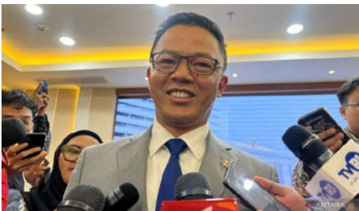
苏吉奥诺外长在雅加达发表2026年外交部长年度新闻声明后接受记者采访。

【本报讯】伊朗爆发大规模示威活动后，印尼外交部长苏吉奥诺（Sugiono）表示，大部分在伊朗的印尼公民是集中在库姆（Qom）和伊斯法罕（Isfahan）市的学生，据了解这些城市并非该国大规模示威的爆点。在决定从伊朗撤离印尼公民之前，外交部将继续监测伊朗局势。