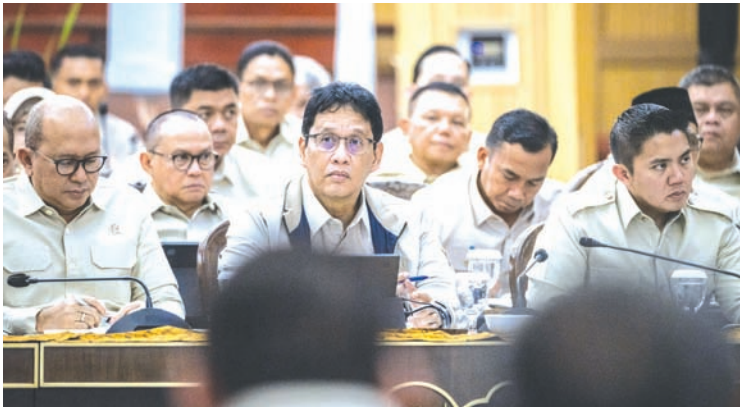
内阁秘书Teddy Indra Wijaya（右）与财政部长Purbaya Yudhi Sadewa（中）及投资与下游产业部长兼投资协调委员会（BKPM）主任兼达南塔拉投资管理机构首席执行官Roslan Roeslani（左），于2026年1月6日在西爪哇茂物县汉巴朗出席红白内阁年度务虚会时，聆听总统普拉博沃·苏比安托在年初政策说明会上的指示。

他阐明，下游产业化项目将伴随着来自国外的大规模投资涌入，因此政府对人力资源的储备和项目