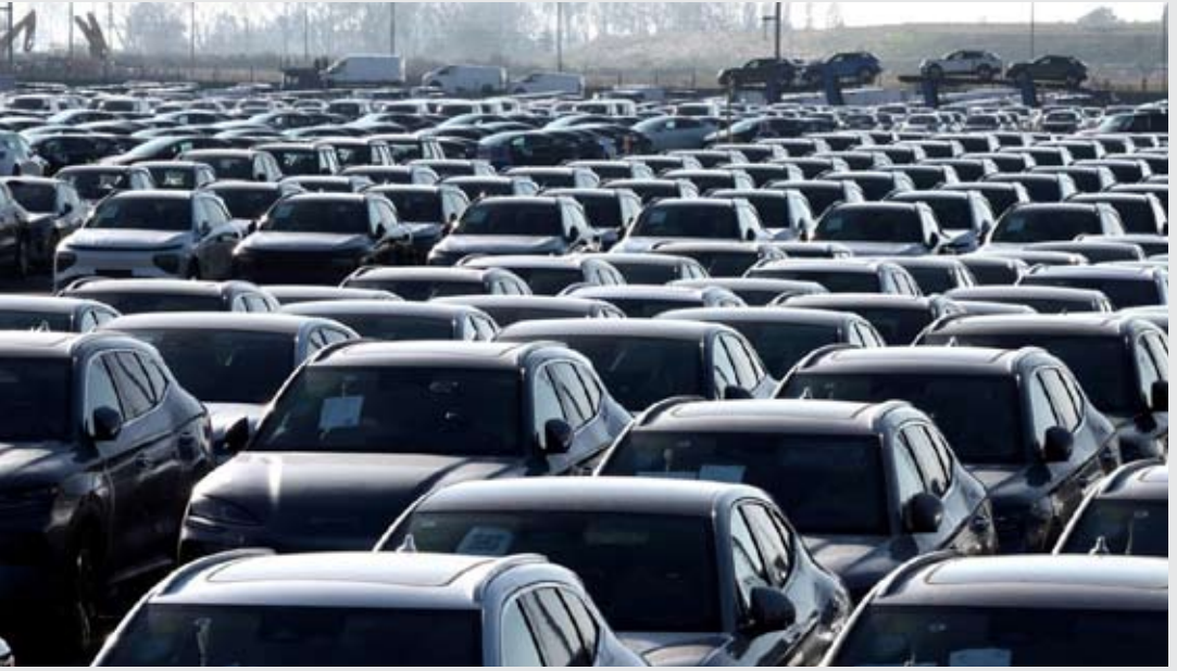
有数据反映，比亚迪汽车去年即使面对欧盟高额关税，在区内的市场销售额依然强劲。