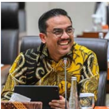
中小企业与合作社部长马曼·阿卜杜拉赫曼。

既能从事摩托车载客服务，也能开展创业活动。 “因为这种伙伴关系赋予了司机时间上的灵活性，他们当然可以利用这一点开展副业，而不仅仅是做网约摩托车司机。例如，可以开小吃店，” 部长说道。 他接着强调政府，包括中小微企业部在内，正致力于通过平台服务商、司机合作伙伴及平台内中小微企业共同支撑的数字经济生态系统。 马曼认为，这三者相互关联，是密不可分的要素。