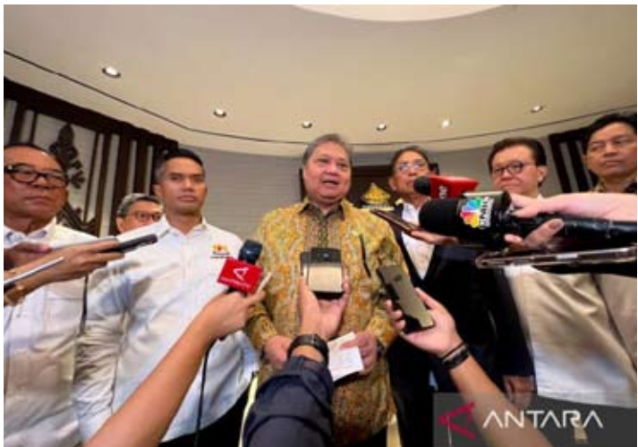
1月13日，经济统筹部长艾尔朗加·哈尔塔托（中）与印尼工商会总主席阿宁迪亚·巴克里（左二）在雅加达出席“通往雅加达粮食安全峰会”期间举行新闻发布会。

【本 报 讯】经 济 统 筹 部 长 艾 尔 朗 加 · 哈 尔 塔 托 表 示，根 据 总 统 普 拉 博 沃 · 苏 比 延 多 的 明 确 指 示，政 府 今 年 将 继 续 实 施 B40 生 物 柴 油 强 制 掺 混 政 策，B50 方 案 目 前 仍 处 于 系 统 评 估 和 技 术 研 究 阶 段。 艾 尔 朗 加 1 月 13 日 在 雅 加 达 出 席“通 往 雅 加 达 粮 食 安 全 峰 会”（JFSS）相 关 活 动 后 向 媒 体 表 示，B40 政 策 将 在 今 年 按 既 定 安 排 稳 定 推 进；至 于 B50，其 实 施 需 在 充 分 评 估 燃 料 油、成 品 油 以 及 国 内 和 国 际 棕 榈 油 价 格 差 异 的 基 础 上，开 展 持 续、动 态 的 综 合 研 究。 他 指 出，政 府 并 未 取 消 B50 政 策 选 项。目 前，相 关 技 术 论 证 和 汽 车 产 业 领 域 的 测 试 工 作 仍 在 推 进，同 时 密 切 跟 踪 价 格 走 势，并 评 估 从 上 游 原 料 供 应 到 下 游 产 业 应