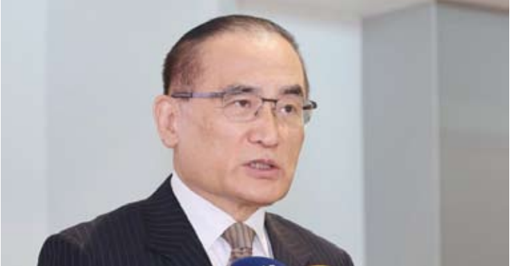
韩国国家安保室室长魏圣洛（资料图）