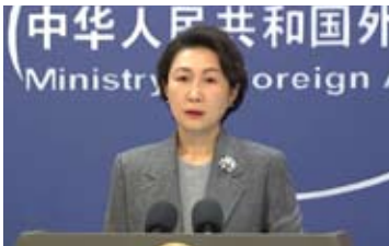
外交部发言人毛宁

国家的稳定。同时我们反对外部势力干涉一个国家的内政，不赞成在国际关系中使用或者是威胁使用武力，希望各方都能多做有利于中东和平稳定的事情。