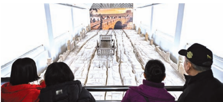
1月14日，明代太原府城护城河桥——镇远桥遗址馆正式开馆。

太原市文物保护研究院文物考古研究所所长裴静蓉介绍，镇远桥的发现与研究，不仅为探讨明代太原城的布局、北方桥梁建造工艺提供了实物资料，其桥面车辙更是晋商文化传播路径的直接物证。遗址馆在科学保护原址的基础上进行展示阐释，使民众能直观感受太原深厚的历史文化层积。