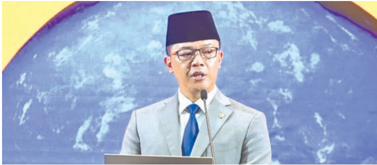
外交部长苏吉奥诺于2026年1月14日在雅加达发表年度外交部长声明。