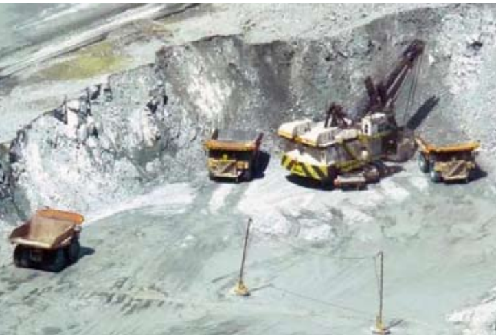
Bumi Resources Minerals (BRMS)公司金矿区。

【本报讯】Bumi Resources Minerals (BRMS)公司对2026年充满信心。BRMS定下指标，2026