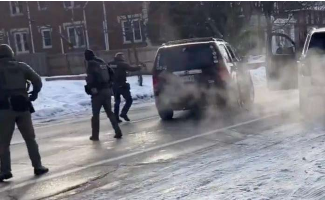
ICE探员射杀一名女子。

直有声音宣称，宪法第二修正案赋予民众持有武器的权利，是为了反抗暴政，但在美国政治领域的纷争中，很少真的有人选择用枪解决问题。美国历史上的大规模群众运动很多，但鲜见有人用枪袭击联邦武装人员，来宣泄政治诉求。