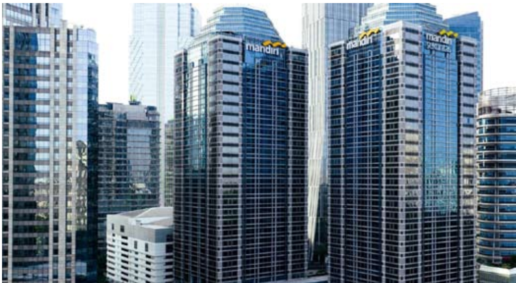
万自立银行位于雅加达苏迪曼将军路的总部大楼。

从银行单体（bank only）口径看，截至2025年11月底，万自立银行贷款投放规模达1,452万亿盾，增速高于行业平均水平，彰显了公司作为政府战略合作伙伴，在推动国家经济加速增长方面的坚定承诺。