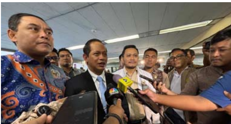
环境部长兼环境控制局局长哈尼夫（Hanif Faisol Nurofiq）回答记者提问。

【本报讯】环境部长哈尼夫·费索尔·努罗菲克（Hanif Faisol Nurofiq）表示，将对14个省份的采矿活动进行评估，以确保其遵守环境规定。 周三（1月14日）在雅加达与全国县级地方议会举行的会议上，环境部长兼环境控制局局长哈尼夫向各县级地方议会主席传达了监督对环境造成影响采矿活动的必要性。 哈尼夫说，“镍矿和煤矿都需要进行审查，这些活动造成的破坏也不小。我们已开始行动，今年的目标是完成对14个主要省