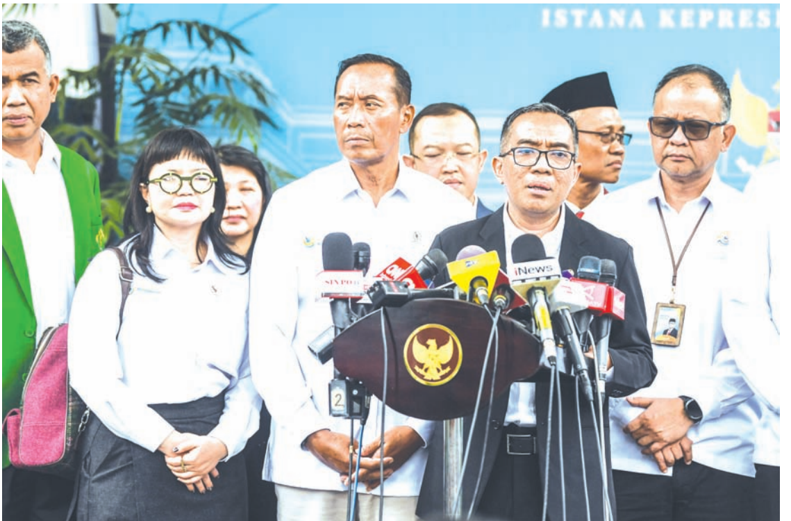
2026年1月15日，高等教育与科技部长布莱恩·尤利亚托（右二）与副部长蒋黛兰（左二）在雅加达独立宫出席“2026年印尼总统与国立及私立高校校长领导层简报会”后举行新闻发布会。

高等教育与科技部副部长蒋黛兰在活动前表示：“今天这场会议专门面向人文社科领域。如果说之前的会议较为综合，且可能更侧重STEM领域，那么今天的会议是专为人文社科领域举办的。学界同仁若曾担忧人文社科领