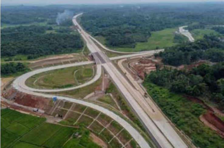
史冷(Serang)至Panimbang收费高速公路二期工程施工进度。

程将在2026年开斋节返乡期间功能性通车，但其全面运营仍需完成所有技术和行政方面的工作，定下指标，2026年10月全面性通车。 除此之外，WIKA认为二期工程的开通将对交通流量产生显著影响，尤其是在返乡期间。 根据WIKA记录显示，在2025年开斋节期间，其管理的收费高速公路路段日均车流量约为12,000辆。 在资金方面，史冷—Panimbang收费高速公路项目投资额达8.58万亿盾，融资结构包括股权和贷款。 Ngatemin总结说，在