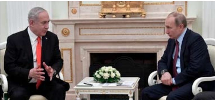
（资料图）2020年1月30日，以色列总理内塔尼亚胡（左）在莫斯科克里姆林宫与俄罗斯总统普京会谈时做出手势。（Maxim Shemetov/Pool Photo via AP，资料图）

俄方关于采取政治外交步骤以稳定中东局势的基本原则等，并表示，俄罗斯愿继续斡旋并推动相关国家开展建设性对话。两国领导人商定继续在不同层面保持接触。