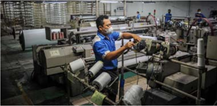
1月15日，在雅加达，投资与下游产业部长、投资统筹机构（BKPM）主任兼达南塔拉首席执行官罗山·鲁斯拉尼在发布2025年全年投资实现情况的新闻发布会后接受媒体采访。

【本报讯】达南塔拉（Daya Anagata Nusantara）首席执行官罗山·鲁斯拉尼表示，达南塔拉目前正对在纺织领域设立国有企业（BUMN）的相关方案进行评估，尚未作出最终决定。罗山于1月16日在雅加达指出，达南塔拉在推进各项投资时，均需开展系统性的可行性和综合评估，并依据多项标准加以审慎衡量，其中包括投资项目对扩大就业的实际贡献。他表示，基于上述原则，达南塔拉对回报率相对较低、但具备较强就业吸纳能力的投资项目持开放态度。罗山认为，纺织行业具有较高的就业吸纳能力和进一步发展的潜力，尤其