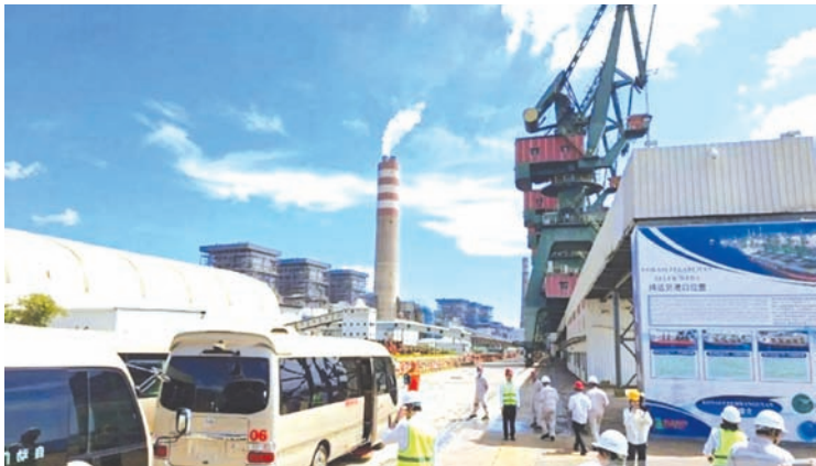
1月15日，北马鲁古省中哈马黑拉县韦达湾工业园内，员工正在进行日常活动。

这一成就表明，过去五年工业区领域持续增长，反映出加工制造业领域新增投资和业务拓展的高度