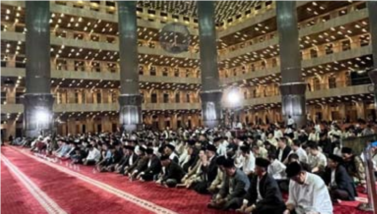
雅加达伊斯蒂克拉尔清真寺于1月15日晚举行的国家性先知穆罕默德登霄节纪念活动场景。

通过此次宣言，Gema Bangsa党宣布已准备好为印尼建设民主，以及为国家 and 民族贡献力量。（pl）