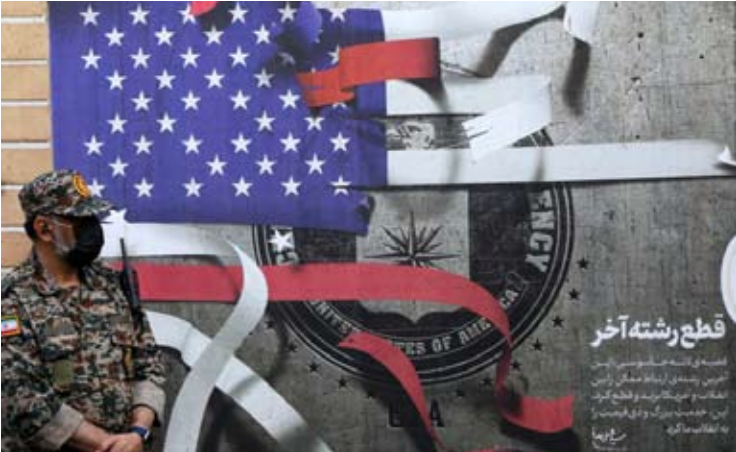
2025年11月4日，在伊朗首都德黑兰举行的集会上，安全人员站在反美宣传画前。当天，伊朗多地民众举行集会，谴责美国霸权和以色列的侵略行为。