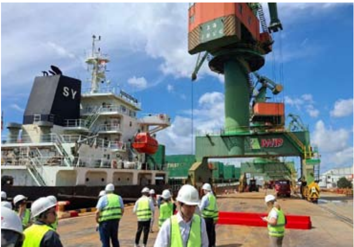
1月15日，北马鲁古省中哈马黑拉县韦达湾工业园码头区域作业场景。

治理和运营标准，推动环境、社会和治理（ESG）理念在镍产业园区管理中的全面融入。印尼韦达湾工业园（IWIP）总裁何凯文（译音）在北马鲁古省中哈马黑拉县园区现场表示，示范项目的落地，为进一步深化工业园区可持续发展实践、对标国际标准提供了重要契机。何凯文表示，IWIP将