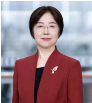
1月16日，邹加怡正式就任亚投行行长兼董事会主席。

【中新网1月16日电】据亚洲基础设施投资银行微信公众号消息，1月16日，邹加怡正式就任亚洲基础设施投资银行（亚投行）行长兼董事会主席，带领机构迈入第二个十年发展新阶段。