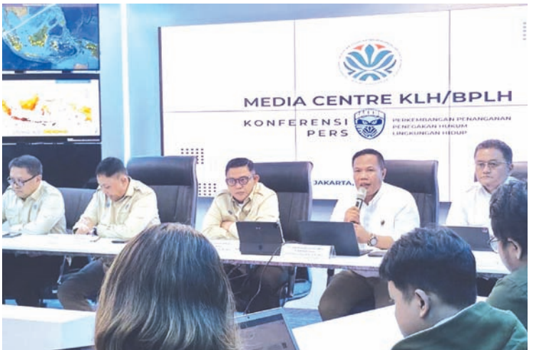
2026年1月15日，印尼环境部法律执法副局长里扎尔·伊拉万（中）出席在雅加达举行的新闻发布会。

业需承担绝对赔偿责任，因其行为已造成生态系统破坏，并对环境及社区产生直接影响。专家团队实地调查发现加罗加河与巴唐托鲁河流域周边存在环境破坏迹象，其中关键证据是该区域2516公顷的土地开垦行为。