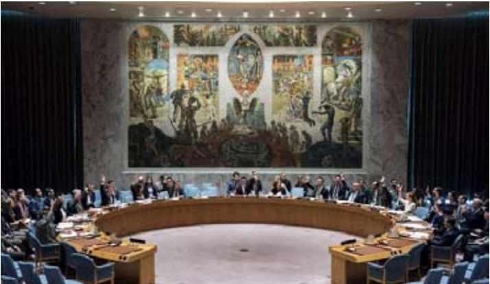
联合国安理会就伊朗局势召开紧急会议。

寻求升级或对抗，但是对任何直接或间接的侵略行为，将予以果断、合法回击，由此引起的后果将完全由发起非法行动者承担。