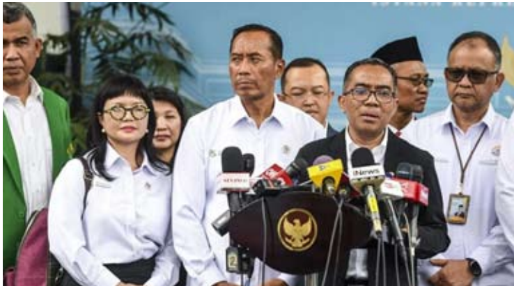
高等教育、科学及技术部部长布莱恩·尤利阿托（右二）与副部长斯特拉·克里斯蒂（左二）本月15日在雅加达总统府与普拉博沃总统参加2026年国立及私立高等院校校长领导层汇报会后，共同向媒体发布新闻声明。

布莱恩表示，根据普拉博沃总统的指示，国家科研工作将不再各自为政，而是致力于成为连接学术发展与国内产业实际需求的桥梁，并以达南塔拉公司作为核心驱动力。