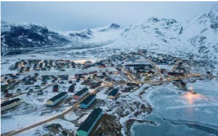
这是2025年3月21日拍摄的丹麦自治领地格陵兰岛纳尔萨克镇（无人机照片）。

一些欧洲人认为，欧洲承受不起与美国武装冲突导致北约瓦解的代价。然而历史和现实都证明，