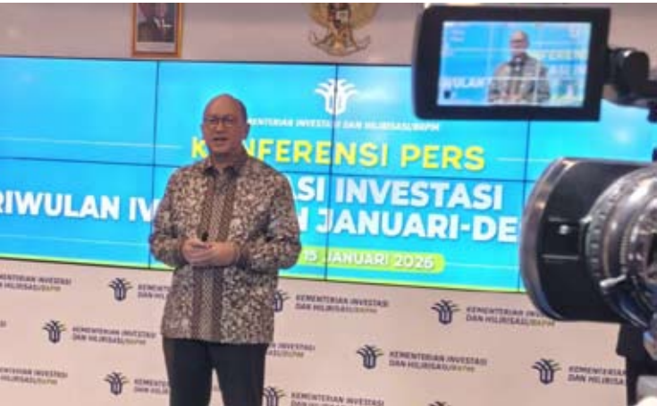
1月15日，在雅加达，投资与下游产业部长、投资统筹机构（BKPM）主任罗山·鲁斯拉尼出席2025年全年投资实现情况新闻发布会。

【本报讯】投资与下游产业部长罗山·鲁斯拉尼15日表示，2025年全国投资实现额达1931.2万亿盾，完成年度目标的101.3%，高于既定目标1905.6万亿盾。相关投资共吸纳就业271万人。罗山指出，2025年投资实现额同比增长12.7%。在全球经济不确定性上升的背景下，这一成绩表明印尼投资者信心保持稳定，国内投资环境展现出较强韧性。从投资来源看，2025年1月至12月，国内投资（PMDN）实现1030.3万亿盾，同比增长26.6%。同期，外国直接投资（PMA）达900.9万亿盾，显示外资对印尼经济发展的支撑作用依然稳固。从区域分布看，爪哇岛以外地区投资占比达51.3%，高于爪哇岛的48.7%。相关结构变化与政府推动区域协调发展、促进经济增长成果更均衡分布的政策方向相一致。从行业结构看，基础金属及金属制品、非机械类设备制造业成为2025年投资规模最大的领域，投资额达262万亿盾。交