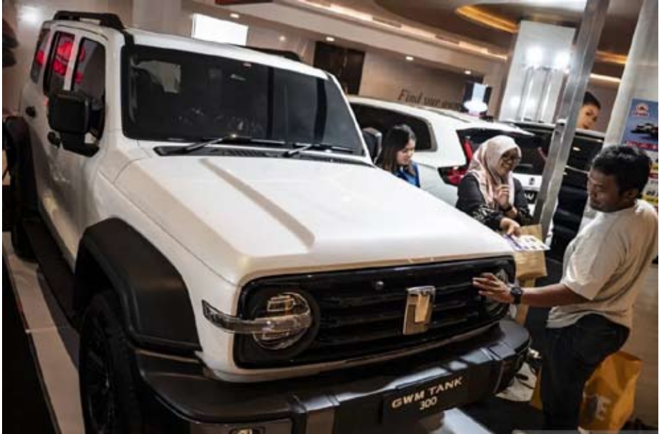
资料图片——2026年1月15日，中爪省三宝壟DP商场汽车展览期间，参观者观看展示中的电动汽车。

与之相对，内燃机汽车销量整体呈下降趋势。2025年，印尼内燃机汽车销量为628,543辆，占全年汽车批发销量803,687辆的78.2%。该比例较2024年明显下降，当年内燃机汽车销量为762,495辆，占比88.1%。