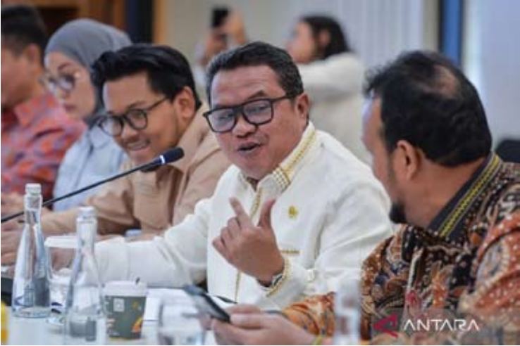
国会第七委员会副主席Lamhot Sinaga（右二）。

周五（16/1），他在雅加达发表声明表示，“停止进口柴油是一项重要政策，既是印尼能源自主的关键时刻，也是推动基于清洁能源的绿色工业发展的加速器。国会第七委员会一致认为，这不仅关乎能源问题，更关乎国家工业的未来发展，”