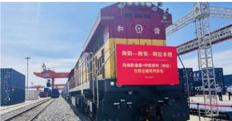
中国与中亚国家货物贸易规模再创新高，进出口总值历史上首次突破1000亿美元大关，连续5年保持正增长。

口712亿美元，同比增长11%，机电和高新技术产品增长强劲，“新三样”产品市场份额稳步扩大；自中亚进口351亿美元，同比增长14%，化工、钢材、农产品等非资源类产