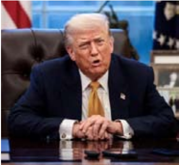
消息称，美国总统特朗普将担任加沙和平委员会首任主席，每个成员国的任期不超过三年，而想要永久续任的国家须贡献10亿美元。