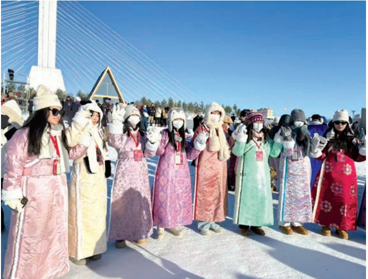
2025年12月21日，内蒙古呼伦贝尔，身着艳丽蒙古袍的香港青少年在冰雪那达慕会场合影。

【中新社呼和浩特1月17日电】17日，来自粤港澳大湾区的20余名旅行商和自媒体达人，在内蒙古