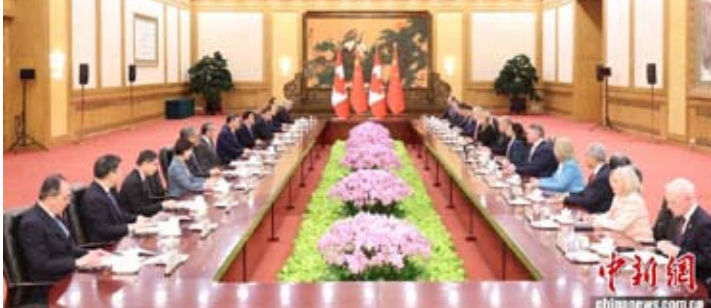
1月16日，中国国家主席习近平在北京会见来华进行正式访问的加拿大总理卡尼。

经贸议题上取得进展。加方将给予中国电动汽车每年4.9万辆配额，配额内适用最惠国关税；中方表示将依法调整加方关注的油菜籽反倾销措施及部分农产品限制。