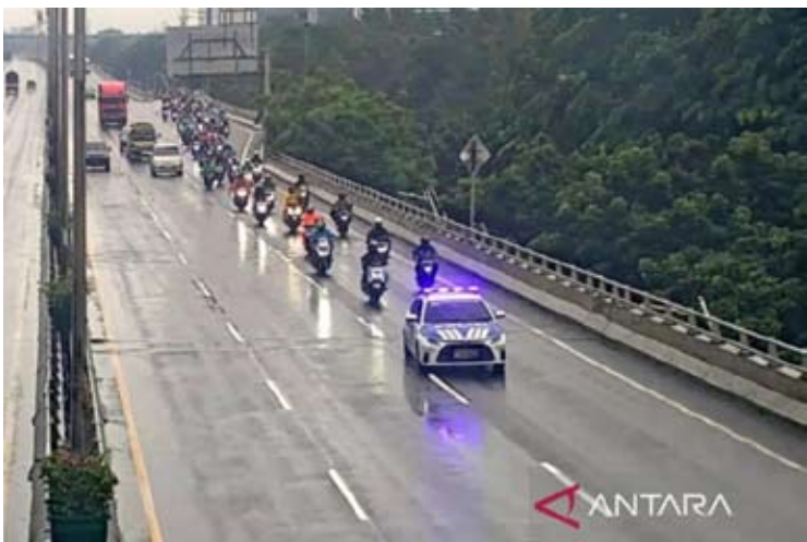
雅加达大都会警察局交通局机动部队对两轮车行驶在Ir. Wiyoto Wiyono高速公路上进行了护送，路线是从Pulo Mas收费站往Tanjung Priok方向。