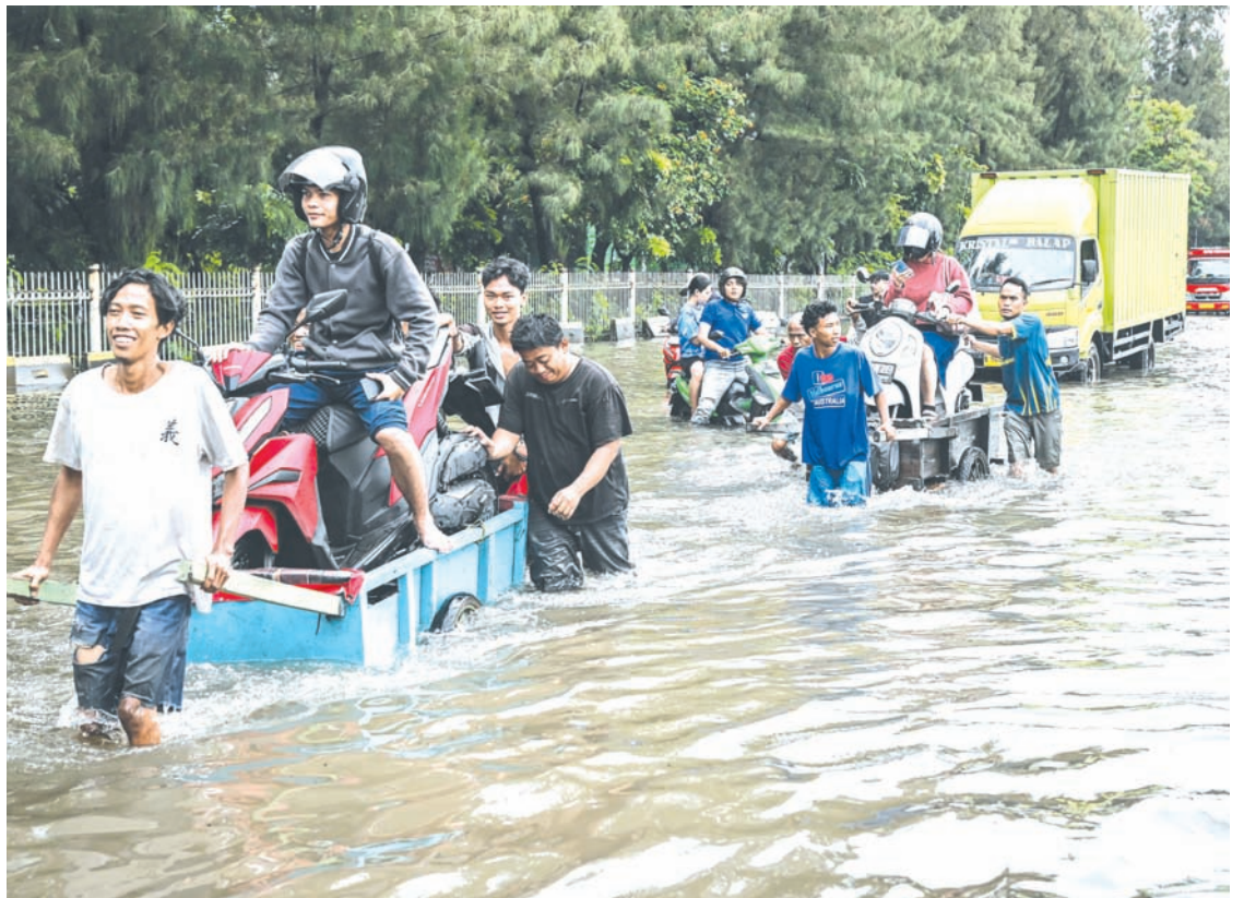
2026年1月18日，北雅加达本嘉令安区的三脚桥路段，一名摩托车骑手借助手推车趟过积水。雅加达灾害管理局记录显示，自周六（1月17日）傍晚强降雨以来，全市已有34个邻组和19条道路遭遇淹水。

排水系统未能跟上城市发展步伐，使情况进一步恶化。许多密集区域，尤其是贫民区，在缺乏完善水利基础设施的情况下不断扩张。一旦降雨，径流便直接淹没道路和居民区。基础设施的局限性与环境退化使雅加达处于脆