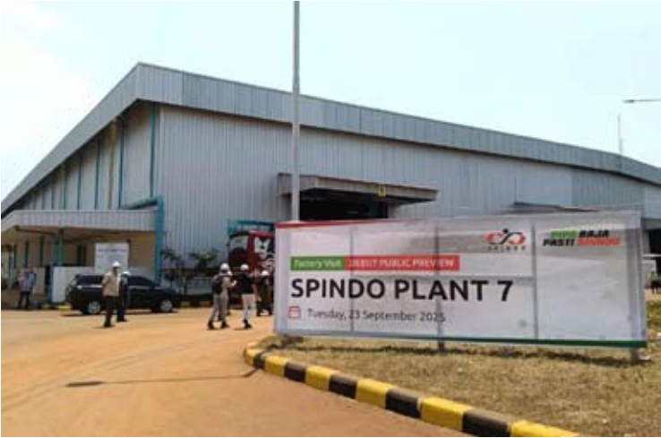
Spindo (ISSP) 扩建项目，在锦石 (Gresik) 建设第七家工厂。