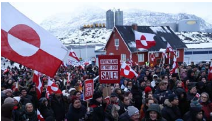
格陵兰岛首府努克近三分之一的居民，周六冒着严寒上街抗议，反对美国总统特朗普购买格陵兰岛的计划。

格陵兰岛是世界第一大岛，系丹麦自治领地，拥有高度自治权，其国防和外交事务由丹麦政府负责。目前，美国在格陵兰岛设有一处军事基地。特朗普自2025年上任以来多次声称美国“必须得到格陵兰岛”，并表示不排除动用武力的可能性。对此，丹麦及多国欧洲国家予以激烈反对。美国和丹麦高级官员14日在白