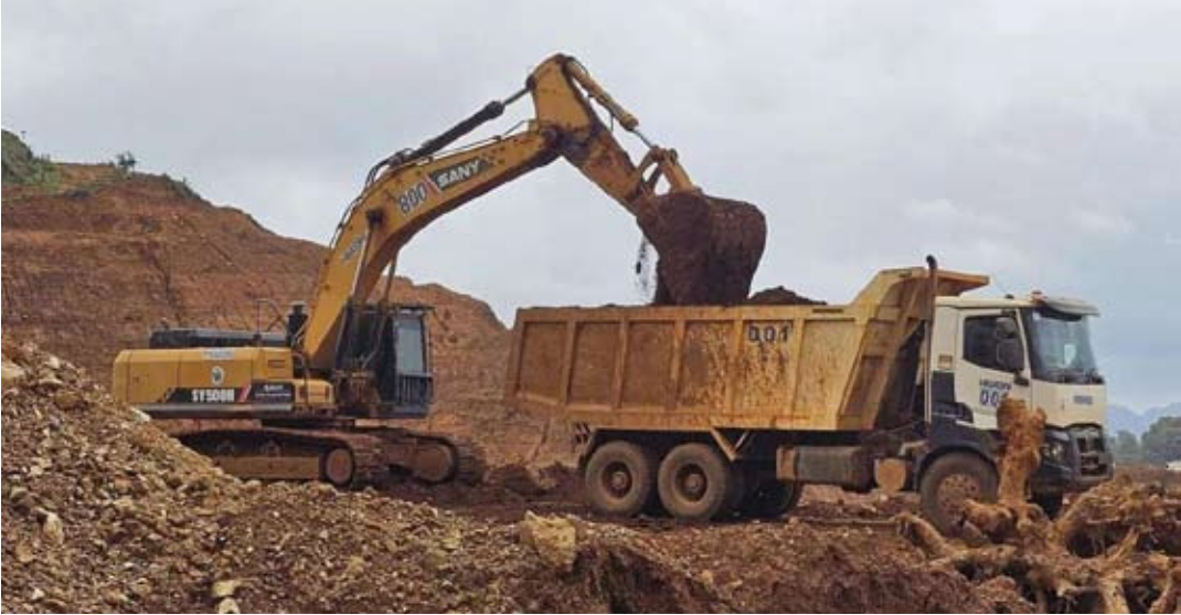
因2026年镍产量上限为2.6亿吨，重型机械停止活动。