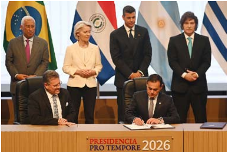
当地时间2026年1月17日，欧盟与南方共同市场（南共市）在巴拉圭签署自由贸易协定，冯德莱恩等人出席。

【新华社里约热内卢1月17日电】在历经逾25年谈判后，南方共同市场（南共市）与欧盟17日在巴拉圭首都亚松森正式签署自由贸易协定。此举被视为双方在全球地缘政治紧张、贸易保护主义抬头背景下，推动开放合作、迈向建设世界最大自贸区之一的重要一步。