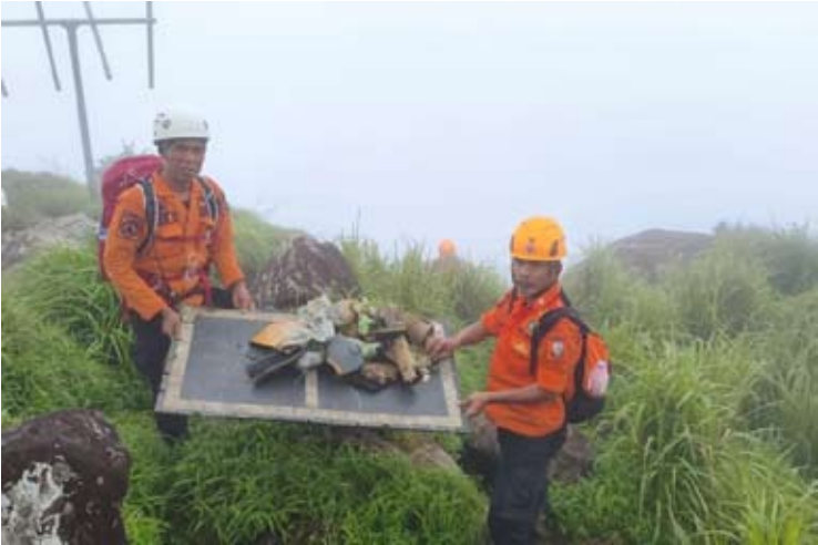
联合搜救队于1月18日在南苏拉威西省的布卢萨朗山找到ATR42-500飞机残骸。

法德利透露，在印尼中部时间07:46，联合小组在坐标南纬04°55'48"、东经119°44'52"处发现了