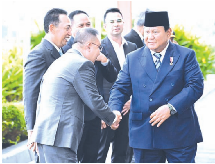
普拉博沃总统（右）在雅加达哈林·珀达纳库苏马空军基地登机前与国会副议长苏夫米·达斯科·艾哈迈德握手。

往伦敦时，多位国家官员统吉布兰·拉卡布明·拉前往送行，其中包括副总统卡及其妻子塞尔维·阿南