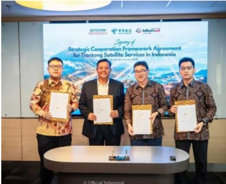
印尼电信卫星公司与中国电信股份有限公司卫星通信分公司、中国电信印尼公司及印尼天合卫星公司共同签署了四方战略合作文件。

【本报讯】印尼电信卫星公司（Telkomsat）与中国电信股份有限公司卫星通信分公司（简称中国电信卫星公司）、中国电信印尼公司（CTID）以及印尼天合卫星公司（Skyconn）共同签署了四方战略合作文件，旨在加强印尼卫星通信服务的开发与实施。