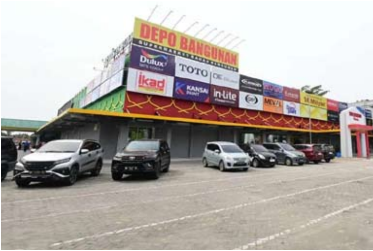
Caturkarda Depo Bangunan (DEPO) 公司零售店。

【本报讯】Caturkarda Depo Bangunan (DEPO) 公司对2026年首季度的业绩充满信心，因斋月和开斋节的到来通常会显著提振建材零售业。