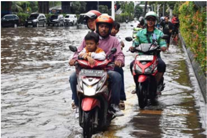
周日（1月18日），雅加达Cempaka Putih镇Ahmad Yani路被洪水淹没，摩托车骑手在人行道上行驶。