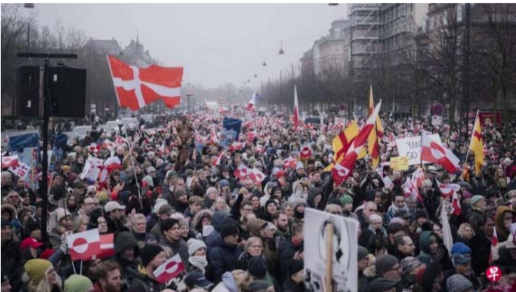
1月17日，在丹麦全国各地，成千上万民众走上街头，抗议特朗普企图吞并格陵兰岛的野心。

【中新网1月19日电】据路透社报道，美国总统特朗普当地时间18日表示，丹麦未能采取任何措施消除格陵兰岛的“俄罗斯威胁”，并称“现在是时候了，这件事一定会办成”。报道称，特朗普在社交媒体上写道：“北约20年来不断告诫丹麦，必须消除俄罗斯对格陵兰岛的威胁。可惜丹麦一直无所作为。现在是时候行动了，这件事将要完成！”特朗普一再坚持要获得丹麦自治领土格陵兰岛。丹麦和格陵兰岛的领导人