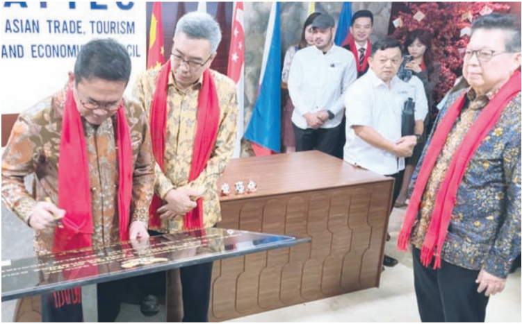
我国贸易部长布迪·桑托索在石碑上签名。