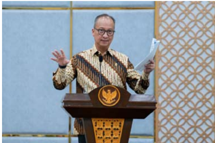
工业部长阿古斯·古米旺·卡塔萨斯米塔

从需求结构看，2026年印尼制造业增长仍主要依托国内市场支撑，占比约80%；出口市场贡献约20%。工业部将通过推进进口替代政策、提升本地化率（TKDN），以及优化政府和国有企业采购机制，进一步释放国内市场