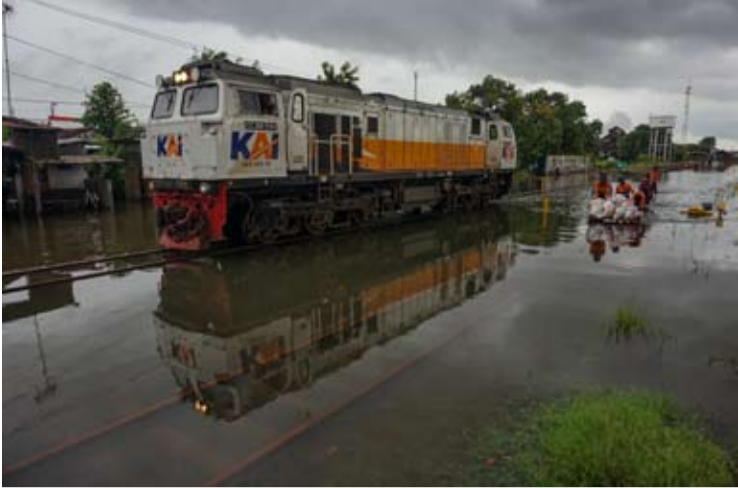
周六(1月17日)，一辆机车在中爪哇省北加浪岸车站附近紧急通行，检查被洪水淹没的铁轨情况。

【本报讯】印尼铁路公司 (PT Kereta Api Indonesia, 简称KAI) 记录，由于三宝垄第四区域运营局(Daop 4) 北加浪岸(Pekalongan)市洪水导致运营中断，火车票退款金额已达到35亿盾。