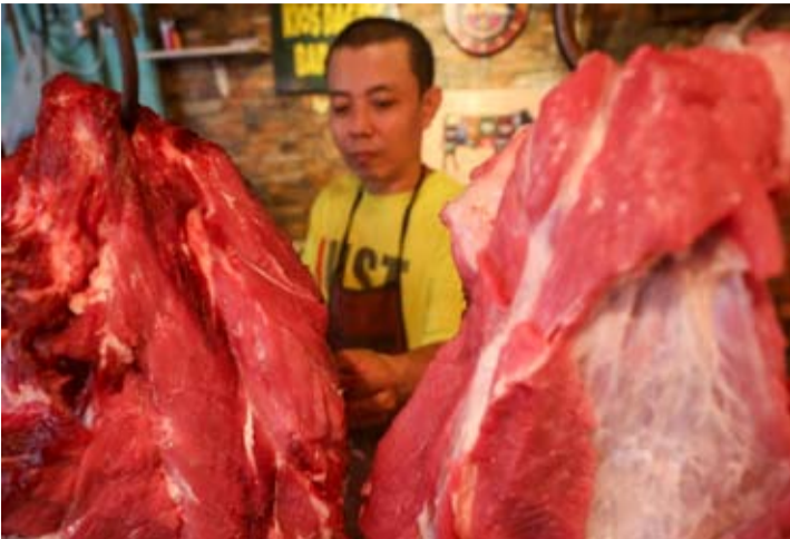
在雅加达的一个市场，商贩正在切割牛肉。