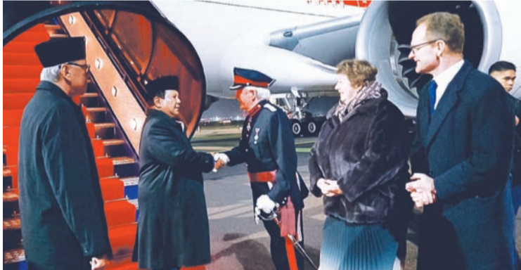
我国总统普拉博沃·苏比安托于2026年1月18日抵达英国伦敦斯坦斯特德机场一瞥。

在英国访问期间，我国总统普拉博沃计划与英国首相基尔·斯塔默（Keir Starmer）举行会晤。此次会晤预计将在英国首相府举行，将成为加强两国在多个战略领域对话与合作的重要契机。