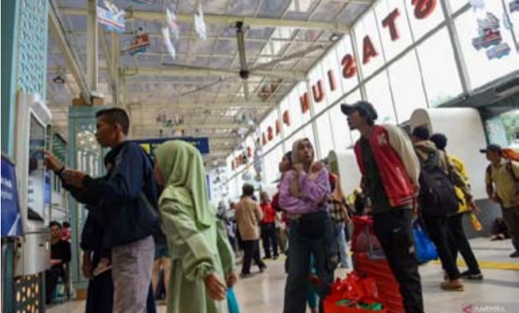
图为去年4月3日（周四），乘客在雅加达Pasar Senen车站打印火车票的情景。

他认为，如果民众在圣诞节和新年期间（Nataru）因年底极端天气或准备下学期学费而倾向于克制消费，那么2026年开斋节的出行活动将受到节日津贴发放和更