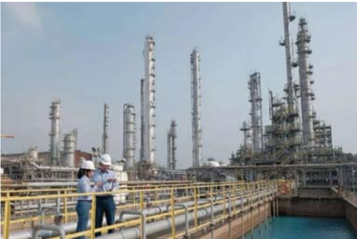
Chandra Asri Pacific (TPIA) 公司水处理设施。