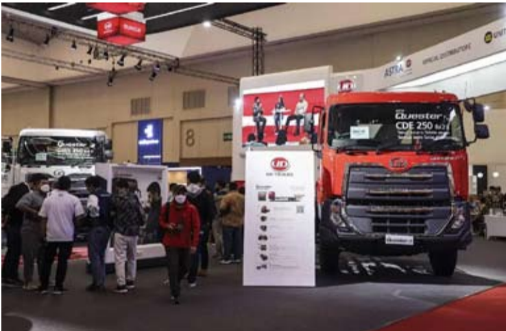
Astra UD Trucks。

【本报讯】UD Trucks Astra Motor Indonesia公司定下指标，2026年实现约5%的销量增长，力求在经济挑战和商用车市场动态变化中保持增长势头。