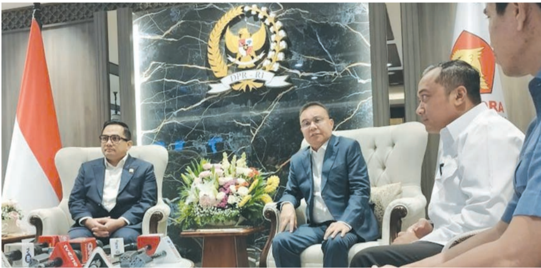
2026年1月19日，印尼国会副议长达斯科与国务秘书普拉塞蒂奥在雅加达议会大厦会晤。

除上述两项议题外，阿迪表示地方选举讨论常与立法成员开放比例制或封闭比例制选举体系的辩论同步进行。开放比例制允许选民直接投票给候