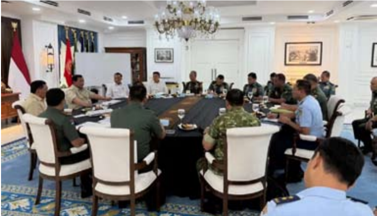
2026年1月16日，印尼总统普拉博沃在雅加达独立宫，与印尼国军主要官员举行例行会晤。与会者包括国军总司令及副司令、陆军参谋长、海军参谋长和空军参谋长。

政府和印尼央行必须密切关注并共同考虑这一情况，以确保国民经济健康发展，以及国际信任得以恢复。