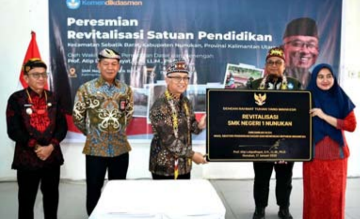
中小学教育部在北加里曼丹省努努坎县塞巴蒂克岛，为偏远、边境、边远地区（3T）的八所振兴教育机构项目的学校举行落成仪式。

【本报讯】中小学教育部在偏远、前沿、边境地区（3T地区）启用了八所振兴教育机构项目的学校，这些学校位于北加里曼丹省努努坎县的塞巴蒂克岛。