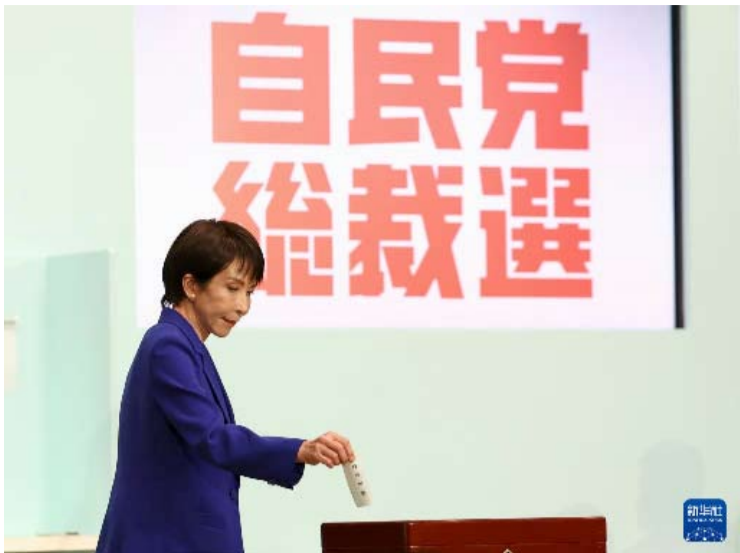
2025年10月4日，高市早苗在日本东京自民党总部进行的自民党总裁选举中投票。

【中新网1月19日电】据日本广播协会(NHK)报道，当地时间19日傍晚，日本首相高市早苗宣布将在1月23日解散众议院。随后她公布了众议院选举日程：选举信息将在1月27日公示，投票和开票定于2月8日举行。这场大选将改选国会众议院全部465个席位，也是高市自去年10月出任日本首位女首相以来的首次选举考验。综合路透社和法新社报道，高市星期一（19日）在记者会上说，她将于本周五解散国会并举行全国大选，以争取选民对扩大财政支出及新安全战略的支持，相关政策预计将加快日本的防务建设。