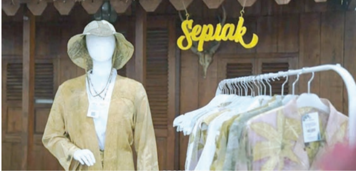
PT Timah公司在全国家级展会推广辅导中小微企业的产品。

“受助企业将这些资金用于提升生产能力、拓展业务范围以及扩大市场营销网络，”他表示。