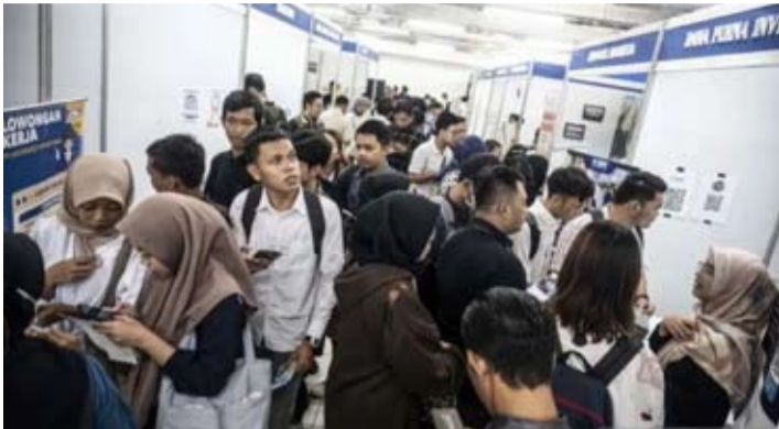
2024年5月28日，在雅加达谭林城举行的招聘会上，众多求职者正在寻找职位空缺信息。

题在于教育体系与预算限制之间的不协调。我们的教育尚未完全与就业市场接轨，同时财政空间还需分配给包括免费营养餐（MBG）在内的众多优先项目。”此外，养老金和社会保障体系仍不健全，尤其对数量庞大的非正式就业者而言。这导致经济受冲击时，社会韧性不足且消费易下滑。