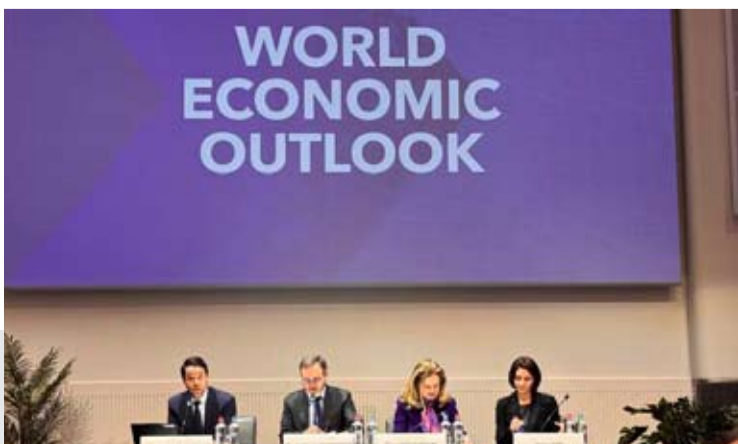
国际货币基金组织(IMF)19日发布《世界经济展望报告》更新内容，将2025年中国经济增长率上调0.2个百分点至5%，同时上调2026年中国经济增长预期。（总台记者 顾鑫）

2026年中国经济增长预期。在全球层面，IMF预计2026年世界经济将增长3.3%，较去年10月预测值上调0.2个百分点；2027年全球经济增速为3.2%，与此前预测持平。