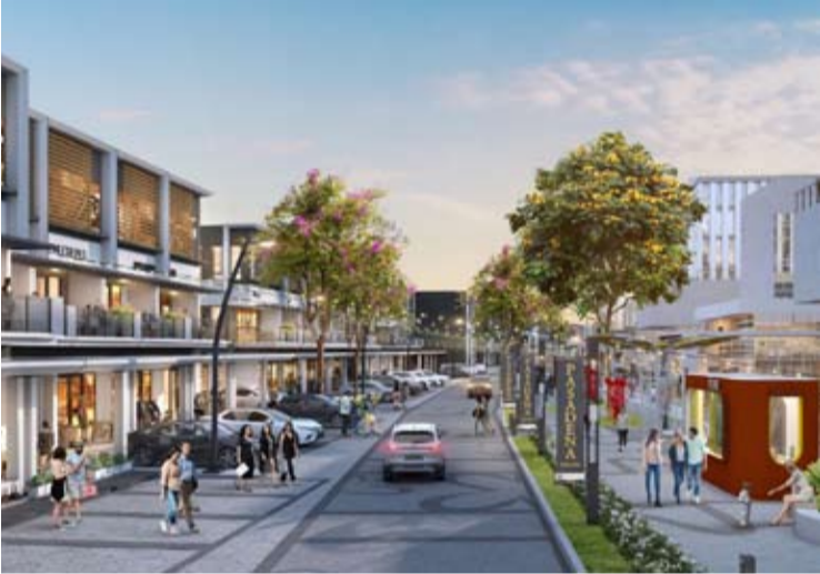
在丹格朗Gading Serpong的Pasadena Square商业区一角的草图。

【本报讯】房地产开发商对2026年房地产领域财政刺激政策的延长表示欢迎，以推出销售计划。其中是Paramount Land为住宅和商业产品推出免增值税促销活动。