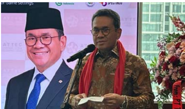
1月19日，贸易部长布迪·桑托索在雅加达出席亚洲贸易、旅游与经济理事会 (ATTEC) 总部揭牌仪式。

布迪哈佐强调，上述举措是吸引亚洲投资持续进入印尼、并进一步提升印尼在区域产业链和供应链体系中参与度的重要组成部分。(er)