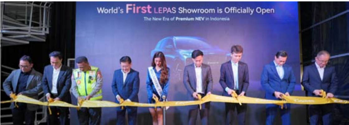
周一(1月19日)，在雅加达Kelapa Gading地区为LEPAS全球首家展示厅开业举行剪彩仪式。

【本 报 讯】奇瑞集团旗下汽车品牌 LEPAS，推出首家全球展示厅，并选择印尼，是在雅加达Kelapa Gading 地区，作为其所在地。此举受到新能源汽车细分市场日益增长势头的推动。