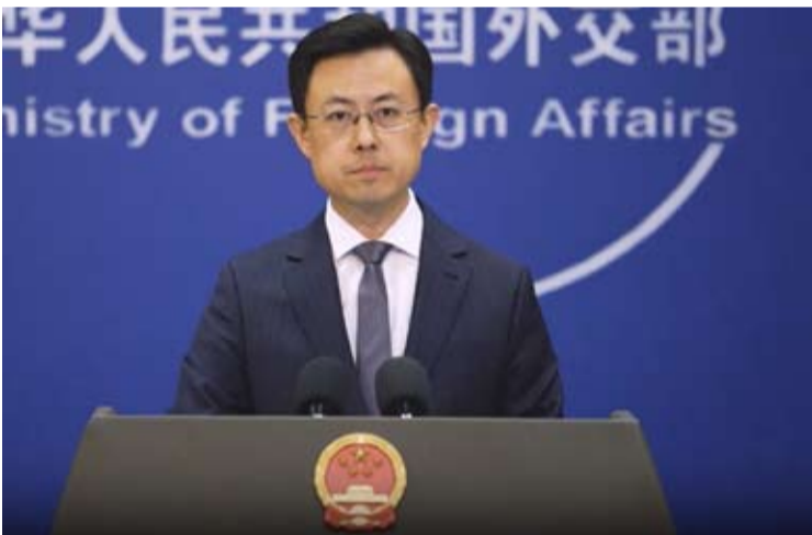
中国外交部发言人郭嘉昆20日在例行记者会上说，中方要求阿方尽快查清真相、惩治凶手。

【中新社北京1月20日电】当地时间1月19日，阿富汗首都喀布尔市一家中国餐馆门外发生爆炸事件，造成中国公民伤亡。据报道“伊斯兰国”已宣布对爆炸事件负责。中国外交部发言人郭嘉昆20日在例行记者会上说，中方要求阿方尽快查清真相、惩治凶手。