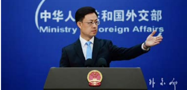
中国外交部发言人郭嘉昆

也符合国际社会的共同期待。一年来中美关系发展的历程再次表明，中美合则两利、斗则俱伤。中美应该在平等、尊重、互惠基础上，探索两个大国的正确相处之道。中方愿同美方一道推动中美关系稳定发展，同时坚定维护自身主权安全和发展利益。