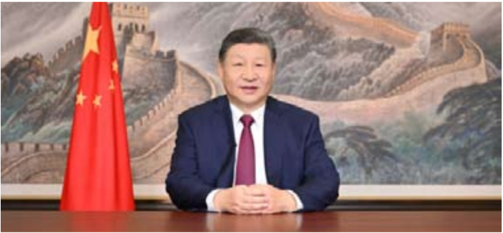
国家主席习近平就西班牙高速列车脱轨相撞事故向西班牙国王费利佩六世致慰问电。

【中新社北京1月20日电】1月20日，国家主席习近平就西班牙高速列车脱轨相撞事故向西班牙国王费利佩六世致慰问电。