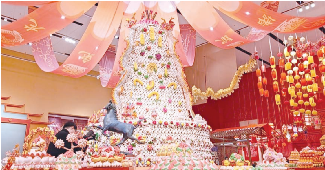
1月20日，中国非物质文化遗产馆的“过年——丙午春节系列主题展”开展。图为1月19日预展现场。中新社记者（应妮 摄）

【中新社北京1月20日电】（记者 应妮）大寒之际，中国非物质文化遗产馆的“过年——丙午春节系列主题展”现场却是一派热气腾腾的景象。20日