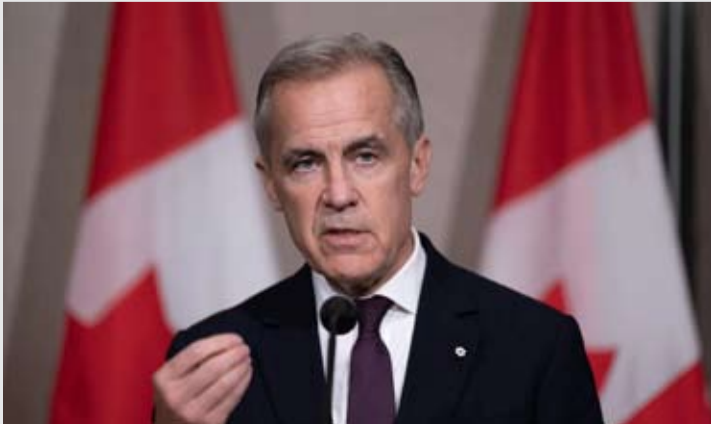
加拿大总理卡尼近日在记者会上表示，近年来世界已经发生了变化，并称近几个月加中关系的发展更具可预测性。

郭嘉昆：中加关系健康稳定发展符合两国共同利益，也有利于世界的和平稳定与发展繁荣。中方发展中加关系的立场是一贯的、明确的，愿同加方本着对历史、对人民、对世界负责任的态度，推进构建中加新型战略伙伴关系，推动中加关系迈入健康、稳定、可持续的发展轨道，更好地造福两国人民。