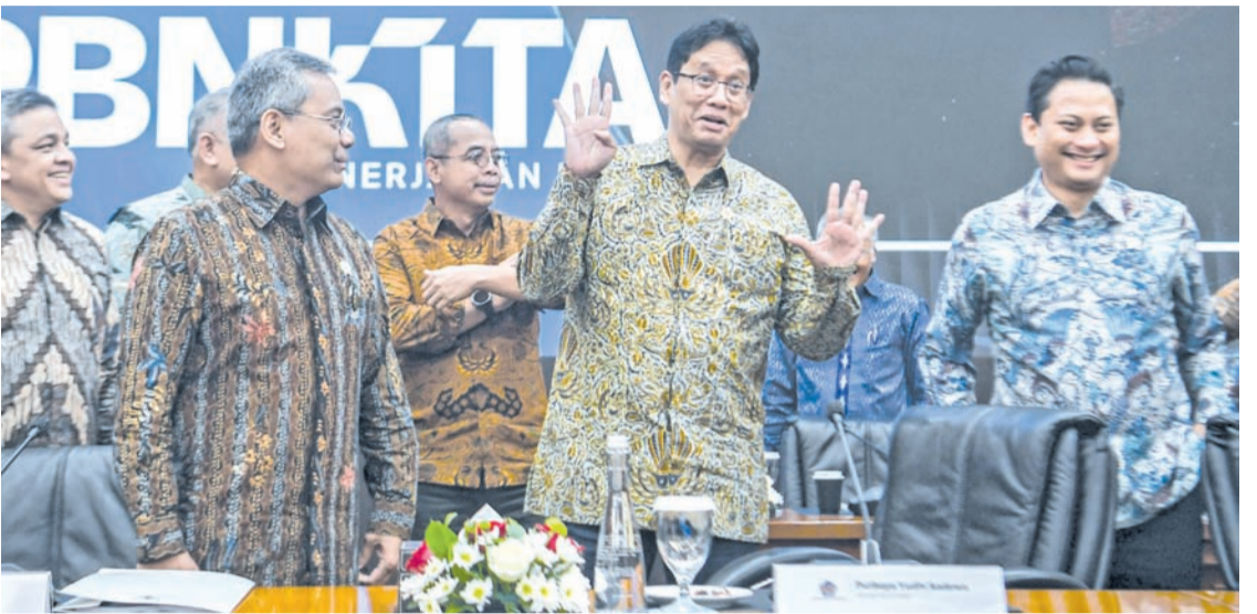
2026年1月8日，印尼财长普尔巴亚（中）与两位副财长苏哈希尔（左）及托马斯（右）出席在雅加达举行的2026年1月版《国家收支预算》新闻发布会。

忧。若托马斯最终当选，央行必须确保其独立性不受影响。同日，印尼盾汇率持续走弱，逼近1.7万盾兑1美元关口。