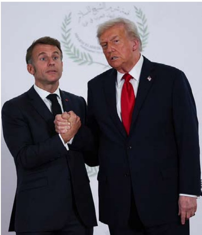
美国总统特朗普威胁要对法国葡萄酒征收200%关税，原因是法国拒绝加入“和平委员会”。左为法国总统马克龙。

一名接近马克龙的消息人士说：“以关税威胁来影响我们的外交政策，是不可接受且无效的。”