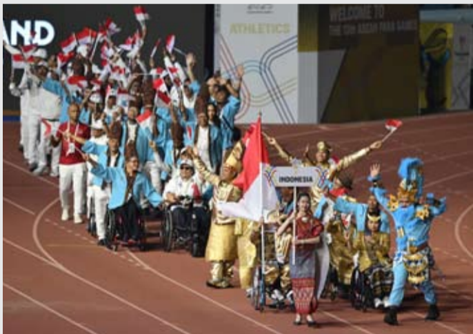
1月20日（星期二），印尼代表团包括运动员和官员在泰国呵叻府（Nakhon Ratchasima）体育场出席泰国东盟残疾人运动会开幕式的入场仪式。印尼派出209名运动员参加泰国东盟残疾人运动会18个项目的比赛。（pl）

因此，鉴于印尼国民经济依然强劲，近期盾币汇率的走弱应被视为暂时现象。我们希望印尼央行和政府能够实施适当的政策，以阻止汇率下跌并迅速恢复公众信心。