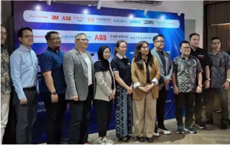
ElectGo Indonesia 管理层。

【本 报 讯】ElectGo Indonesia 公司正式推出工业电商平台 ElectGo.id，专注于工业产品和电子元件，拥有超过 15,000 种产品。