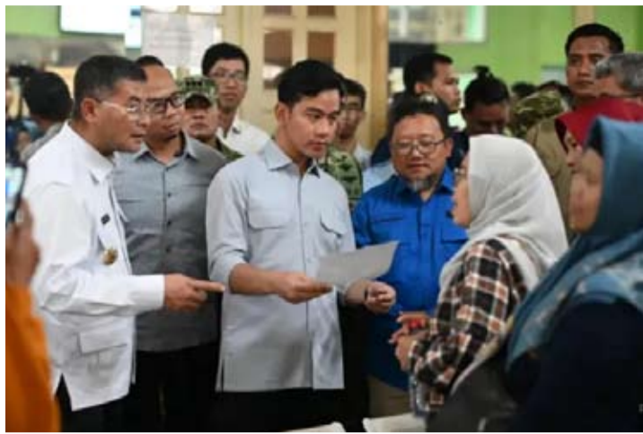
副总统吉布兰于周二（1月20日）视察苏卡佐国立综合医院（RSUD dr. Soekardjo）的医疗服务情况。