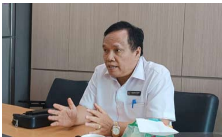
雅加达特区议会A委员成员马努阿拉·西亚哈于1月19日在雅加达发表声明的情景。