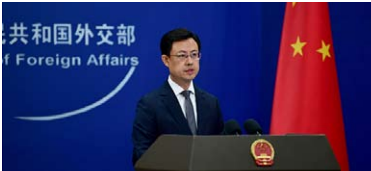
中国外交部发言人郭嘉昆20日主持例行记者会。