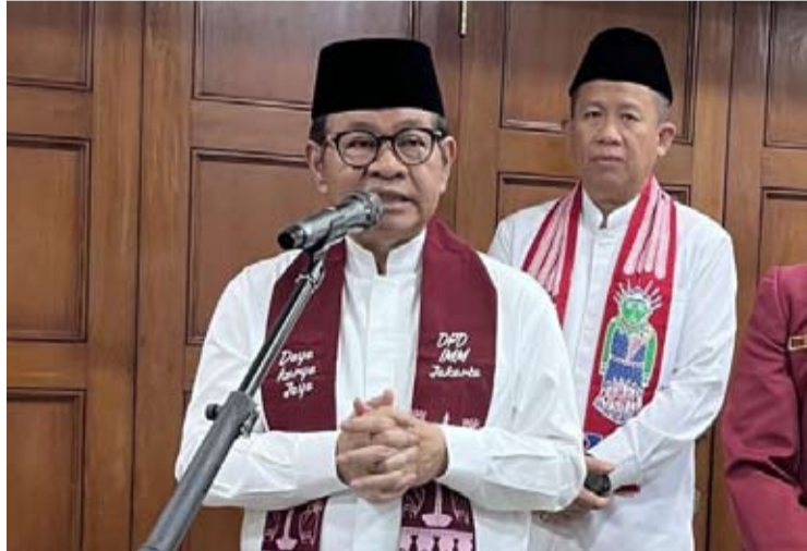
雅加达特区省长普拉莫诺·阿农。

处理，雅加达已经做得相当不错。更何况我们的设施，无论是与登革热相关的卫生服务站、社区卫生中心还是医院，都已经具备了完整的转诊体系，”他说道。