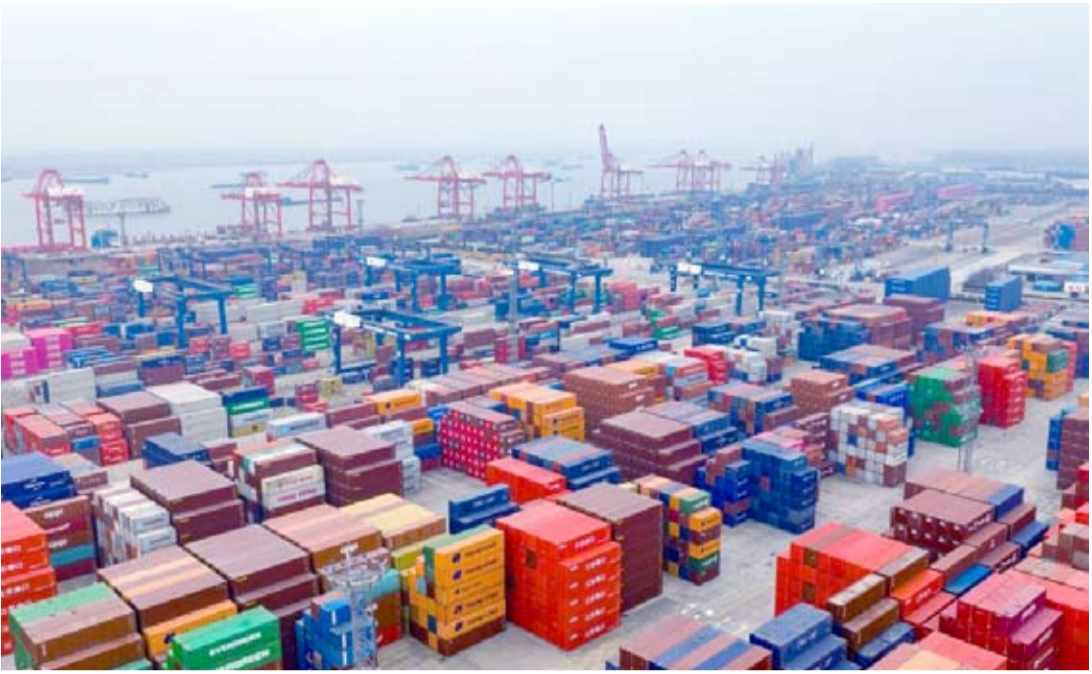
1月18日拍摄的江苏省港口集团南京港龙潭集装箱码头（无人机照片）。

140万亿元，是民生从“投资于物”到“投资于人”的温暖转型。发展的终极目标是人的全面发展。这份GDP成绩单里，藏着满满的民生温度。就业不仅要“饭碗稳”，更要“成色足”。城镇新增就业保持在每年1200万人以上，服务业、制造业升级催生了人工智能训练师、新能源维修师等新职业，技能培训、资格认证等政策让劳动者“长本事、涨工资”，真正实现“就业赋能人”。生鲜