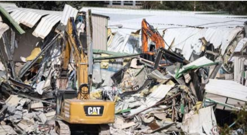
重型机械周二正被以色列占领的东耶路撒冷，拆除联合国近东救济工程处总部内的一栋建筑物。

近东救济工程处成立于1949年，主要负责生活在约旦河西岸、加沙地带以及约旦、叙利亚和黎巴嫩的巴勒斯坦注册难民提供人道主义救助、教育和医疗等服务。以色列议会2024年10月通过法案，禁止近东救济工程处在以境内开展活动，相关法案于2025年初正式生效。