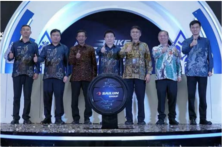
赛轮工厂于周日 (1月18日) 在中爪哇省淡目举行落成典礼。

赛轮的增长体现在全球销售额的显著提升，从 2008 年的 2.96 亿美元增长到 2022 年的约 30 亿美元。目前，赛轮拥有超过 1500 种轮胎产品变体，涵盖乘用车、商用车以及采矿、林业和农业等特殊