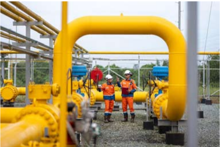
图为技术人员在天然气管道及调压站开展作业，现场配备完善的安全防护设施。

尤斯蒂努斯表示，HGBT落实不足可能对工业企业产能利用率形成压制，同时推高生产成