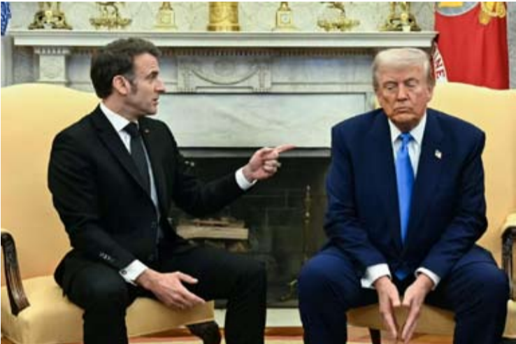
2025年，美国总统特朗普和马克龙在白宫。特朗普威胁要对法国葡萄酒征收关税，以迫使马克龙加入他的加沙和平委员会。