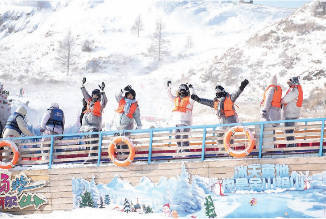
1月1日，游客在内蒙古阿尔山体验冰天雪地带来的乐趣。