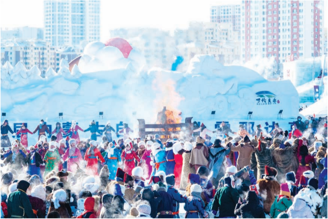
2025年12月21日，内蒙古呼伦贝尔，冰雪那达慕现场举行祭火仪式。