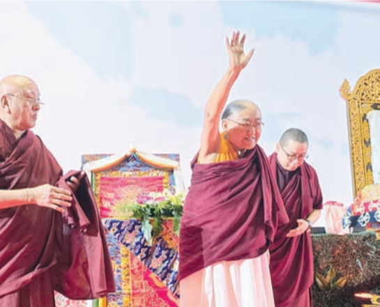
第41世萨迦法王——至尊法王恭玛·萨迦赤钦仁波切向信徒们挥手致意。