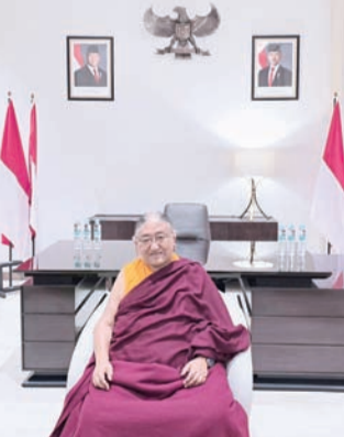
第41世萨迦法王——至尊法王恭玛·萨迦赤钦仁波切。