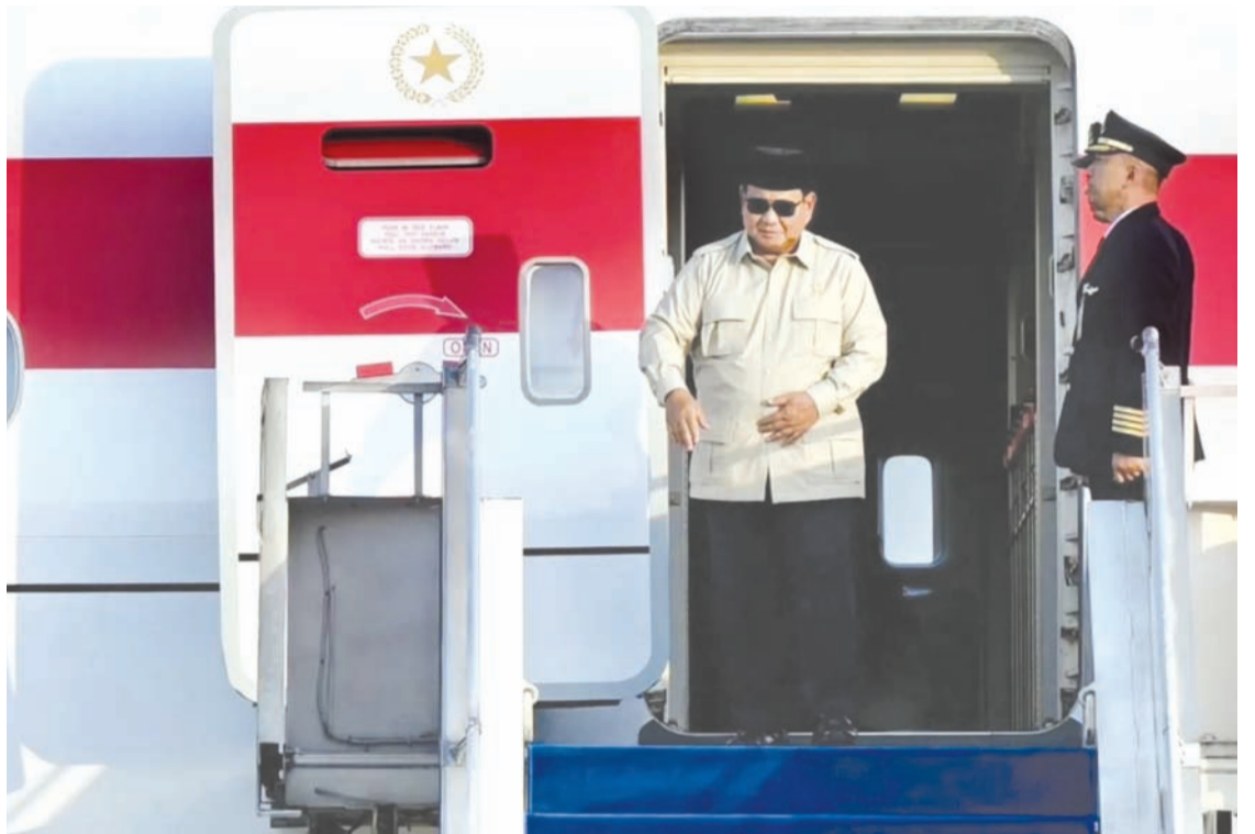
印尼总统普拉博沃圆满结束对英国、瑞士和法国三个友好国家的访问，于2026年1月24日傍晚返回雅加达。

用表示乐观。“希望这能成为一个改变格局的转折点，一个阻止世界走向恶化的关键时刻。”