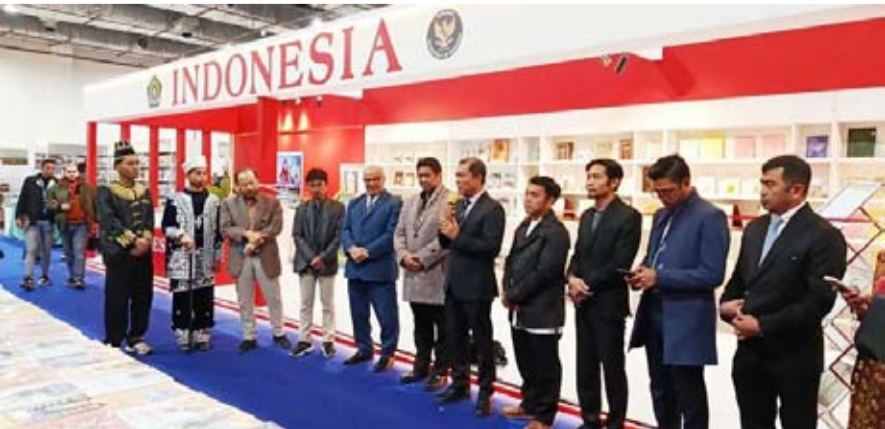
埃及举办的第57届开罗国际书展（CIBF）的印尼展馆。

是对两国总统于2025年4月在开罗签署的战略伙伴关系合作协议的具体落实。（fd）