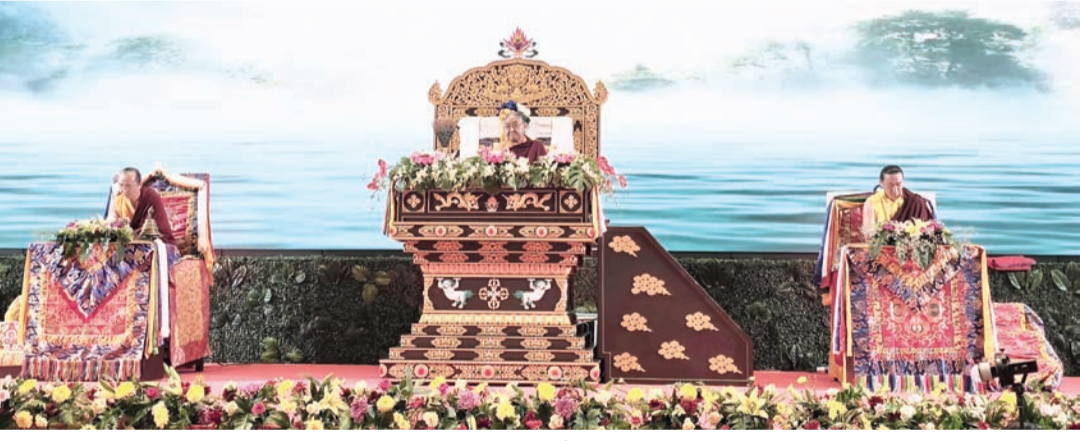
三位尊贵的主法者在法会上。