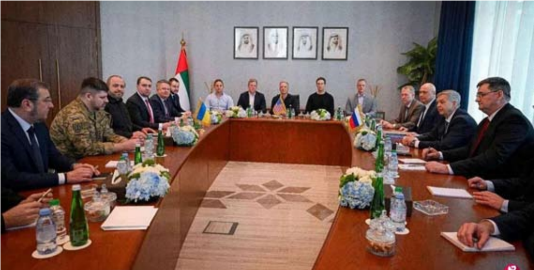
1月24日，由乌克兰、俄罗斯和美国代表组成的安全问题工作组首次三方会谈在阿拉伯联合酋长国首都阿布扎比的沙提宫举行。（路透社）

美国总统特使威特科夫在社交媒体发文说，23日至24日在阿布扎比举行的美俄乌三方会谈“非常具有