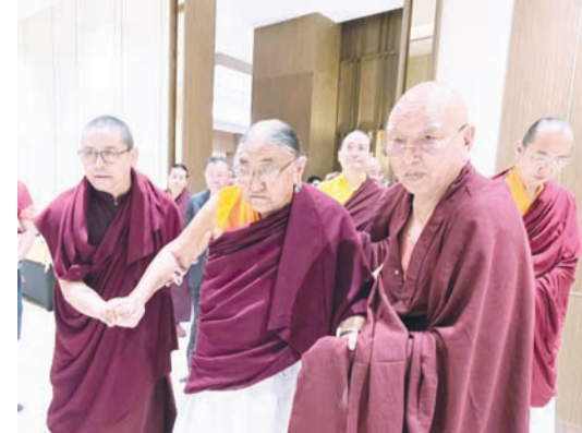
第41世萨迦法王——至尊法王恭玛·萨迦赤钦仁波切步入法会现场。