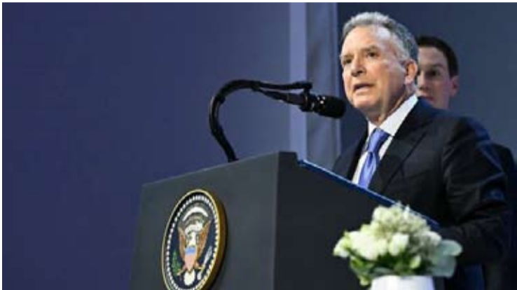
2026年1月22日，美国特使史蒂夫·威特科夫在瑞士达沃斯举行的世界经济论坛年会期间的和平委员会会议上发表讲话。

同一天，乌克兰总统泽连斯基在社交媒体发文称，三方会谈富有建设性，其中议题是结束战争的“可能性方案”。他还表示，只要各方愿意继续，下次会谈有望于下周举行。