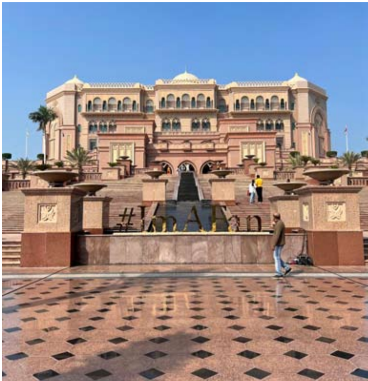
这是举行此次三方会谈的阿布扎比酋长宫酒店的照片。

【新华社莫斯科1月25日电】俄罗斯、美国和乌克兰代表24日在阿联酋阿布扎比结束首次三方安全问题会谈。这是2022年2月俄乌冲突升级以来三方首次公开接触，也是美方提出所谓“和平方案”后俄乌的首次直接对话。会谈未发布联合声明或宣布达成具体共识，但专家认为，会谈涉及多项实质性议题，释放出有限的积极信号。