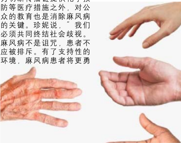
苏拉威西岛格伦打洛（Gorontalo）省纪念2026年世界防治麻风病日。

通过2026年世界防治麻风病日纪念活动，格伦打洛省卫生、人口控制和计划生育局希望提高社会各界和各部门的意识，共同支持加速格伦打洛省消除麻风病的进程。（pl）