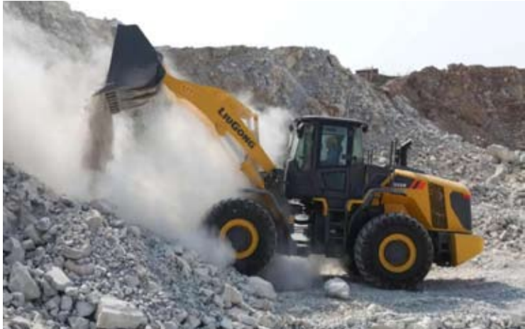
Intraco Penta (INTA) 公司的重型机械。

【本报讯】Intraco Penta (INTA) 公司正在制定多项战略，力争至2026 年实现两位数的营收增长率。