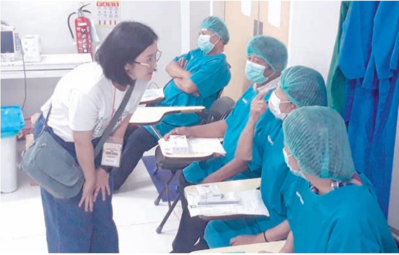
今年则为80人实施了手术