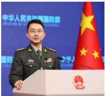
国防部新闻发言人蒋斌大校

【中新社北京1月24日电】中国国防部新闻发言人蒋斌24日就近期涉军问题发布消息。他表示，中国军队愿不断深化同拉美和加勒比国家军事交流合作，为共建中拉命运共同体作出新贡献。