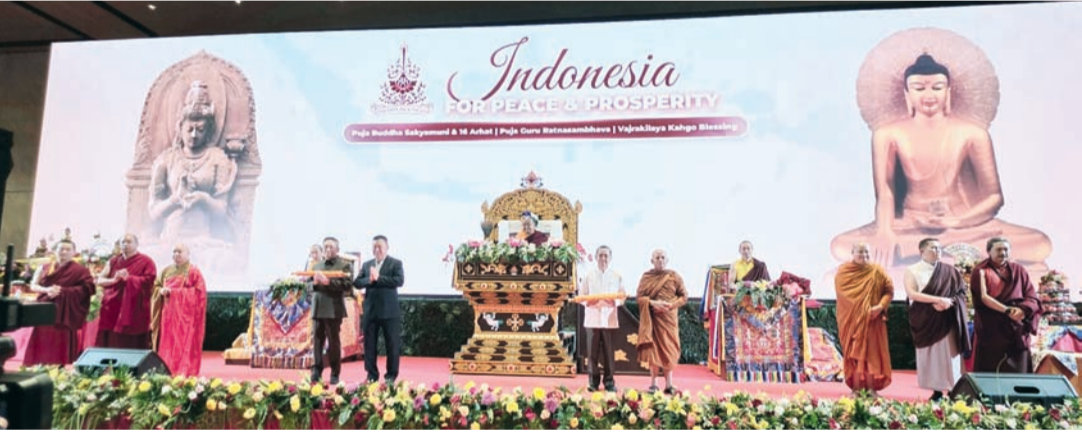
第41世萨迦法王——至尊法王恭玛·萨迦赤钦仁波切赐予嘉宾们珍贵礼品后合影。