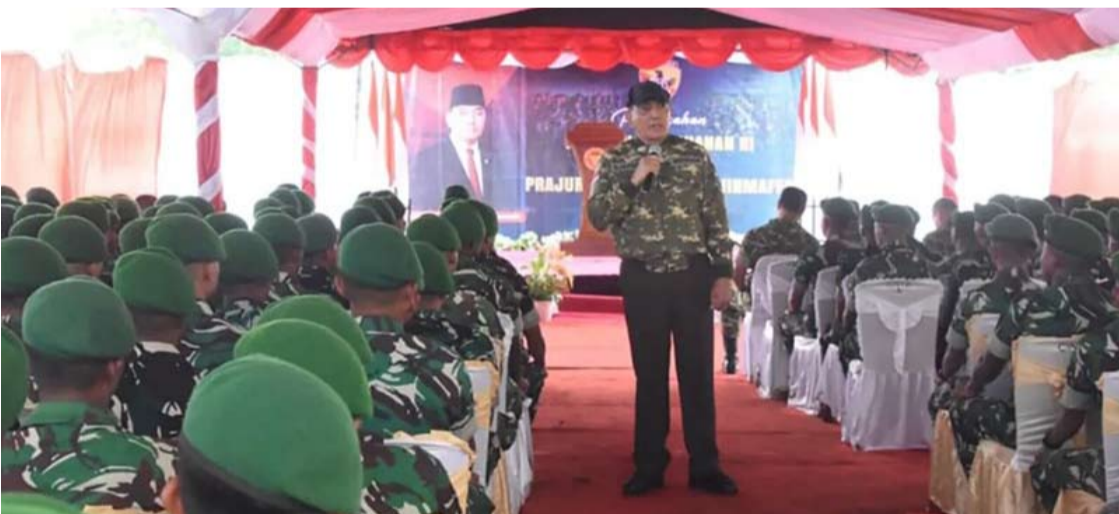
国防部长夏弗里·萨姆苏丁在北中帝汶地区县为第877/Biinmaffo步兵营士兵进行指导的情景。

“印尼国军的荣誉始终须得到维护，因为人民的信任是国军力量和尊严的根本基础。”他补充道。（fd）