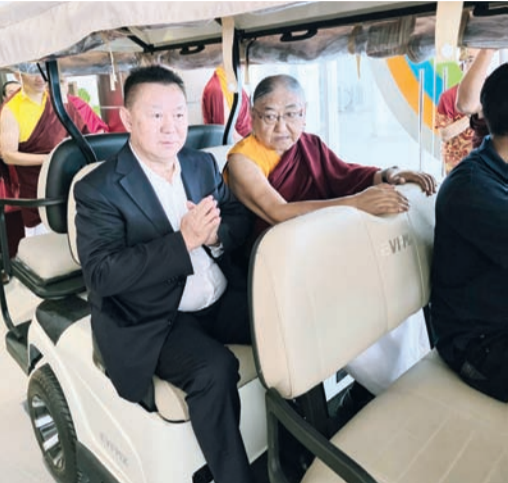
李明光与第41世萨迦法王——至尊法王恭玛·萨迦赤钦仁波切出席法会。