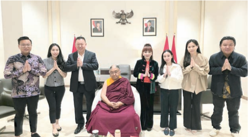
李明光家属与第41世萨迦法王——至尊法王恭玛·萨迦赤钦仁波切合影。