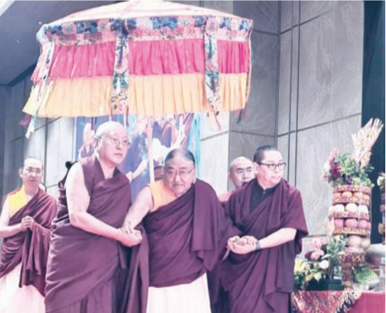
第41世萨迦法王——至尊法王恭玛·萨迦赤钦仁波切步入法会现场。