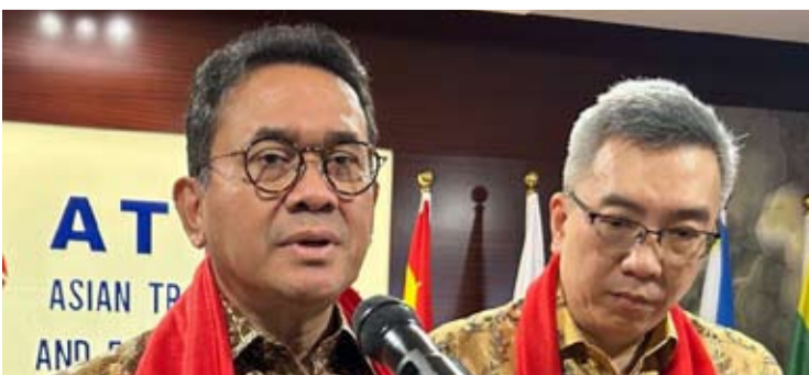
1月19日，印尼贸易部长布迪·桑托索（左）与亚洲贸易、旅游与经济理事会（ATTEC）主席布迪哈佐·伊杜安夏（右）在雅加达出席ATTEC总部揭牌仪式后向媒体介绍相关情况。

布迪在出席亚洲贸易、旅游与经济理事会（AT-TEC）雅加达总部揭牌仪式后向媒体表示，目前全球咖啡价格相关机构设在英国，印尼方面将通过沟通协调和政策对接，积极探索推动印尼在全球咖啡产业体系中发挥更加核心的枢纽作用。