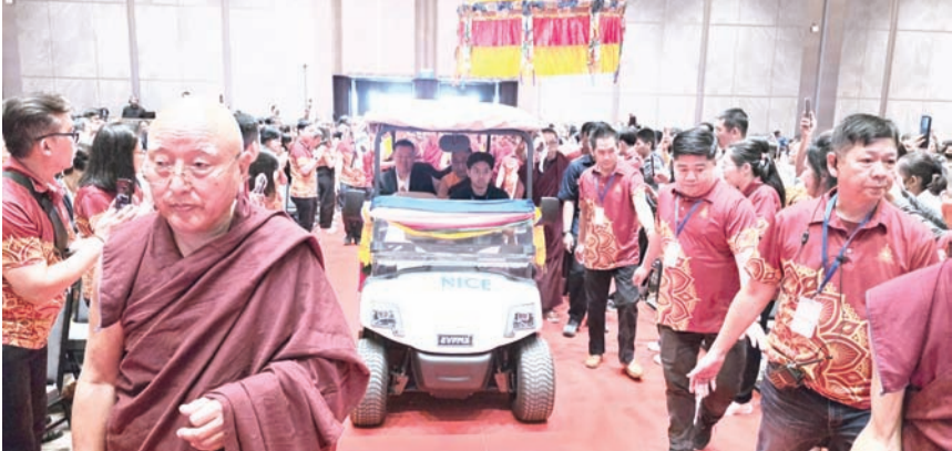
李明光与第41世萨迦法王——至尊法王恭玛·萨迦赤钦仁波切一同进入会场。