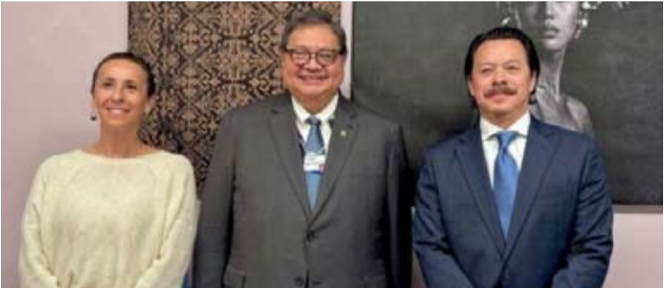
1月23日，印尼经济统筹部长艾尔朗加·哈尔塔托在瑞士达沃斯出席2026年世界经济论坛年会期间的活动。

他表示，印尼方面借助世界经济论坛系列活动，与来自美国的数字科技企业高层开展会谈，相关接触也是印尼与美国就关税议题进行沟通后的延续举措之一。