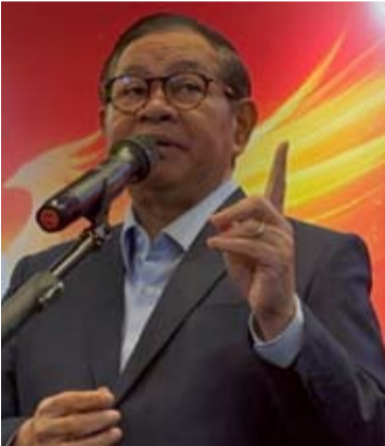
雅加达特区省长普拉莫诺·阿农。

【本报讯】雅加达特区省长普拉莫诺·阿农声称，2025年1月至12月期间，雅加达的投资实现额达到270.9万亿盾。这一成就标志着比2024年增长11.99%。