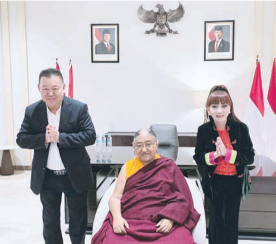
李明光夫妇与第41世萨迦法王——至尊法王恭玛·萨迦赤钦仁波切合影。