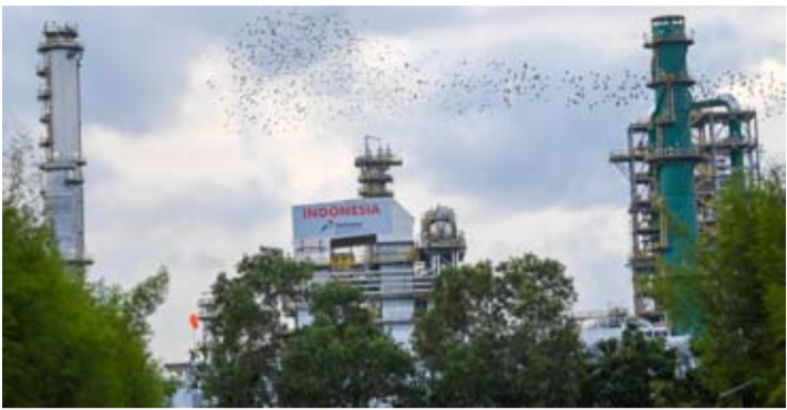
鸟群飞越东加里曼丹省巴厘巴板炼油厂升级改造项目（RDMP）区域（2026年1月12日摄）。

只要油价波动属于阶段性和短期性质，其对当前约5%的印尼经济增长水平仍处于可控范围之内。