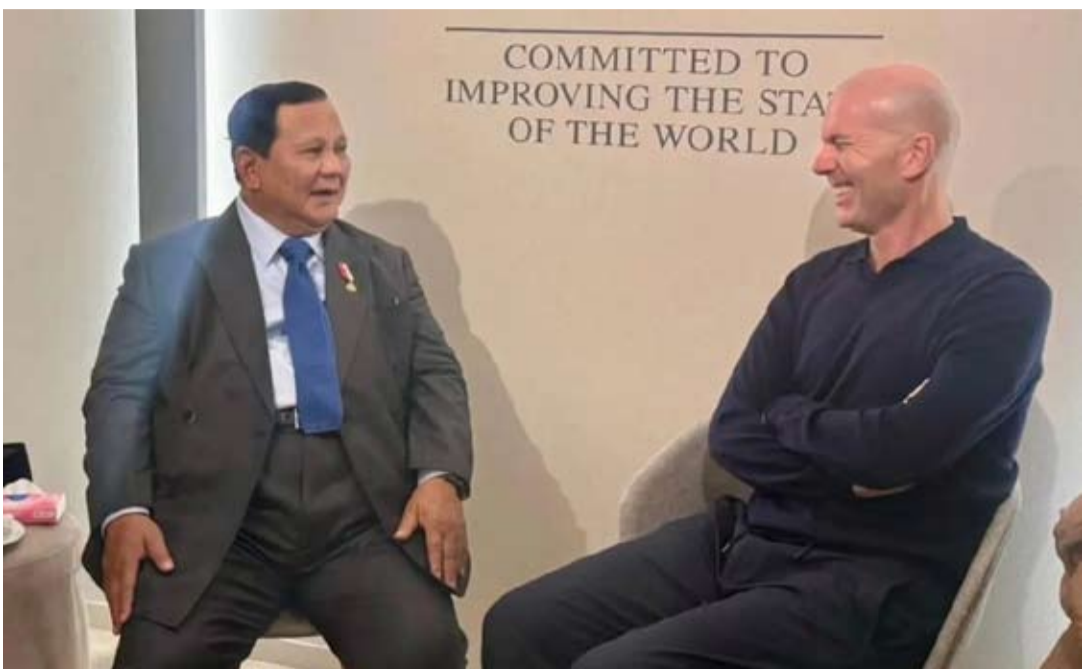
普拉博沃·苏比安托总统（左）在瑞士达沃斯举行的WEF期间，与法国足球传奇人物齐内丁·齐达内交谈一瞥。

普拉博沃总统在2026年达沃斯世界经济论坛上提出了以社会福利为基础的包容性经济战略“普拉博沃经济学”，引发了全球关注。