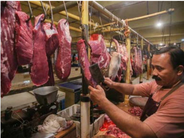
2026年1月21日，雅加达一座传统市场肉贩正在切割待售的牛肉。

另一方面，年度消费需求量为79.43万吨，涵盖家庭与非家庭消费。政府粮食储备（CPP）中的牛肉和水牛肉库存也处于安全水平。截至2026年1月22日，牛肉储备约8000吨，水牛肉储备约3000吨。具体而言，ID Food持有1.1万吨牛/水牛肉库存，而Bulog持有约18吨储备。（ cx ）