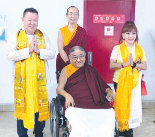
李明光夫妇与第41世萨迦法王——至尊法王恭玛·萨迦赤钦仁波切（中）和第42世萨迦赤钦法王——至尊赤钦仁波切（后）合影。