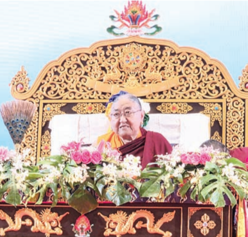
第41世萨迦法王——至尊法王恭玛·萨迦赤钦仁波切主持法会。

整个法会过程庄严殊胜，井然有序，最后在庄严祥和的氛围中圆满结束，参与大众法喜充满，并共同回向国家安定、社会和谐与世界和平。