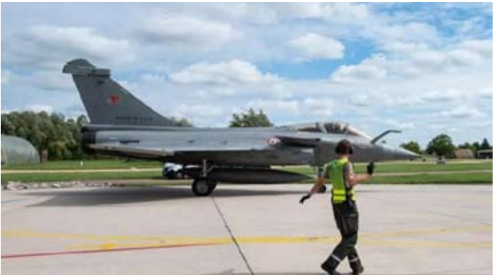
阵风战斗机在法国圣迪济耶 (Saint-Dizier) 113空军基地进行试飞。

尼。目前部署在北干巴鲁 (Pekanbaru) 的鲁斯敏·努尔贾丁 (Roesmin Nurjadin) 空军基地。从行政和技术角度来看，这些飞机已完成移交，印尼空军已可使用。”