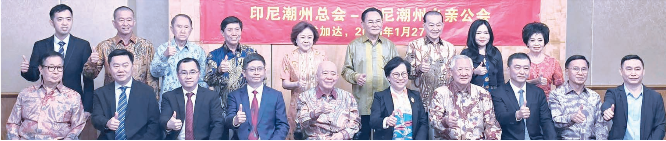
印尼潮州总会暨印尼潮州乡亲公会诸理事与揭阳市常委、统战部部长张丽璇女士一行合影留念。

了“揭阳潮侨坊”规划建设情况，诚邀海外潮人回乡考察投资，寻找商机，共谋发展。 随团来访的还有普宁市委常委、统战部部长谢照，揭阳市外事局副局长孙仲瑞，以及中国阳光投资基金管理有限公司联席主席秦克波等。双方在亲切友好气氛中进行了良好交流座谈后圆满结束。