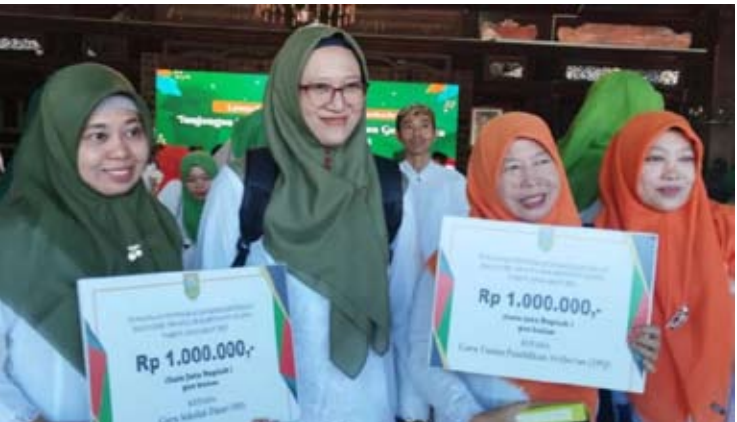
中爪哇省Kudus县的私立教师，他们从县政府领取私立教师福利津贴。

印尼驻金边大使馆披露，桑托大使将很快结束其作为印尼驻柬埔寨大使的任期，并将开始担任印尼外交部亚太和非洲事务总司长的新职务。 (fd)