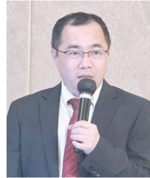
揭阳市自然资源局局长柯雄杰作介绍。