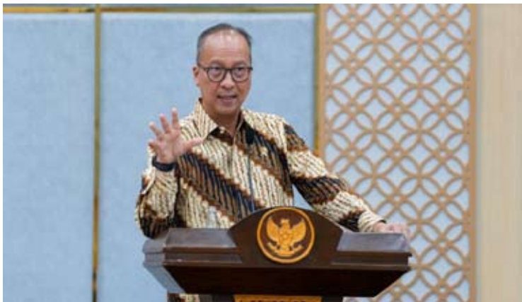
印尼工业部长阿古斯·古米旺·卡尔塔萨斯米塔。

INNOPROM 2026将于2026年7月6日至9日在俄罗斯叶卡捷琳堡举行。主办方介绍，本届展会预计将成为中亚及欧亚地区规模最大的工业展会之一，参展企业近1,000家，展览面积约50,000平方米。自2010年创办以来，INNOPROM已发展成为展示全球创新成果、先