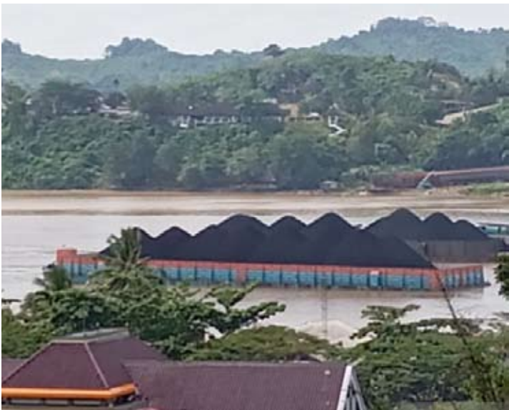
运煤船正沿着沙马林达的马哈坎河行驶。煤炭产业能够吸引东加里曼丹的投资。

他总结道：“按业务领域细分，采矿业仍是吸引投资的主导产业，其次为化工业及食品领域。”(cx)