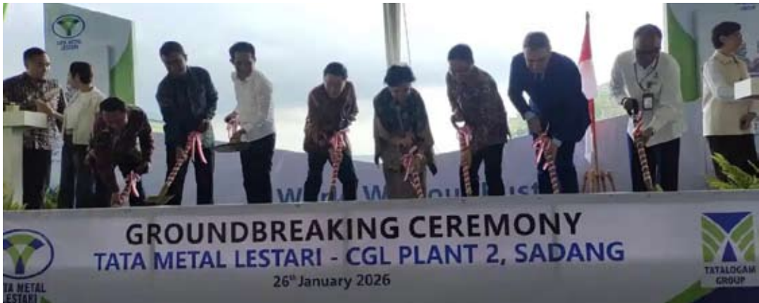
印尼塔塔金属公司 (PT Tata Metal Lestari) 1月26日在西爪省普哇加达县萨当为其第二条连续镀锌生产线 (CGL 2) 项目举行奠基仪式。

有关方面在1月26日于西爪哇省普瓦卡塔举行的项目奠基仪式上表示，该项目为第二条连续镀锌生产线 (CGL 2)，投资规模约1.5万亿印尼盾。该生产线为东南亚地区首个采用相关技术建设的项目，采用锌镁及锌铝镁复合镀层工艺，其技术优势在于可