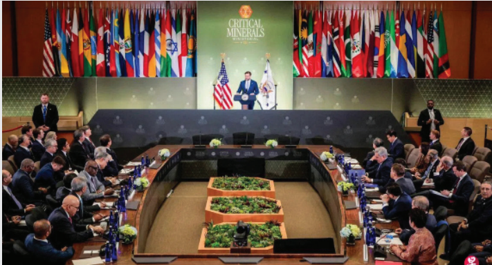
特朗普政府星期三在华盛顿召开关键矿产部长级会议，邀请多国出席，探讨构建一个稳定的关键矿产供应链。图为美国副总统万斯在会上发表演讲。

投资，并减少市场波动带来的不确定性。与会国家包括日本、英国、法国、德国、印度、韩国和澳大利亚等。美国官员还透露，华盛顿正推动达成多项关键矿产合作协议，同时有更多国家表达加入兴趣。