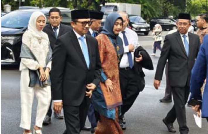
前任印尼央行副行长朱达·阿贡于周四（2月5日）抵达雅京总统府。

众所周知，在托马斯·吉万多诺当选为2026至2031年任期的印尼央行副行长后，财政部副部长的职位出现空缺。托马斯被任命为印尼央行副行