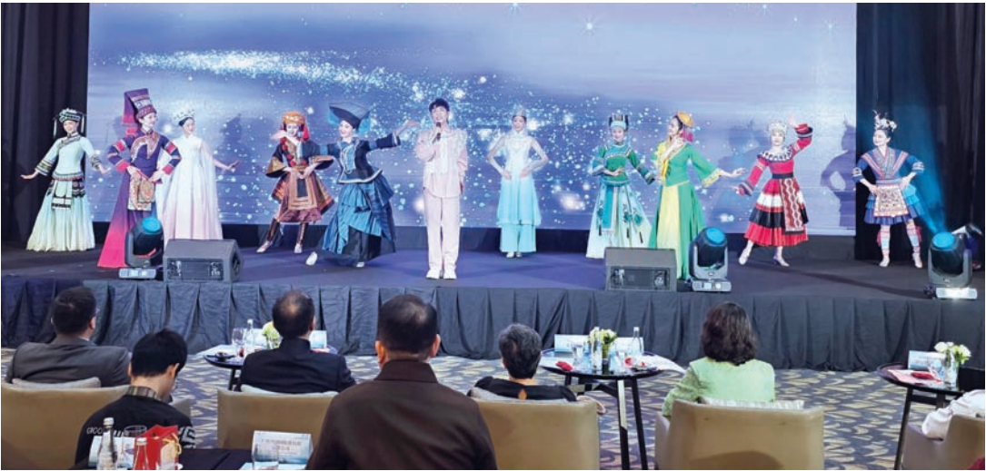
一场美轮美奂的广西民族服饰秀，伴随着印尼民歌《梭罗河》惊艳亮相。