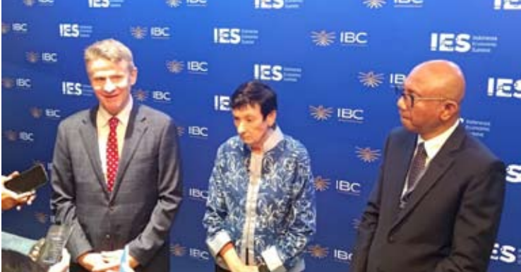
2026年2月4日，澳大利亚驻印尼大使罗德·布雷热（左）与西悉尼大学名誉校长詹妮弗·韦斯特科特教授（中）在雅加达出席2026年印尼经济峰会期间，共同参加印尼—澳大利亚商业圆桌会议后合影。

代表团由澳大利亚东南亚事务特使尼古拉斯·摩尔和澳大利亚对印尼商务特使詹妮弗·韦斯特科特教授共同率领，会见了多位印尼政府部长、国企高管以及主要商业协会与企业代表。韦斯特科特在声明中表示：“我很荣幸能共同率领第五次商务代表团访问雅加达。代表团的规模和层次充分体现了澳大利亚投资者对印尼的兴趣。目前澳大利亚是印尼