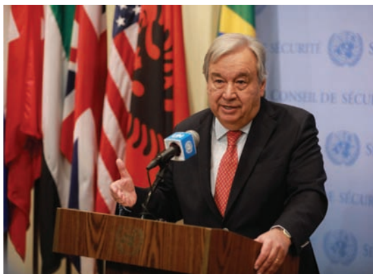
资料图——联合国秘书长古特雷斯在纽约联合国总部向记者讲话。

险并加强全球共同安全的后续框架达成一致。俄美《新削减战略武器条约》于2010年签署，次年正式生效，有效期经协商延长至今年2月5日，是俄美《中导条约》2019年失效后两国间唯一的军控条约。