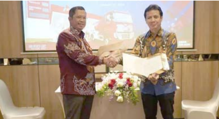
Astra UD Trucks – Pertamina Patra Niaga正签署MoU。

【本报讯】Astra UD Trucks公司正式与Pertamina Patra Niaga公司建立战略合作伙伴关系，双方签署一份谅解备忘录（MoU），旨在为商用车队的运营提供支持并提升其可靠性。