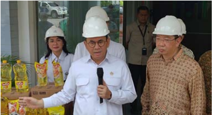
2026年2月5日，贸易部长布迪·桑托索（左）在西爪省勿加西市视察PT Mikie Oleo Nabati Industri (MONI) 工厂后向媒体发表讲话。

布迪表示，政府不希望社会公众过度依赖“Minyakita”。该产品属于基于国内市场义务（DMO）的市场干预工具，供应规模有限，且与出口执行情况密切相关。他于周四（2月5日）