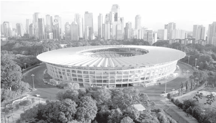
雅加达格拉蓬卡诺主体育场。

中国足协在官方微博上重申，将严格执行党和中央的各项决定，对任何违规行为都采取零容忍态度，并敦促其他球员和俱乐部“从此案中汲取深刻教训，将其视为严厉的警告”。 中国足协的处罚和罚款是中国国家主席习近平自2012年以来发起的跨领域反腐败运动的一部分。 据中央纪律检查委员会和国家监察委员会报告，整个2025年，共有69名省部级或以上官员以及98.3万人因腐败案件受到惩处。