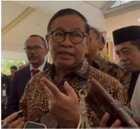
雅加达特区省长Pramono Anung Wibowo于周四在雅加达北区接受采访的情景。