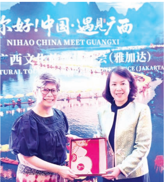
广西壮族自治区文化和旅游厅党组副书记、副厅长林霖（右）赠送纪念品给印尼旅游部东亚、澳大利亚及大洋洲国际旅游市场推广司司长Yulia女士。