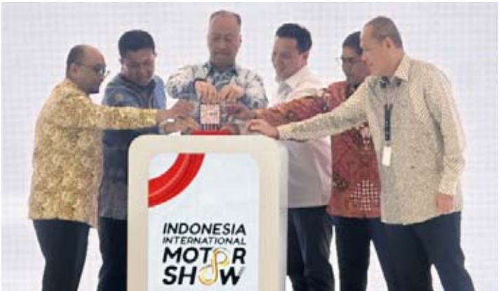
2026年2月5日，印尼工业部长阿古斯·古米旺·卡尔塔萨斯米塔（左三）在雅加达马腰兰JIExpo出席印尼国际汽车展（IIMS）2026开幕式。

他指出，相关数据表明印尼汽车产品具备较强的国际竞争优势，能够稳定进入并拓展海外市场。国内市场收缩与出口持续增长形成对比，进一步凸显全球化布局在当前阶段对印尼汽车工业的重要意义。政府认为，强化出口能力并非短期应对措施，而是支撑产业实现中长期稳定