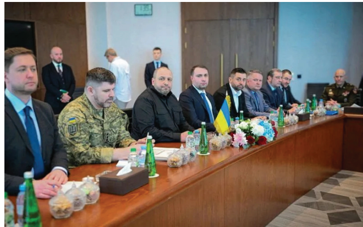
工作组在阿联酋首都阿布扎比举行新一轮会谈。

5日在社交媒体上发文表示，美国、乌克兰和俄罗斯三方代表当天已达成协议，俄乌同意交换314名被俘人员。威特科夫称，各方将继续开展对话，预计未来数周内有望取得更多进展。