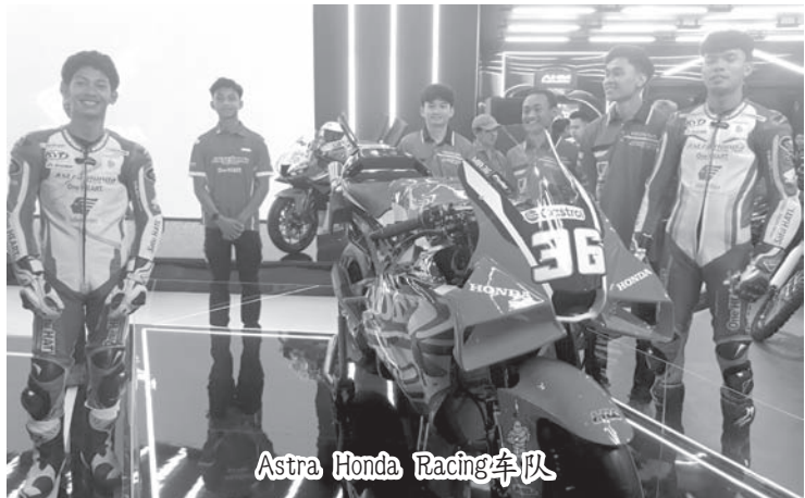
Astra Honda Racing车队