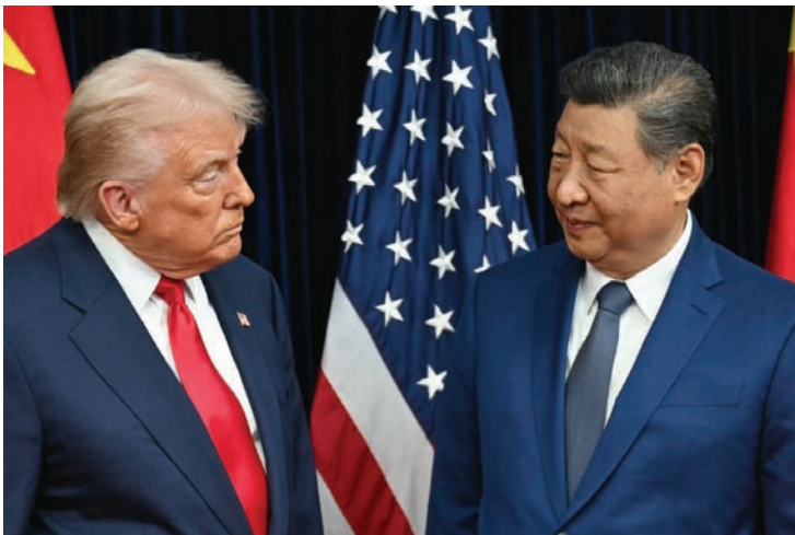
国家主席习近平4日同美国总统特朗普通电话。

中国核心利益中的核心，是中美关系第一条不可逾越的红线。民进党当局一再企图“倚外谋独”“以