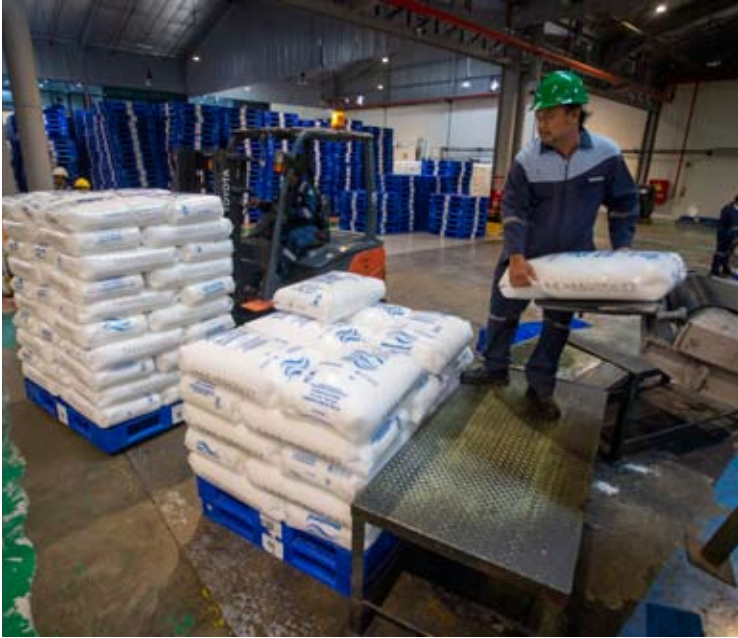
2026年1月30日，工人在西爪省南安迪县俊丁尤阿特（Juntinyuat）地区北塔米纳旗下PT Polytama Propindo生产设施内搬运装有聚丙烯的编织袋。

【本报讯】印尼中央统计局（BPS）最新数据显示，2025年末印尼劳动力市场延续改善态势。截至2025年11月，全国公开失业率（TPT）降至4.74%，较2025年8月回落0.11个百分点。