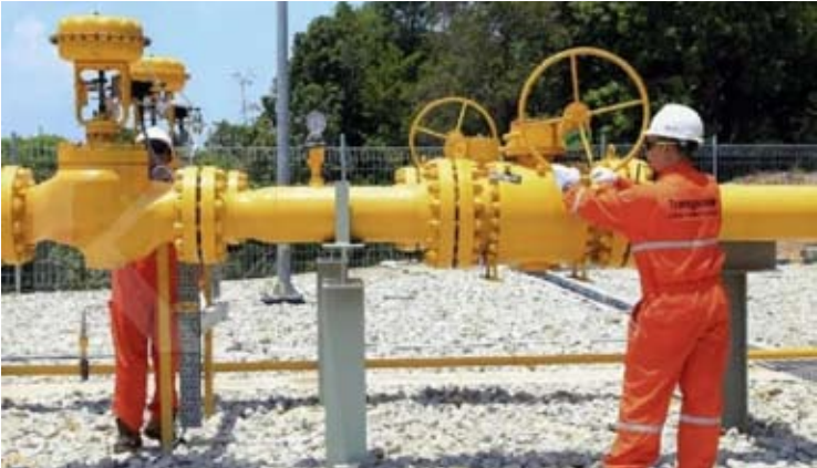
Transgasindo公司员工安装计量站。

这项发展是PGN 2026年3.53亿美元资本支出计划部分，其中62%将供加强中游、下游和其他行业。