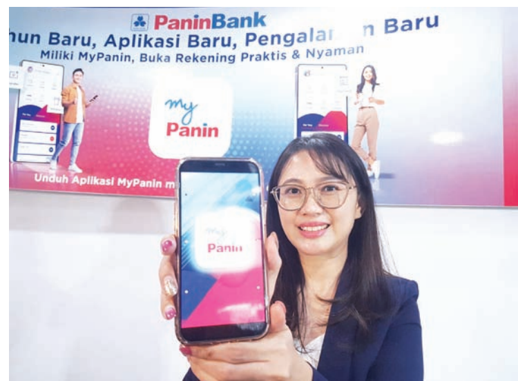
模特展示其手机上的 MyPanin 应用界面。

首选应用，以满足其高度数字化、线上化的生活方式需求。55年来，Panin Bank 持续努力提供更优质的产品与服务，并积极强化印尼银行业的数字化转型。” Panin Bank科技与营运董事Suwito Tjokrorahardjo补充说明：“作为核心亮点