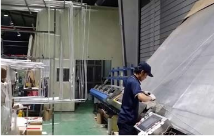
玻璃生产工厂示意图

【本报讯】印尼平板安全玻璃协会（AKLP）近日对越南政府决定对印尼浮法玻璃征收反倾销进口税表示关注。根据相关决定，涉案产品反倾销税税率区间为15.71%至63.39%。