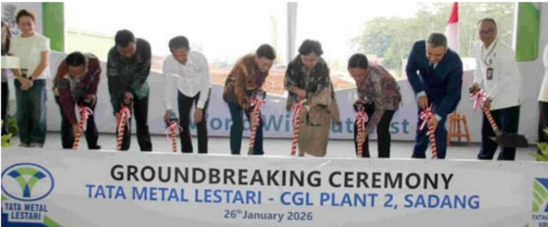
Tata Metal Lestari 工厂奠基仪式。

Stephanus补充道，在建设CGL 2工厂的过程中，Tata Metal Lestari 公司与意大利科技公司Tenova合作，