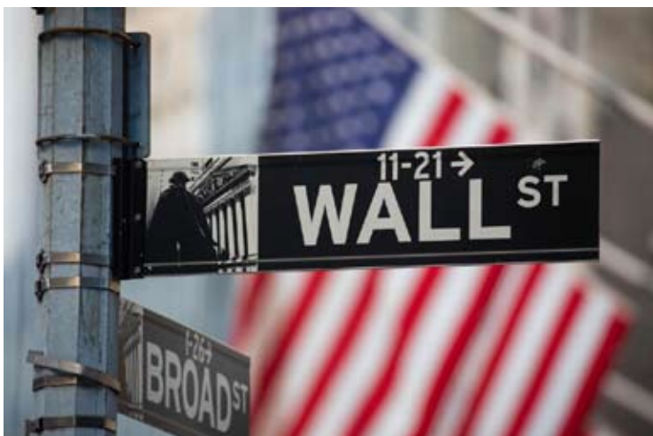
这是2022年1月18日在美国纽约证券交易所外拍摄的华尔街路牌。

市场大幅波动也让美国芯片制造商英伟达的股价面临考验。英伟达预计本月晚些时候公布财报。阿尔伯特赫资资本公司创始人德鲁·迪克森说，此前仅凭资本支出就能引发市场兴奋，现在人们更希望看到资本支出转化为实际营收增长。