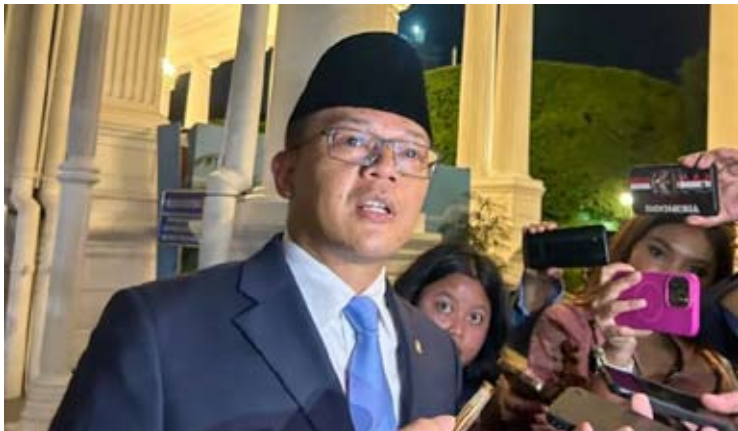
外交部长苏吉奥诺于2月4日（周三）在雅加达总统府会见媒体一瞥。

【本报讯】外交部长苏吉奥诺表示，希望发展中国家峰会（D-8）能达成具体合作成果，特别是在加强成员国之间的经济合作方面。