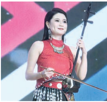
广西艺术团带来二胡演奏《赛马》。