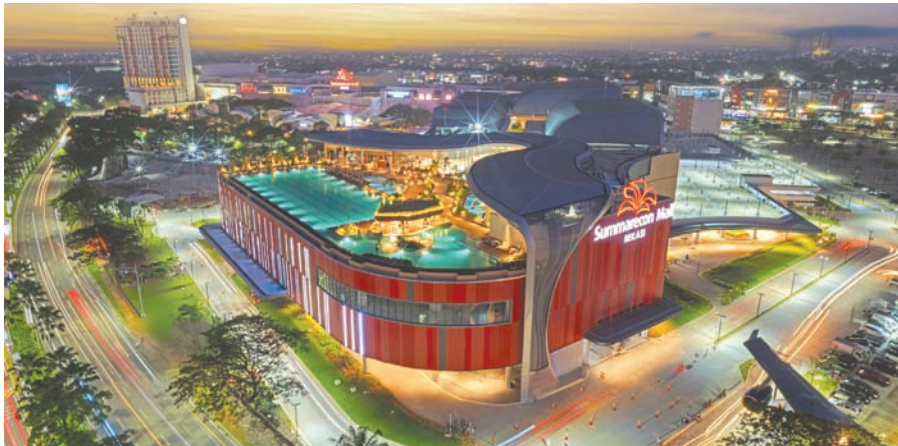
Summarecon Mall Bekasi 2 外观。