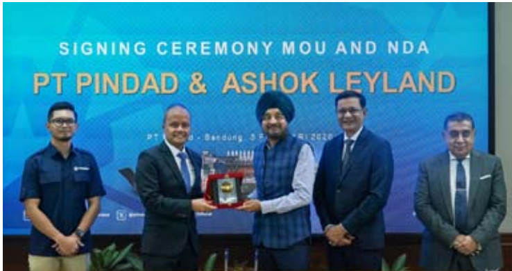
2026年2月4日，印尼国有国防企业Pindad与印度企业Ashok Leyland正式签署谅解备忘录。

当前印尼正加速向可持续交通转型并推进国防能力现代化。该备忘录将合国家推动节能出行、电动汽车普及及国产防务平台生产的战略导向。合作重点将集中在电动巴士与国防车辆的联合开发实