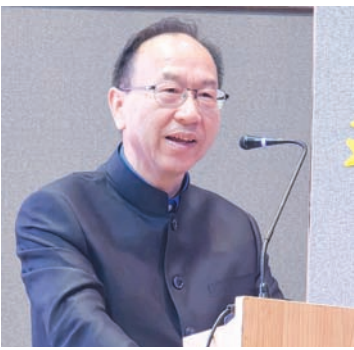
中国驻印尼使馆文化参赞王思平致辞。