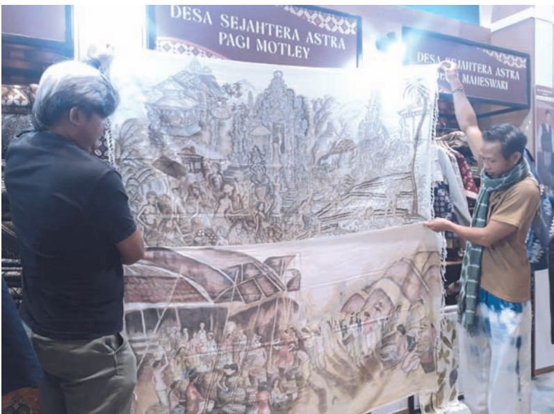
Astra 中小型企蜡染布产品