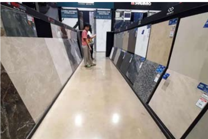
买家正在挑选瓷砖情景。

域的激励措施。 Asaki甚至估计，300万套住房计划可使瓷砖产能利用率提高约16%。 Edy补充道，因此，如果该计划按目标实施，全国瓷砖行业的产能利用率将超过90%。 “但今年，我们仍然采用80%的保守估计。” Edy解释说，不仅产能利用率会提高，瓷砖行业的产能也将增加，去年全国瓷砖行业的产能为6.5亿平方米。 Edy表示，今年，装机产能将增长约4%，达到6.72亿平方米。 “未来两年，最迟到2028年，产能将再次增长，达到7.01亿平方米。这将进一步巩固印尼瓷砖行业在全球前五的地位。” Edy补充说，推动全国瓷砖行业产能增长的因素之一是进口商与本地瓷砖生产商之间的原厂配套(OEM)合作模式。 通过原厂配套模式，将建设一座占地6万平方米的工厂，此外，也计划将该工厂扩建至5万平方米。 Edy表示，OEM模式的推进与政府加强对国内瓷砖产业免受进口产品冲击的政策并行。 凭借各项绩效提升和