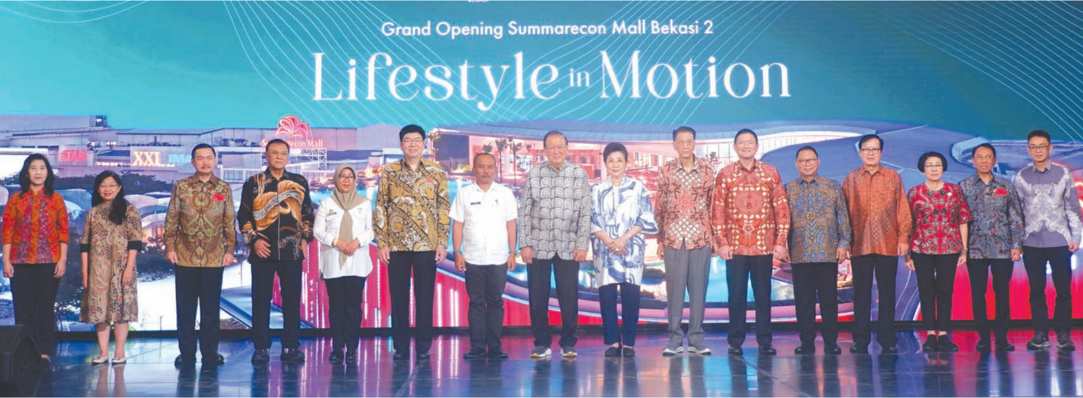
Summarecon 董事会与管理层成员，与西爪哇省政府及勿加泗市贸易与工业局代表，于 Summarecon Mall Bekasi 2 与 Wellground 开幕仪式上合影留念。