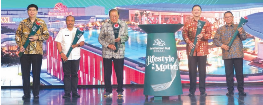
Summarecon 管理层与西爪哇省政府代表共同点燃火炬，标志着 Summarecon Mall Bekasi 2 与 Wellground 正式启用。