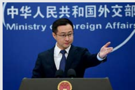
外交部发言人林剑