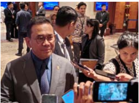
2026年2月3日，印尼贸易部长布迪·桑托索在雅加达举行的2026年印尼经济峰会（IES）期间回答媒体提问。