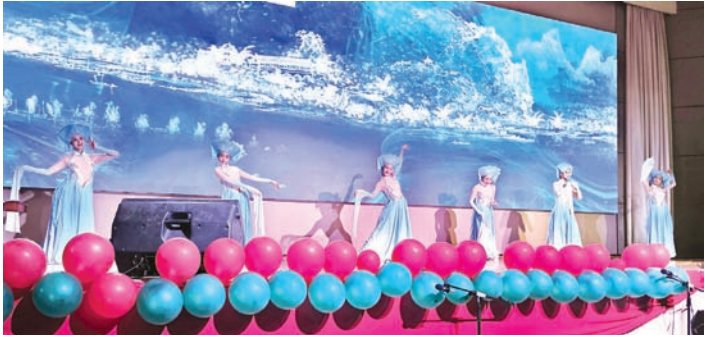
舞蹈《月也花也》表演。