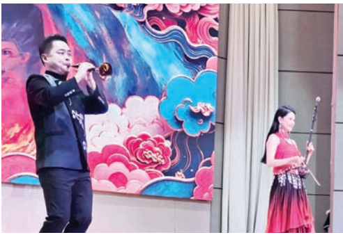
二胡与唢呐乐器演奏《国潮贺岁·马跃新春》。