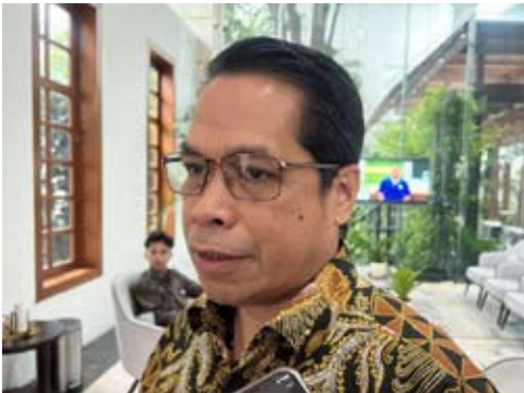
2026年2月6日，印尼能源与矿产资源部石油与天然气总局局长劳德·苏莱曼在雅加达能源与矿产资源部接受媒体采访。

冲击，政府已要求北塔米纳提前完善相关物流和基础设施准备工作，包括装运港口安排、货运调度管理以及根据各加油站运营方需求进行供给量匹配，确保柴油分配与运输环节运行平稳，避免出现市场断供风险。