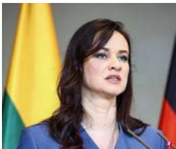
立陶宛总理鲁吉尼埃内星期二（2月3日）接受媒体访问时说，允许台湾在首都维尔纽斯开设以“台湾”为名的代表处是战略性错误。