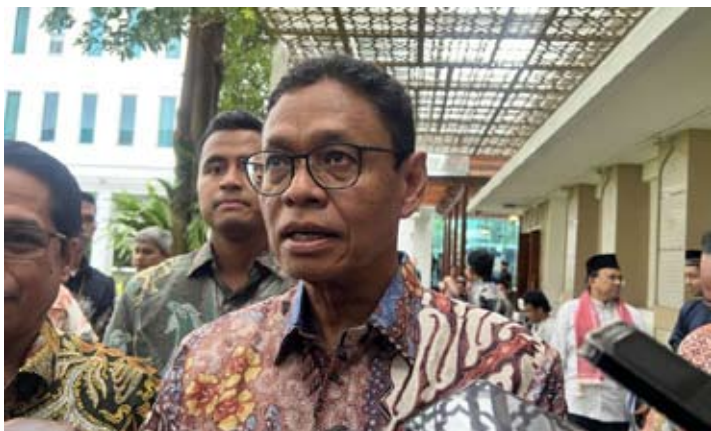
2026年2月6日，能源与矿产资源部副部长尤利奥特·丹绒在雅加达能源与矿产资源部接受媒体采访。