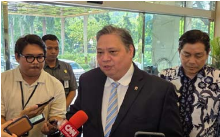
经济统筹部长艾尔朗加·哈尔塔托。

【本报讯】经济统筹部长艾尔朗加·哈尔塔托(Airlangga Hartarto)称，政府计划在2026年开斋节假期，承担机票的全额增值税。 艾尔朗加表示，政府希望促进民众的流动性，以保持自2025年底圣诞节和新年假期以来的经济增长势头。 他说，政府计划提高政府承担的机票增值税比例。在前一个时期，政府仅承担11%增值税税率中的6%。政府计划使即将到来的开斋节长假期间的机票更加实惠。 “实际机票折扣将在17%—18%左右，因为增值税由政府承担。上次圣