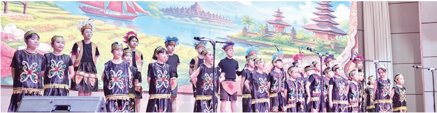
巴中三语学校师生也献上了小学合唱。