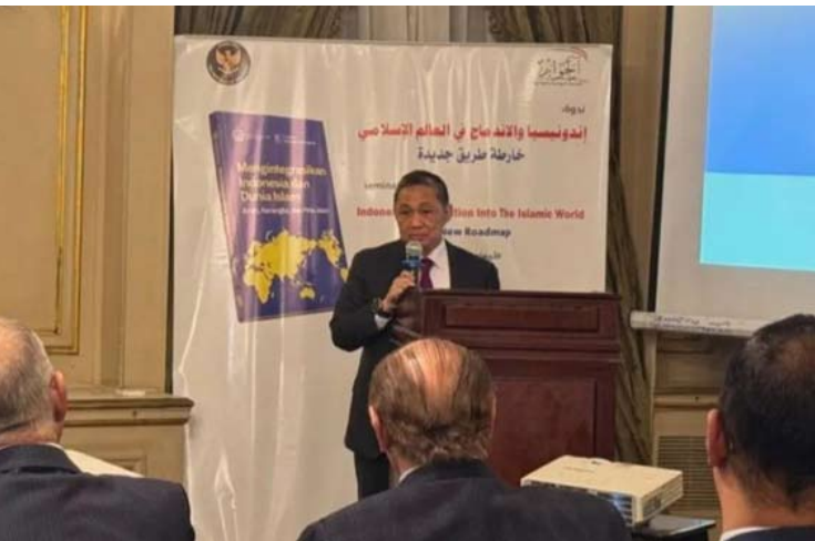
我国外交部副部长阿尼斯·马塔在埃及开罗举行的研讨会上发表讲话，

自己的。印尼以每立方米1500盾的价格将它们运往国外，然后再以数百万盾的价格运回国内。这些药材应该在本地进行加工处理，”他如是说。（fd）