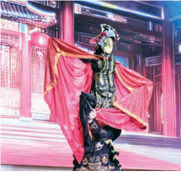
人偶变脸《千面戏偶》表演。