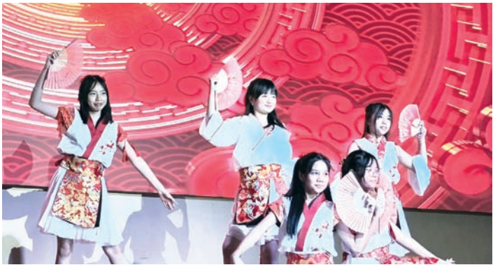
巴中初中舞蹈《花舞翩跹》。