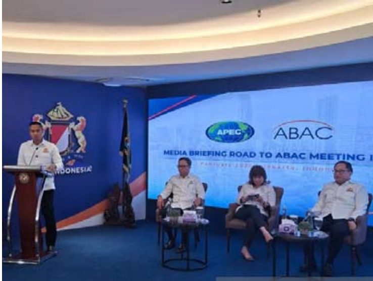
2026年2月2日，印尼工商会主席阿宁迪亚·巴克里在雅加达举行的“迈向2026年亚太经合组织工商咨询理事会第一次会议”媒体吹风会上发表讲话。

【本报讯】印尼工商会（Kadin）表示，中国方面明确提出由印尼主办2026年亚太经合组织工商咨询理事会（ABAC）首场会议，显示印尼在亚太区域经济架构中的战略地位不断提升。该论坛被视为工商界参与塑造亚太经济议程的重要平台。