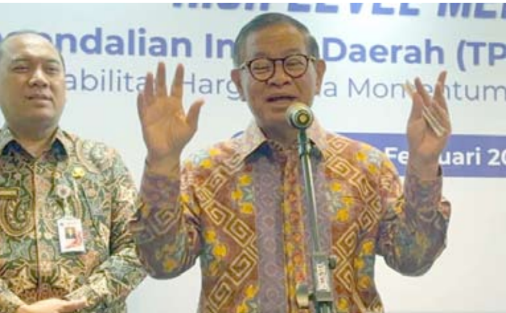
周五（6/2），雅加达特区省长Prabowo Subianto在雅加达市中心接受采访。

核实、个案评估，以及为无护照印尼公民签发临时旅行证件。此外，印尼驻金边大使馆已向柬埔寨当局提交申请，请求减免近800名印尼公民的移民罚款，并希望在未来几天内得到答复。（pl）