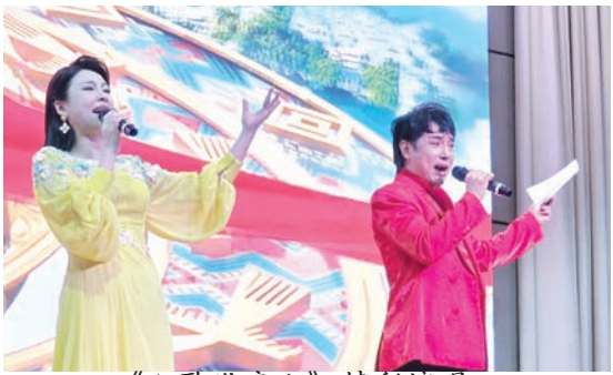
《山歌敬亲人》精彩演唱。