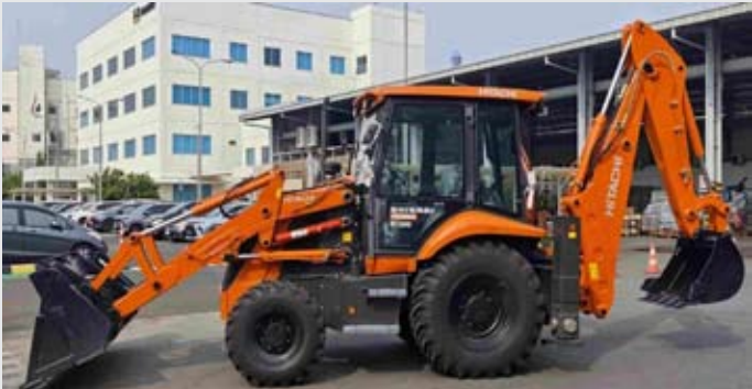
Hexindo发布的新产品BX100 Shinrai动力挖掘装载机。

【本报讯】重型机械制造商Hexindo Adiperkasa (HEXA)公司预计，至2025年底净收入达4.0107亿美元。 2025年，HEXA的收入比2024年增长8.62%，2024年收入为3.6923亿美元。 如此一来，HEXA的财务报告周期与日本日立建机(HCM)的财务报告周期一致，本财年涵盖2025年4月至2026年3月。 因此，截至2025年12月31日的财务报告，仅反映HEXA在三个季度，即九个月的业绩。 根据印尼证券交易所发布的财务报告，HEXA向第三方销售重型机械的销售额同比增长23.62%，从2.1693亿美元提高成为2.6817亿美元。 向第三方销售重型机械是HEXA营收的主要来源，2025年4月至12月期间九个月内，该项收入占HEXA总营收的66.86%。 与此同时，HEXA向关联方销售的重型机械销售值为131万美元。2024年同期，HEXA在该业务领域未录得任何收入。 只是即便收入有所增长，HEXA的利润却有所下降。原因之一是HEXA的营业成本增幅较大，同比提高11.84%，从2.9001亿美元提高成为3.2436亿美元。 这些因素导致HEXA的毛利润同比下降3.18%，从7922万美元降低成为7670万美元。 同样的，HEXA的营业利润同比也下降8.13%，从3246万美元降低成为2982万美元。