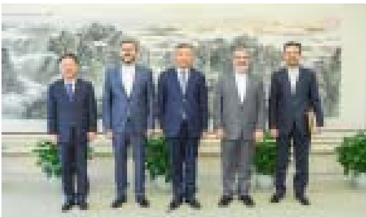
2026年2月5日，外交部副部长苗得雨在北京会见伊朗外交部副部长加里布阿巴迪。

【中新社北京2月6日电】据中国外交部网站6日消息，2月5日，中国外交部副部长苗得雨在北京会见伊朗外交部副部长加里布阿巴迪。