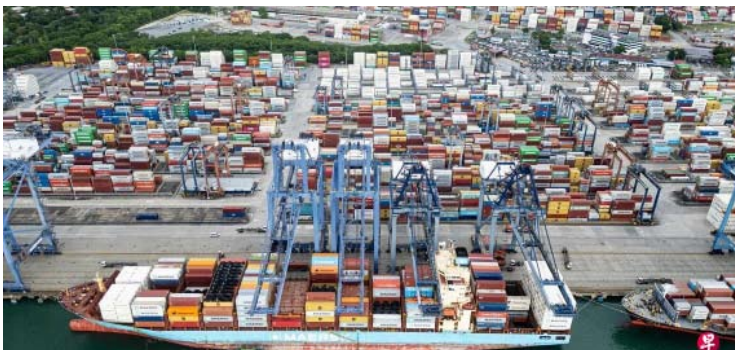
图为长和位于巴拿马运河太平洋入口处的巴尔博亚港，摄于2025年10月。