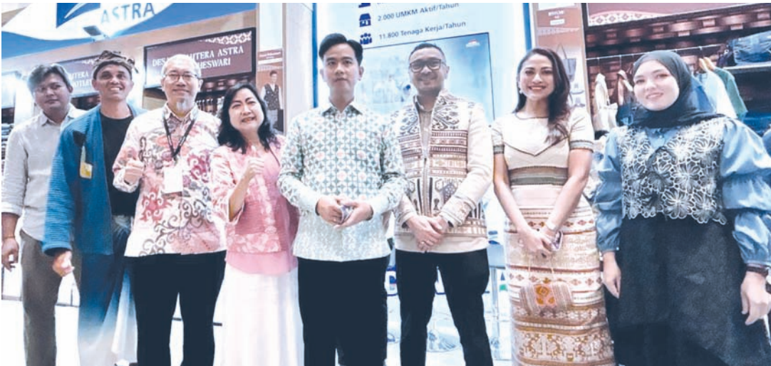
来宾与副总统吉布兰合影。