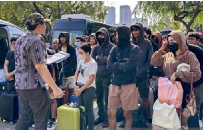
印尼驻柬埔寨金边大使馆重申，鉴于越来越多的印尼公民向大使馆举报，大使馆将继续致力于保护印尼公民的安全。

此外，印尼驻金边大使馆指出，2026年1月16日至2月5日期间，共有3446名印尼公民因在柬埔寨各省遭遇网络诈骗团伙而前往大使馆，申请遣返印尼。