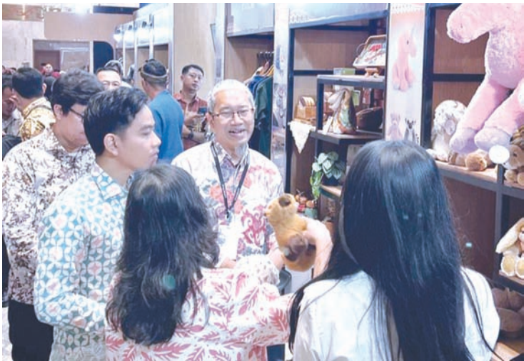
副总统吉布兰访问Astra展台