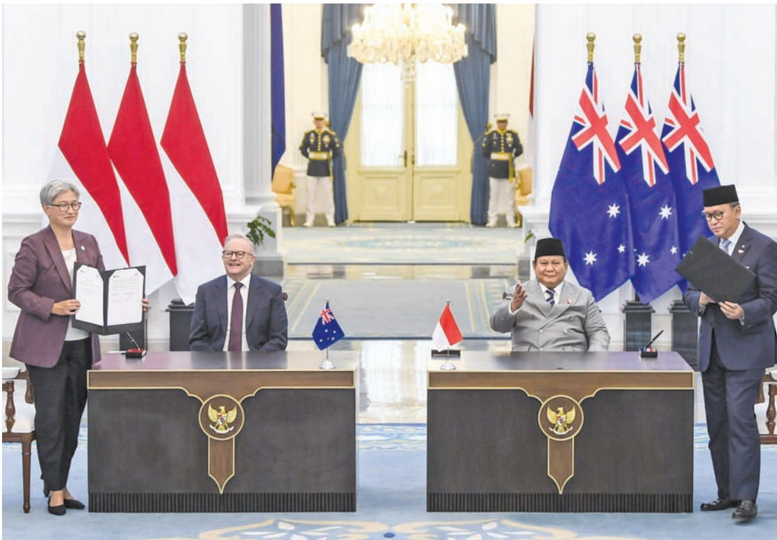
普拉博沃·苏比安托总统（右二）和澳大利亚总理安东尼·阿尔巴尼斯（左二）在独立宫见证了澳大利亚外交部长黄英贤（左）与投资和下游产业部长/投资统筹机构主任兼达南塔拉集团首席执行官罗珊·罗斯拉尼（右）签署合作协议。

同时，我也邀请澳大利亚投资印尼关键矿产的下游产业链，包括镍、铜、铝土矿和黄金的加工产业。我们也将鼓励印尼企业在澳大利亚的关键矿产采矿领域进行投资，”他如是说。（fd）