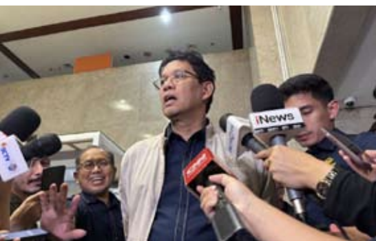
印尼财政部长普尔巴亚·尤迪·萨德瓦

精确衡量，因为相关激励通常与其他财政刺激同步实施。不过，税收激励与额外刺激政策的组合，已被证明有助于维持经济活动，并改善整体经济走势。