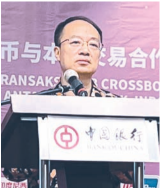
中国驻棉兰总领事黄河致辞。