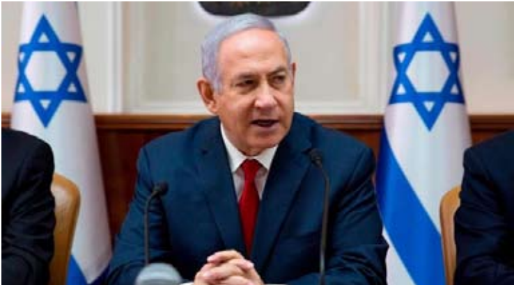
以色列总理内塔尼亚胡（资料图）

【新华社耶路撒冷2月7日电】以色列总理府7日在一份声明中宣布，以总理内塔尼亚胡将于下周前往华盛顿，与美国总统特朗普举行会晤，讨论对伊朗的谈判。 根据这份声明，以美领导人会晤将于11日举行。内塔尼亚胡认为，与伊朗的“任何谈判”都必须要求伊朗限制其弹道导弹能力、停止支持“抵抗之弧”成员。 “抵抗之弧”是伊朗主导的中东地区抗以联盟，成员包括黎巴嫩真主党、巴勒斯坦伊斯兰抵抗运动（哈马斯）、也门胡塞武