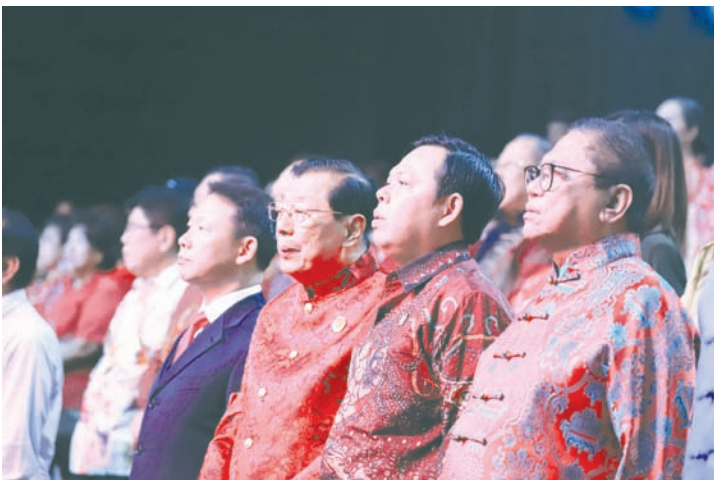
右起：奥斯曼·萨普塔、苏丹·巴赫蒂亚尔·纳贾穆丁、叶联礼、郑杰公参兼总领事出席活动。