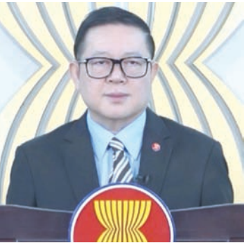
东盟秘书长高金洪发表视频致辞。

在迎接马年之际，期待大家拥抱骏马所代表的优雅、活力、前进的动力，满怀希望、坚韧、团结，共同奔向新的一年。 中国驻东盟大使王擎在致辞中表示，春节象征团圆、欢乐、和谐，一起过年是中国东盟民心相亲、文明交融、和谐共生的生动范例。中国东盟命运共同体日益紧密，迸发出强大生命力，树立了共建人类命运共同体的典范。他特别提到，广西是中国东盟友好交流与合作的重要“联接点”，“交汇点”，在中国东盟全面战略合作伙伴关系中发挥着“门户+引擎”的作用。新的一年，衷心祝愿中国东盟友好合作如