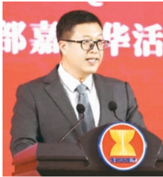
中国广西壮族自治区人民政府新闻办公室主任黎擎致辞。