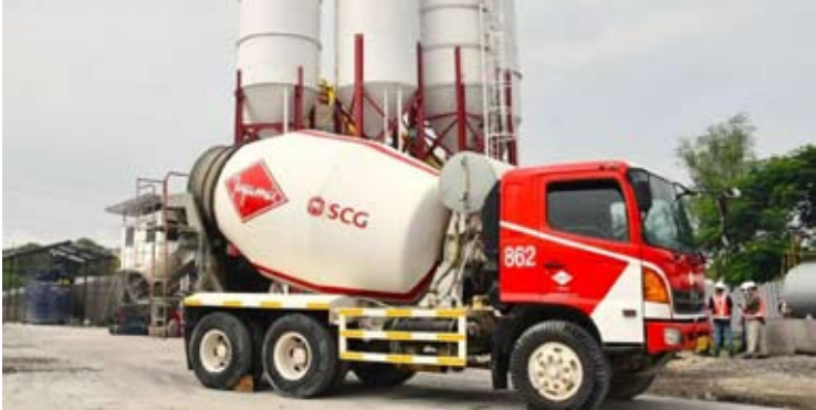
暹罗水泥集团(SCG) 水泥搅拌机。

【本报讯】暹罗水泥集团(Siam Cement Group/ SCG)持续拓展其在印尼的市场。这家泰国企业集团正通过推广低碳水泥产品，力求在企业对企业(B2B)和企业对消费者(B2C)两个市场实现增长。