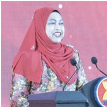
马来西亚常驻东盟代表萨拉发表致辞。