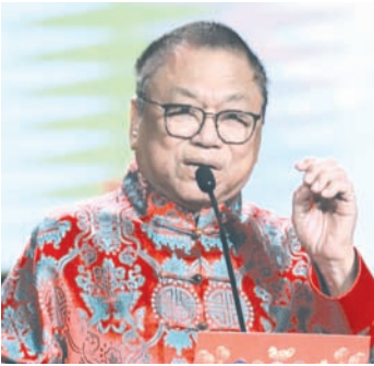
印尼客联总会永远荣誉名誉主席奥斯曼·萨普塔致辞。