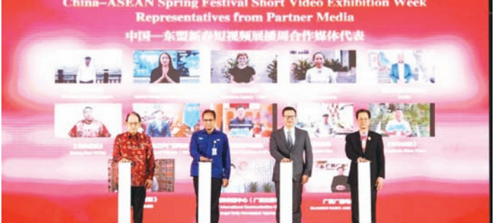
中国与东盟媒体代表以云端连线的方式共同启动中国—东盟新春短视频展播周。