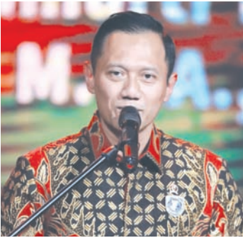
印尼基础设施和区域发展统筹部长阿古斯·哈里穆尔蒂·尤多约诺致辞。

【本报讯】2月2日晚，“2026客家春晚”海外分会场——“2026客家春晚·东盟（印尼）之夜”在印尼国家电视台圆满完成录制。这场跨越山海的文化盛宴，是梅州市广播电视台《客家春晚》自2019年首次走出国门以来，规格最高、规模最大的一次海外分会场录制，不仅为马年新春增添了浓郁年味，更以乡情为纽带，奏响了中印尼文明互鉴的动人乐章。