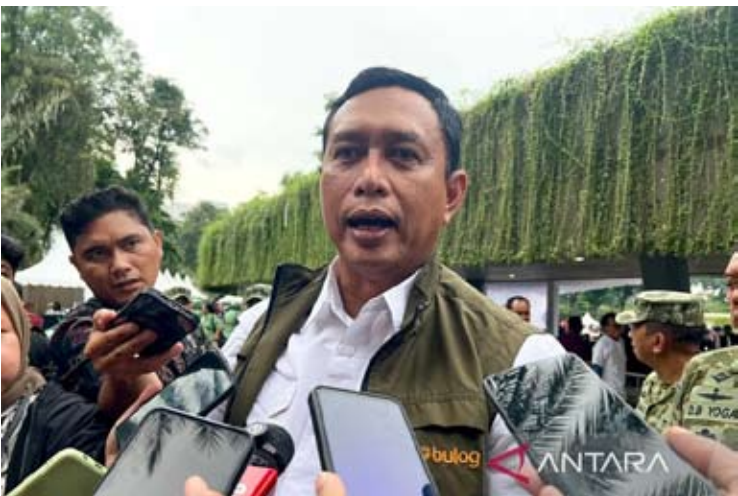
国粮署署长艾哈迈德·里扎尔·拉姆达尼在雅加达2026年丰收节研讨会的媒体采访环节中回答记者提问。

因此，国粮署是国家拥有的一家机构或国有企业，其职责是负责保障后勤供应。目前，我们暂时将重点放在大米和玉米