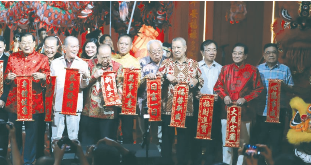
与会华社贤达向大家送上新春祝福。