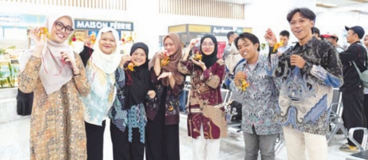
印度尼西亚民众收获满载新年祝福的广西绣球。