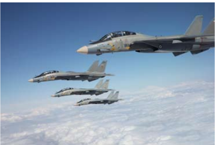
伊朗空军的F-14战斗机

穆萨维在伊朗空军日发表声明称，空军在加强主动威慑、提升防御能力以及应对敌方威胁方面正发挥日益关键的战略作用。伊朗不会主动发动战争，但将毫不犹豫地捍卫国家安全和核心利益和领土完整。 他警告，任何冒险行为不仅可能导致对手遭遇战略失败，还可能将冲突扩大至整个地区，并给策划者和支持者带来沉重代价。 在军事表态趋于强硬之际，伊朗外交层面亦释放明确信号。 伊朗外长阿拉格齐8日表示，美国在该地区的军事部署“吓不倒伊朗”。他强调，伊朗为和平核计划付出了巨大代价，没有任何国家有权规定伊朗“应该拥有什么、不应该拥有什么”。 阿拉格齐指出，伊朗不寻求核武器，但其合法权利必须得到尊重；