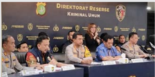
雅加达首都特区警察厅刑侦处处长、伊曼·伊马努丁准将 (右二) 与雅加达西区警察局刑侦科科长、阿尔凡·祖尔坎·西帕云上校 (左二) 在雅加达大都会警察局举行新闻发布会。

【本报讯】雅加达大都会警察局一般刑事调查局与雅加达西区警察局刑事调查组破获一起儿童贩卖案件，并确定了10名犯罪嫌疑人。