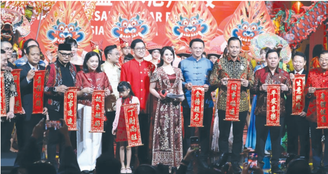
与会政要和华社贤达向大家送上新春祝福。