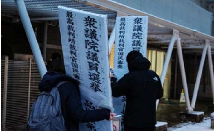
2月8日，在日本东京，工作人员在一处投票站外放置投票站标志。

装以及伊拉克一些获伊朗支持的民兵组织。 据以色列媒体此前报道，内塔尼亚胡原计划2月18日至22日访问华盛顿。 伊朗和美国6日在阿曼首都马斯喀特举行核问题间接谈判。伊朗外交部长阿拉格齐在谈判结束后表示，谈判开局良好，双方已就继续谈判达成共识。特朗普说，美伊下周早些时候将继续谈判。 阿拉格齐7日说，伊朗在伊美谈判中有两条“红线”：伊朗不会放弃铀浓缩，也不会就本国导弹事宜进行谈判。