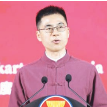
中国驻东盟大使王擎致辞。