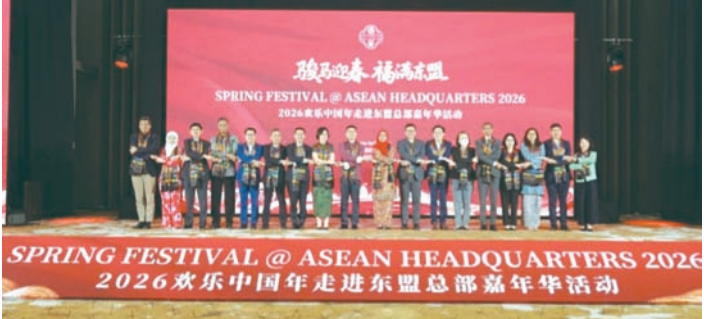
中国驻东盟大使、广西主办方代表与东盟11国常驻代表手拉手合影。

此次嘉年华活动吸引了人民日报、新华社、中央广播电视总台、中新社、印尼国家电视台、印尼美都电视台、博龙网、越通社等20余家媒体到现场报道，把春节所蕴含的和平、和睦、和谐等理念向海内外民众进行广泛传播。