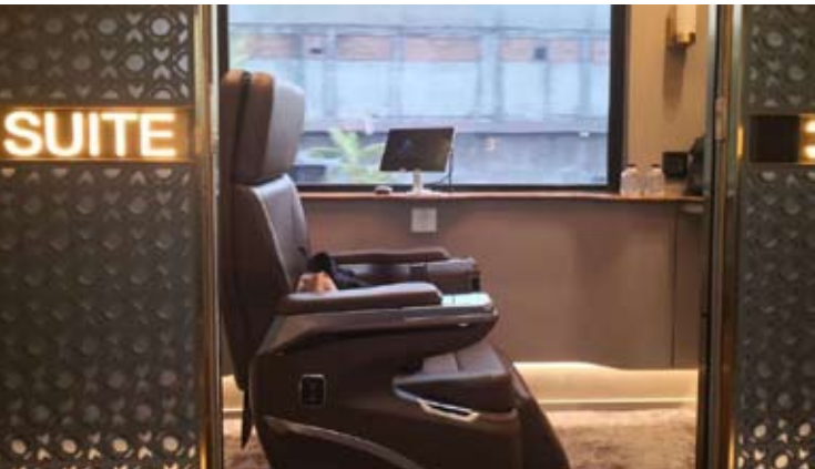
印尼铁路公司列车的豪华包厢。

每个包厢车厢配备自动滑门、可180度平躺的座椅、座椅按摩和加热功能、列车车载信息娱乐系统，以及全程提供完善餐饮服务，以保障旅途舒适。(lcm)