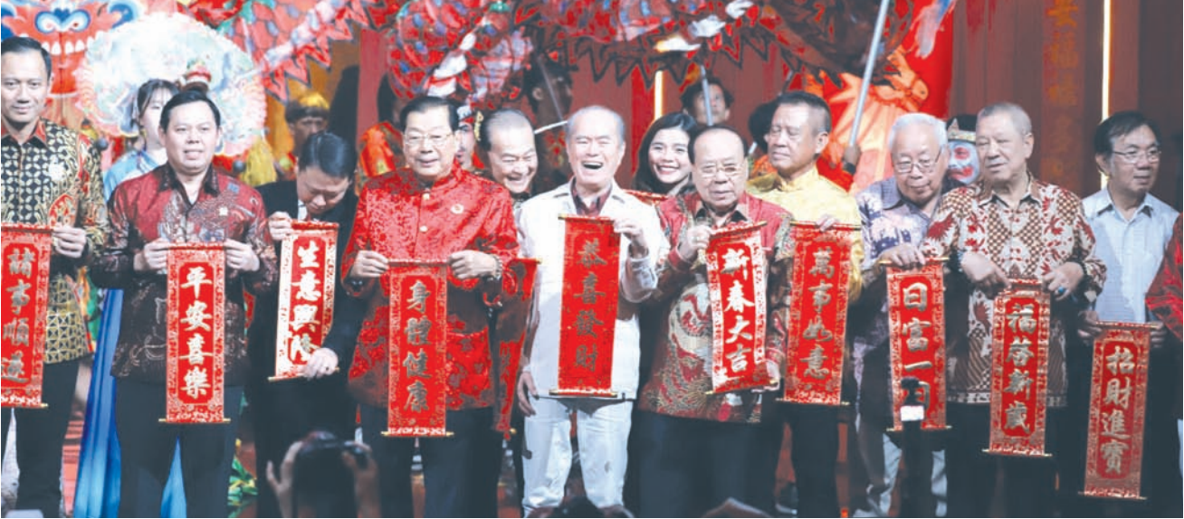
与会政要和华社贤达给大家送上新春祝福。