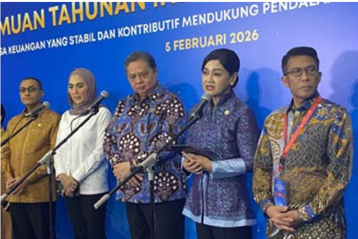
图为：OJK代理主席Friderica Widyasari（右二）与经济统筹部长Airlangga Hartarto（中）、印尼国会第十一委员会主席Mukhamad Misbakhun（右）于2月5日（周四）晚在雅加达出席2026年金融服务业年度会议（PTIJK）后，接受媒体“堵访”（doorstop）并回答记者提问。

【本报讯】在持续推进印尼资本市场诚信改革议程的背景下，印尼金融服务管理局（OJK）设定目标，力争2026年资本市场融资规模达到250万亿盾。 众所周知，作为对摩根士丹利资本国际（MSCI）相关政策发布后市场变化的回应，OJK已推出八项加速资本市场诚信改革举措。 OJK代理主席Friderica Widyasari于2月5日（周四）在雅加达举行的2026年金融服务业年度会议（PTIJK）上表示，当前资本市场的动态变化，正成为一次重要的反思契机。 “我们意识到，单纯追求高速增长并不足以支撑资本市场的长期发展，必须通过系统性改善，推动资本市场实现更高质量的增长，”她指出。 Friderica进一步表示，作为落实改革承诺的具体步骤，OJK将尽快成立资本市场诚信改革专项工作组（Satgas/Task Force），以确保八项行动计划按照既定时间表稳步推进并落地实施。 在同一场合，Friderica也披露了对其他金融领域的前景展望。其中，银行业信贷预计将同比增长10%至12%，并由第三方资金（DPK）同比增长7%至9%提供支撑。 此外，保险业资产规模预计同比增长5%至7%，养老基金资产增长10%至