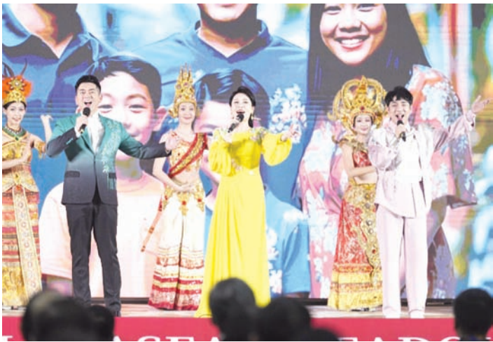
歌舞表演《阿依莎娜妮娅》唱响中国—东盟友谊之歌。