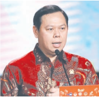
印度尼西亚共和国区域代表理事会主席苏丹·巴赫蒂亚尔·纳贾穆丁致辞。