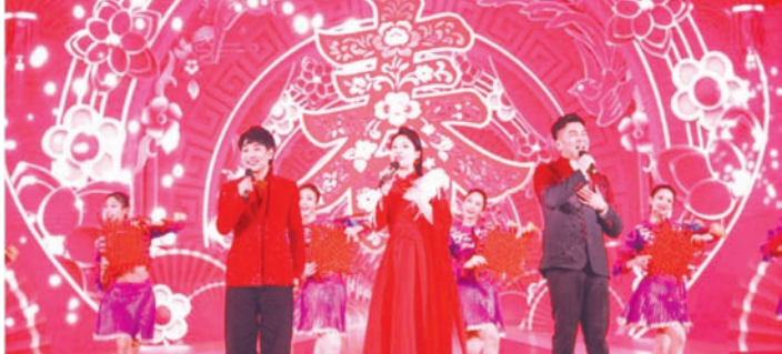
开场歌舞表演《春和万象·同启新章》拉开活动序幕。