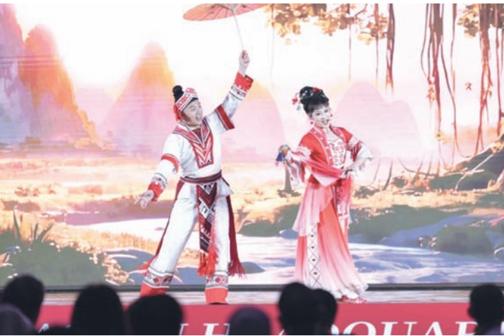
中国广西非遗文化瑰宝彩调剧《刘三姐》经典选段“盘歌”。