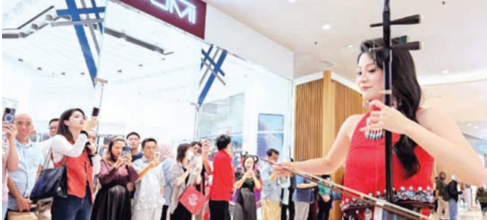
精彩的二胡演奏吸引众多印度尼西亚民众驻足欣赏。