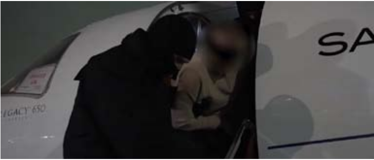
嫌疑人被从迪拜引渡回俄

【新华社莫斯科2月8日电】俄罗斯联邦侦查委员会8日说，袭击俄军中弗拉基米尔·阿列克谢耶夫的一名嫌疑人在阿联酋迪拜被拘捕。这名嫌疑人受乌克兰情报部门指派。 俄联邦侦查委员会当天在官网上说，这名嫌疑人于2025年12月抵达首都莫斯科准备实施袭击。在袭击过程中，他使用带消音器的马卡洛夫手枪至少开