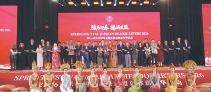
出席活动嘉宾、演出人员合影。