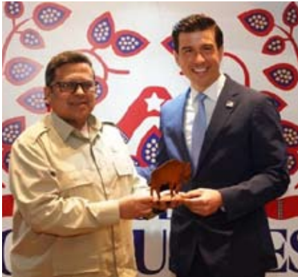
BPJPH与USDA代表团本周二在雅加达君悦酒店举行会议。

美国农业部代表团还阐述了通过海外合作倡议扩大农业贸易的战略计划，该计划目标为一年