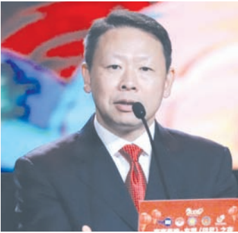
中国驻印尼大使馆公参兼总领事郑杰致辞。