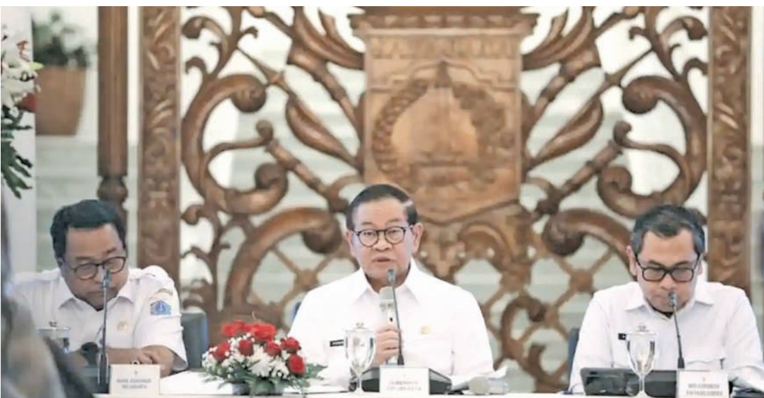
雅加达省长普拉莫诺认为，2025年雅加达经济增长5.21%是大家共同努力的结果，从政府、商界到社会各界。

参照世界银行的分类，雅加达居民支出不平等仍处于中等不平等类别。尽管如此，雅加达的不平等问题仍被视为一项待完成的任务。雅加达特区地方议会D委员会主席尤克·尤丽克