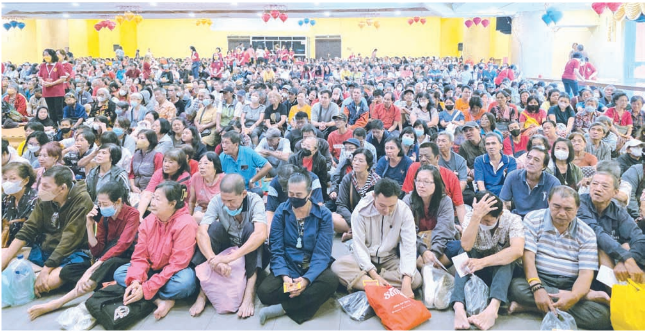
受患者等待领取爱心礼篮。