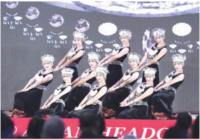
中国少数民族风情歌舞《大美中国·桂风壮韵》。