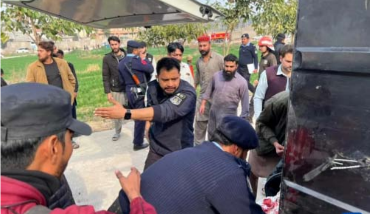
2月6日，在巴基斯坦首都伊斯兰堡，警察将伤者送往医院（手机照片）。

克谢耶夫开枪，随后逃离现场。俄罗斯媒体报道，阿列克谢耶夫成功接受手术，暂无生命危险。