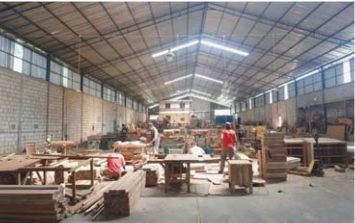
政府通过劳动密集型产业信贷计划扶持日巴拉(Jepara)家具产业。