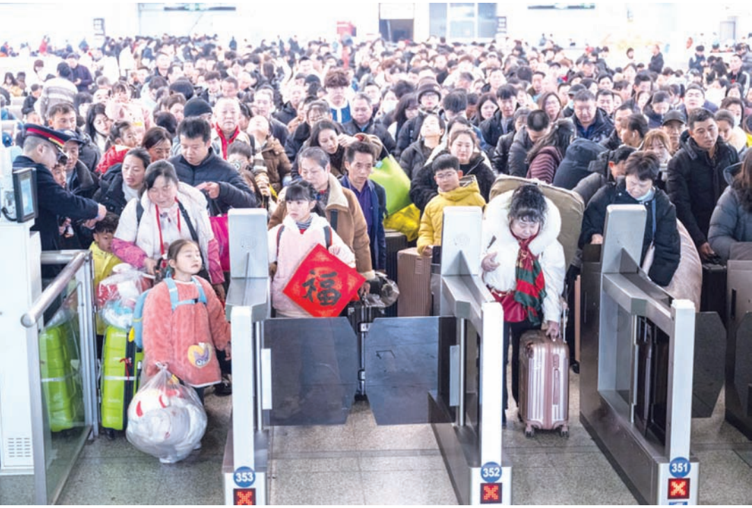
2月2日，在湖北省武汉市汉口火车站，旅客进站乘车。

点推出“雪具便利行”服务，支持线上预约和列车专门存放。 位于“九省通衢”之地湖北武汉的汉口站，春运首日已经迎来首波客流高峰。经过“硬件大改造”后的汉口站，上新4500块显示屏，增加100余个充电插座，新引入一批餐饮商户，针对老幼病残孕等重点旅客设置综合服务区。 “我们有专人为特殊重点旅客进行一对一地送站和接站服务，满足特殊重点旅客的需求。”汉口站值班站长席珊珊说。 记者从上海铁路部门了解到，春运期间，上海四大火车站将服务升级落实于各个细节中。 上海南站客运车间党总支书记金鼎表示，业总支副书记金鼎表示，业四生驻站服务，全面推行“轻装行”行李寄送服务；畅通急客进站通道，为临近开车的旅客及老幼病残孕重点旅客提供优先验证、优先安检、优先检票、“三优先”服务，统一张贴服务标识；推进“暖手工程”，节前全面排查维护各站区厕所电热水器与“小厨宝”。