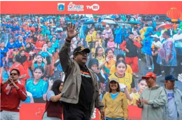
雅加达特区副省长拉诺·卡尔诺于2月8日（周日）出席在雅加达印尼酒店环形路口举办的2026年“雅加达多彩节”（JPW）活动。

主的经济、强大的民族”。2月9日被定为国家新闻日，依据是1985年第5号总统令，该法令同时也标志着印尼记者协会（PWI）于1946年在梭罗市成立。（pl）