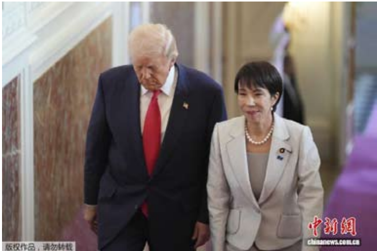
2025年10月28日，美国总统特朗普与日本首相高市早苗在东京会晤。

【中新网2月9日电】综合外媒报道，当地时间8日，美国总统特朗普发文，对高市早苗以及由日本自民党和日本维新会组成的执政联盟，在当天举行的日本众议院选举中获得过半数议席，表示祝贺。 据报道，特朗普在社交媒体“真实社交”上发文称，“很荣幸”支持高市早苗及其执政联盟，“热情投票的日本人民将永远得到我的坚定支持”。 据日本广播协会报道，在8日举行的日本众议院选举中，由自民党和日本维新会组成的执政联盟获得过半数议席。其中，自民党获得316个议席，日本维新会获得36个议席。 在野党方面，由立宪民主党和公明党共同组建的新党“中道改革