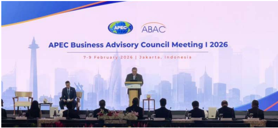
2026年2月7日，印尼经济统筹部长艾尔朗加·哈尔塔托在雅加达出席2026年APEC工商咨询理事会（ABAC）第一次会议开幕式。