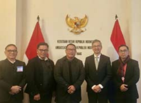
巴淡岛开发局代表团在荷兰海牙的印尼大使馆开展推广任务，与欧洲的利益相关方和企业界进行交流。

随后在荷兰，该局通过印尼荷兰企业家协会展开对话，并会见印尼驻荷兰大使以加强欧洲投资者联动。