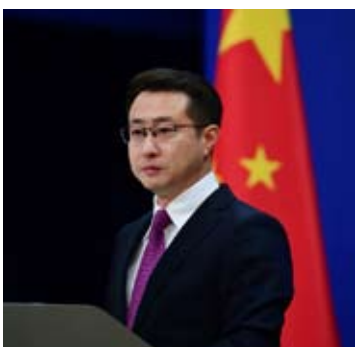
2026年2月9日外交部发言人林剑主持例行记者会

【新华社北京2月9日电】在2月8日举行的日本众议院选举中，由自民党和日本维新会组成的执政联盟获得过半数议席。外交部发言人林剑2月9日在例行记者会上回答有关提问时表示，选举是日本的国内事务，但本次选举反映的一些深层次、结构性问题以及思潮、动向、趋势，值得日本各界有识之士和国际社会深思。殷鉴不远，不可不察。 林剑说，中方敦促日本执政当局正视而不是漠视国际社会的关切，走和平发展道路而不是重蹈军国主义覆辙，恪守中日四个政治文件而不是背信弃义。日本极右翼势力若误判形势、恣意妄为，必将遭到日本人民的抵制和国际社会迎头痛击。 林剑说，中方对日政策始终保持稳定性和连续性，