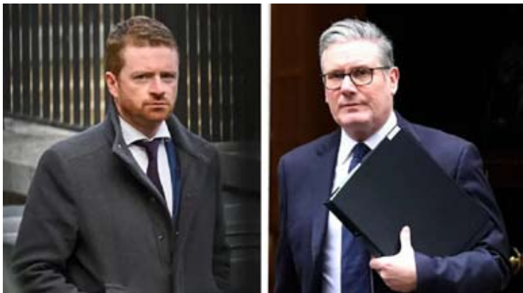
英国首相办公厅主任摩根·麦克斯威尼8日因英国前驻美国大使彼得·曼德尔森涉爱泼斯坦案引咎辞职。

【新华社北京2月9日电】挪威外交部8日说，已启动对挪威驻约旦及伊拉克大使莫娜·尤尔的调查。这名资深外交官因与已故美国富商爱泼斯坦有关联而辞职。同日，英国首相办公厅主任摩根·麦克斯威尼8日因英国前驻美国大使彼得·曼德尔森涉爱泼斯坦案引咎辞职。 自美国司法部陆续公布爱泼斯坦案相关文件以来，该案持续发酵，影响不断外溢，在大西洋两岸接连投下重磅“炸弹”。 辞职、道歉、调查，多国陷入“风暴眼”。 挪威外交大臣埃斯彭·巴尔特·艾德8日在声明中说：“尤尔与被定罪的性犯罪者爱泼斯坦接触表明她的判断严重失误。这一事件让她难以重建履职所必需