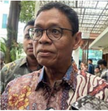
印尼能源与矿产资源部副部长尤利奥特·丹绒

政府同步完善多项配套政策措施，包括收益分成安排、成本回收（cost recovery）与总分成（gross split）合同机制、国内市场义务（DMO）价格政策，以及通过油气数据资源库（Migas Data Repository）提升数据获取便利度。