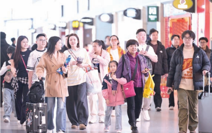
2月2日在北京首都国际机场航站楼拍摄的出行旅客。