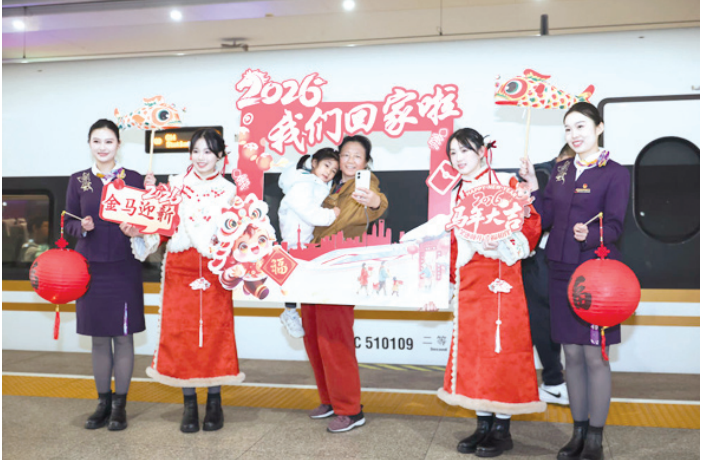
2月2日，在上海虹桥火车站，旅客和铁路上海客运段乘务员在G14列车外打卡合影。