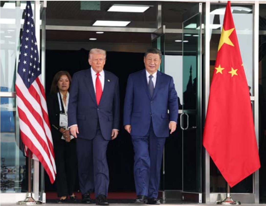
当地时间10月30日，国家主席习近平在釜山同美国总统特朗普举行会晤。

2月4日晚，国家主席习近平同美国总统特朗普通电话。此次通话为2026年全年中美关系的发展定调，也为当前阶段的双边互动明确了方向。习近平主席在通话中强调，双方应“不以善小而不为，不以恶小而为之，一件事一件事去做，不断积累互信”。这既是中华传统智慧的时代表达，也是对美方的明确提醒：大国相处，最忌空谈、最怕反复，在互动中做到善小必为、恶小必戒，是中美两国积累互信的可靠路径。