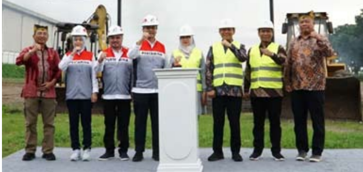
2026年2月6日，PT Sinergi Gula Nusantara、北塔米纳新能源与可再生能源公司与达南塔拉在东爪哇外南梦举行生物乙醇工厂项目奠基仪式。

与此同时，Glenmore生物乙醇工厂项目由北塔米纳新能源与可再生能源公司与印尼糖业企业PT Sinergi Gula Nusantara联合实施。该项目以甘蔗为原料，计划年产3万千升