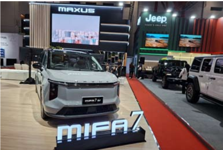
图为MAXUS MIFA7。

与此同时，MIFA 9定位为一款高端电动MPV，配备90千瓦时电池，续航里程可达520公里(NEDC