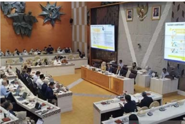
国会副议长Sufmi Dasco Ahmad在雅加达议会大厦主持召开会议，与多位部长讨论暂停医保受益人相关问题。

该决定自2026年2月1日起生效，内容涉及参保调整、部分PBI JK参与者被暂停注册，由新参与者取代。然而，部分PBI JK参与者注册被暂停，并不意