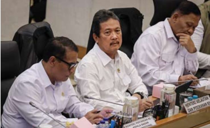
印尼海洋与渔业部长萨克蒂·瓦赫尤·特伦戈诺(中)。

【本报讯】印尼海洋与渔业部长萨克蒂·瓦赫尤·特伦戈诺(Sakti Wahyu Trenggono)称，在斋戒月至开斋节期间，鱼类食品的库存或供应状况安全。目前，全国鱼类产量预计达到357万吨。