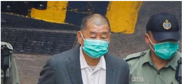
香港特区高等法院今（9）日宣判，黎智英因两项串谋勾结外国势力罪及一项串谋发布煽动刊物罪被判监禁20年。

【中新网北京2月9日电】外交部发言人林剑9日主持例行记者会。 香港特区高等法院9日宣判，反中乱港分子黎智英因两项串谋勾结外国势力罪及一项串谋发布煽动刊物罪被判监禁20年。会上有记者就此提问，英国首相斯塔默访华期间提及黎智英案件，中方对量刑有何评论？ 林剑：我首先要指出的是，黎智英是中国公民。黎智英是一系列反中乱港事件的主要策划者和参与者，其行为严重冲击“一国两制”的原则底线，严重危害国家安全，严重损害香港的繁荣稳定和市民的福祉，理应受到法律的严惩。 香港是法治社会，特区司法机关依法履职尽责，维