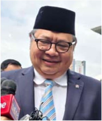
经济统筹部长艾尔朗加·哈尔塔托。

【本报讯】经济统筹部长艾尔朗加·哈尔塔托称，与免费营养餐(MBG)计划相关的支出预计在2026年第一季度将达到约80万亿盾。