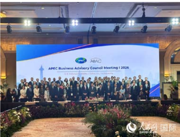
2026年亚太经合组织工商咨询理事会首次会议与会各国嘉宾合影。

绍了中方对APEC“中国年”的总体考虑，鼓励工商咨询理事会聚焦务实合作，为领导人会议贡献高质量成果。 会议期间，亚太工商界代表围绕区域经济一体化、可持续发展、数字创新和互联互通四大重点领域深入交流，提出多项建设性提案，确定“开放、互通、协同”作为年度主题，呼吁亚太地区保持市场开放、加快经济一体化进程、强化创新合作。会上，由中方倡议恢复设立的互联互通工作组获得各方广泛支持。 据了解，作为APEC机制中唯一代表工商界的常设机构，工商咨询理事会肩负着向领导人会议传递