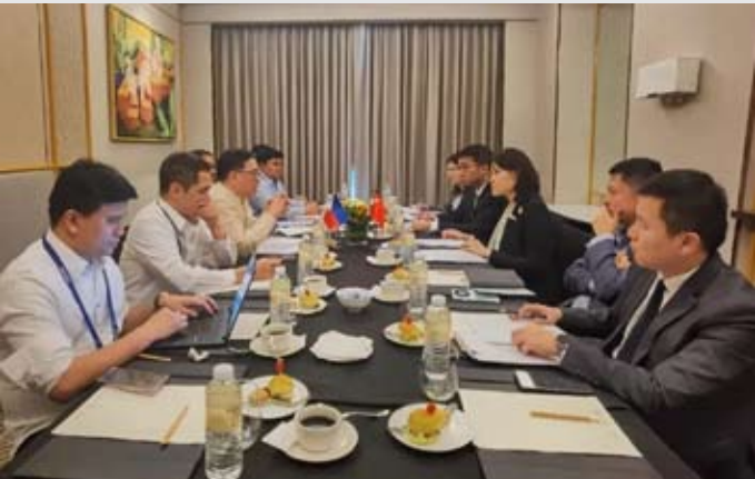
2026年1月29日，中菲外交部官员在菲律宾宿务举行了双边会见，就涉海等共同关心的问题坦诚深入交换了意见。