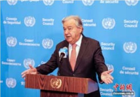
资料图：古特雷斯。

日，埃及、约旦、阿联酋、印度尼西亚、巴基斯坦、土耳其、沙特阿拉伯和卡塔尔八国外长发表联合声明并表示强烈谴责。