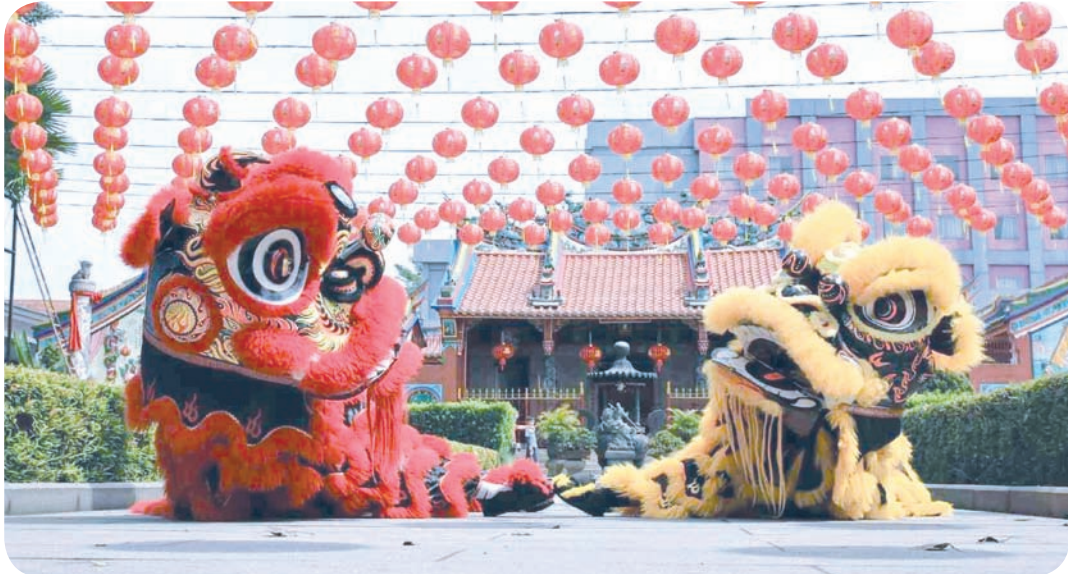
8. 雅加达特区政府筹备了以“努山达拉新春和韵”为主题的2026年雅加达新春系列活动，在首都多个公共空间举行。活动自2026年2月中旬持续至3月初，涵盖文化、艺术及娱乐项目，面向公众开放。庆典将在苏迪尔曼-谭林大街、印尼大酒店环岛、班芝兰广场及唐人街等多个战略区域展开。雅加达省政府致力于将此庆典打造为包容、安全、欢庆的文化表达空间，惠及全体市民。