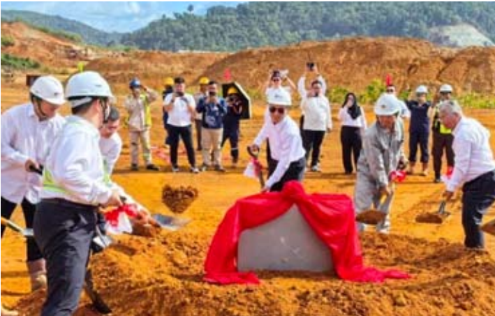
Petrindo Jaya Kreasi (CUAN) 公司在北马鲁古省东哈马黑拉县为大型发电厂项目举行奠基仪式。

由空调、冰箱、洗衣机、电视，以及视听产品和小家电等多个主要品类的销售所支撑的。夏普还成功保持了其市场领导地位，空调产品市场占有率为 21.2%，冰箱为 33.2%，和洗衣机为 26.1%。 “2025 年的成就证明了消费者对夏普的信任。在经济挑战和日益激烈的行业竞争中，我们庆幸能够实现积极增长，并巩固夏普在印尼电子市场中的地位。”他于周六(2月7日)在东爪哇省琅琅市表示。 他续说，在创新方面，2025 年是一个重要的里程碑，推出了多款新产品，包括 Aquos Sense 10 和 Aquos R10 智能手机、国产化率 (TKDN) 的大屏电视、带有 LED 温度显示功能的空调，以及最新的家用产品系列。 除了产品开发，夏普还通过整合数字活动、公共关系、品牌激活、大众媒体广告，以及经销商、次级经销商和电子商务层面销售活动的 360 度营销方式来加强营销策略。 与三丽鸥 (Sanrio) 合作的“你好，舒适，科技与舒适的完美融合” (Hello Comfort, where technology meets comfort) 活动成为扩大品牌影响力并与消费者建立情感联系的关键策略之一。 未来，夏普不仅聚焦于销售，还专注于我们如何通过创新、服务和相关的沟通，与消费者建立长期的体验和关系。 2025 年期间还获得多项奖项，其中是印尼产品奖、印尼绿色与可持续发展公司奖、印尼最佳品牌奖、顶级品牌奖、印尼客户体验奖，以及印尼年度公关奖和品牌传播卓越奖。 他说，进入 2026 年，印尼夏普制定了通过巩固国内市场、推出环保创新产品，以及扩大更贴近消费者的品牌和销售激活活动来加强战略。 夏普还通过开拓印尼制造的空调产品向越南出口的新机遇，将业务范围扩大到国际市场，目标是在 2026 年 1 月贡献约 10% 的份额。这一战略巩固了印尼作为夏普在东盟地区战略生产基地的角色。 “凭借 2025 年打下的坚实基础，我们乐观 2026 年将成为印尼夏普在创新、市场渗透，以及对国家电子产业贡献方面更强劲增长的一年。” (lcm/mm)