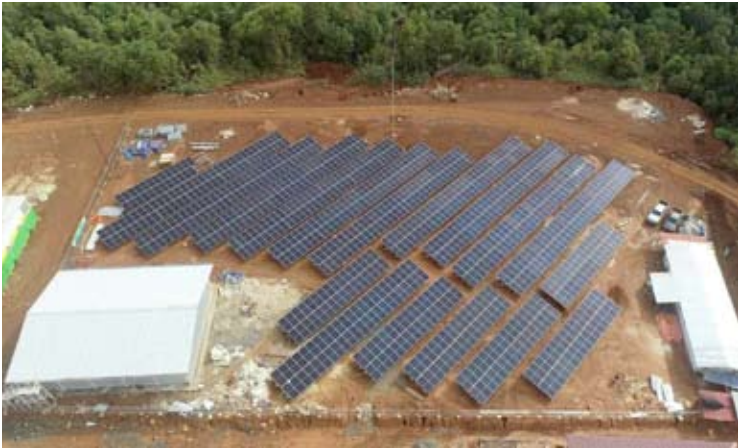
Xolare RCR Energy (SOLA) 的太阳能发电厂。

东和管理层、FHT、承包商，以及将为该发电厂项目提供融资的几家银行的代表出席。该项目估计价值约 6 亿美元，相当于 10 万亿盾。 (lcm)