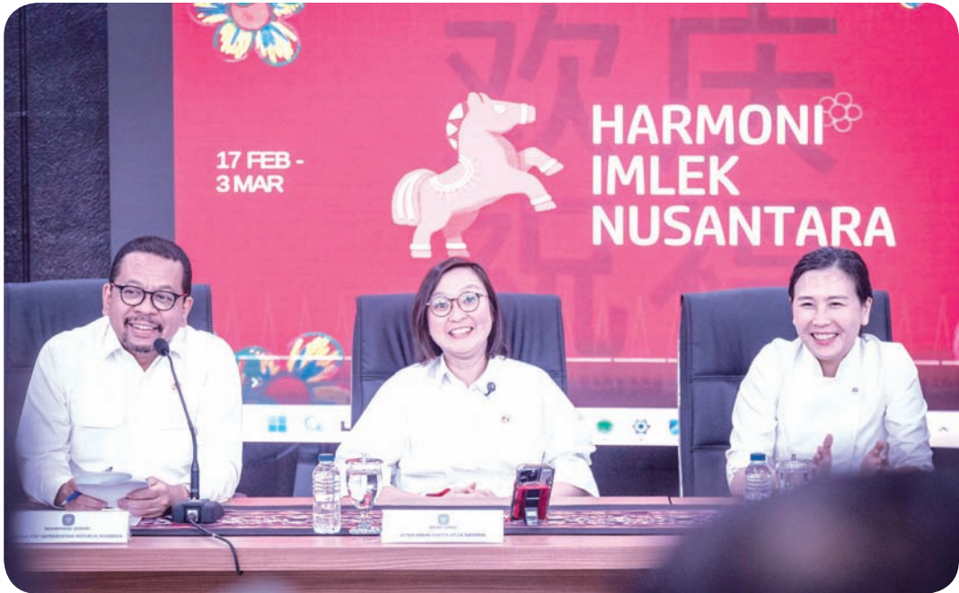
1. 总统幕僚长Muhammad Qodari（左）、国家春节委员会总主席兼创意经济副部长Irene Umar（中）以及妇女赋权与儿童保护部副部长林雪莉（右），于2026年1月28日（周三）在雅加达印尼政府通信署举行的2026年春节标志(Logo)发布会上共同出席记者会。政府将于今年2月17日至3月3日在雅加达的雄牛广场举办以“多元一体”为主题的中国春节庆祝活动，旨在弘扬宗教社群之间的多样性与和谐。