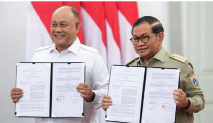
BGN负责人达丹·欣达亚纳 (左) 与雅加达特区长普拉莫诺·阿农在雅加达市政厅签署谅解备忘录后合影。

普拉莫诺坦言，对签署谅解备忘录表示欣慰。他认为雅加达省政府与国家营养机构 (BGN) 的合作，是加强从幼年阶段开始的人力资源开发的战略性举措。