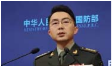
2月10日下午，国防部新闻局副局长、国防部新闻发言人蒋斌大校就近期涉军问题发布消息。

【中新社北京2月10日电】国防部新闻发言人蒋斌10日就近期涉军问题发布消息。他指出，在解放军的强大实力面前，“台独”武装若胆敢挑起战端，必遭灭顶之灾。