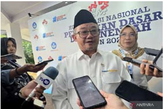
中小学教育部长阿卜杜勒·穆提在西爪哇省德波市教育部办公楼主持2026年全国中小学教育统筹活动开幕式后，与媒体进行问答交流。

普拉莫诺声称，免费营养餐计划已产生积极影响，从减少发育迟缓到抑制雅加达贫困率。不过，他未具体说明当前雅加达发育迟缓人口及贫困人口的具体数据。 (fd)