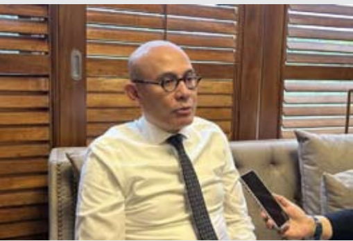
外交部副部长阿尔马纳塔·纳西尔于2月9日在雅加达外交部接受采访一瞥。

此外，该部门还通过“一村一幼儿园”项目，全力推进幼儿园教育单位建设，以增加幼儿教育基础设施数量，支持13年义务教育实施。 (fd)