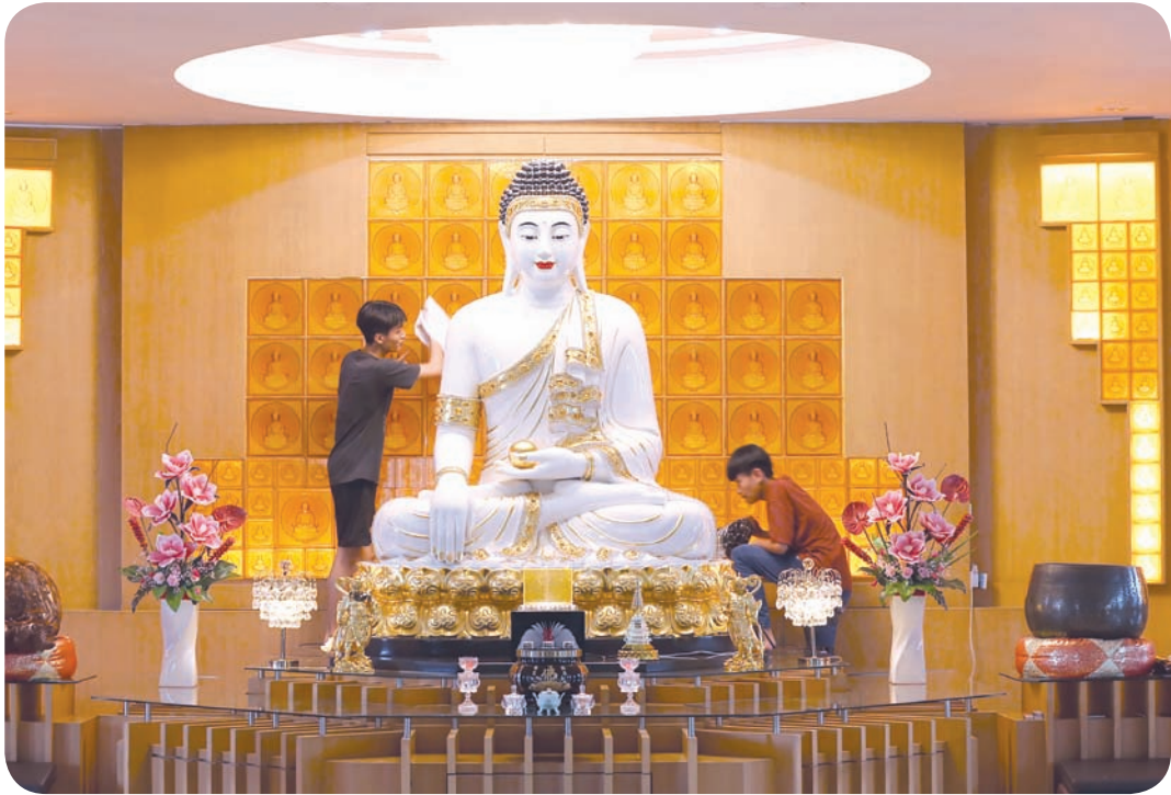
6. 2月8日，在亚齐省班达亚齐的释迦牟尼佛寺，华人族群与礼拜场所管理人员一同清洁墙壁、佛像、神像及祭坛。此次由寺院管理人员与华裔居民共同进行的佛像、神像、祭坛及整个礼拜场所的清洁工作，是为迎接2026年2月17日农历新年所做的礼拜准备。