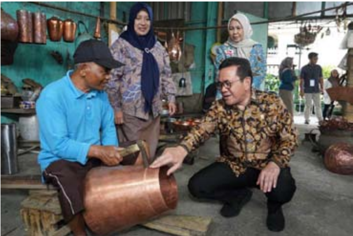
贸易部长布迪在中爪哇省 Boyolali 县参观中小微企业的手工艺工坊。

【本报讯】贸易部记录，“中小微企业勇于创新与适应出口” (UMKM BISA Ekspor) 计划在 2025 年期间共为 1,217 家企业提供了便利，实现 1 亿 3487 万美元，或约合 2.27 万亿盾的交易额。