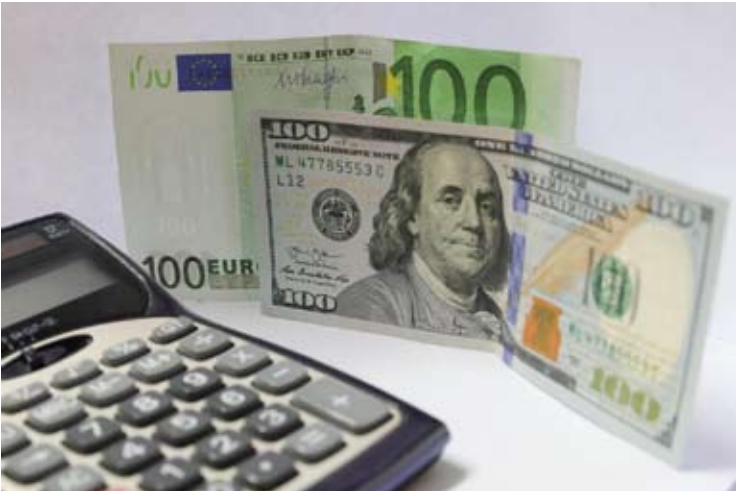
这是2022年7月7日在比利时首都布鲁塞尔拍摄的欧元（后）和美元纸币。

【新华社北京2月10日电】欧洲最大资产管理机构东方汇理说，该公司将继续减少美元资产风险敞口，转向欧洲和新兴市场。