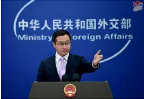
2026年2月10日外交部发言人林剑主持例行记者会。

外交部发言人林剑在例行记者会上表示，匈牙利是中国在欧洲地区的全天候全面战略伙伴。访问期间，王毅将会见匈牙利领导人，同西雅尔多外长举行会谈，就双边关系及共同关心的问题深入交换意见。中方愿同匈牙利落实两国领导人重要共识，深化战略沟通，拓展务实合作，推动中匈及中欧关系行稳致远。