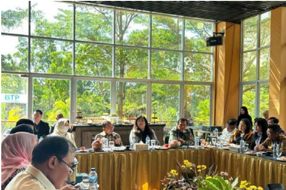
国会第七委员会主席萨勒赫·帕尔塔奥南于2月10日在廖内群岛省巴淡岛旅游理工学院主持专题工作会议讨论。