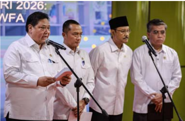
周二(2月10日)，经济统筹部长艾尔朗加·哈尔塔托(左二)在国务秘书长普拉塞蒂奥·哈迪(左一)、社会部长赛福拉·尤素夫(右二)，和劳工部长雅慈莉(右一)的陪同下，在雅加达Gambir火车站就2026年开斋节国家宗教节日经济刺激政策召开新闻发布会。

他表示，政府准备此项经济刺激措施，为推动民众购买力，同时加强需求。 “希望地方政府及相关