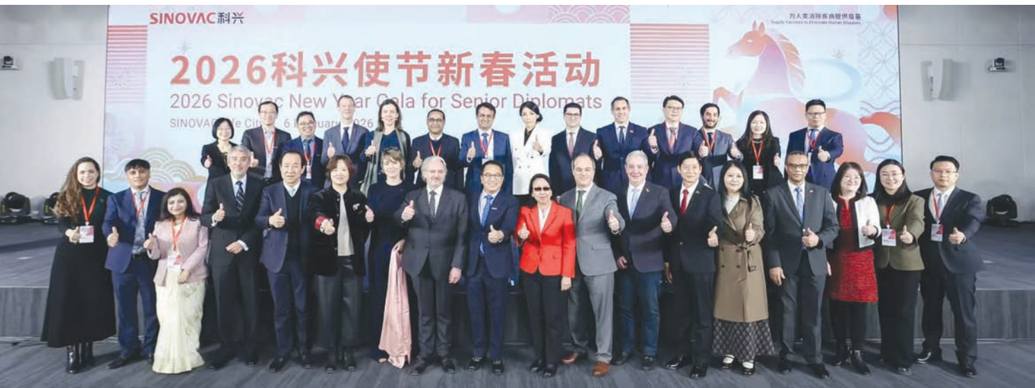
活动现场嘉宾合影。