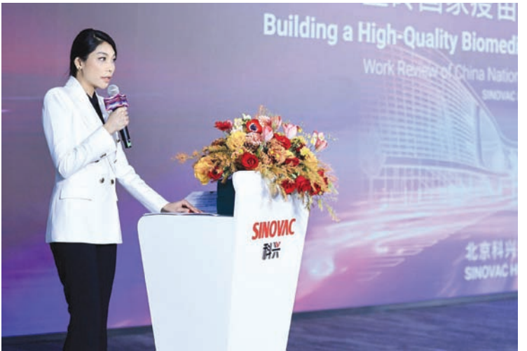
印尼驻华副大使梁玉宁致辞。

此次活动也是她与伙伴国家大使及高级外交官会面的契机，双方就生物医药产业发展及未来医疗健康合作机遇进行了探讨。