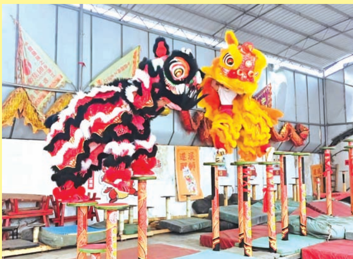
2月10日，广东湛江市遂溪醒狮保护传承基地的年轻人在进行舞狮练习。