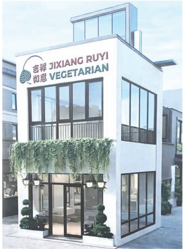
吉祥如意素食餐厅外貌一景。