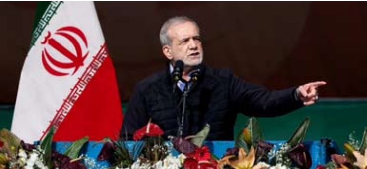
当地时间2月11日，佩泽希齐扬在伊斯兰革命胜利纪念日游行活动上发表讲话。

【新华社德黑兰2月11日电】伊朗总统佩泽希齐扬11日表示，伊朗不寻求核武器，并准备接受任何形式的核查，但不会在过度要求和公正面前退让。