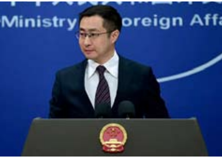
2026年2月11日外交部发言人林剑主持例行记者会

“美国指责中国开展核爆炸试验，毫无事实依据，中方反对美国为自身重启核试验编造借口。”林剑说，中方敦促美方重申五核国“暂停核试验”承诺，维护全球禁止