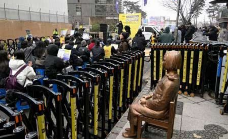
11日，韩国首尔民众在象征“慰安妇”问题的少女像前集会，要求日本正视历史并道歉。

长期以来，日本国内始终有部分势力妄图否认甚至篡改强征“慰安妇”历史。中方对日方对待侵略历史不端正、不老实的错误态度和做法严正关切，此次再次表明了立场。日方应深刻反省侵略历史，深刻反思其罪行给受害者带来的深重灾难，以诚实和负责任的态度妥善处理强征“慰安妇”等历史遗留问题，以实际行动取信于亚洲邻国和国际社会。