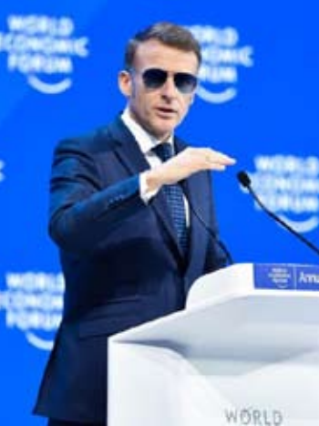
1月20日，法国总统马克龙在瑞士达沃斯举办的世界经济论坛2026年年会上讲话。

大幅增加军费；从要求欧洲承担乌克兰安全保障“主要责任”，到多次强调不排除武力夺取格陵兰岛……特朗普政府的“美国优先”不断冲击欧美关系。