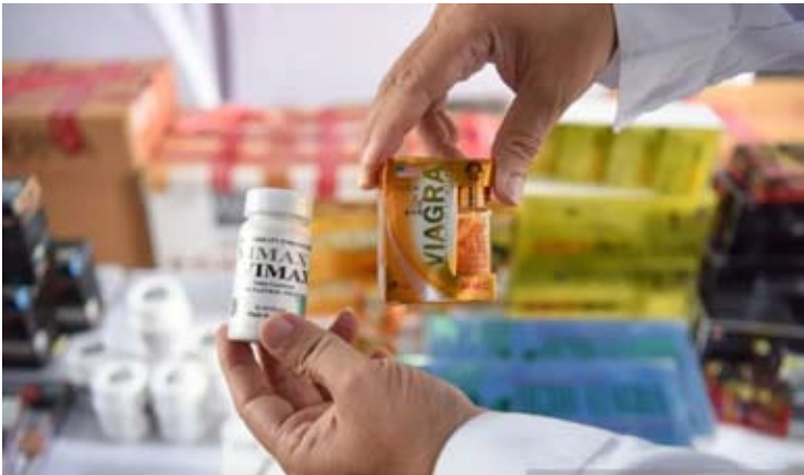
工作人员在雅加达东区Cilangkap的BBPM办公室发布非法药品仓库查处结果时，展示了一批非法壮阳药产品。

在实施开斋节交通运输工作过程中，交通部与国家警察交通总队及公共工程部部长建设总局保持协同配合。（fd）