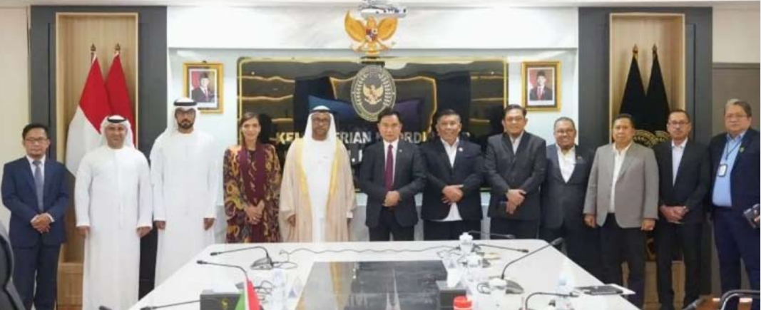
法律、人权、移民和惩教统筹部长尤斯里尔·伊扎·马亨德拉（右七）与阿拉伯联合酋长国驻印尼大使阿卜杜拉·萨利姆·阿尔扎赫里（左五）本周二在雅加达举行双边会晤。

塔鲁纳提醒，在传统草药或保健品中擅自添加处方药物成分是严格禁止的，因其可能引发严重的健康风险。可能导致的危害包括心血管系统损害、视力障碍、精神异常，若缺乏恰当医疗监督甚至可能危及生命。（fd）