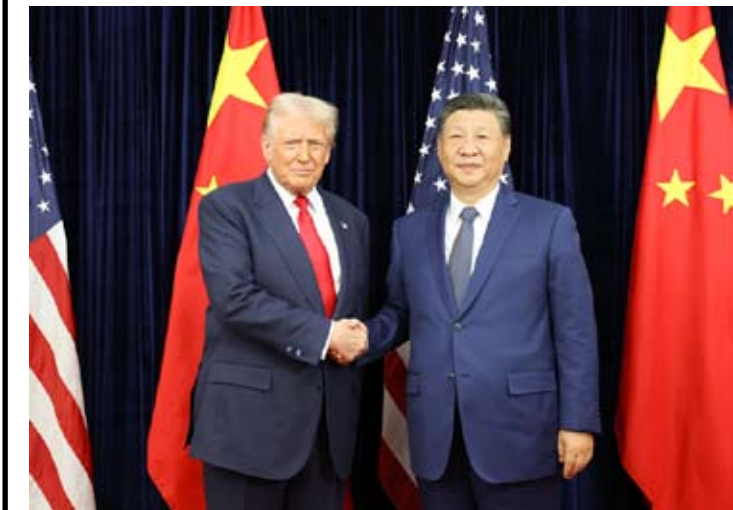
国家主席习近平同美国总统特朗普举行会晤。元首外交被视为引领中美关系发展的关键力量。（资料图）

【中新网北京2月12日电】美国总统特朗普拟于今年4月访问中国，释放出中美高层外交持续推进的重要信号。双方强调落实两国元首达成的重要共识，并通过经贸磋商机制保持各层级密切沟通，为双边关系与世界经济注入更多确定性与稳定性。