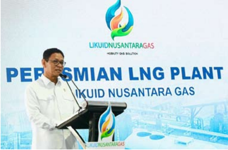
能源与矿产资源部副部长尤利奥特·丹戎。

【本报讯】能源与矿产资源部 (ESDM) 副部长尤利奥特·丹戎 (Yuliot Tanjung) 于周三 (2月11日) 主持东爪哇省岩望县帕苏鲁安工业区 (Pasuruan Industrial Estate Rembang, 简称PIER) 迷你液化天然气提炼厂的投运仪式。