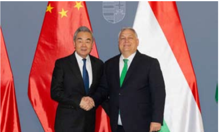
当地时间2026年2月11日，匈牙利总理欧尔班在布达佩斯会见中共中央政治局委员、外交部长王毅。

【中新社北京2月12日电】当地时间2月11日，中共中央政治局委员、外交部长王毅在布达佩斯同匈牙利外长西雅尔多举行会谈。 王毅说，中匈传统友好。在两国领导人战略引领下，双方坚持相互尊重、平等相待、互利共赢，建立起新时代全天候全面战略伙伴关系，成为新型国际关系的典范。中国企业在匈投资兴业，有力促进匈经济发展和民生改善，给人民带来实实在在的福祉。事实证明，中匈友好与合作完全符合匈牙利国家和人民根本利益，也有利于中欧关系健康发展。中方赞赏匈方奉行对华友好政策，愿同匈方继续相互支持对方维护自身正当权益，始终做匈牙利发展振兴进程中可以依靠的战略伙伴。