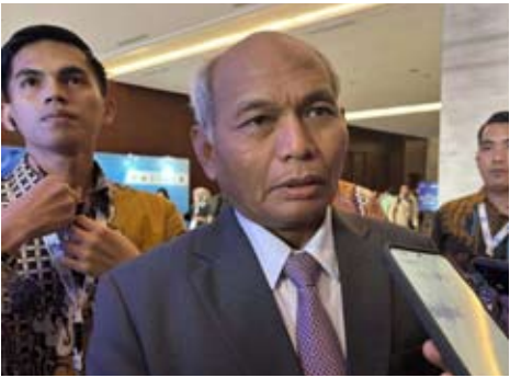
油气上游业安排机构 (SKK Migas) 局长Djoko Siswanto。