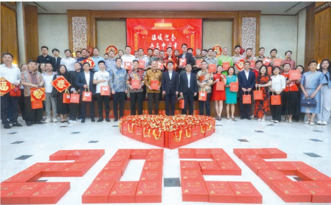
周侃公使和与会侨胞们合影留念。