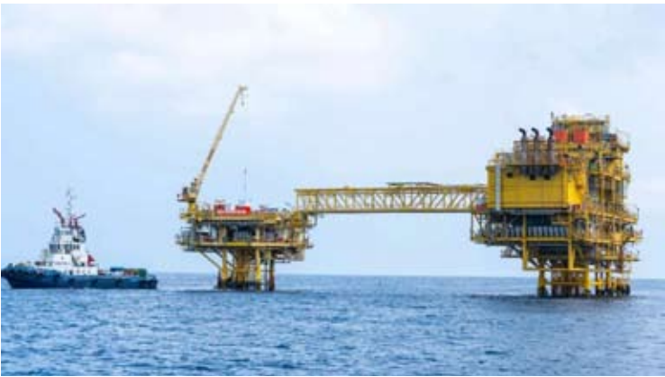
Medco Energi公司的离岸生产设施。