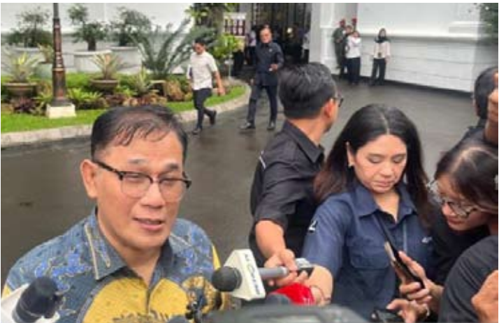
国家加速扶贫局局长布迪曼·苏贾特米科周四（2月12日）在雅京总统府出席由普拉博沃总统主持的会议后发表讲话。