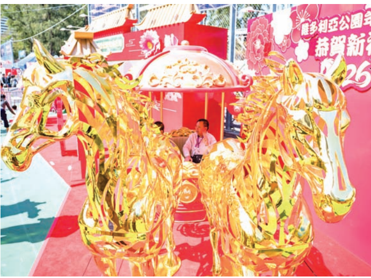
2月11日，市民在维园年宵市场内摆放的“黄金马车”新春装饰处拍照。中新社记者 侯宇 摄

中环一家酒吧内，在港生活多年的英国籍调酒师阿米尔（Amir）将中国的茉莉花茶、韩国的泡菜、日本的粕渍（日本腌制食品）等多种各国代表性食物元素融入鸡尾酒创作中，以创意的鸡尾酒迎接中国农历新年。（作者 罗英杰）