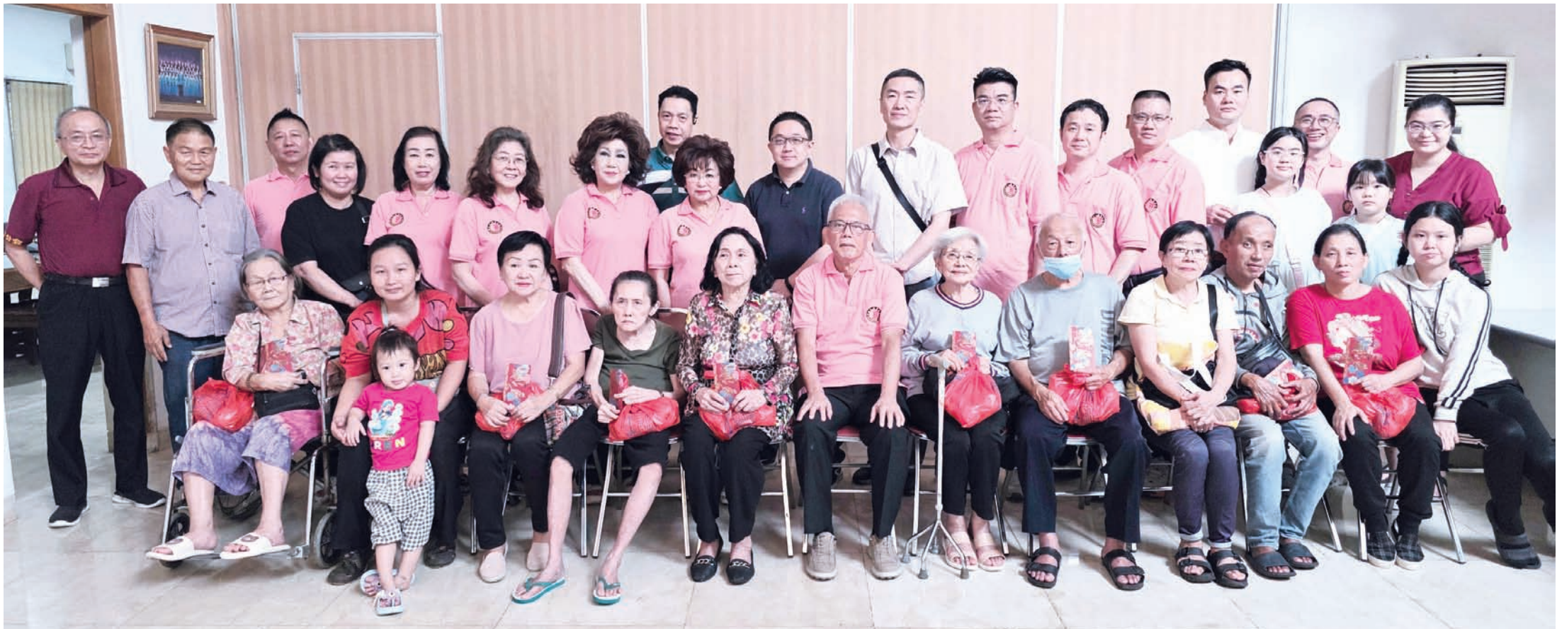
雅加达福清公会诸理事与乡亲们合影留念。