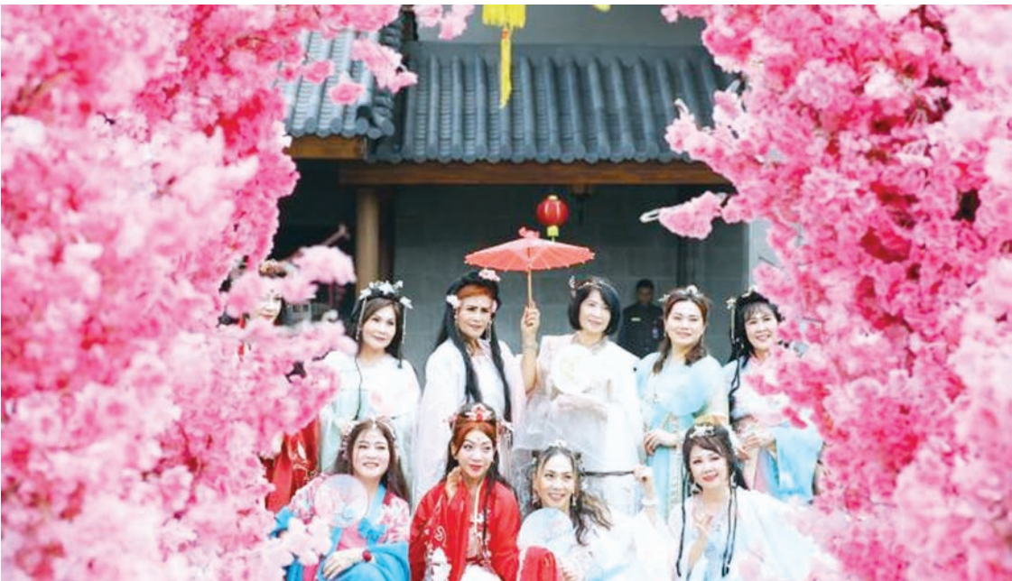
1月26日，身着各式汉服的民众在雅加达一处景点拍照留念。