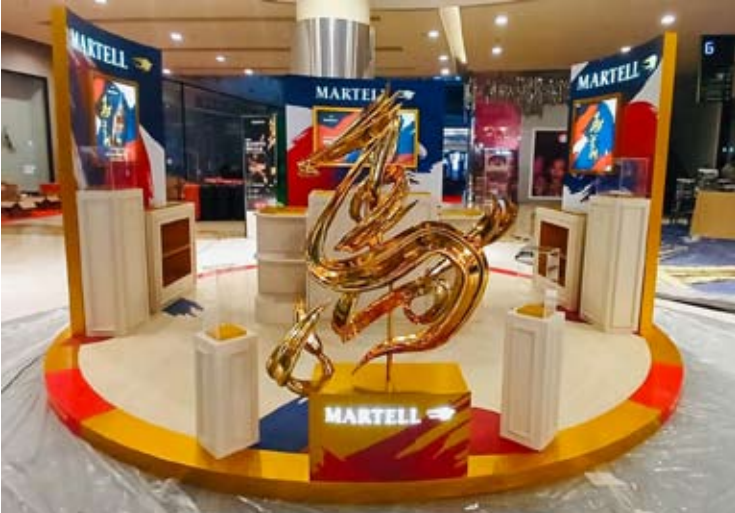
图为马爹利在雅加达举行的春节展会上展示一系列优雅的限制干邑。

【本报讯】为迎接 2026 年农历新年的喜庆氛围，马爹利 (Martell) 参与雅加达多个著名的春节展会，包括 2 月 3 日至 8 日在中央公园购物中心 (Central