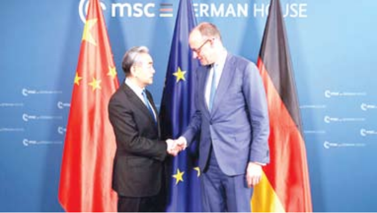
当地时间2026年2月14日，德国总理默茨在慕尼黑会见中共中央政治局委员、外交部长王毅。

【新华网2月14日电】当地时间2026年2月14日，德国总理默茨在慕尼黑会见中共中央政治局委员、外交部长王毅。 王毅首先转达中国领导人对默茨的亲切问候。王毅说，总理先生昨天在慕尼黑安全会议开幕式上的讲话，体现了德国和欧洲期待战略自主、自立自强。中方支持德国为此发挥更大作用。中国在国际舞台上提出的一切倡议，采取的一切行动，都是为维护以联合国为核心的国际体系。尽管联合国的权威和地位受到削弱，但其重要地位仍不可替代。习近平主席提出全球治理倡议，就是为了重振联合国，构建更加公正合理的全球治理体系。 在此大背景下，中德应展现大国担当，为促进世界和平与发展作出新的贡献，也期待德国成为中欧务实合作的推进器、中欧战略关系的稳定锚。 王毅表示，中德共同利益多、优势互补强，加强合作是基于两国现实需求的战略选择。中国坚持高水平对外开放，将为德国企业投资兴业提供巨大机遇。希望德方也为中国企业提供更加公平、公正的营商环境。中方愿同德方一道，筹备好下一阶段高层交往，加强各领域务实合作，探讨开展三方合作，推动中德全方位战略伙伴关系迈上新台阶。 默茨请王毅转达对中国领导人的诚挚问候。默茨表示，中国取得举世瞩目的辉煌发展成就，已成为世界性强国，在国际上发挥着举足轻重的作用。德方致力于维护基于规则的国际秩序，维护世界贸易组织地位和作用，这同中方关于全球治理的理念是一致的。德中共同坚持和践行这些理念，有益于两国，也利于世界。德中经贸关系紧密，双方都是经济全球化的受益者和支持者，我们应该抓住机遇，挖掘潜力，深化合作。德国一贯反对保护主义，倡导自由贸易，鼓励德国企业加大对华投资合作。德方奉行一个中国政策，期待同中方密切高层交往，推进各领域合作，推动德中关系取得更大发展。