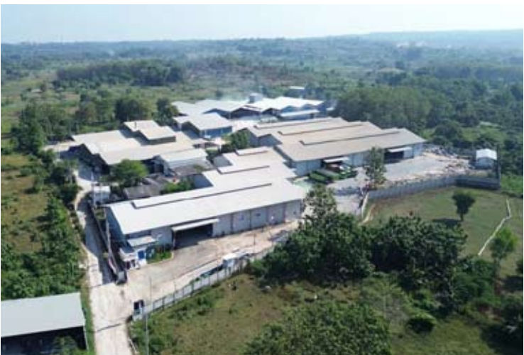
Nusa Palapa Gemilang (NPGF) 公司的生产设施。

在加强营运资本结构方面的战略举措。截至目前，NPGF 已获得 540 亿盾的银行信贷额度，因此公司拥有坚实的需求组合和充足的融资能力来执行增长战略。