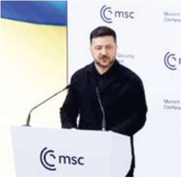
2月14日，在德国慕尼黑，乌克兰总统泽连斯基在慕尼黑安全会议上发表讲话。

泽连斯基在演讲中说，乌方希望即将举行的新一轮乌美俄三方会谈能严肃、具有实质性且有益于各方。 此前，由乌美俄三国代表组成的安全问题工作组在阿联酋首都阿布扎比举行两轮会谈，俄方代表团均由俄武装力量总参谋部情报总局局长科斯科夫率领。俄总统新闻秘书佩斯科夫13日说，新一轮会谈将于17日至18日在瑞士日内瓦举行，俄代表团将由俄总统助理梅金斯基率领。