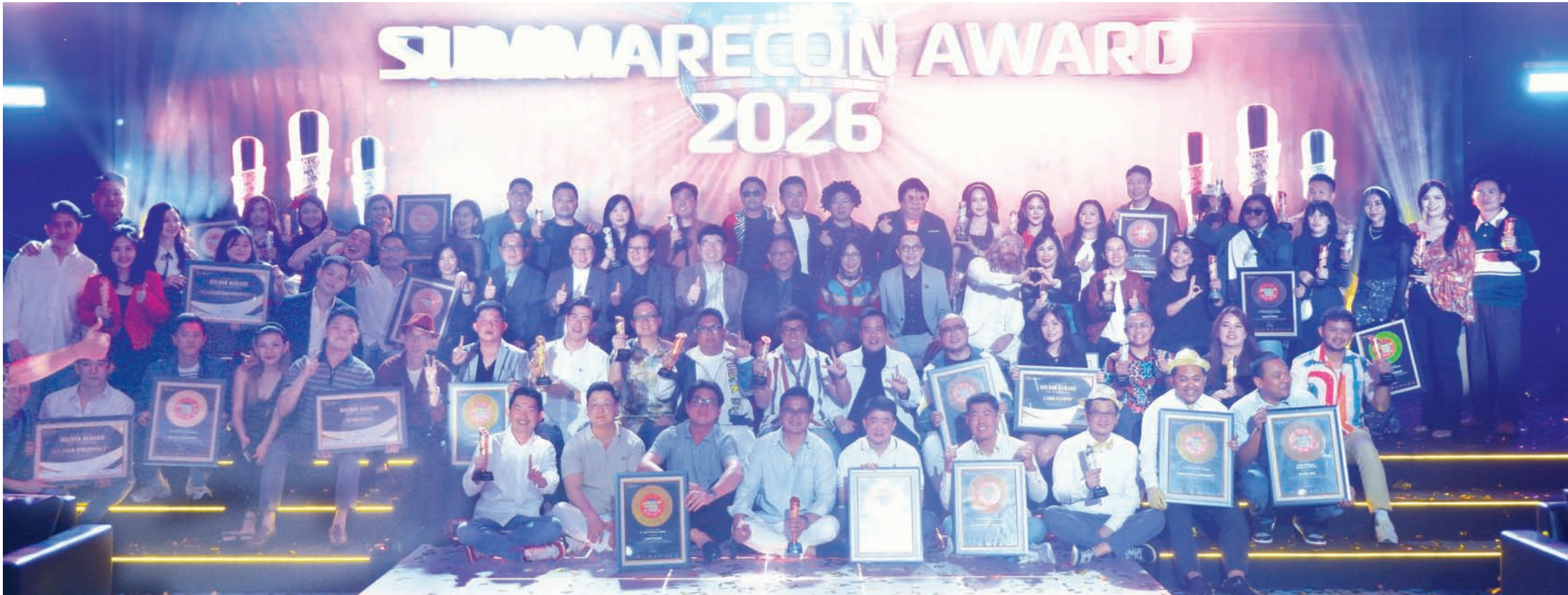
Summarecon 董事及管理层与 Summarecon Awards 2026 全体获奖者合影留念。