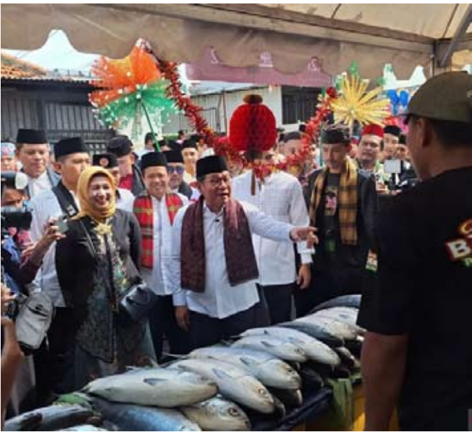
雅加达特区长普拉莫诺·阿农出席于周六在雅加达举行的拉瓦贝隆鲷鱼节。

【本报讯】雅加达特区政府声称，雅加达西区拉瓦贝隆（Rawa Belong）鲷鱼节是维护贝塔维文化的方式之一。 周六（14/2），普拉莫诺·阿农在雅加达西区拉瓦贝隆鲷鱼节现场对记者透露，“作为雅加达省长，我对贝塔维社区居民举办2026年拉瓦贝隆鲷鱼节表示赞赏。” 普拉莫诺认为，这项活动不仅仅是售卖鲷鱼，更是必须共同维护和传承的贝塔维人传统与文化。 因此，他表示，希望此类节日能够持续举办，以弘扬贝塔维文化，同时为当地居民带来经济效益。 “所有的活动，所有