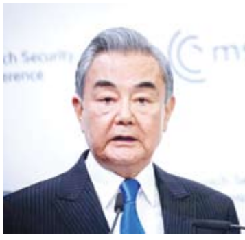
2月14日，中共中央政治局委员、外交部长王毅在第62届慕尼黑安全会议“中国专场”发表主旨讲话。

【新华社德国慕尼黑2月14日电】2月14日，中共中央政治局委员、外交部长王毅在第62届慕尼黑安全会议“中国专场”发表主旨讲话，围绕改革完善全球治理、践行真正多边主义、推动止战促和等阐明中方立场主张。 王毅表示，当前国际局势变乱交织，单边主义、阵营对抗抬头，人类和平与发展事业站在新的十字路口。习近平主席提出的全球治理倡议，倡导践行主权平等、国际法治、多边主义、以人为本、行动导向五大原则，为构建更加公正合理的全球治理体系提供了重要指引。面对风高浪急的国际环境，各国应同舟共济，通过改革完善全球治理校正历史航向。