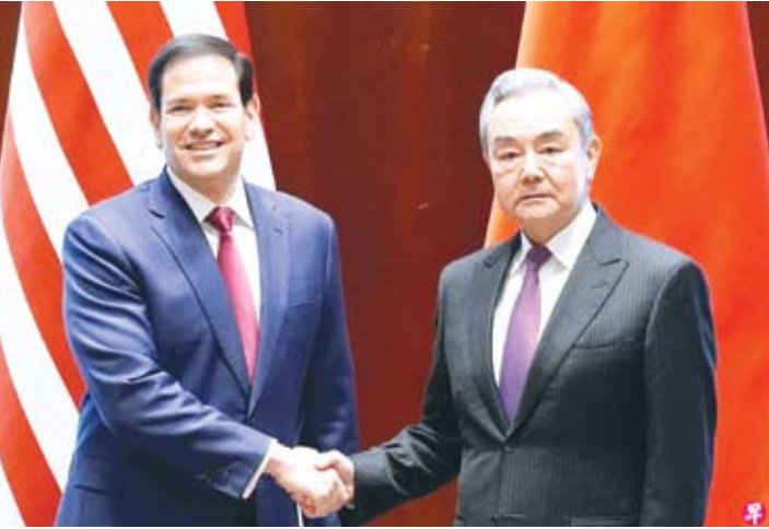
美国国务卿鲁比奥（左）星期五（2月13日）在德国慕尼黑安全会议举行期间，与中国外交部长王毅举行场边会谈。这是两人在会谈前握手合影。

【中新社慕尼黑2月13日电】当地时间2月13日至14日，中共中央政治局委员、外交部长王毅在出席 Munich Security Conference 期间会见美国国务卿 Marco Rubio，并在会议“中国专场”发表主旨讲话，就中美关系等问题阐明中方立场。