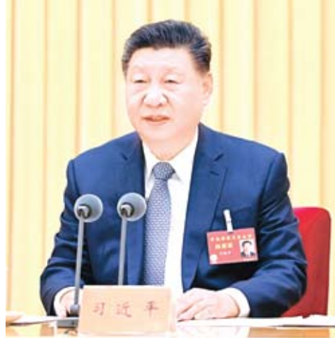
2025年12月10日至11日，中央经济工作会议在北京举行。中共中央总书记、国家主席、中央军委主席习近平出席会议并发表重要讲话。

【新华社北京2月15日电】2月16日出版的第4期《求是》杂志将发表中共中央总书记、国家主席、中央军委主席、习近平的重要文章《当前经济工作的重点任务》。这是习近平总书记2025年12月10日在中央经济工作会议上讲话的一部分。 文章指出，做好2026年经济工作，要坚持稳中求进工作总基调，完整准确全面贯彻新发展理念，加快构建新发展格局，扎实推动高质量发展。面对复杂严峻形势，必须抓住关键、纲举目张，统筹发展和安全，推动经济持续回升向好。 文章强调，要坚持内需主导，建设强大国内市场，统筹促消费和扩投资，实施提振消费专项行动，优化投资结构，激发民间投资活力。要坚持创新驱动发展，以科技创新引领产业升级，加快培育壮大新动能，发展新质生产力，深化拓展“人工智能+”，提升产业链供应链韧性和竞争力。 文章指出，要坚持改革攻坚，完善全国统一大市场制度