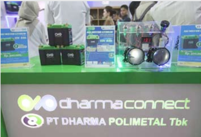
DRMA在2026年印尼国际车展 (IIMS) 上推出本土锂电池，以电动摩托车市场为目标。

【本报讯】Dharma Polimetal (DRMA) 公司正通过开发国产锂电池产品，强化其在印尼电动汽车 (EV) 供应链中的地位。