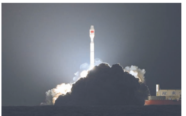
4月11日，中国在广东阳江附近海域使用捷龙三号运载火箭，成功发射卫星互联网技术试验卫星。

【中新社北京4月11日电】据中国航天科技集团消息，北京时间4月11日19时32分，中国在广东阳江附近海域使用捷龙三号运载火箭，将卫星互联网技术试验卫星发射升空，卫星顺利进入预定轨道，发射任务取得圆满成功。