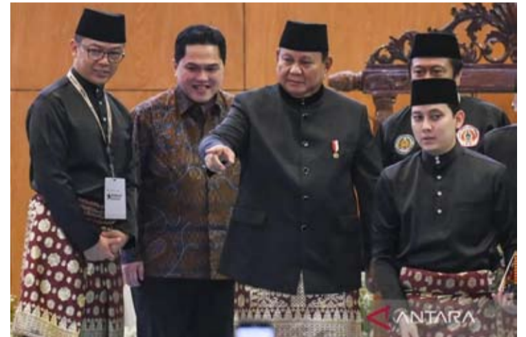
印尼Pencak Silat协会(PB IPSI)总主席, 同时也是印尼总统的普拉博沃·苏比安托(左三), 在雅加达史纳廷会议中心出席第十六届PB IPSI全国协商会议开幕式时, 与青年与体育部长艾立克·托希尔(左二)以及兼任PB IPSI副总主席的外交部长苏吉奥诺(左)交谈一瞥。

声明强化了pencak silat作为活态文化遗产的地位, 它不仅传承传统, 也成为在全球动态变化中塑造品格、增强团结和构建国家