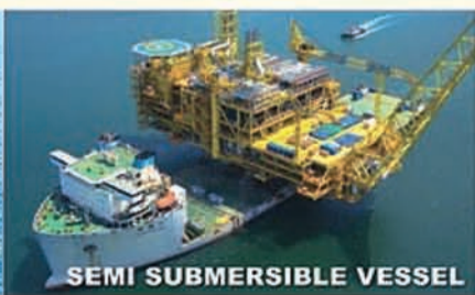
SEMI SUBMERSIBLE VESSEL