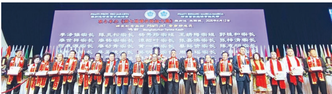
筹委会颁发纪念品给雅加达印华百家姓协会董事部成员后合影。