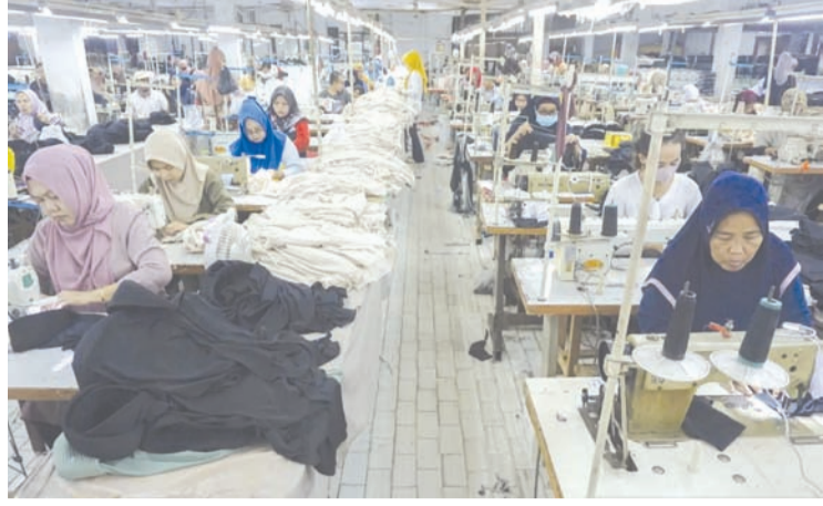
2025年10月23日, 在雅加达Penggilingan小型工业园区 (PIK), 工人正在进行服装生产作业。

【本报讯】在全球市场准入空间持续拓展背景下, 印尼纺织及纺织制品行业正加快提升国际竞争力, 积极把握对美出口增长机遇。这一发展契机源于印尼与美国签署的《对等贸易协定》(ART)。根据协定安排, 印尼部分产品可通过关税配额 (TRQ) 机制享受0%进口关税待遇, 为纺织品出口提供重要政策支持。