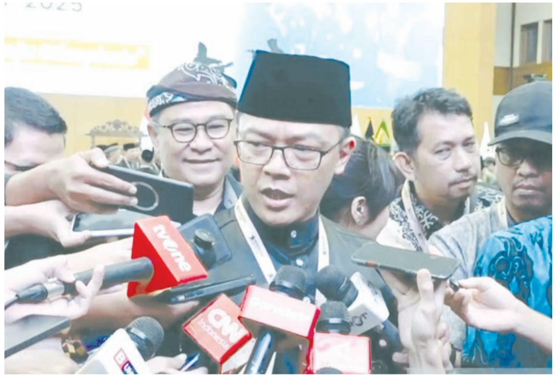
外交部长苏吉奥诺于4月11日(星期六)在雅加达总统府接受记者提问时作出回答。

总统强调，在全球地缘政治局势动荡的背景下，政府需要积极与世界各国保持沟通与合作，以维护国家经济稳定，特别是能源领域。(fd)