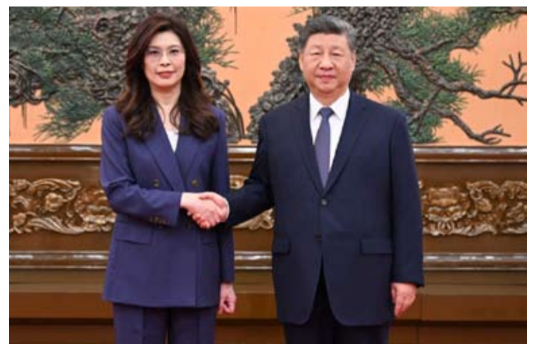
中共中央总书记习近平4月10日上午在北京会见中国国民党主席郑丽文。

习近平总书记就两岸关系发展提出4点意见,激励两岸同胞力同心,把两岸关系的未来牢牢掌握在中国人民自己手中。从欢迎台湾同胞常回家看看,到愿同广大台湾同胞共享发展机遇和成果,两岸持续深化交流融合,共绘民生福祉新图景。