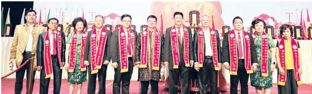
《第七届尊宗敬祖大典》筹委会代表向祖先敬献花篮后合影。