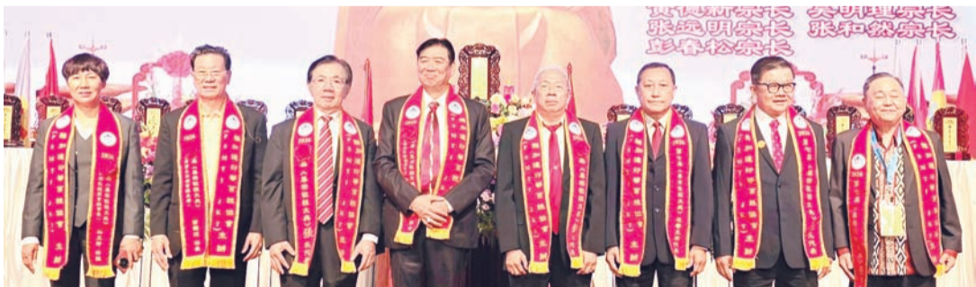
世界各姓氏总会总主席诸位宗长向祖先敬献花篮后合影。