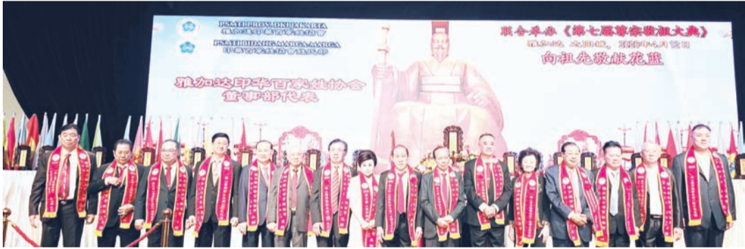
雅加达印华百家姓协会董事部代表向祖先敬献花篮后合影。