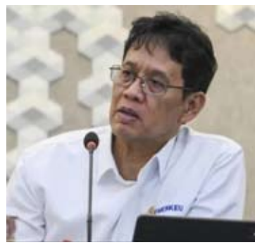
Purbaya Yudhi Sadewa

【本报讯】财政部长普尔巴亚·尤迪·萨德瓦(Purbaya Yudhi Sadewa)表示,政府计划自2026年5月起,在烟草消费税(CHT)税率结构中新增一档税率层级。