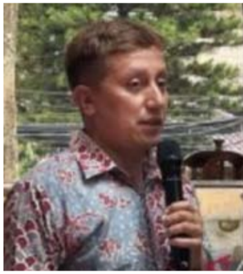
图为外交部发言人瓦赫德·纳比尔·A·穆拉切拉于2月10日在雅加达举行的媒体集会上发表讲话。