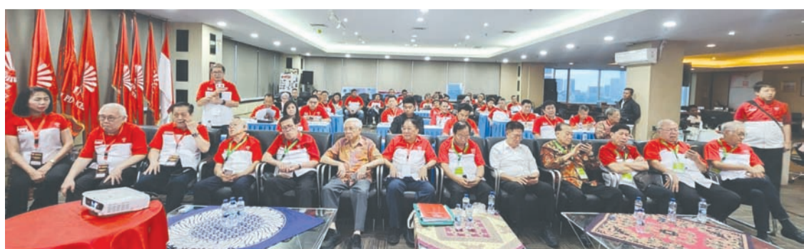
印尼华裔总会召开第三次全国特别代表大会一景。