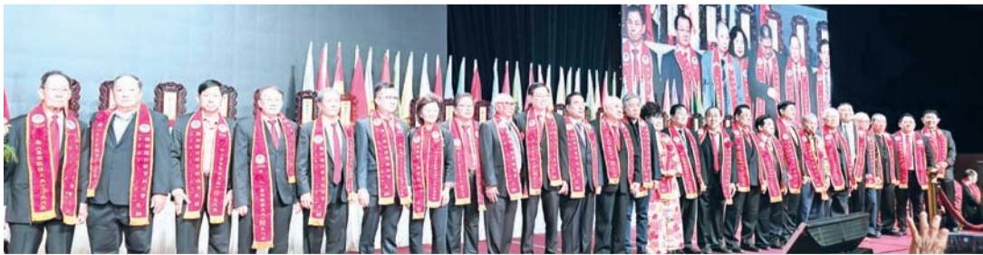
各姓氏宗亲会领导或代表主持点亮各姓氏牌位光明灯后合影。