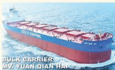
BULK CARRIER MV. YUAN QIAN HAI