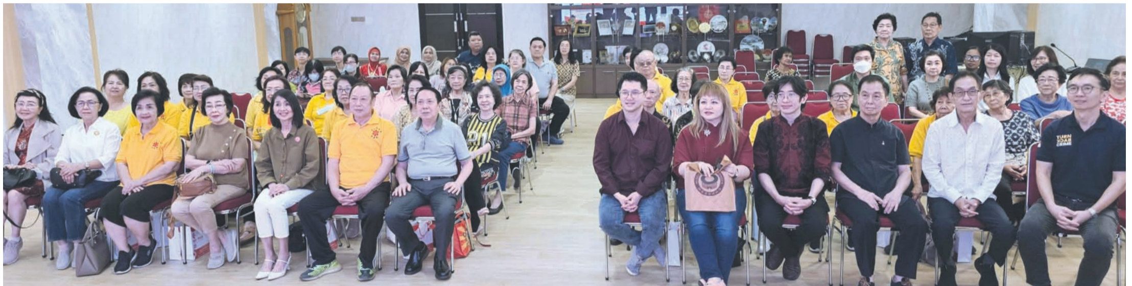
与会主讲嘉宾和客属社团诸理事及听众们合影留念。