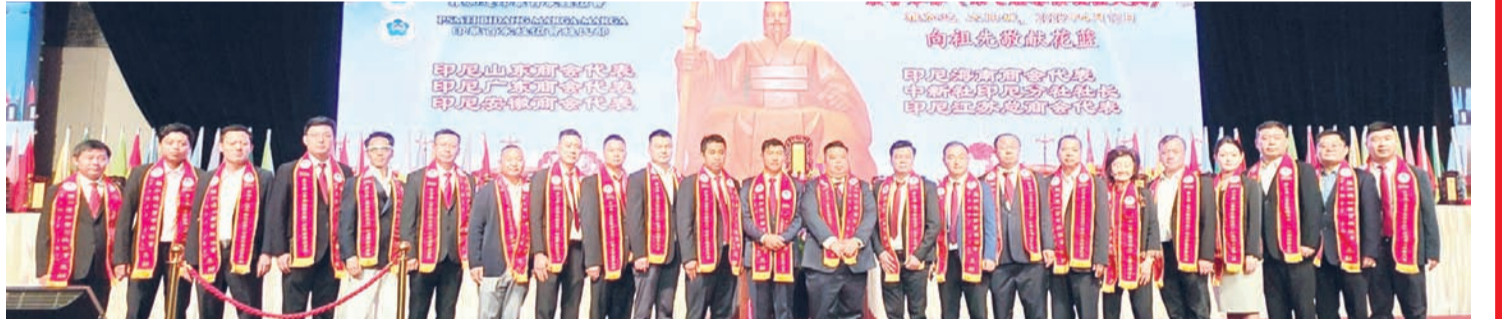
印尼山东、广东、安徽、海南、江苏商会及中新社印尼分设社长向祖先敬献花篮后合影。