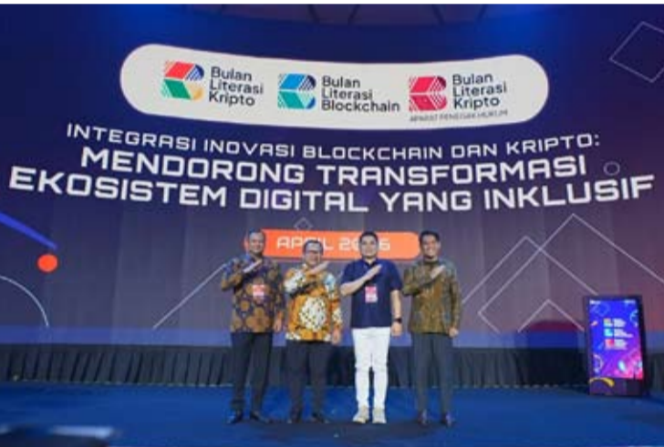
图注:4月7日(周二)OJK金融科技、数字金融资产及加密资产监管执行主任Adi Budiarmo(左二)在雅加达出席2026年加密资产素养月开幕式。