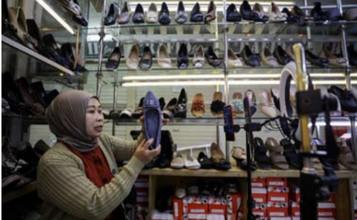
在雅加达 Tanah Abang 市场, 一位商贩通过在线销售平台的直播功能推销鞋类产品。

为 17.6 亿美元, 而第三大鞋类出口目的地是中国, 出口额为 5.04 亿美元。印尼还有其他 132 个国家作为该商品的出口目的地。 他认为, 全球贸易的地缘政治动态, 包括美国的贸易关税政策, 也影响了全球鞋类产业供应链结构的变化。这种状况为印尼加强其作为各全球品牌主要生产基地之一的地位提