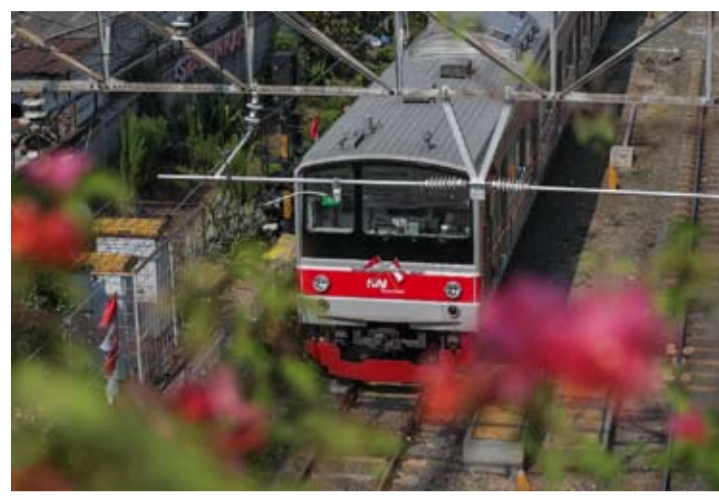
电动列车正在驶过雅加达 Karet 站。

【本报讯】印尼铁路公司 (PT Kereta Api Indonesia, 简称 KAI) 计划将电气化铁路线路扩展至孔雀 (Merak)、苏加武眉 (Sukabumi) 和芝甘北 (Cikampek)。此举将把电动列车 (KRL) 的服务范围扩大至雅加达周边的多个缓冲地区。