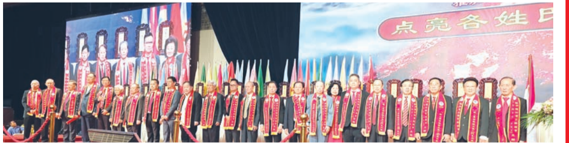
各姓氏宗亲会领导或代表主持点亮各姓氏牌位光明灯后合影。