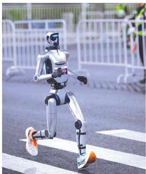
4月11日晚至12日凌晨，北京经济技术开发区组织开展2026北京亦庄人形机器人半程马拉松全流程全要素测试活动。

2025年4月，北京亦庄上演全球首个人形机器人半程马拉松赛事，20支人形机器人参赛队和9000余名人类跑者齐跑21公里赛道，宛如一场成功的“路演”。比如，松延动力