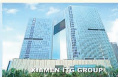
XIAMEN ITG GROUP