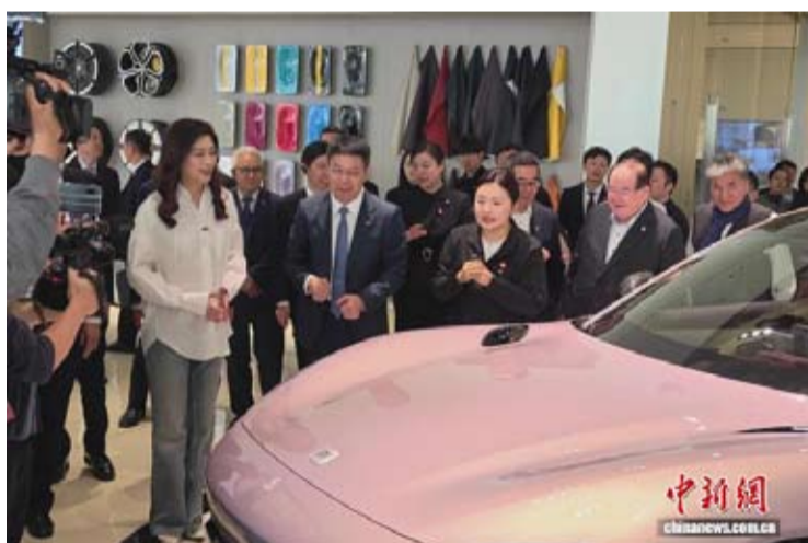
4月12日,中国国民党主席郑丽文(左一)在北京参观小米汽车工厂。

五、在坚持“九二共识”、反对“台独”政治基础上建立沟通机制,为符合检验检疫标准的台湾农渔产品输入大陆提供便利。支持台湾农渔产品参与大陆各类展销会、对接会,拓展销售渠道。