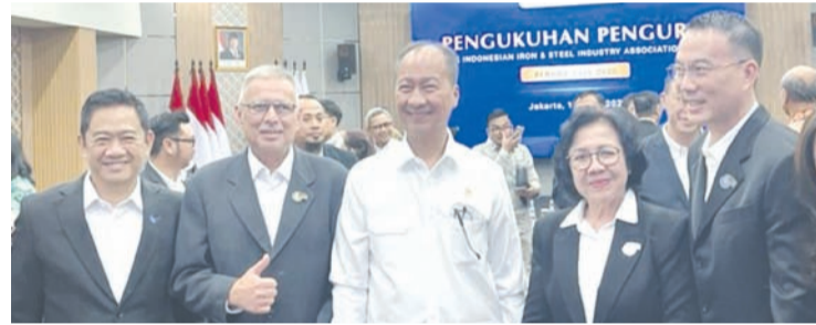
4月10日, 在雅加达举行的印尼钢铁工业协会 (IISIA) 2026—2030年任期管理层就职仪式结束后, 印尼工业部长阿古斯·古米旺·卡塔萨斯米塔 (中) 接受媒体采访。

他表示, 当对单一市场依赖程度过高时, 该市场一旦发生经济动荡, 将对印尼钢铁行业产生显著冲击。我担心我们的出口目的地过于集中在一个国家。如果该国出现经济动荡或问题, 势