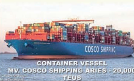
CONTAINER VESSEL MV. COSCO SHIPPING ARIES - 20,000 TEUS