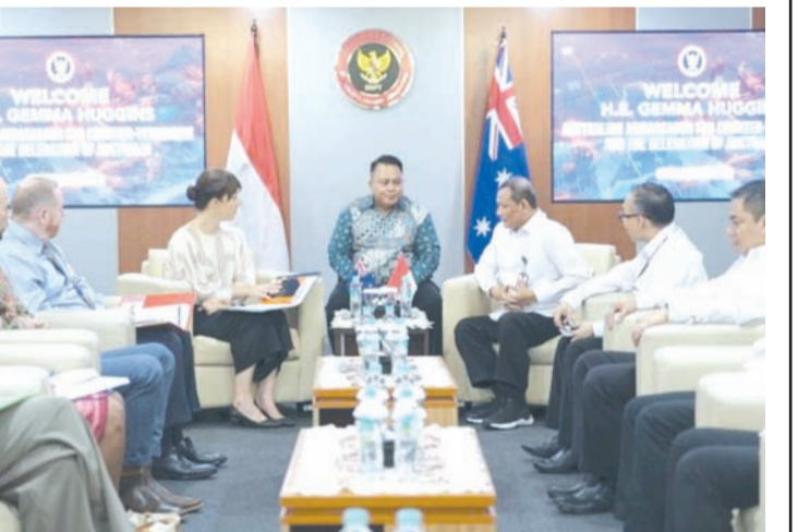
近日，印尼国家反恐局首席秘书邦·苏罗诺(右前)与澳大利亚反恐事务大使杰玛·哈金斯(左前)在雅加达举行会晤。

为应对这一发展态势，邦称，印尼政府已通过一项关于儿童保护中电子系统运营治理的政府条例(PP Tunas)制定了相关