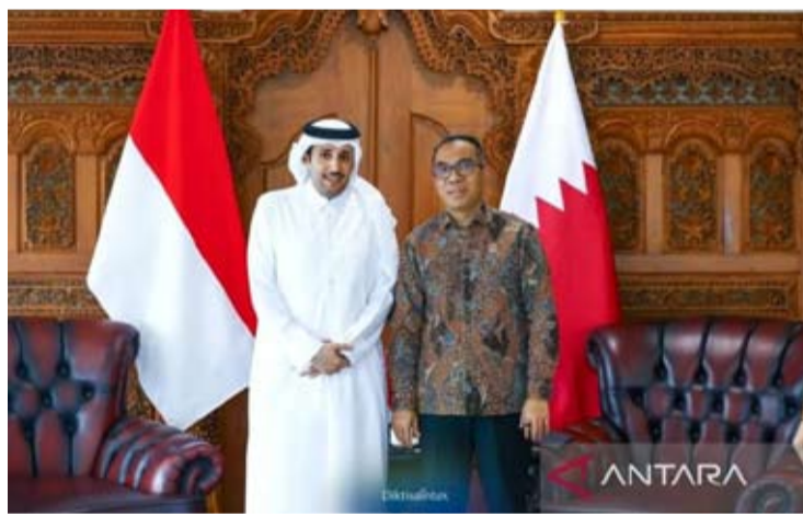
印尼高等教育、科学与技术部长布莱恩·尤利阿尔托(右)在其办公室, 接见了卡塔尔驻印尼大使苏丹·本·穆巴拉克·阿勒·多萨里(左)的礼节性拜访。

【本报讯】高等教育、科学与技术部与卡塔尔在加强联合研究、学术流动以及卓越人力资源开发等领域开启了合作关系。