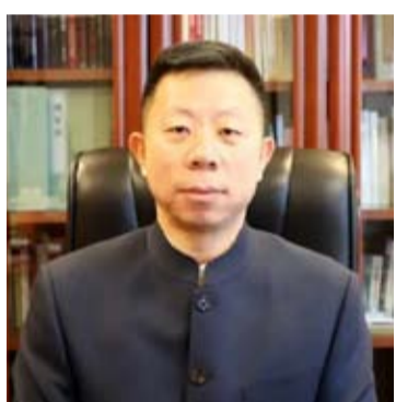
中国驻菲律宾大使井泉

井泉介绍说,1月至3月,中国来菲游客12万人次,同比增长57%。宿务至泉州、重庆至马尼拉等航线已经或即将开通。菲民众赴华人数也在增