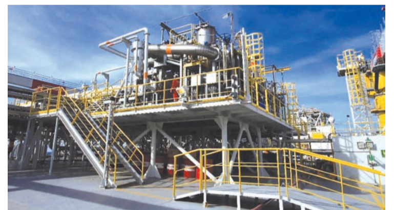
图为Blok Cepu(塞普区块)由PT Raharja Energi Cepu Tbk.管理的油气设施。