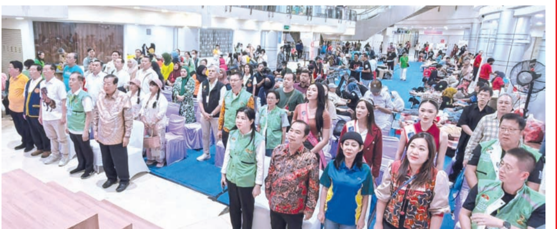
与会嘉宾出席献血活动开幕礼。