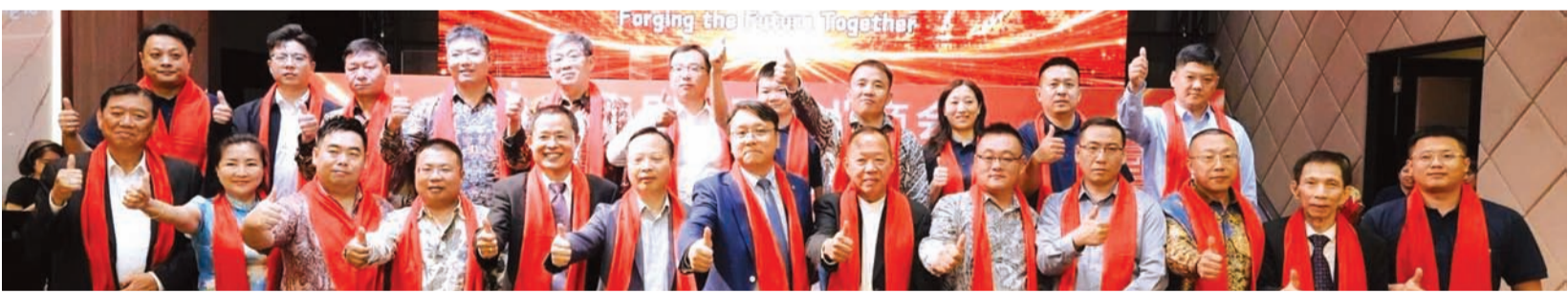
印尼河北商会全体理事与顾问团合影。