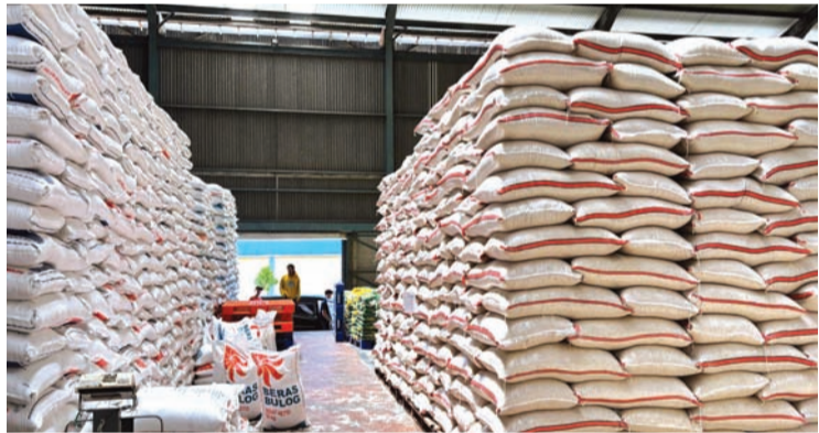
西爪哇省一处Bulog仓库内储存的大米库存。

他指出, 目前印尼粮食供应总体充足, 问题主要集中在库存消化与仓储管理方面。“当前并非粮食短缺问题, 而是如何提升