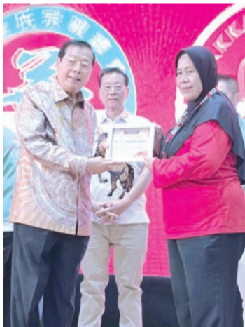
叶联礼总主席向印尼红十字会代表颁发感谢状。