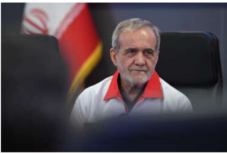
伊朗总统佩泽希齐扬

【中新网4月26日电】据卡塔尔半岛电视台报道，当地时间25日，伊朗总统佩泽希齐扬当日与巴基斯坦总理夏巴兹通电话。佩泽希齐扬在通话中表示，伊朗不会在压力、威胁和封锁下进行谈判。佩泽希齐扬表示，美国对伊朗实施的海上封锁等措施阻碍了双方建立互信，而在谈判进程推进的同时，压力与对抗不断升级，也进一步削弱了相互信任。佩泽希齐扬还称，在有关各方之间达成共识、形成共同愿景，并营造有利于有效对话的环境，是推动谈判取得进展的前提条件。佩泽希齐扬补充道，美国加强在中东地区的军事存在，将加剧局势复杂性，不利于对话氛围的形成。