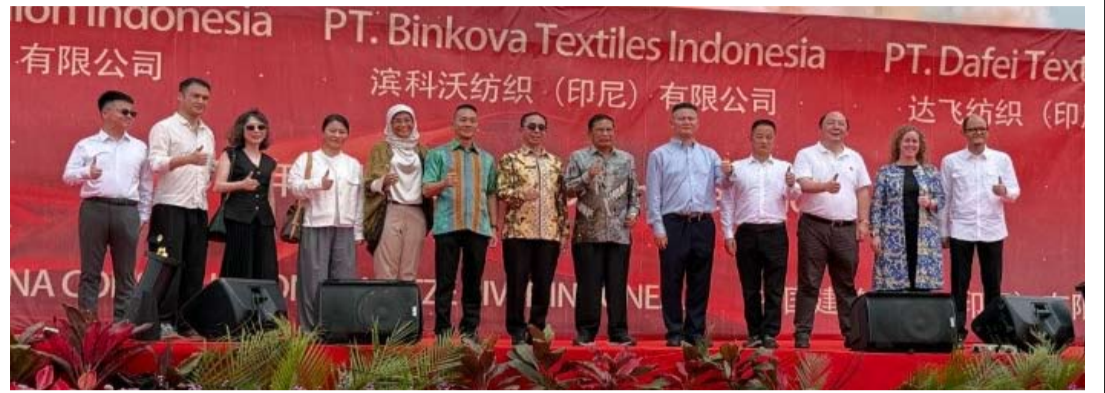
三家纺织公司在西爪哇省苏横智能城正式启动纺织厂的建设。

引力不断增强之际。这三家公司作为全球时尚品牌H&M 合作伙伴的公司, 正在构建垂直供应链, 以满足 IEU-CEPA 零关税计划下的两阶段生产流程要求。