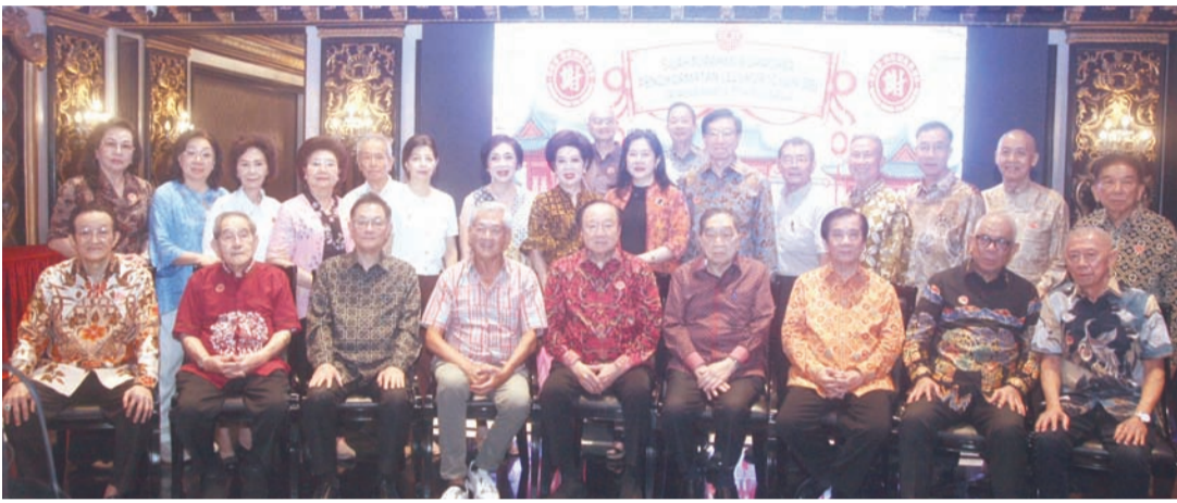
与会谢氏宗亲们祭祖后假座太阳城国际酒楼聚餐联欢。