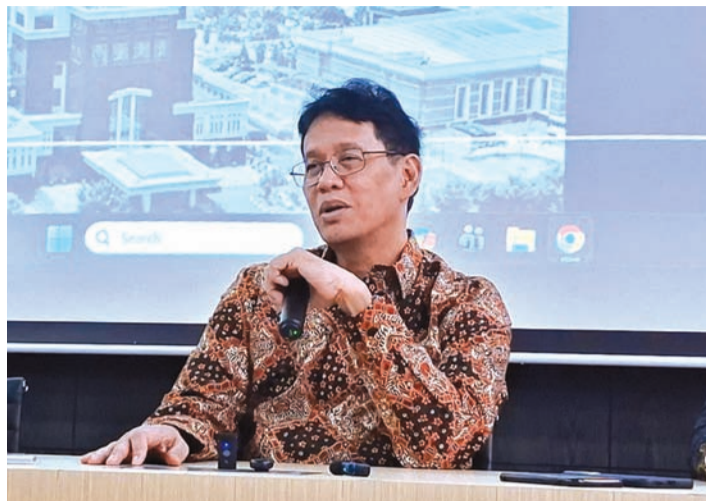
资料照片: 印尼财政部长普尔巴亚·尤迪·萨德瓦(Purbaya Yudhi Sadewa)