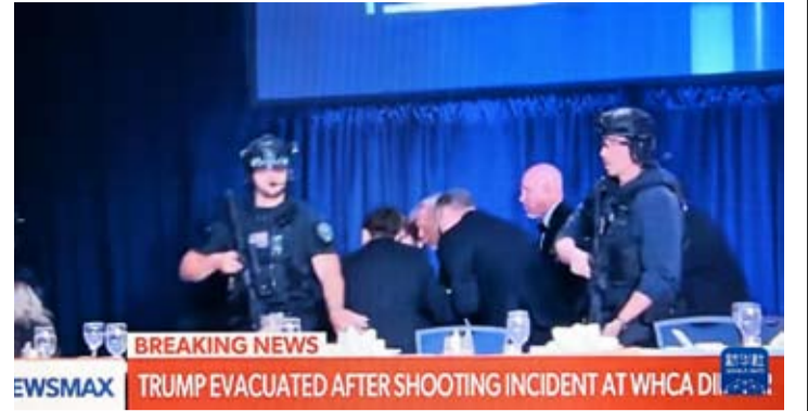
这张4月25日拍摄的视频截图显示，美国总统特朗普在华盛顿白宫记者协会晚宴发生“安全事件”时在安保人员护送下离开。

是事发酒店的住客。华盛顿特区代理警察局长杰弗里·卡罗尔表示，调查人员目前认为嫌疑人系单独作案，无证据表明有其他人员参与。美国哥伦比亚电视台援引两名消息人士的话报道称，在25日晚发生的美国白宫记协晚宴安全事件中的涉案嫌疑人已向美执法当局供述，其作案目标为美国政府官员。特朗普在社交媒体上发布了疑似嫌疑人被制服的照片及监控录像。录像显示，一名男子持枪快速冲过安检关卡，安检人员拔枪追击。特