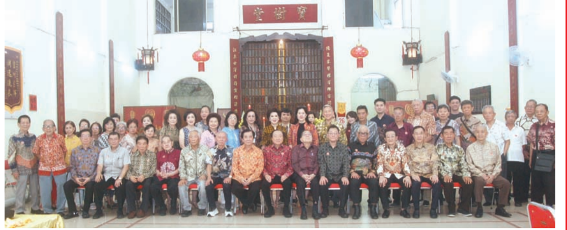
雅加达谢氏宗亲会诸位理事与宗亲们祭祖后合影留念。