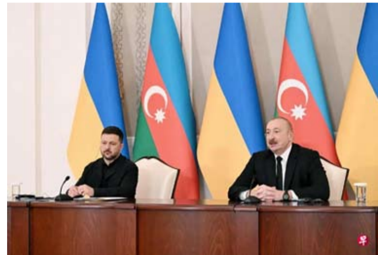
4月25日，阿塞拜疆总统阿利耶夫(右)和乌克兰总统泽连斯基在阿塞拜疆加巴拉会晤后举行新闻发布会。

【中新社阿斯塔纳4月25日电】加巴拉消息：当地时间25日，正在阿塞拜疆访问的乌克兰总统泽连斯基提议，在阿塞拜疆举行乌克兰与俄罗斯的谈判。据阿塞拜疆国家通讯社消息，25日，泽连斯基抵达阿塞拜疆进行工作访问，并在加巴拉市与阿塞拜疆总统阿利耶夫举行正式会晤。会晤结束后，两国总统共同出席记者会。在随后发表的媒体声明中，泽连斯基表示，乌方认可并赞赏包括阿塞拜疆在内的合作伙伴在乌克兰问题调解进程中发挥的积极作用，并指出乌方已准备好与美国、俄罗斯进行三方谈判，以外交途径推动局势缓和，前提是俄方