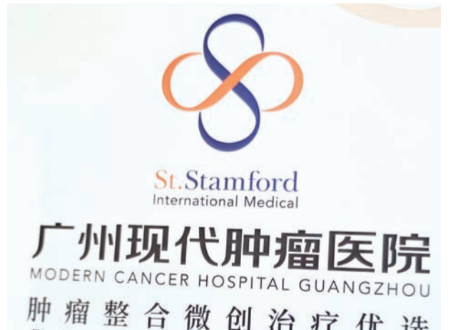
圣丹福广州现代肿瘤医院。