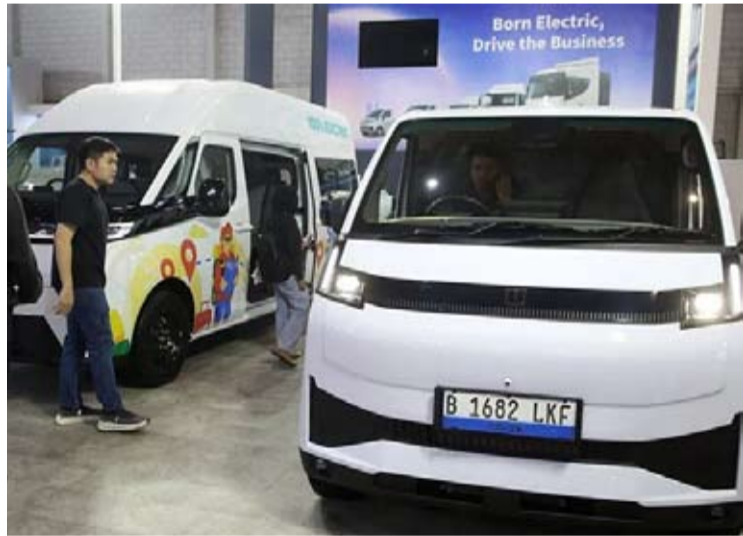
参观者在雅加达马腰兰的JlExpo展览中心举行的2026年印尼国际商用车展 (GIICOMVEC) 观看用于货运行业的电动商用车。

【本报讯】雅加达特区地方收入局 (Bapenda) 将合理征收电动汽车税, 同时继续提供激励措施。雅加达特区地方收入局局长卢西安娜·赫拉瓦蒂表示, 在2026年第11号《内政部长条例》发布后, 政府已制定了相关税率方案。