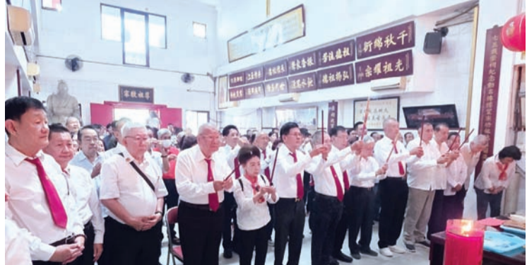
雅加达张氏宗亲会诸理事等各地区宗亲虔诚祭祖一景。

聚餐会上，大家畅叙宗谊、共话发展，在欢声笑语中进一步加深彼此情感与凝聚力。最后，在温馨愉快的氛围中圆满落幕。