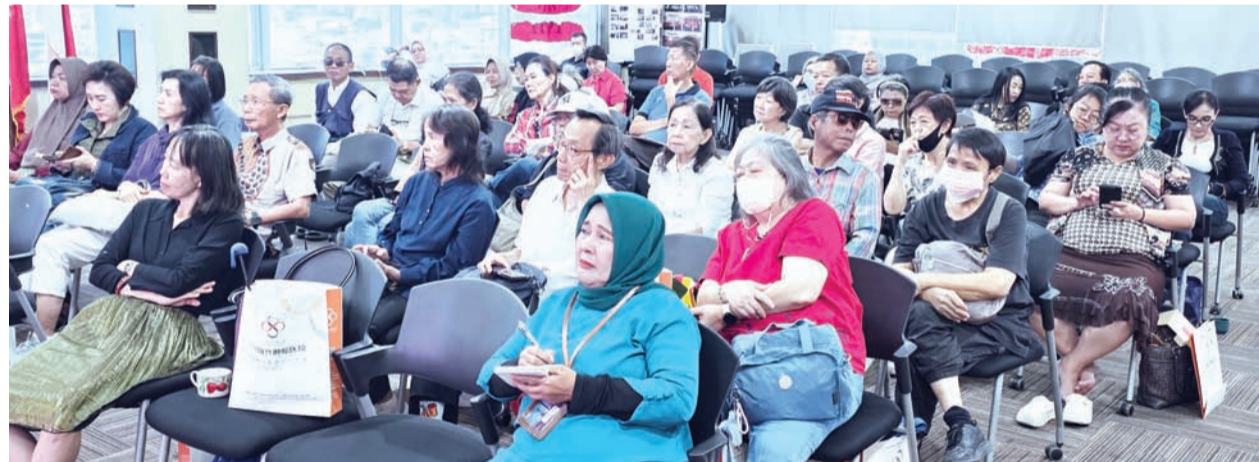
“肿瘤治疗的精华”健康讲座一景。