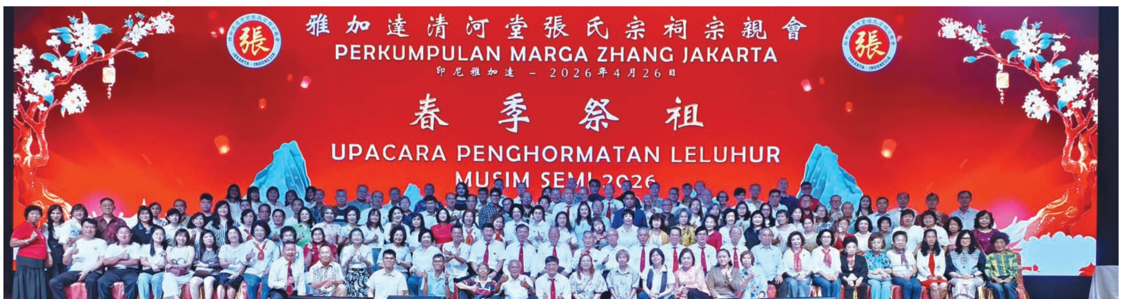
与会张氏宗亲们在金沙酒楼聚餐联欢时合影留念。