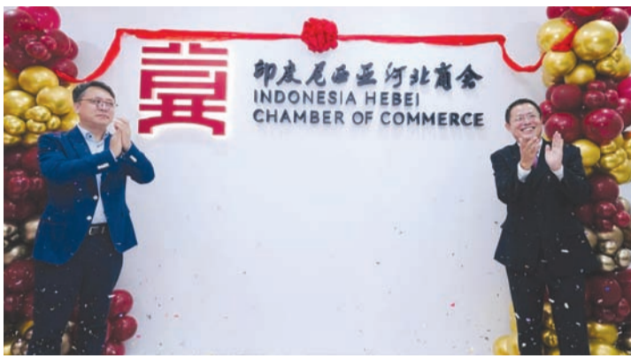
印度尼西亚河北商会揭牌仪式。

凝心聚力冀商情，携手共筑中印梦。河北作为中国的经济大省，拥有雄厚的工业基础、丰富的物产资源以及极具活力的民营经济。以“团结、服务、发展、共赢”为宗旨的河北商会，弘扬诚信务实、义利并举的燕赵商业文化，为在印尼河北籍企业家们共享信息，发现商机，深化合作搭建平台，也将为更多河北企业开拓印尼市场提供强有力的支持，强强联合，打造互助共赢的发展共同体，共同推动中印尼经贸合作迈向新高度。