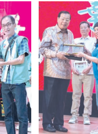
印尼国会议员 Nurwayah 向叶联礼总主席赠送礼品。