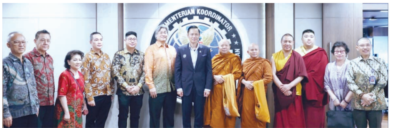
2026年卫塞节筹委会与我国基础设施与区域发展统筹部长阿古斯(中)合影。

向阿古斯部长汇报了系列活动安排,并邀请阿古斯部长出席庆典高峰活动,以支持并加强跨宗教群体之间的团结与和谐。此次会晤有望进一步加强政府与佛教界之间的协同合作,确保2026年卫塞节庆典庄严顺利举行,营造祥和氛围,并传递团结一致的积极精神。