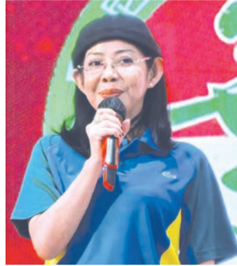
印尼国会议员 Nurwayah 致辞。