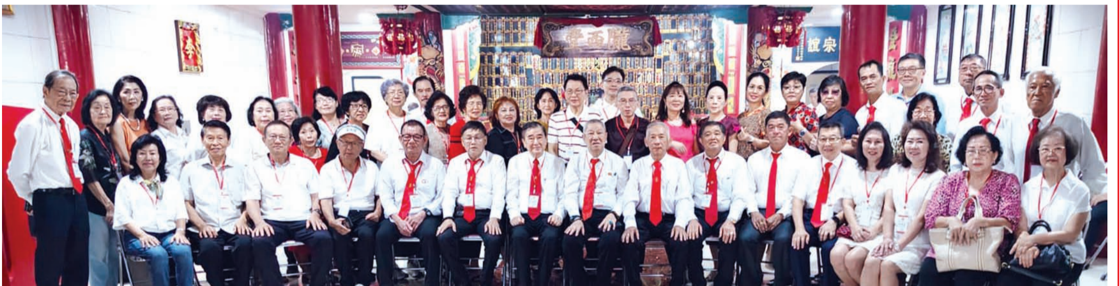
雅加达李氏宗亲会诸位理事与巴眼亚比李氏宗亲们合影留念。