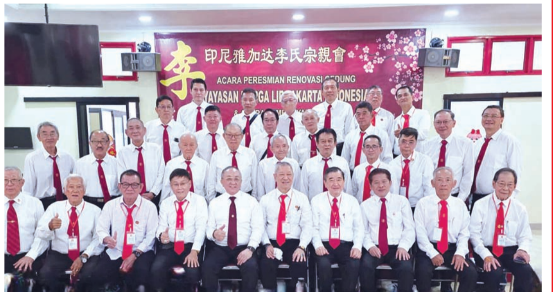
与会李氏宗亲们在餐厅举行聚餐时合影。