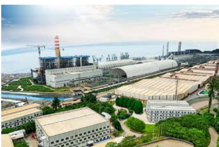
位于印尼北马鲁古省中哈马黑拉县的印尼韦达湾工业园区。

【本报讯】浙江华友钴业股份有限公司(Zhejiang Huayou Cobalt Co., Ltd.)宣布, 位于印尼的子公司华飞镍钴有限公司(Huafei Nickel-Cobalt Co., Ltd.)自2026年5月1日起, 对部分