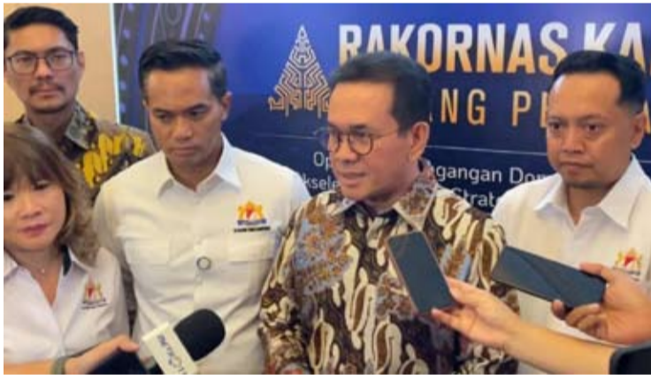
2026年4月30日, 印尼贸易部长布迪与印尼工商会总主席阿宁迪亚, 共同出席了在雅加达丽思卡尔顿酒店举行的2026年印尼工商会全国协调会议贸易领域专场活动, 主题为“优化国内与国际贸易、加速战略投资, 迈向8%经济增长目标”。

【本报讯】印尼政府持续通过加强中央与地方协作、以及与商界的协同, 推动全国出口增长。