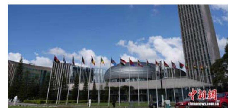
当地时间4月21日，非盟总部门口前的成员国旗阵。

【中新社约翰内斯堡5月1日电】5月1日零时，24吨产自南非的新鲜苹果顺利入境中国。这是中国对53个非洲建交国全面实施零关税政策后的首票进口货物。自5月1日起，中国对所有非洲建交国实施零关税，同时继续推动商签共同发展经济伙伴关系协定。此前，已有33个最不发达国家通过特惠税率安排，享受输华产品零关税。本次政策，将零关税范围扩大至包括南非在内的20个国家。至此，中国成为全球首个对所有非洲建交国、以及所有建交的最不发达国家实施单方面、全面零关税的主要经济体。