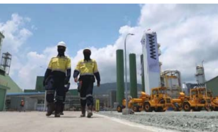
2024年9月23日, 工人在西努沙登加拉省西松巴哇地区安曼矿业努沙登加拉公司 (PT Amman Mineral Nusa Tenggara) 铜冶炼厂内作业。

他认为, 在全球能源转型背景下, 铜作为关键基础材料, 其战略地位将进一步提升, 印尼相关产业发展潜力较大。(er)