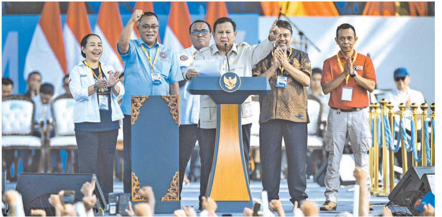
2026年5月1日，印尼总统普拉博沃(居中)在工会主席(从左至右)埃莉·罗西塔·西拉班、穆罕默德·朱姆胡尔·希迪亚特、安迪·加尼·内纳·韦阿、赛义德·伊克巴尔以及伊尔哈姆西亚的陪同下，在雅加达民族纪念碑出席2026年五一劳动节纪念活动并发表讲话。

三、预防大规模裁员：敦促成立裁员应对工作组，特别关注因地缘政治局势(伊朗与美以战争)