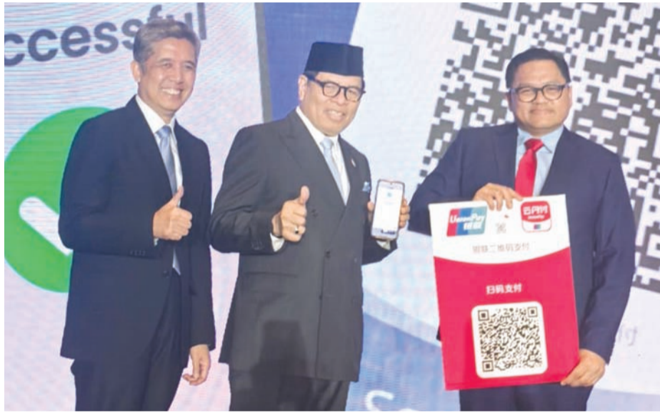
左至右：行央行支付系统政策部主任杜迪，周浩黎大使、印尼央行驻华代表处主任尤利安出席启动仪式时合影。