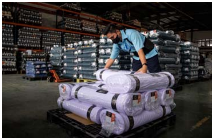
2026年4月22日, 印尼西爪哇省芝马墟市 (Cimahi) PT Trisula Textile Industries工厂内, 工人整理布料卷。

萨哈拉表示: “基于对印尼投入产出表中185个行业进口依赖度的测算结果显示, 部分行业对进口投入依赖程度较高。”