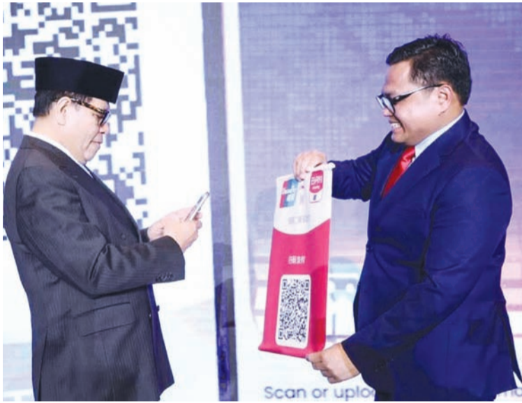
周浩黎大使使用QRIS服务。