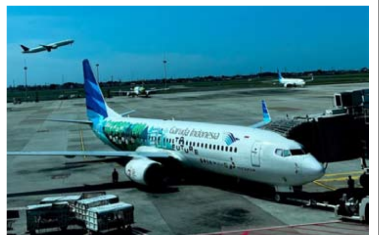
在万丹省丹格朗县苏加诺-哈达机场的一架印尼鹰航飞机。