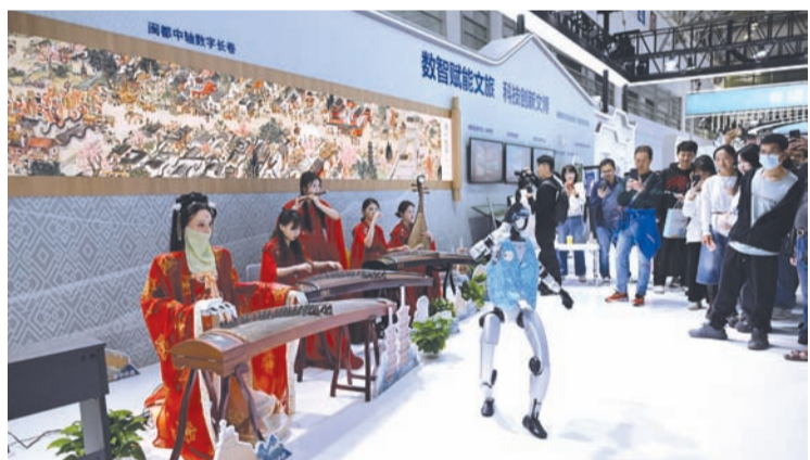
4月30日, 福建福州, 机器人弹古筝、跳舞吸引参观者。当日, 第九届数字中国建设峰会现场体验区对公众开放, 吸引不少市民前去参观、体验。