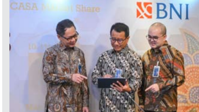
图为周三（4月29日），印尼国家银行（BNI）总裁Putrama Wahyu Setyawan（中）、金融和策略总监Husein Paolo Kartadjoemena（右）与风险管理总监David Pirzada（左）在雅加达举行的BNI 2026年第一季度业绩发布会时交谈。2026年第一季度BNI的净利达5.6万亿盾，同比增长5.21%。