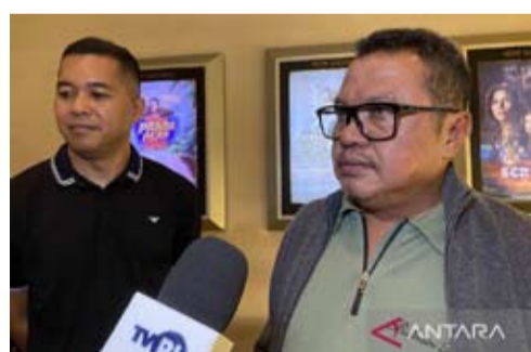
国会第七委员会副主席拉姆霍特·西纳加 (Lamhot Sinaga, 右) 在雅加达回答记者提问。

只有雇主和劳工的利益平衡, 才能实现和谐的劳资关系。他反对剥削性的劳资关系模式, 即一方为了短期利益而让另一方处于不利地位。他认为, 企业繁荣和劳工福祉是不可妥协的基本原则。