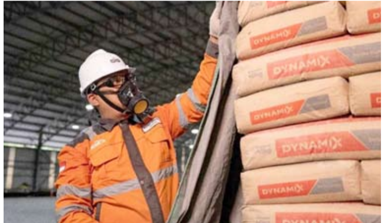
仓库里堆积的袋装水泥。

【本报讯】印尼水泥公司(SMGR/SIG)正加速优化以工业废料、生物质和城市垃圾为基础的替代燃料, 以此作为降低能源成本和排放的关键战略。