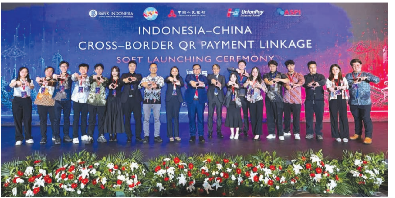
在华印尼公民合影。