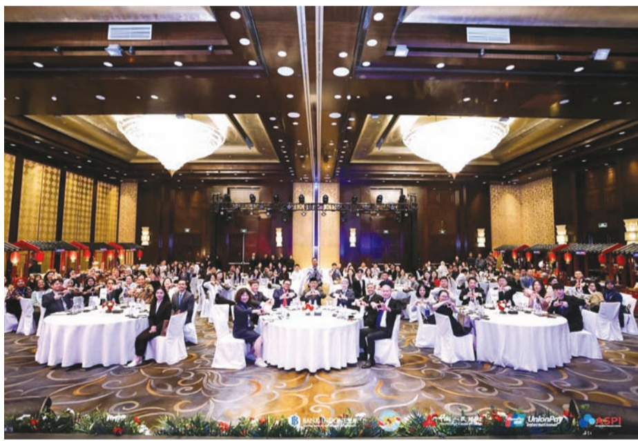
嘉宾出席启动仪式。