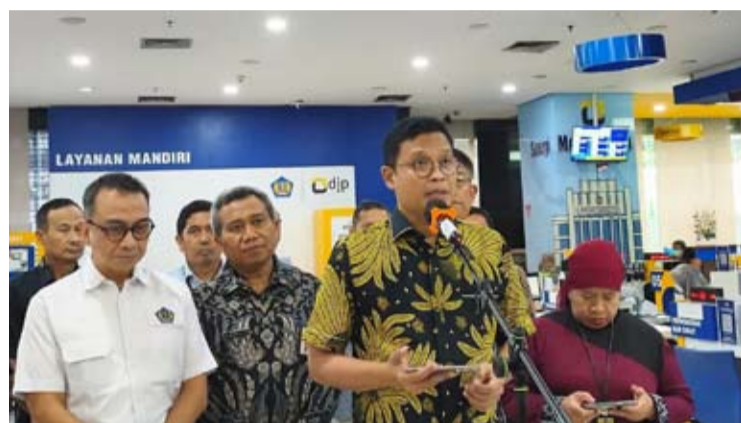
Bimo Wijayanto (左三)

【本报讯】财政部税务总局局长Bimo Wijayanto表示, 当局将很快把企业所得税(PPh Badan)年度申报表(SPT Tahunan)的申报截止日期延长至2026年5月31日。