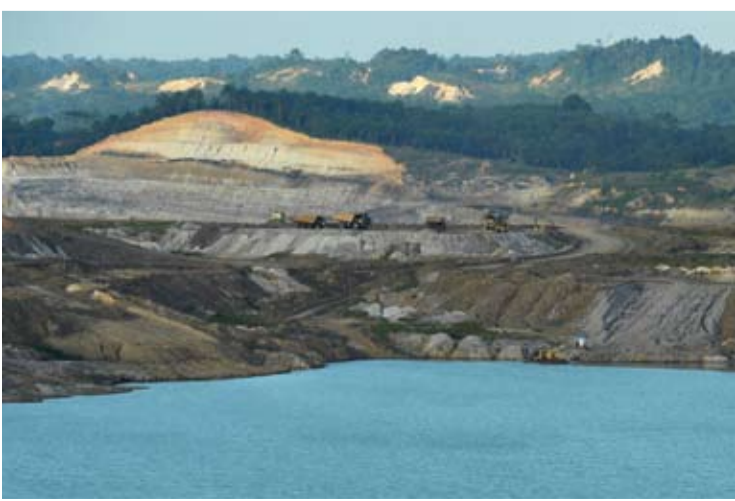
2026年4月22日，在东加里曼丹省库台卡塔内加拉地区，运煤卡车行驶于矿区作业道路。

他强调，对于欧洲方面的采购意向，印尼政府不会作出简单回应，而将采取更加务实的政策取向，在保障国内能源安全和能源价格可负担性的前提下，合理利用本国能源资源，以维护经济稳定。(er)