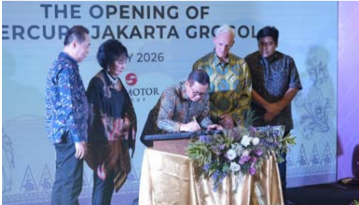
雅加达省长普拉莫诺为位于西雅加达的格罗戈尔美居酒店盛大开业签署了纪念匾。

【本报讯】印尼雅加达首都特区省长普拉莫诺·阿农于周六(5月2日)在西雅加达格罗戈尔佩坦布兰地区为雅加达格罗戈尔美居酒店揭幕。这家由雅高集团管理的国际标准酒店被认为将推动西雅加达地区的经济增长。