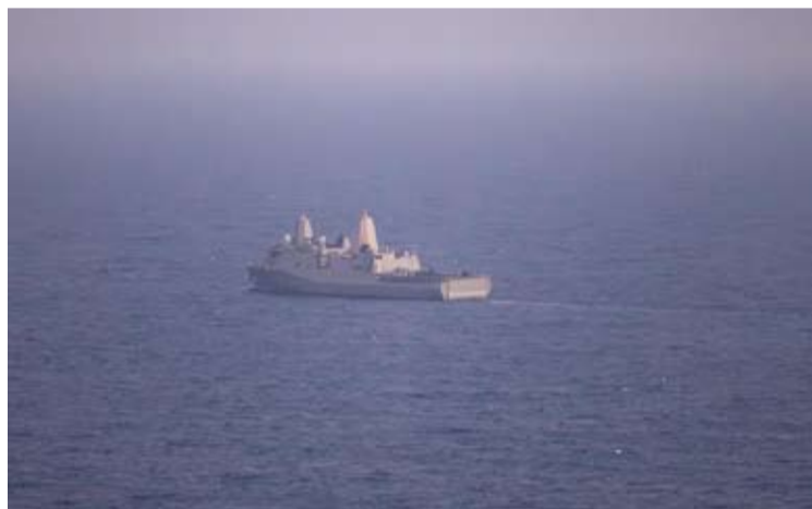
特朗普称,他将很快研究伊朗最新提交的方案,但“无法想象该方案可以被接受”。他还说,美军有可能恢复空袭伊朗。图为4月28日,美军新奥尔良号两栖船坞运输舰在阿拉伯海航行。

【中新社北京5月3日电】综合消息:据伊朗塔斯尼姆通讯社当地时间2日报道,伊朗已通过斡旋方巴基斯坦向美国提出包含14点提议的谈判方案。美国总统特朗普对方案内容表示不满。 报道称,伊朗此次提议是为回应美国先前提出的一项包含9点提议的谈判方案。14点提议主要包括:确保不进行军事侵略、将美军从伊朗周边地区撤出、解除海上封锁、解冻伊朗被冻结资产、支付赔偿、取消制裁、在包括黎巴嫩在内的所有战线结束战争、建立霍尔木兹海峡新管理机制等。 美国先前的方案称,美伊双方应停火两个月。对此,伊朗强调,各项问题应在30天内解决,且重点应放在“结束战争”、而非延长停火之上。 特朗普2日稍晚回应