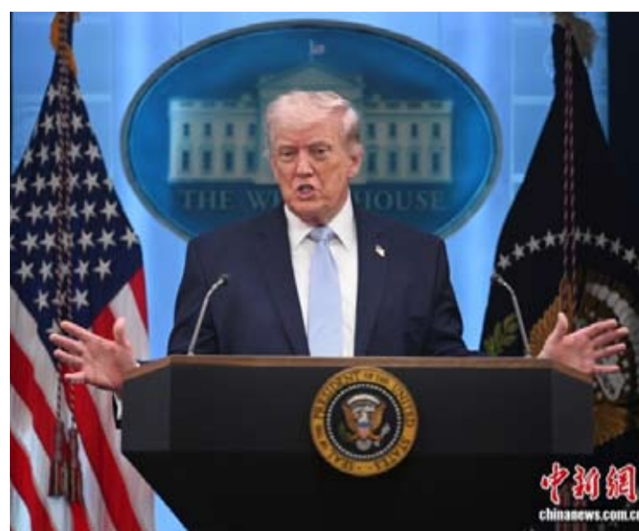
资料图:美国总统特朗普。

【中新网5月3日电】据美国Axios新闻网、美国有线电视新闻网(CNN)等报道,当地时间2日,美国总统特朗普在佛罗里达州一座机场接受媒体采访时称,存在美国重启对伊朗空袭的可能性。