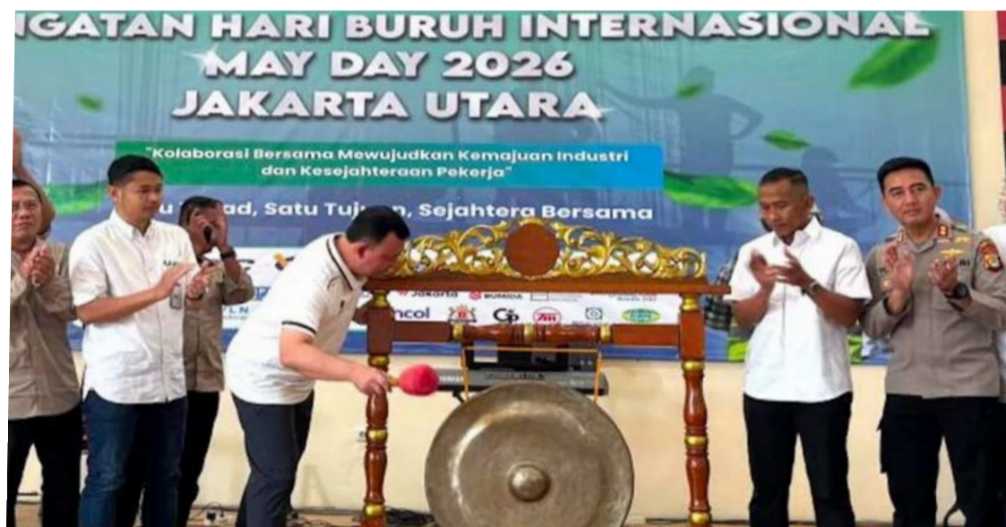
雅加达北区市长亨德拉·希达亚特于5月2日在雅加达北区出席了国际劳动节纪念活动的开幕式。

【本报讯】雅加达北区市长亨德拉·希达亚特(Hendra Hidayat)声称, 国际劳动节的纪念活动是加强政府、雇主和工人三方协同合作的契机, 以应对劳动领域面临的各种挑战。周六(2/5), 他在雅