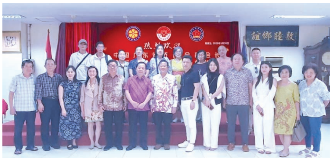
宾主在印尼梅州会馆合影留念。