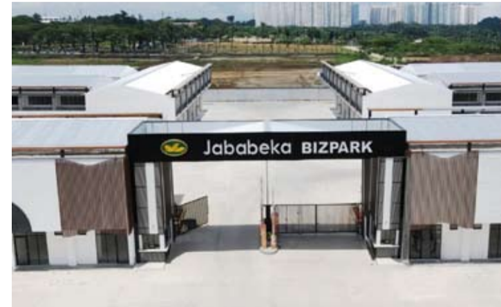
位于芝卡朗 Jababeka 市中央商务区的 Jababeka Bizpark 商业空间的大门。

“Jababeka Bizpark 多功能建筑提供多种优势,可支持业主的商业运营,例如建筑结构灵活、已配备