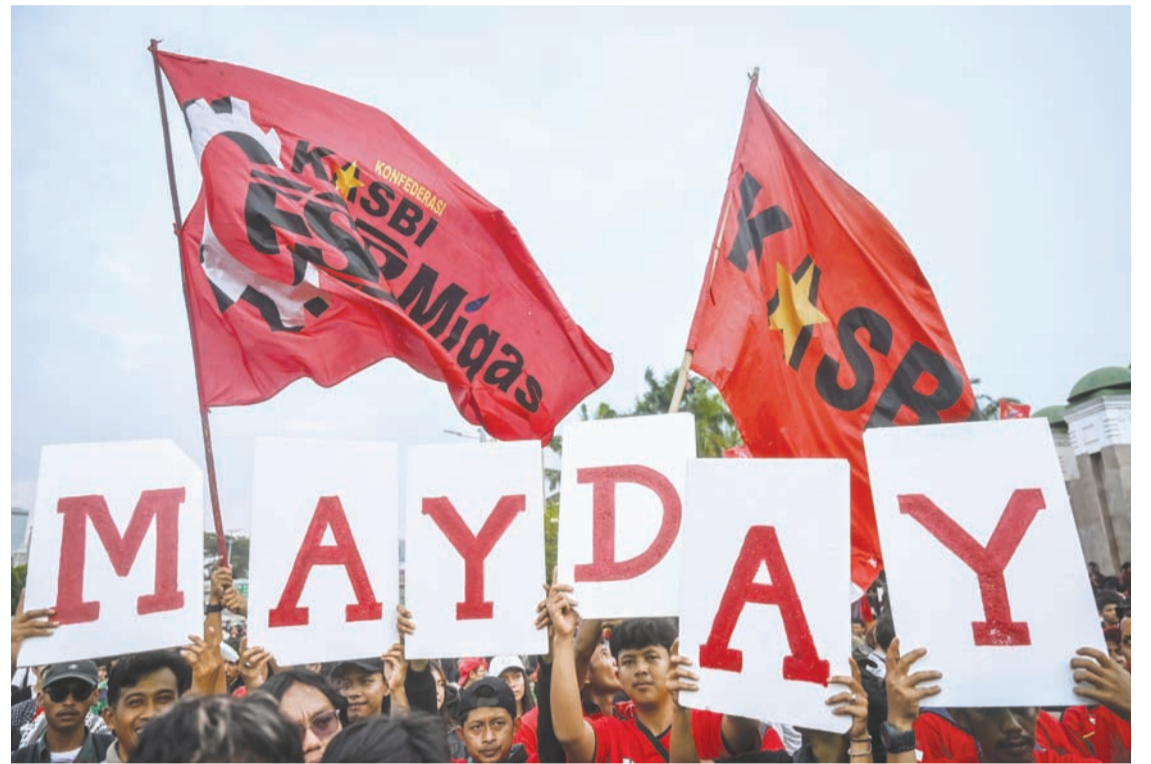
2026年5月1日，大批印尼民众在雅加达国会大厦前举行纪念国际劳动节的示威活动。他们要求通过《劳动法案》、取消劳务外包，并拒绝低工资。

据悉，外包制度是在印尼第五任总统梅加瓦蒂执政时期，通过2003年第13号《劳动法》正式引入印尼的。该法规明确规定，具有法人资格的外包公司