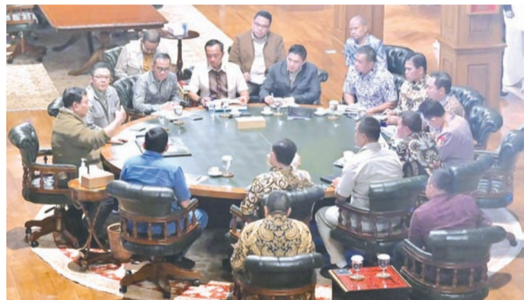
普拉博沃·苏比安托总统（左）于5月2日在西爪哇省茂物市汉巴朗的私人官邸，与多位红白内阁成员召开局部内阁会议。

“关于教育方面，包括利用国内各高校的作用，直接参与本地区的建设，特别是通过高校工程学院的发挥