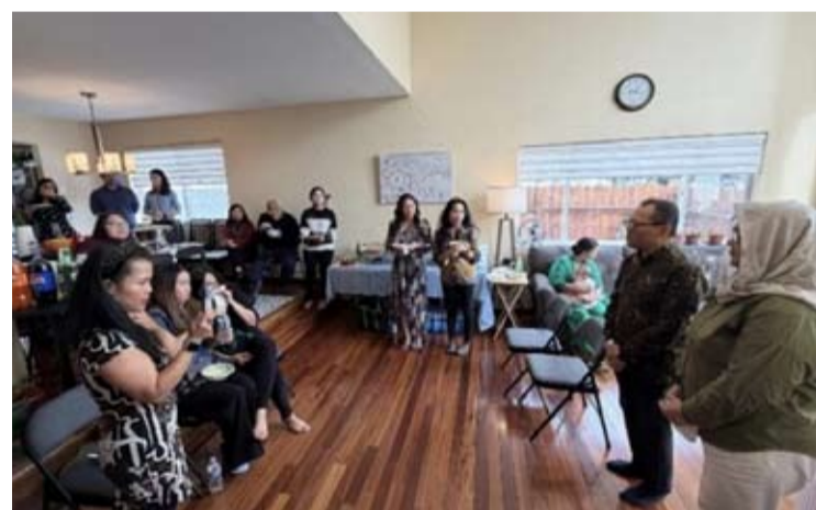
印尼驻旧金山总领事馆于2026年4月11日至12日访问安克雷奇的情景。