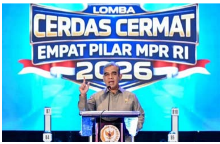
人协议长艾哈迈德·穆扎尼出席在巨港举行的楠榜省级人民协商会议四项支柱智慧竞赛开幕式上致辞。

【本报讯】人民协商会议议长艾哈迈德·穆扎尼Ahmad Muzani于5月2日(周六)出席南苏门答腊省级人协会议四项支柱智慧竞赛(LCC)开幕式时强调, 教育作为主要基础, 为迎接2045黄金印尼培养人力资源方面扮演重要角色。