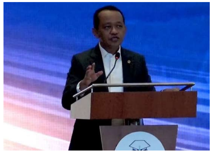
2026年5月2日，印尼能源与矿产资源部长巴赫利尔·拉哈达利亚(Bahlil Lahadalia)在雅加达出席茂物农业大学(IPB)校友活动。(IPB校友会YouTube截图)

巴赫利尔表示，通过将棕榈油(CPO)转化为脂肪酸甲酯(FAME)，并与柴油基燃料(B0