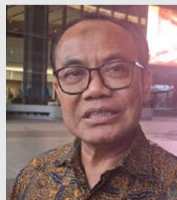
印尼经济统筹部秘书苏西维约诺·莫吉亚尔索(Susiwijono Moegiarsoso)。