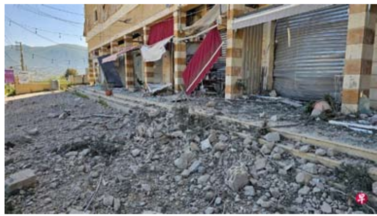
以军星期天(5月3日)发布的疏散令也适用于利塔尼河以北的边境城市纳巴泰。当地多次遭到以军袭击,图为星期六(2日)纳巴泰街边一座被以军空袭摧毁的建筑。

【中新社北京5月3日电】综合消息:以色列当地时间2日对黎巴嫩南部多地发动袭击,共造成至少13人死亡。黎巴嫩真主党当天对以色列军队发动攻击。 黎巴嫩卫生部称,以军2日对黎巴嫩纳巴泰地区发动空袭,造成包括1名儿童在内的8人死亡,西顿地区和提尔地区分别有4人和1人遇袭身亡。 黎巴嫩真主党当日发表声明称,对黎境内的以军发动攻击。 《以色列时报》称,据以色列国防军2日通报,黎真主党向驻扎在黎巴嫩南部的以军士兵发射火箭