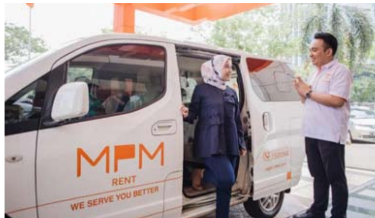
Mitra Pinasthika Mustika公司(MPMX)出租的汽车。

【本报讯】Mitra Pinasthika Mustika公司(MPMX)通过整合可持续出行理念,持续强化其汽车租赁业务。