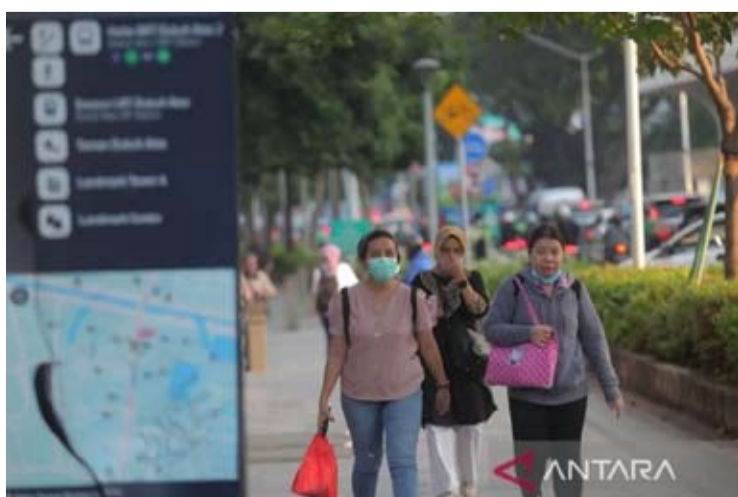
许多市民戴着口罩行走在雅加达苏迪曼地区。

【本报讯】据IQAir网站信息显示, 周日(5月3日)早晨6点(印尼西部时间), 雅加达空气质量被评为