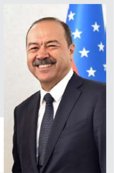
乌兹别克斯坦共和国总理阿卜杜拉·尼格马托维奇·阿里波夫像。

【中新社北京5月3日电】中国外交部发言人3日宣布,应中国政府邀请,乌兹别克斯坦总理阿里波夫将于5月6日至7日访华,并同中共中央政治局委员、国务院副总理刘国中共同主持召开中乌政府间合作委员会第八次会议。