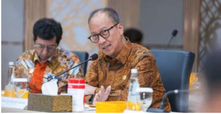
印尼工业部长阿古斯·古米旺·卡塔萨斯米塔 (Agus Gumawang Kartasasmita)。

【本报讯】在电动汽车产业保持快速增长背景下，印尼工业部正加大力度推动市场发展，同时关注新一轮税收政策可能对行业带来的影响。