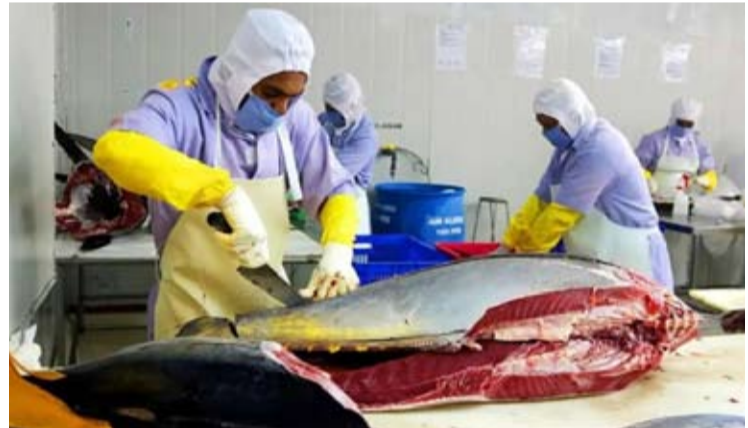
图为在马鲁古省安汶市塔维里村, PT Maluku Prima Makmur公司金枪鱼加工厂内, 工人分割加工黄鳍金枪鱼。