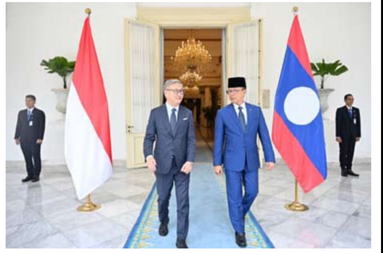
印尼外交部长苏吉奥诺(Sugiono,右)周一(5月4日)在雅加达接见老挝副总理兼外交部长通沙万·丰威汉(Thongsavan Phomvihane,左)。

印尼支持老挝为加强可持续和包容性经济发展所做的努力。两位外长一致认为,需要通过教育、青年和文化交流来加强民间合作,并强调共同的价值和文化遗产是进一步加强民间联系的重要资产。