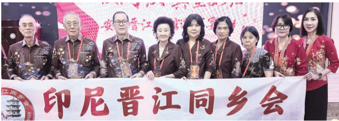
印尼晋江庆贺团一行合影。