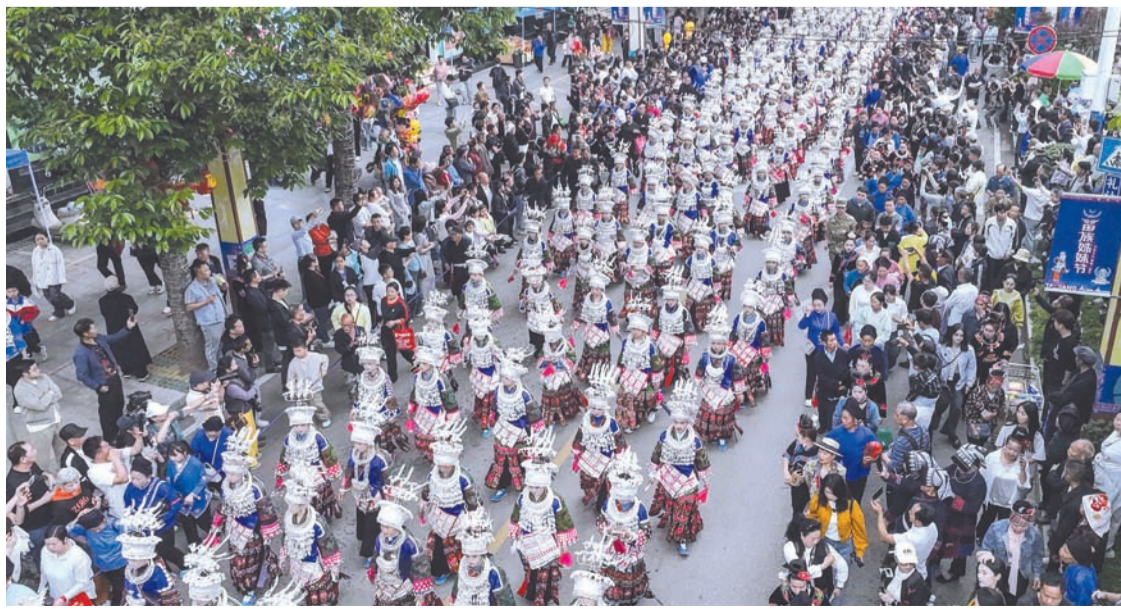
5月2日,贵州·台江2026年苗族姊妹节主要活动——万人盛装游演。(无人机照片)

风情。节日期间,当地还举办万人唱响翁你河、苗族绣技能大赛、“村BA”篮球赛等系列活动,为游客打造一场沉浸式的民族文化体验之旅。