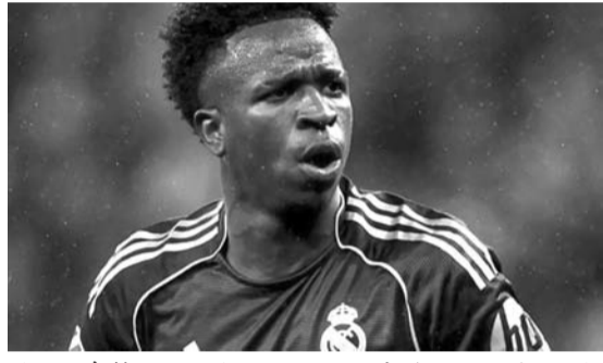
皇马前锋维尼修斯·儒尼奥尔。

第35分钟，阿诺德主罚皇马前场左路定位球开到禁区，门前皇马三点争顶都没能顶到。第40分钟，加西亚左路传中，禁区内巴尔韦德头球攻门角度太正被没收。 第45+2分钟，埃斯波西托拉拽皮塔奇染黄。 第45+3分钟，多兰禁区左侧小角度打门被皇马双人放铲封堵出底线，随后卡夫雷拉角球的头球攻门被卢宁神扑化解。