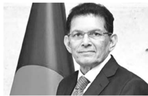
孟加拉国外长卡利勒

发言人指出，中方高度重视中孟关系，愿以此访为契机，同孟加拉国新政府一道努力，增进政治互信，深化各领域交流合作，高质量共建“一带一路”，推动中孟全面战略合作伙伴关系进一步向前发展。