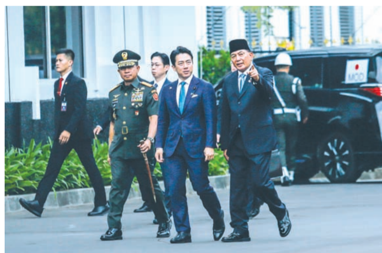
2026年5月4日，印尼国防部长夏弗里·善苏丁 (右) 同印尼国军总司令阿古斯·苏比延托上将 (左) 在雅加达国防部迎接日本防卫大臣小泉进次郎 (中) 的到来。

【本报讯】周一 (5月4日)，印尼国防部长夏弗里·善苏丁与日本防卫大臣小泉进次郎在雅加达举行了双边会晤。此次会晤是强化两国战略伙伴关系及签署防务合作协议的关键议程。 此前，两国防长已于5月3日在巴厘岛穆丽雅酒店的工作晚宴上进行了初步交流。席间，夏弗里与小泉对印尼与日本之间长期保持的良好关系相互表示赞赏。 夏弗里希望两国能够围绕全球战略发展交换信息。他还表示，此次会晤是2026年首次印尼-日本防长会议。他指出，此次会谈基于相互尊重和互利共赢的原则。他解释说，双方将就防务建设进行建设性意见交流，同时加强在人道主义和灾害应对领域的合作。