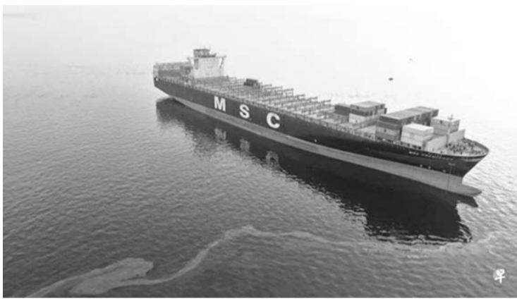
路透社4月24日取得的图像显示，一艘悬挂巴拿马国旗的集装箱船MSC弗朗西斯卡号（MSC Francesca）在霍尔木兹海峡遭伊朗革命卫队扣押。

公告称，新推出的这项服务将欧洲重要港口直接连接到沙特的阿卜杜拉国王港、吉达港和约旦的亚喀巴港，并通过多式联运服务连接至阿联酋和其他海湾地区。首次航运计划于5月10日从比利时安特卫普港出发。据美国方面2日消息，地中海航运公