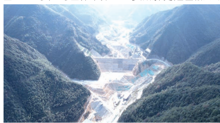
浙江松阳抽水蓄能电站下水库施工面貌。