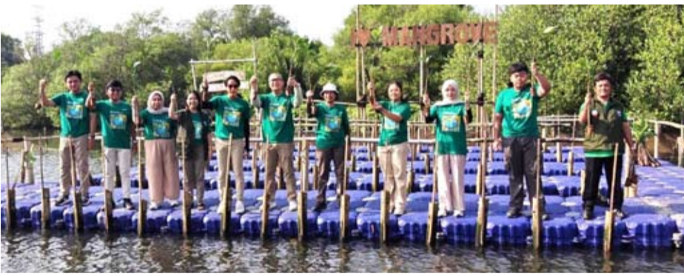
上周五(4月29日), 印尼夏普管理层与Sharp Greenerator人员在雅加达北区的Angke Kapuk防护林种植红树苗。

样性重要性的认识, 同时向他们介绍了红树林生态系统作为各类物种栖息地和环境平衡支撑者的战略作用。 “此外, 拾荒慢跑行动体现了集体对减少污染的关怀, 所有收集到的垃圾将被记录在案, 作为衡量活动影响的一部分。” 该活动也是Sharp Greenerator长期历程的一部分, 这是一项自2015年以来一直持续开展的环境倡议。近年来, 该项目已动员了数千名年轻人参与环境保护行动, 从教育到实地活动。 夏普对环境的承诺反映在其此前实施的各项可持续倡议中。据记录, 印尼夏普已在印尼各地种植了数千棵红树, 包括作为蓝碳生态系统修复的一部分, 在万丹省沿海地区种植了超过3,300棵树。 在减少垃圾方面, 在群岛地区开展的环境清洁活动单次就收集了数十公斤垃圾, 同时提高了公众对废弃物管理重要性的认识。 不仅如此, 通过自动回收机等技术驱动的创新, 夏普还推动公众在回收塑料垃圾方面的行为改变, 迄今已累计收集了超过2吨塑料。(lcm/mm)