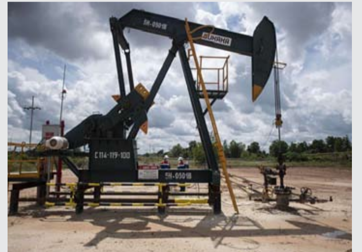
图为PT Pertamina Hulu Rokan公司 (PHR) 员工在廖内省望加丽县罗坎区块杜里油田中央集输站 (CGS-10) 检查抽油机设备。

【本报讯】印尼上游油气业务特别工作组 (SKK Migas) 近日在东加里曼丹省库台卡塔内加拉县三宝加地区发现13口新油气井, 原油储量约为96万桶, 接近100万桶。