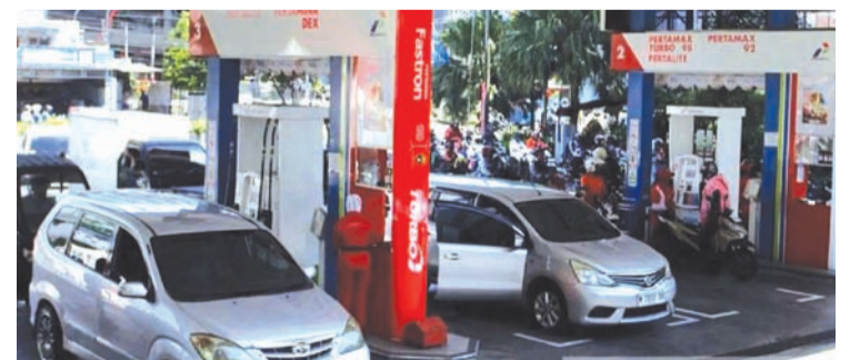
图为大量车辆用户在印尼东爪哇省玛琅市的Pertamina加油站添加燃油。

【本报讯】国油公司 (PT Pertamina) 宣布，自5月4日起对部分地区的燃油价格进行更新，其中非补贴柴油和Pertamax Turbo两种燃油价格大幅上涨，而Pertamax价格保持不变。 根据雅加达周一 (4/5) 援引Pertamina官方网站信息，该公司对燃油价格进行了调整。 例如在雅加达及周边地区 (Jabodetabek) 的记录显示，RON 98级别的Pertamax Turbo燃油价格已从4月份的每升19,400盾上涨至每升19,900盾。该地区的Pertamina Dex系列柴油类燃油价格也出现上涨。其中，CN 51级别的Dexlite燃油价格已从2026年4月的每升23,600盾上涨至每升26,000盾。