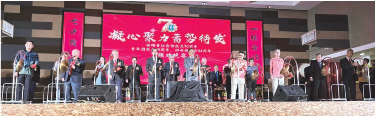
共同主持鸣锣仪式。