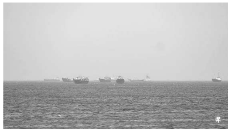
图为5月4日霍尔木兹海峡阿曼附近水域的船只。

请求美国帮助它们的船只脱困。这项名为“自由计划”的行动旨在帮助那些完全没有做错任何事的个人、公司和国家。受困海峡的船员众多，食物和其