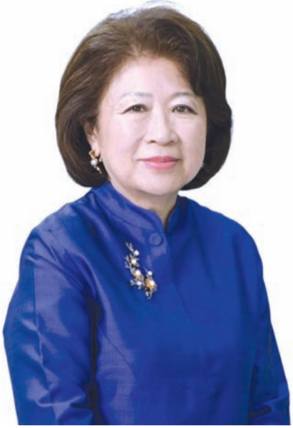
4月30日日本驻印尼大使馆网站这样公布：2026年4月29日，在2026年

春季荣誉之星颁奖典礼上，日本政府宣布向两位印度尼西亚人士授予荣誉之星，以表彰他们为加强日本和印度尼西亚之间的关系所作出的贡献。