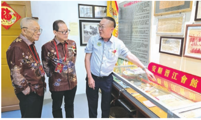
参观“安顺晋江历史与文物馆”。