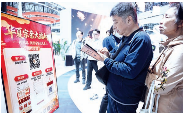
4月30日,“华夏宗亲大福树”吸引众多参观者驻足体验。

福建社会科学院两岸融合发展研究中心秘书长苏美祥研究员表示,寻根之旅从“山重水复”变得“柳暗花明”,跨越世代与山海的