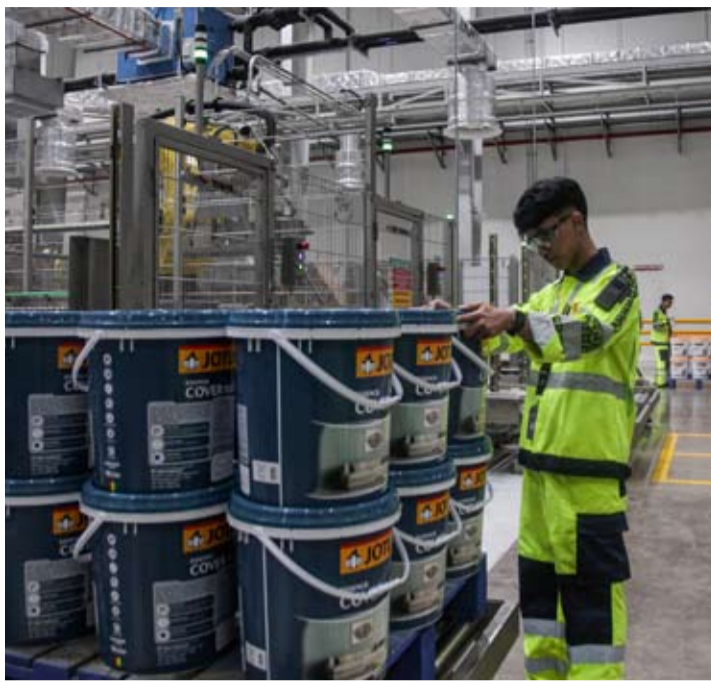
2026年4月15日在西爪省勿加西县芝卡朗, 佐敦印尼公司 (PT Jotun Indonesia) 新建工厂内, 工人进行涂料生产作业。