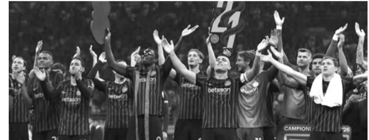
国米vs帕尔马。

第30分钟，国米前场左侧肋部打出配合，禁区内邓弗里斯尝试一脚射门，被防守球员封堵。 第37分钟，迪马尔科头球，这球击中斯特雷费扎面部，后者倒地休息了一会继续比赛。 第40分钟，国米策动