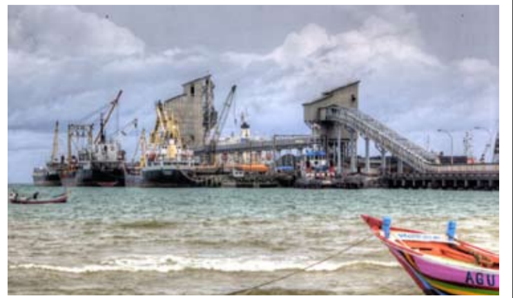
印尼水泥公司位于东爪哇省图班工厂的码头和生产设施开发项目。

【本报讯】印尼水泥公司(PT Semen Indonesia Tbk, 简称SIG)在完成位于东爪哇省图班(Tuban)工厂的码头及生产设施扩建项目后, 正瞄准扩大出口市场。