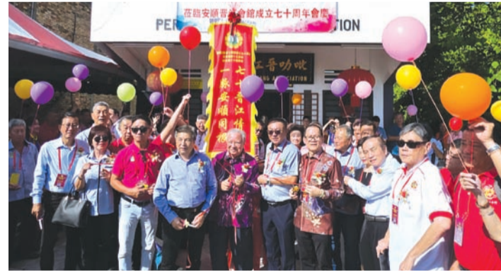
共同发放气球仪式。