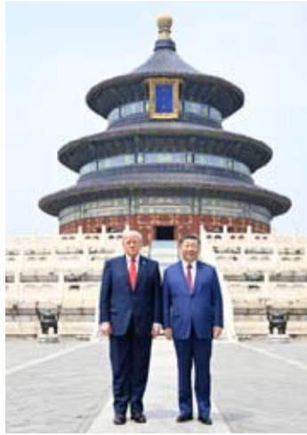
5月14日, 国家主席习近平同来华进行国事访问的美国总统特朗普参观天坛。

政治上, 中美关系在经历跌宕起伏后实现了总体稳定, 为理性声音提供了生长的土壤。在元首外交引领下, 双方正在探索一条“竞争中防失控、博弈中求合作”的相处之道。在今年2