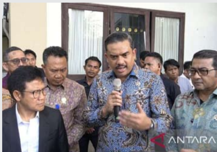
2026年5月13日, 印尼中小企业部长马曼·阿卜杜拉赫曼在巴厘岛巴东县出席“十名创意经济中小企业营业贷款集体签约仪式”期间, 讨论了电商平台拟上调服务费的计划。

【本报讯】印尼中小企业部长马曼·阿卜杜拉赫曼暂时禁止电商平台(如Shopee或Tokopedia)提高服务费。