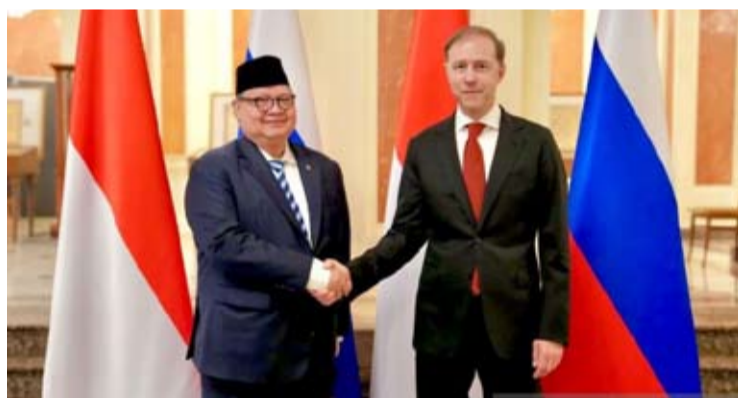
2026年5月13日, 印尼经济统筹部长艾尔朗加·哈尔塔托(Airlangga Hartarto, 左)在俄罗斯喀山举行的第14届印尼—俄罗斯联合委员会会议期间, 会见俄罗斯联邦第一副总理杰尼斯·曼图罗夫(Denis Manturov, 右)。

艾尔朗加表示, 第14届印尼—俄罗斯联合委员会会议《议定纪要》的签署, 体现出双方持续深化并落实重点领域双边合作的共同意愿, 也符合两国