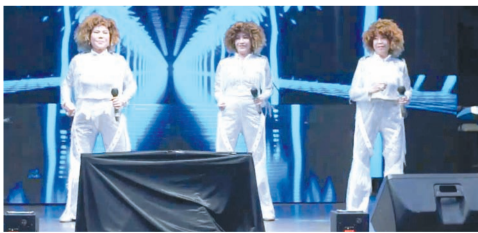
三位女声小组演唱。