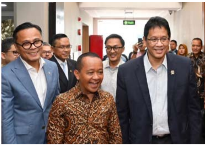
财政部长普尔巴亚·尤迪·萨德瓦(Purbaya Yudhi Sadewa)与能源与矿产资源部长巴赫利尔·拉哈达利亚(Bahlil Lahadalia)

普尔巴亚同时提及此前被指存在合规问题的约40家中国钢铁企业。他表示, 印尼税务总局已与