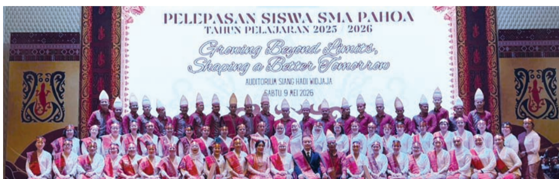
毕业典礼全体教师（筹委会）合影