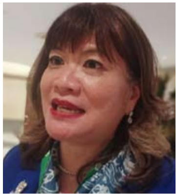
印尼企业家协会(Apindo)主席欣塔·维查亚·卡姆达尼(Shinta W. Kamdani)