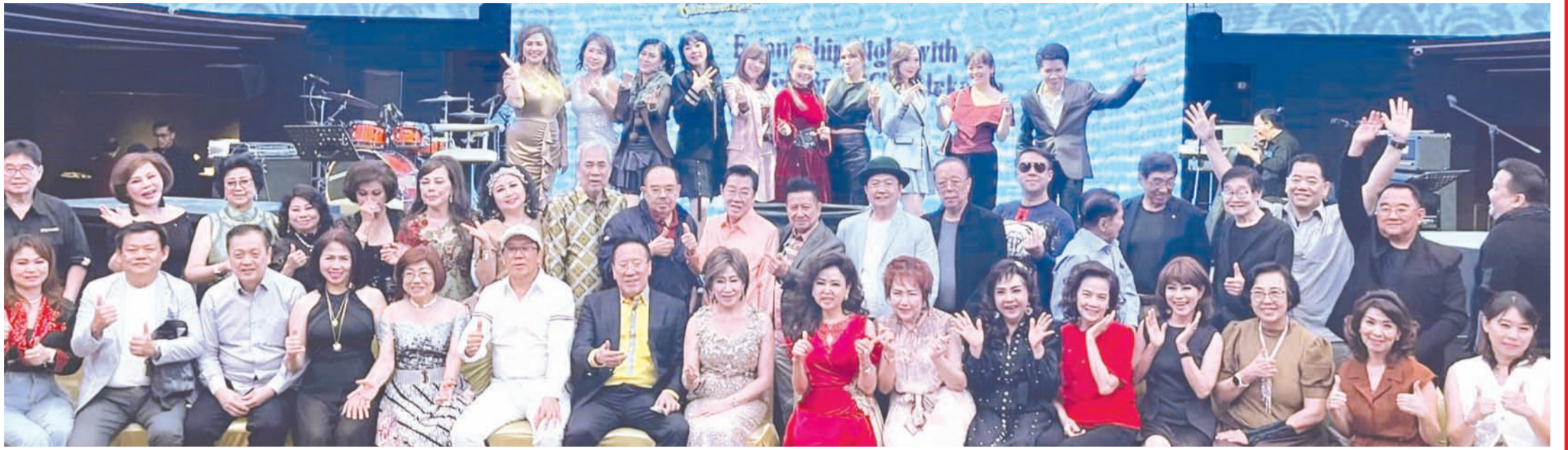
雅加达幸运草歌唱团与泗水微笑歌舞俱乐部歌友们合影留念。