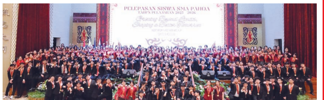
第15届八华高中毕业生大合照