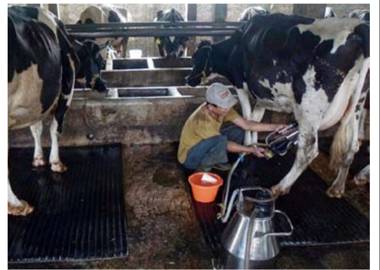
工人正在养殖场里挤牛奶。

集团的快速消费品业务线整合。她表示, 乳制品业务将成为公司快速消费品组合的一部分, 该组合此前已拥有多个食品和饮料品牌。