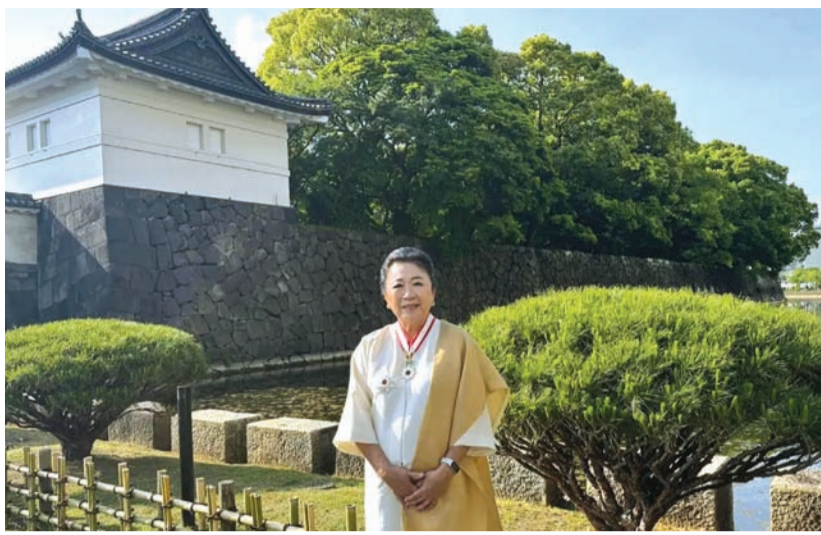
冯慧兰博士荣获日本天皇授予旭日重光奖章