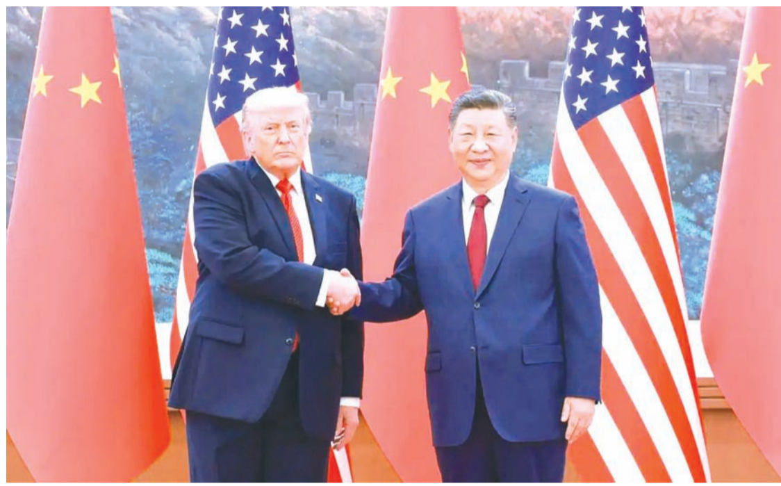
2026年5月14日，中国国家主席习近平在北京人民大会堂同来华进行国事访问的美国总统特朗普举行会谈。

天的会晤是一次举世瞩目的重要会晤。我愿同习主席一道，加强沟通合作，妥善解决分歧，开启有史以来最好的中美关系，开创两国更加美好的未来。美中是世界上最重要、最强大的国家，美中合作可以为两国、为世界做很多大事、好事。我此访带来了美国工商界杰出代表，他们都很尊重和重视中国，我积极鼓励他们拓展对华合作。”