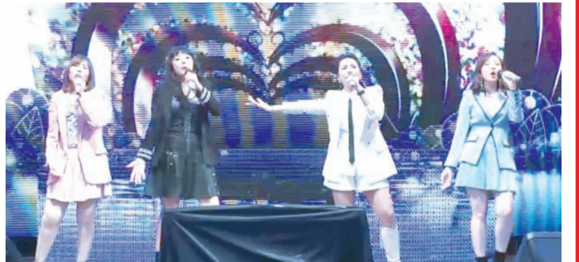
四位女声小组演唱。