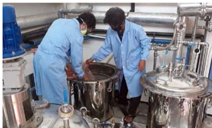
印尼科学院(LIPI)的研究人员在南丹格朗Serpong的Puspitex化学研究中心对草药发现进行实验室测试。

【本报讯】投资与下游化部/投资统筹机构(BKPM)正在促成一项来自日本的外国投资计划, 该计划价值14亿美元, 瞄准制药领域, 旨在印尼建设原料药 (Active Pharmaceutical Ingredients, 简称API) 产业。