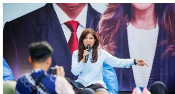
通信与数字事务部长梅蒂亚·哈菲德于5月13日在北苏门答腊省棉兰市举行的“反网络赌博行动”活动中发表讲话。

她说:“我们不仅仅是关闭访问权限或进行下架处理。更重要的是,要用这些事实影响广大公众,让各家庭和社区内部自发