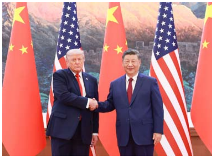
5月14日上午，国家主席习近平在北京人民大会堂同来华进行国事访问的美国总统特朗普举行会谈。

习近平强调，台湾问题是中美关系中最重要、最敏感的问题。处理好了，两国关系就能保持总体稳定。处理不好，两国就会碰撞甚至冲突，将整个中美关系推向十分危险的境地。“台独”与台海和平水火不容，维护台海和平稳定是