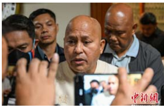
当地时间5月12日，菲律宾参议员、前国家警察总监罗纳德·德拉罗萨在菲律宾参议院接受媒体采访。

菲律宾马尼拉南部警区14日发表声明称，13日晚在参议院大楼区域内连开数枪的嫌疑人已被逮捕，该嫌疑人为现年44岁的菲律宾国家调查局司机。