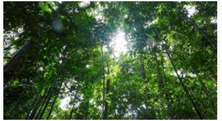
努山达拉首都管理局辖区内的森林区域。

【本报讯】努山达拉首都管理局(OIKN)正利用科技手段加强应对潜在森林和土地火灾的准备工作。OIKN在辖区内的七个区域安装了火灾传感器,以应对今年旱季可能出现的厄尔尼诺(El Nino)现象。