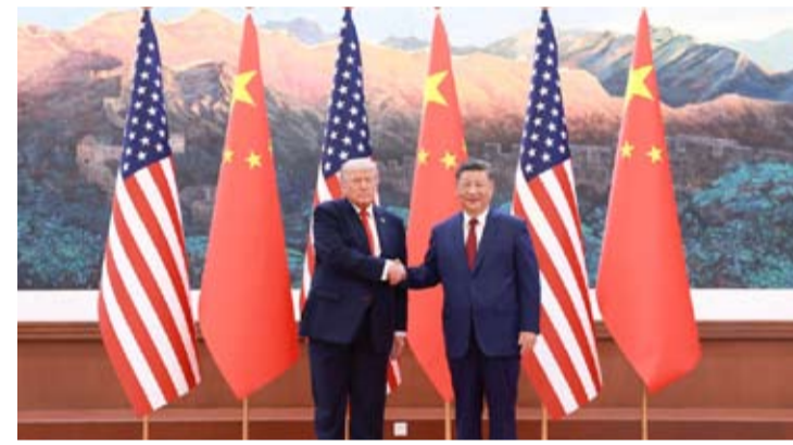
5月14日上午，国家主席习近平在北京人民大会堂同来华进行国事访问的美国总统特朗普举行会谈。

习近平强调，中美之间的共同利益大于分歧，中美各自成功是彼此的机遇，中美关系稳定是世界的利好。双方应当做伙伴而不是对手，相互成就、共同繁荣，走出一条新时代大国正确相处之道。我期待着同特朗普总统就事关两国和世界的重大问题交换意见，共同为中美关