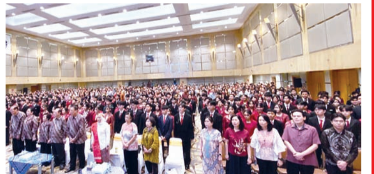
新入会校友与老校友合影