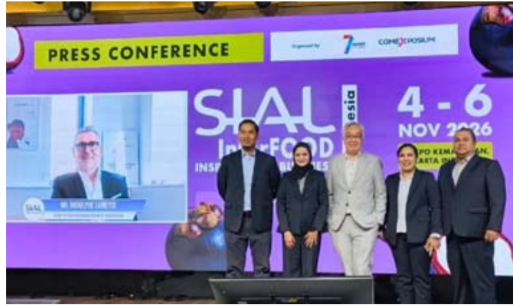
2026 SIAL Interfood展览会的新闻发布会。

【本报讯】2026年国际食品饮料行业展览会Salon International de l'Alimentation (SIAL) Interfood 将于2026年11月4日至6日在雅加达国际展览中心 (JIE expo Kemayoran) 举行。 主办方Seven Events和Comexposium表示, 这项展会是SIAL全球展览网络的一部分, 旨在加强印尼的国际食品贸易联系。 Comexposium食品饮料部门首席执行官鲁道夫·拉梅斯 (Rodolphe Lameyse) 在雅加达发表声明称: "SIAL Network正迈入一个非常重要的新篇章。"