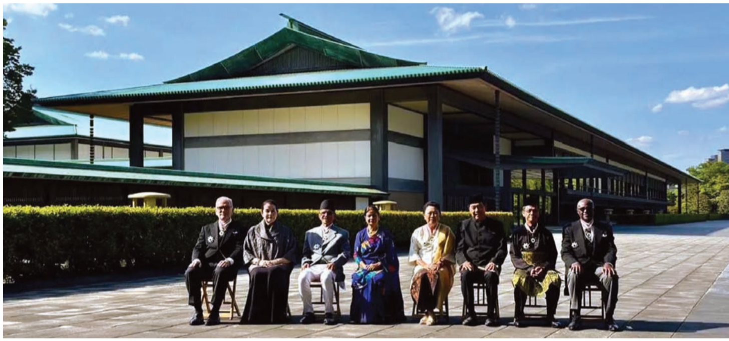
颁奖仪式结束后,获奖者一同合影