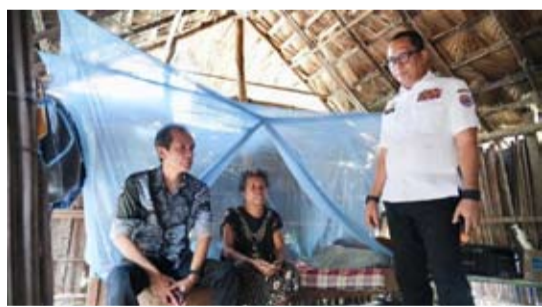
国家边境管理局秘书马赫鲁齐·拉赫曼走访边境地区,视察接受房屋质量提升援助计划受益居民的房屋状况,以了解实际情况。

【本报讯】国家边境管理局(BNPP)秘书马赫鲁齐·拉赫曼(Makhruzi Rahman)亲自视察在边境地区接受《15,000套不适宜居住房屋质量改善援助计划》的受益居民的房屋状况。