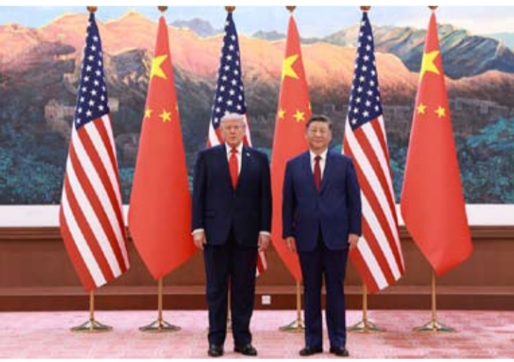
5月14日上午，国家主席习近平在北京人民大会堂同来华进行国事访问的美国总统特朗普举行会谈。

习近平强调，台湾问题是中美关系中最重要、最敏感的问题。处理好了，两国关系就能保持总体稳定。处理不好，两国就会碰撞甚至冲突，将整个中美关系推向十分危险的境地。“台独”与台海和平水火不容。维护台海和平稳定是中美双方最大公约数。