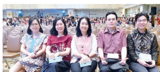
高中部学术部主任老师合影