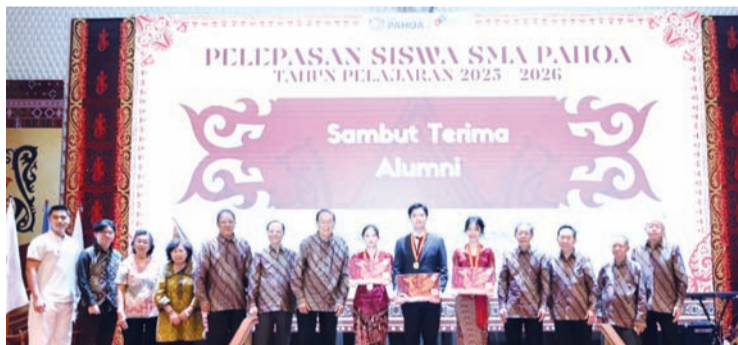
参加毕业典礼的学校领导、老师，毕业生和家长们