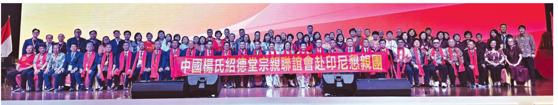
印尼杨氏宗亲总会诸理事与来自国内外宗亲们合影留念。