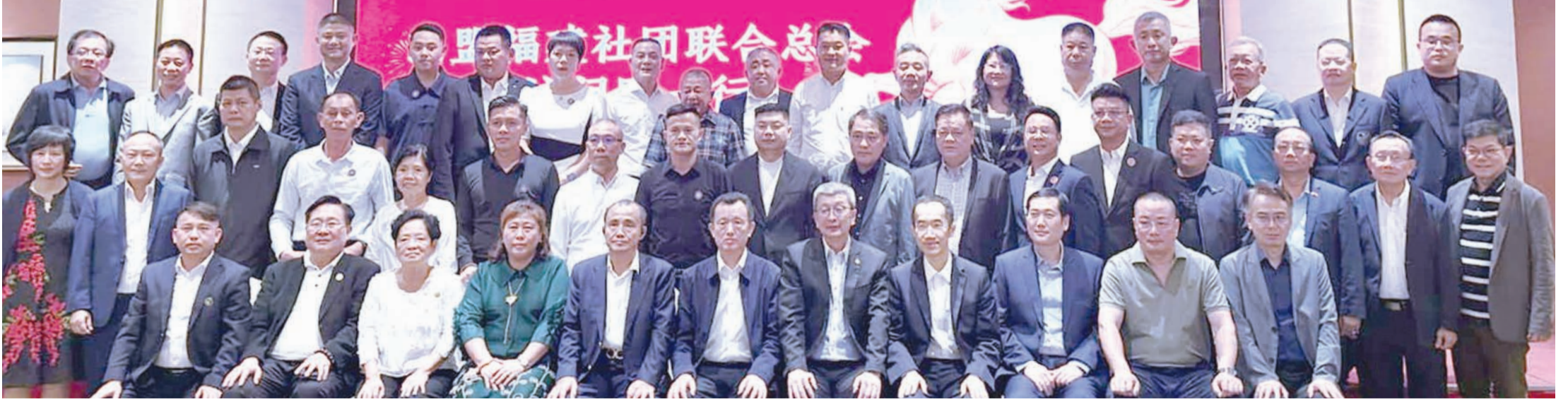
11日晚的福建省侨联欢迎晚宴。