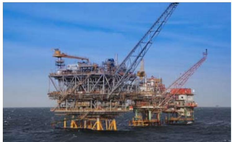
海上石油钻井平台示意图。

【本报讯】印尼政府正加快推进位于纳土纳(Natuna)海域的图纳(Tuna)区块后续开发工作。俄罗斯油气企业俄罗斯海外石油公司(JSC Zarubezhneft)表示, 将于2026年6月重新启动该项目开发。