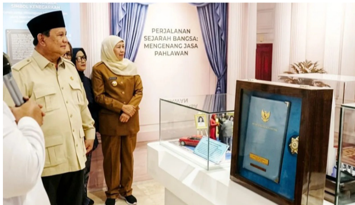
普拉博沃·苏比安托总统与东爪哇省省长科菲法·因达尔·帕拉万萨于5月16日一同视察了东爪哇省恩甘朱县苏科莫罗区Nglundo村的马尔西娜博物馆。

【本报讯】东爪哇省恩甘朱县的居民在目睹普拉博沃·苏比安托总统亲自为缅怀劳工活动家马尔西娜(Marsinah)斗争事迹而修建的马尔西娜博物馆揭幕,民众表达了深切的感动。周六(16/5),根据雅加达政府通信局收到的声