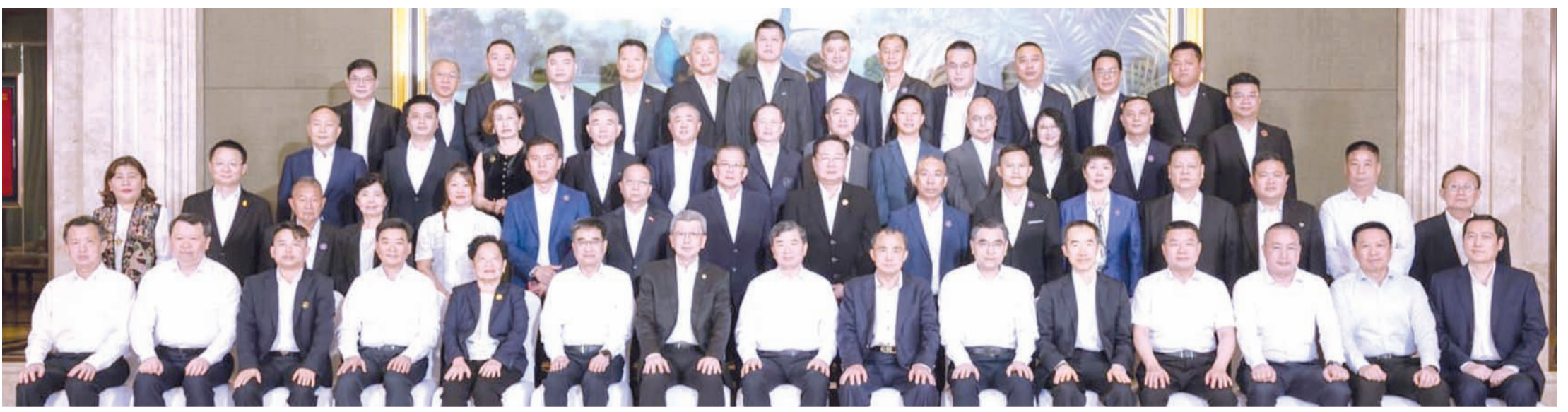
座谈会后合影留念。