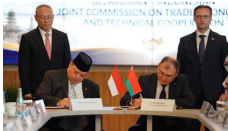
2026年5月15日, 在白俄罗斯明斯克举行的第8届印尼—白俄罗斯贸易、经济与技术合作联合委员会会议期间, 印尼经济统筹部长艾尔朗加·哈尔塔托(左)与白俄罗斯副总理维克托·卡兰克维奇(右)共同签署《2026—2030年白俄罗斯—印尼重点合作领域发展路线图》。

会议期间, 印尼与白俄罗斯围绕贸易、投资、工业、农业、粮食安全、科技、教育、医疗卫生以及旅游等领域合作深入交换意见。印尼方面将白俄罗斯视为发展技术型制造