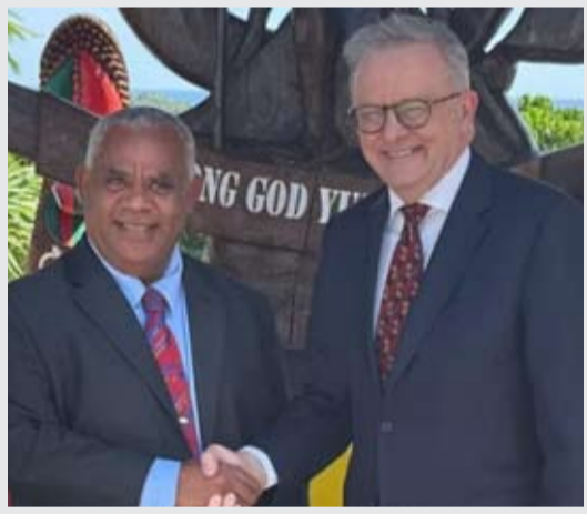
瓦努阿图总理乔瑟姆·纳帕特和澳大利亚总理阿尔巴尼斯。(资料照)

近期,瓦努阿图与澳大利亚围绕新版《纳卡马尔协议》的谈判取得进展。瓦努阿图政府已批准协议文本,其中并未纳入限制中国投资瓦努阿图关键基础设施及其他敏感领域的相关条款。这份协议从提出到临近签署,历经反复修改,恰恰暴露出澳大利亚南太政策中的