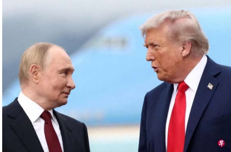
美国总统特朗普（右）结束访华行程后，俄罗斯总统普京（左）也即将启程访问中国两天。这是北京罕见在短短一周内连续接待美俄两国领导人。图为两人去年8月在阿拉斯加安克雷奇会晤。

【中新社北京5月17日电】美国总统特朗普甫一结束对中国的国事访问，俄罗斯总统普京即将启程来华。