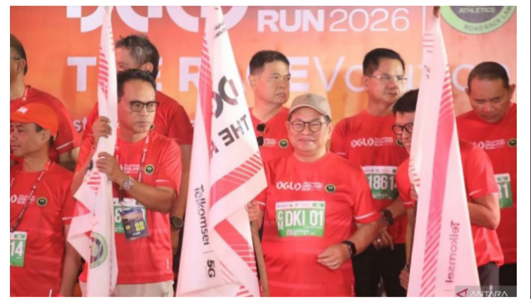
周日(5月17日)上午,雅加达省长普拉莫诺出席在Gelora Bung Karno北广场举行的2026年Digiland半程马拉松赛的开跑仪式。

普拉莫诺说,“我们希望通过此类活动,在雅加达市民中培养运动精神,并将这座城市打造成为一座现代化、开放、健康的城市,吸引世界各地