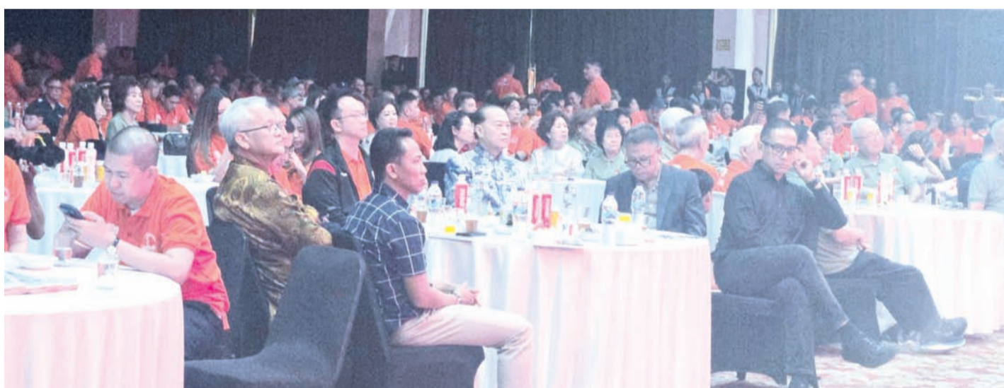
与会嘉宾在欢迎宴会上的一景。