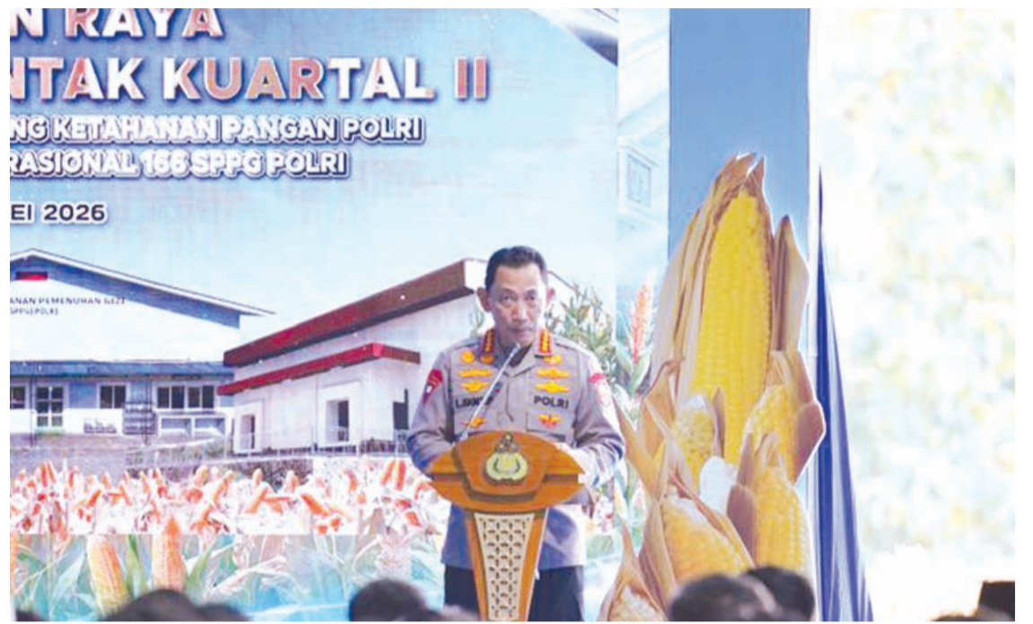
2026年5月16日, 印尼国家警察总长里斯蒂奥在东爪哇省图班县举行的第二季度玉米同步大丰收、国警10座粮食储备库奠基以及国警166个营养履行服务单位(SPPG)正式运营启动仪式上, 向普拉博沃总统作出报告。

总警长介绍了国警在支持粮食安全与社区经济赋权方面, 特别是在农业和中小微企业领域所实施的创新举措。其中一项创新是与本地中小微企业合作, 将农业废弃物加工成替代能源。里斯蒂奥介绍说, 警方推动利用玉米芯制成名为“奇迹炭”的炭块, 可用于家庭需求、鸡舍取暖, 乃至替代小企业使用的木柴。