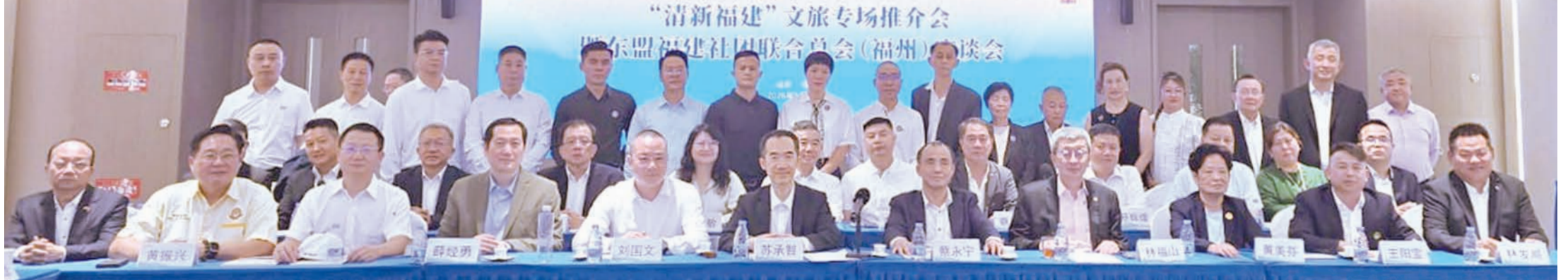
出席座谈会代表合影留念。