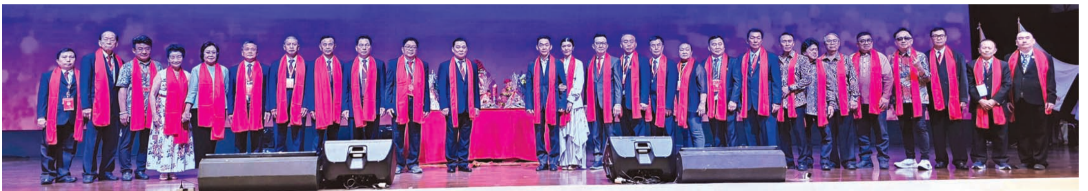
与会国内外杨氏宗亲祭祖后合影留念。