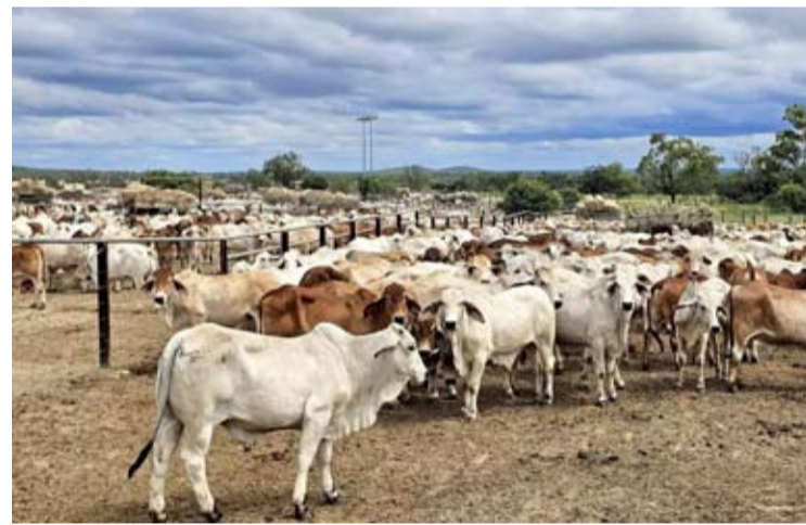
Perumda Dharma Jaya正加速采购7500头进口牛。

【本报讯】Perumda Dharma Jaya正加速采购7500头进口牛, 作为在地缘政治动态和气候变化可能扰乱全球供应链的背景下, 维护雅加达特区粮食安全的一项预防性措施。