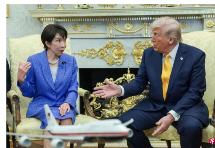
3月19日，美国总统特朗普在白宫椭圆形办公室会见日本首相高市早苗。

稳固的日美同盟关系，并峰会等契机，在未来持续商定将借助下月七国集团深化双边协作。