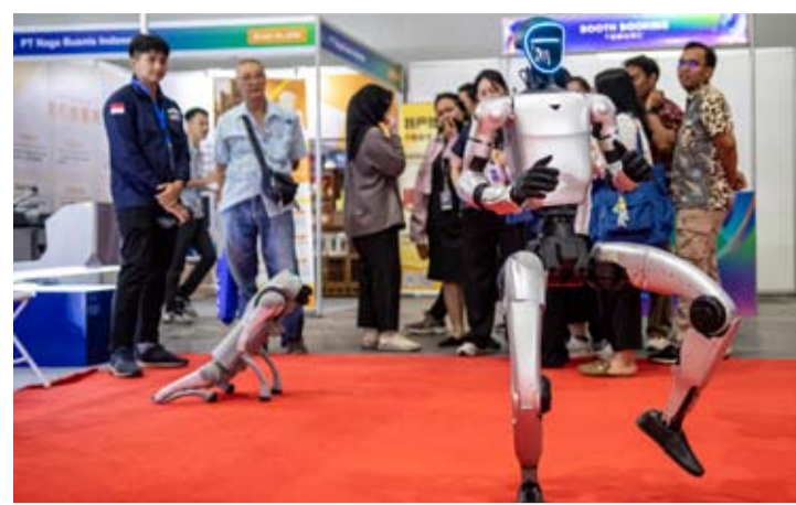
2026年5月12日, 观众在位于雅加达国际会展中心(JIExpo)举行的2026印尼国际煤炭及能源工业博览会(ICEE 2026)上参观人形机器人。此次矿业技术与工业装备展览于2026年5月11日至13日举行, 共吸引超过150家企业参展。