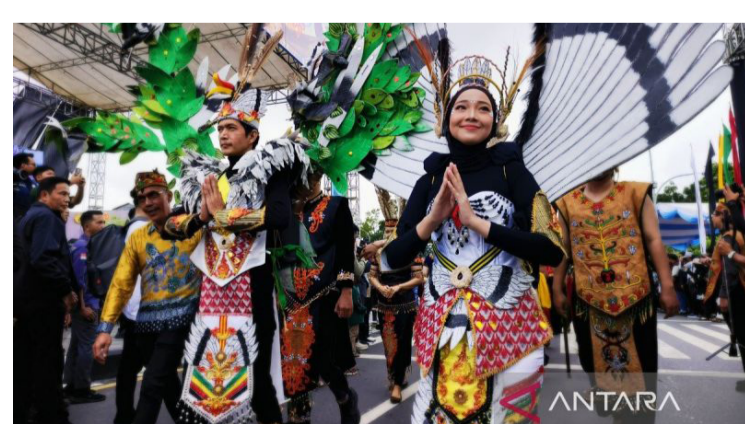
5月17日(周日)在帕朗卡拉亚举行的2026年中加里曼丹伊森穆朗文化节嘉年华,充分展现了中加里曼丹丰富的艺术文化。

伊森穆朗文化节嘉年华的步行游行队伍从帕朗卡拉亚大环形路出发,途经伊玛目·邦约尔(Imam Bonjol)街、小环形路、迪波内戈罗街、苏迪罗胡索多( )街,最终抵达萨纳曼·曼蒂凯(Mantikei)体育场。