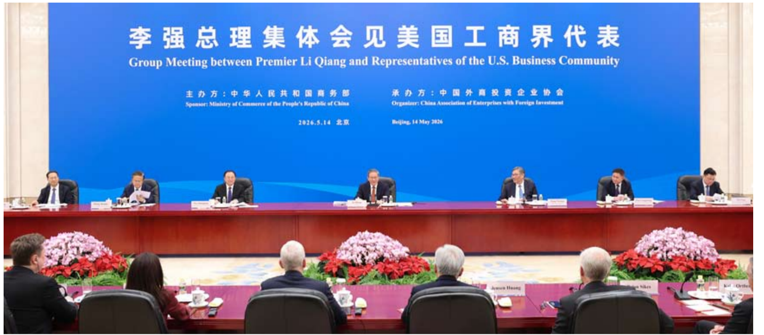
5月14日下午,国务院总理李强在北京人民大会堂会见随同美国总统特朗普访华的美国工商界代表。

其三,创新生态加速跃升,中国正从“世界工厂”迈向全球创新策源地。2025年,全国新设立外商投资企业超7万家,实际使用外资近7500亿美元,电子商务、医疗健康、高端制造业等领域引资增长强劲。苹果公