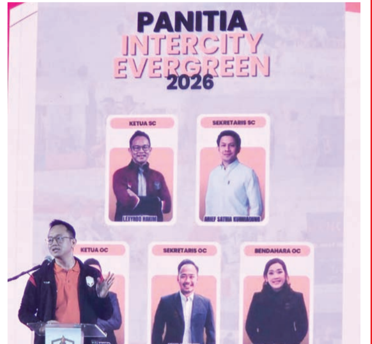
2026年城际常青元老篮球赛筹委会理事成员。