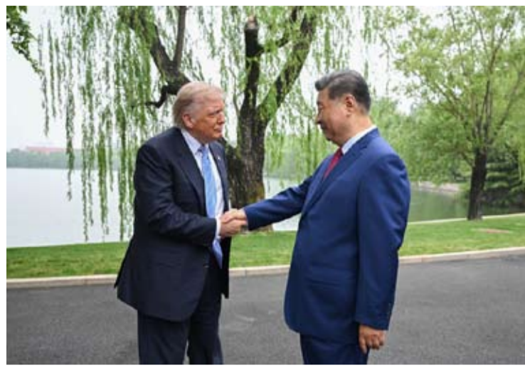
5月15日上午，国家主席习近平在中南海同美国总统特朗普举行小范围会晤。这是特朗普抵达时，习近平热情迎接。