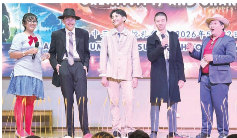
十年级A学生们表演后接受司仪访问。