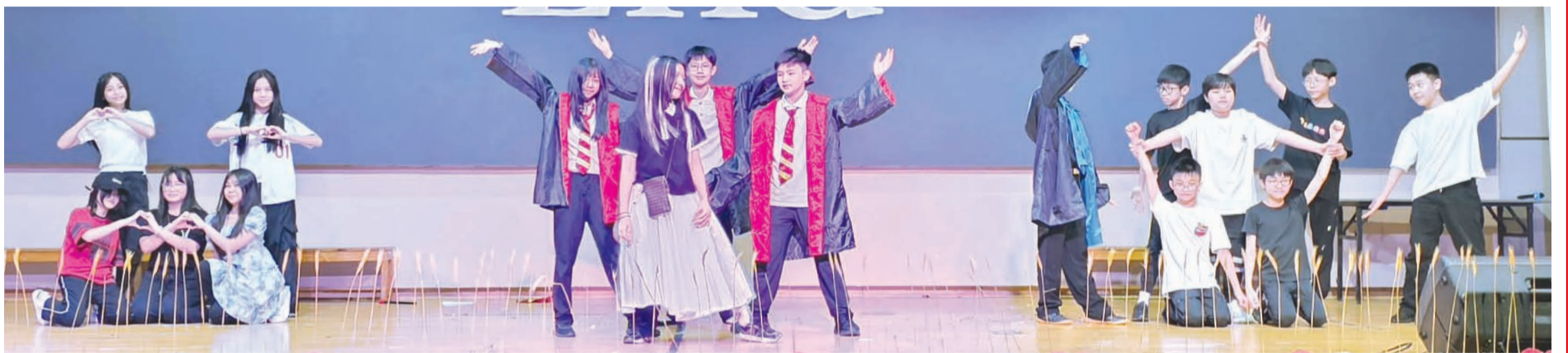
学生们呈献精彩表演。