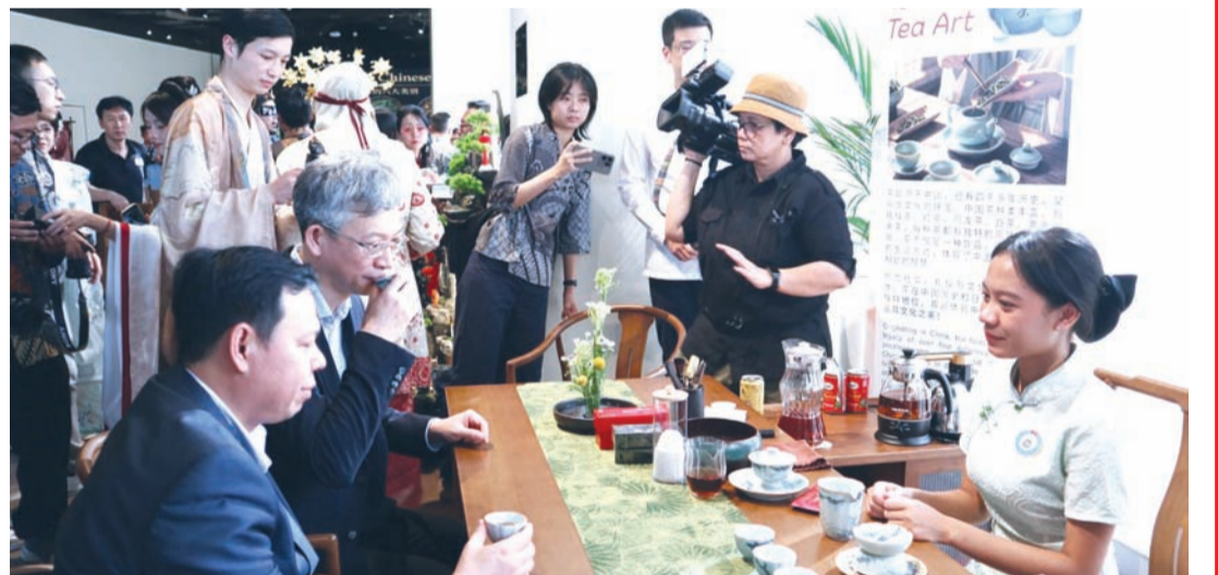
中国驻印尼大使王鲁彤与印尼地方代表理事会主席纳加穆丁品茶一景。