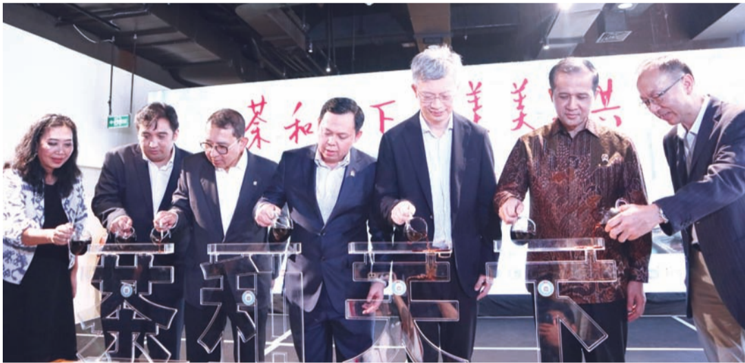
中国驻印尼大使王鲁彤、印尼国会地方代表理事会主席纳加穆丁、文化部部长法德利、人口流动部部长伊夫提塔赫等出席活动开幕仪式。

以茶为媒，薪火相传；以文聚力，共赴新程。未来，期待中印尼两国持续深耕人文交流沃土，跨越山海、同心同行，让传统友谊历久弥新，让命运共同体之花常开长盛！