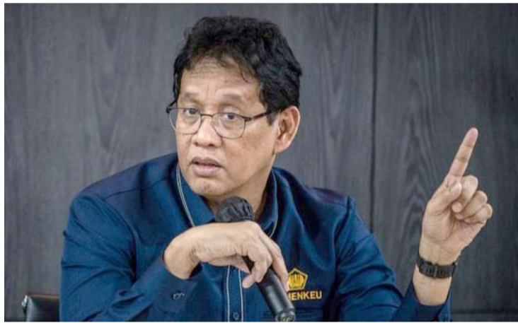
财政部部长普尔巴亚

【雅加达讯】财政部部长普尔巴亚 (Purbaya Yudhi Sadewa) 表示, 如果海关总署署长贾卡·布迪·乌塔玛 (Djaka Budhi Utama) 证实收受受贿案件, 他准备解雇贾卡。