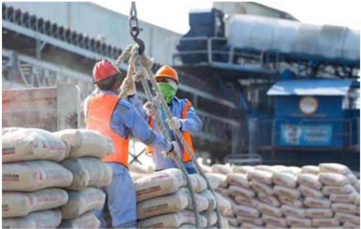
Semen Gresik 袋装水泥在SIG特运码头 (Tersus) 装卸作业。

【本报讯】印尼水泥公司 (Semen Indonesia/SMGR或SIG) 正加强研发和创新, 开发环保可持续发展的建筑材料。