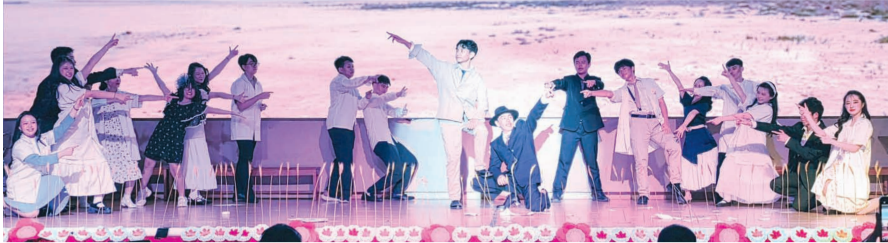
十年级A学生们呈献Oppenheimer音乐剧。