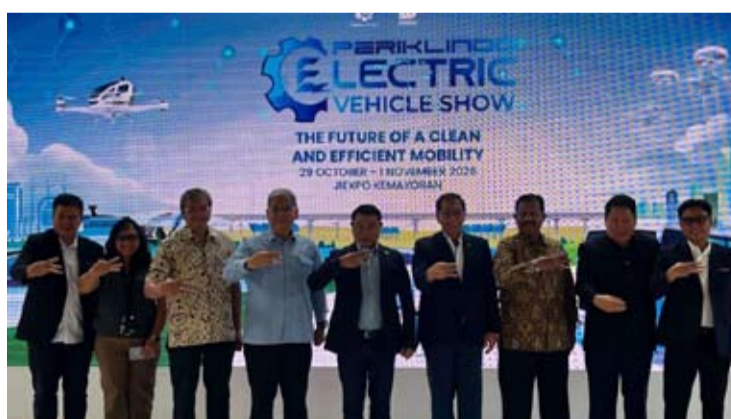
2026年印尼电动汽车展将于2026年10月29日至11月1日在雅加达国际展览中心举行。

示, 电动汽车的发展如今已成为未来出行的组成部分, 尤其在全球能源价格不确定的背景下更如此。