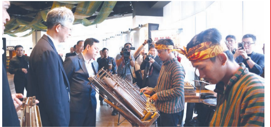
中国驻印尼大使王鲁彤与印尼地方代表理事会主席纳加穆丁参观一景。