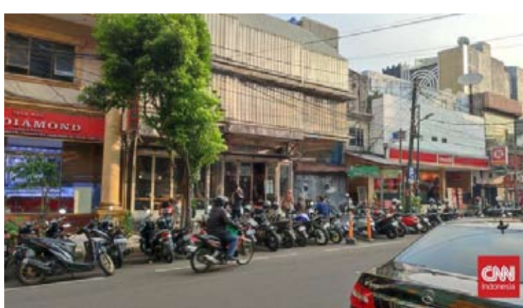
以维护公共秩序, 雅加达特区省政府逮捕了 Blok M区域的13名非法停车管理员。

【本报讯】雅加达特区省政府于5月21日 (周四) 在南雅加达Blok M区域开展了打击非法停车的行动。此举旨在维护公共