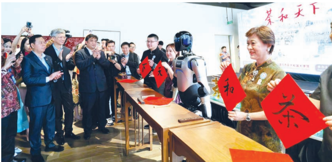
中国驻印尼大使王鲁彤与印尼地方代表理事会主席纳加穆丁参观现场挥毫。