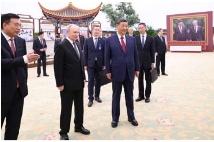
5月20日晚，国家主席习近平同俄罗斯总统普京在北京人民大会堂共同参观“传承中俄世代友好 树立大国关系典范”图片展。

“无论国际形势如何变乱交织，俄中关系始终稳健前行。”俄罗斯亚太地区研究中心主任谢