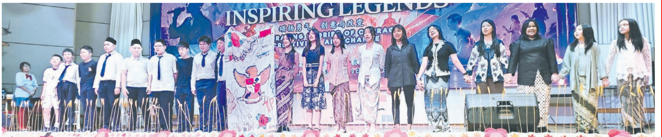
十年级A学生们呈献精彩音乐剧。