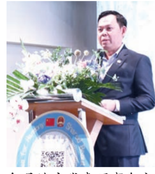
印尼地方代表理事会主席纳加穆丁致辞。