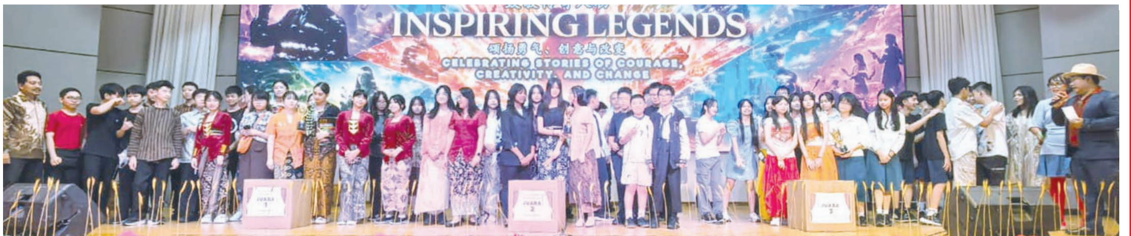
获奖学生们领取奖品后合影。