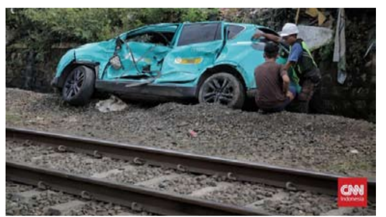
警方将绿色SM出租车司机RPP列为在勿加泗平交道口的通勤列车与电动出租车相撞事故的嫌犯。

SM出租车在平交道口因电气系统故障抛锚。随后, 该车被一列迎面驶来的通勤列车撞击。