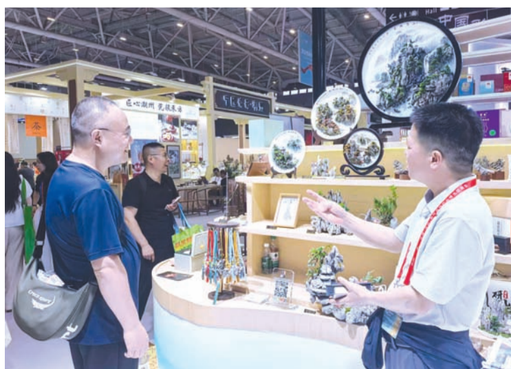
5月21日，第二十二届中国（深圳）国际文化产业博览交易会上展示多款中国非遗产品。

【中新社深圳5月22日电】（记者 张璐）正在深圳举办的第二十二届中国（深圳）国际文化产业博览交易会（简称“文博会”）上，各具特色的中国非物质文化遗产代表性项目和展品亮相，“圈粉”八方来客。