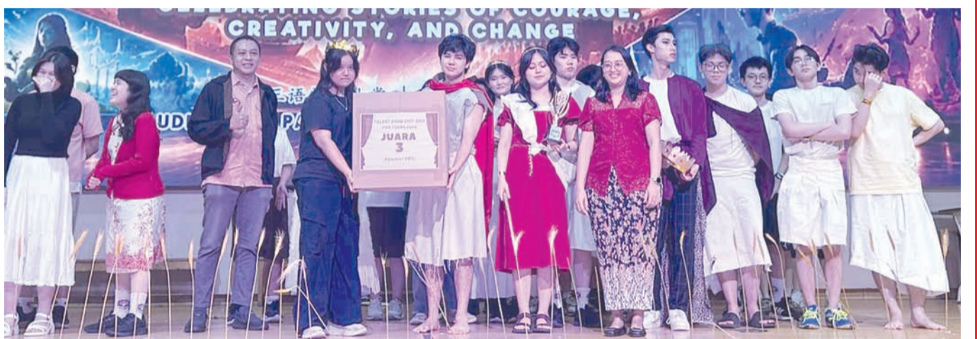
获奖学生们领取奖品后合影。