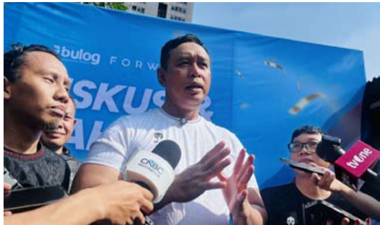
2026年5月22日, 印尼国家粮食署 (Perum Bulog) 署长艾哈迈德·里扎尔·拉姆达尼 (Ahmad Rizal Ramdhani) 在雅加达接受媒体采访。

【本报讯】据悉, 马来西亚企业目前正以每公斤16,000盾的价格洽购印尼优质大米。