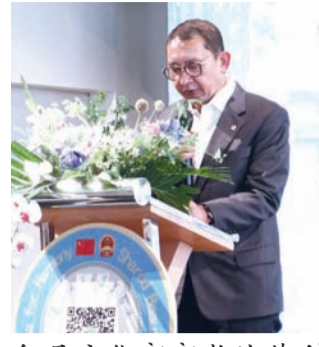
印尼文化部部长法德利致辞。