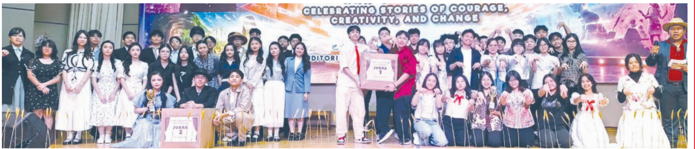
获奖学生们领取奖品后合影。