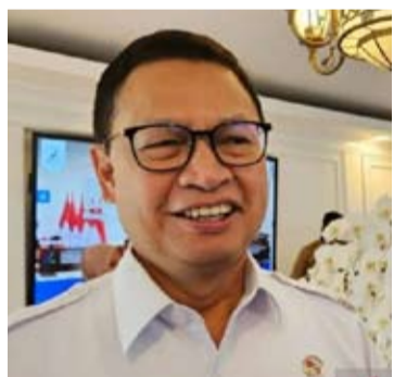
食品药品监督管理局局长Taruna Ikra。

【本报讯】食品药品监督管理局 (BPOM) 在2026年3月的监管中发现, 有22种天然药物 (OBA) 品牌含有化学成分 (BKO)。