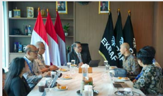
2026年5月20日, 印尼创意经济部部长特库·里夫基·哈尔夏 (Teuku Riefky Harsya) 在雅加达创意经济部办公室会见爱奇艺 (iQIYI) 代表团。

【本报讯】印尼创意经济部长兼创意经济局局长特库·里夫基·哈尔夏 (Teuku Riefky Harsya) 表示, 印尼政府正积极推动本土电影、动画、视频及数字内容等创意经济子行业发展, 并通过与中国数字娱乐平台爱奇艺 (iQIYI) 开展合作, 进一步拓展印尼本土内容进入国际市场的机会。