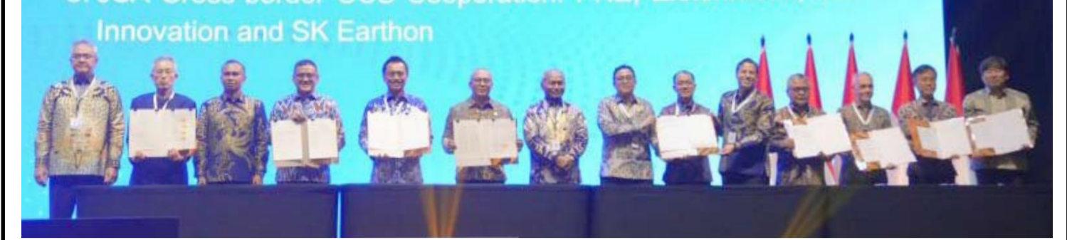
周三(5月20日), 在雅加达举行的印尼石油协会大会暨展览会期间签署一份石油和天然气合同。

【本报讯】PT PLN Energi Primer Indonesia (PLN EPI) 签署两份液化天然气买卖协议和两份天然气买卖协议, 以加强国家能源安全并为 PLN 集团提供长期天然气供应。