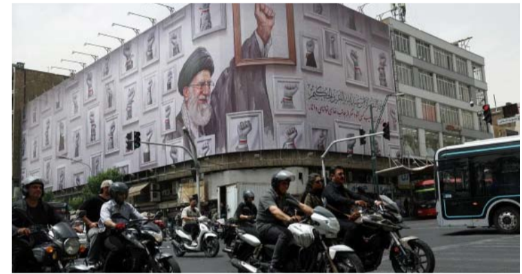
德黑兰一座建筑物外墙贴有伊朗已故最高领袖哈梅内伊画像的宣传海报。

伊朗伊斯兰革命卫队当天表示，过去24小时内，包括油轮、集装箱船及其他商船在内的31艘船只，在革命卫队海军的“协调和安全保障”下通过霍尔木兹海峡。