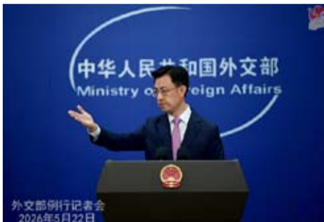
外交部例行记者会 2026年5月22日

内法规制，挑战战后国际秩序，与日方自诩“和平国家”形象背道而驰。日本“新型军国主义”成势为患，可能再次成为引发地区动荡的祸源，国际社会必须以史为鉴，高度警惕、共同遏止。