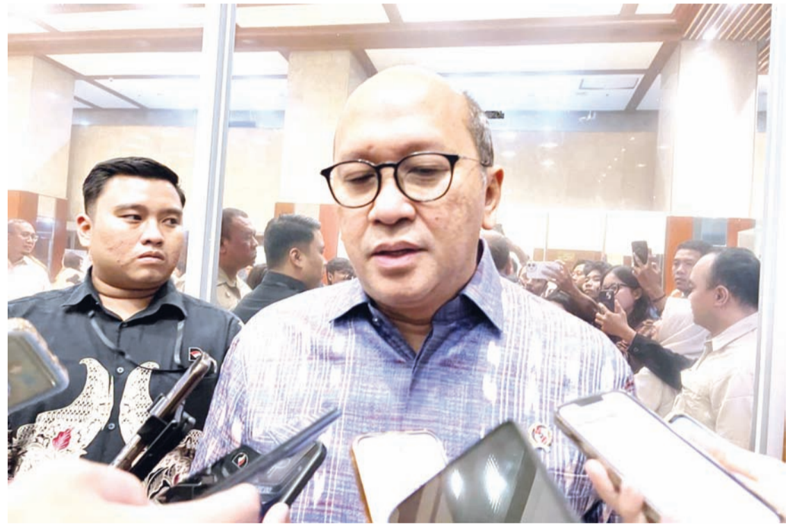
2026年5月21日，印尼投资管理机构首席执行官罗桑·罗斯拉尼在雅加达经济统筹部大楼接受记者即兴采访，回答了提问。

为，商品出口集中化可能对相关行业企业，尤其是矿业企业的信用状况产生负面影响。不过，穆迪认为，该政策从外部角度看也有可能带来积极影响，