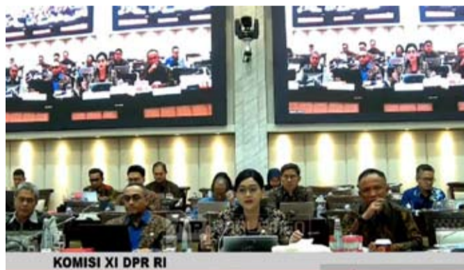
图为：5月21日 (周四)，印尼金融服务管理局 (OJK) 委员会主席弗里德里卡·维迪亚萨里·德维 (Friderica Widayarsi Dewi) 在雅加达与印尼国会第十一委员会举行工作会议并发表讲话。