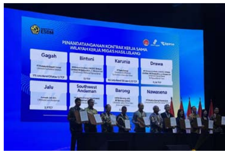
2026年5月20日, 在万丹省丹格朗举行的IPA Convex 2026活动期间, 印尼油气工作区块招标结果合作合同签署仪式现场。

此次新增的3项PSC合同包括位于西巴布亚省的宾图尼 (Bintuni) 和德拉瓦 (Drawa) 勘探区块, 以及位于东爪哇的巴龙 (Barong) 区块。其中, 宾图尼和德拉瓦区块由于毗邻唐古液化天然气项目