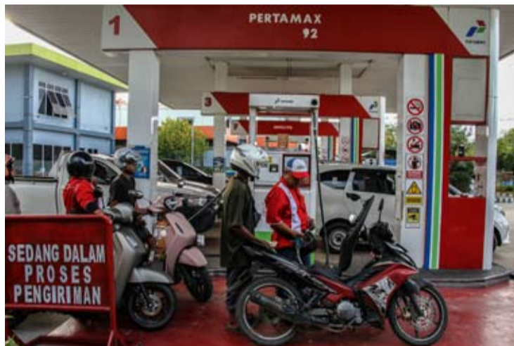
2026年5月9日, 在印尼中加里曼丹省帕朗卡拉亚市一处加油站, 工作人员给摩托车加油。

根据规划, 实施E5强制政策的地区包括雅加达、西爪哇、中爪哇、东爪哇、日惹特区、巴厘岛及楠榜省。埃尼亚指出, 印尼能源与矿产