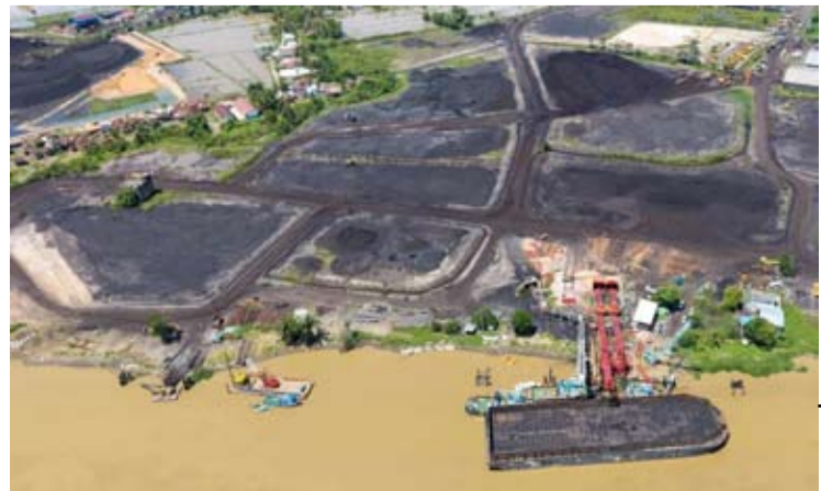
南苏门答腊非油气特别商品出口额下降。

【本报讯】新成立的专门负责商品出口的国有企业被提醒在未来履行职责时能保持透明度。