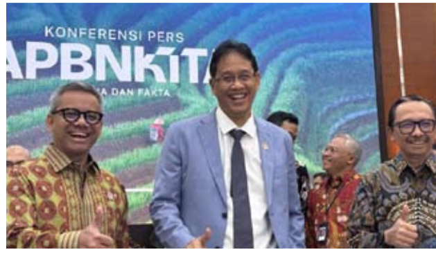
图为：财政部长普尔巴亚·尤迪·萨德瓦(中)

其中，中央政府支出同比增长51.1%，达到826万亿盾。作为国家财政掌舵人，普尔巴亚表示，这一表现反映出政府正推动全年财政支出更均衡