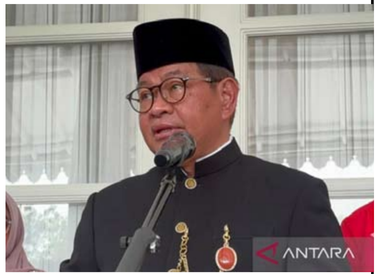
雅加达特区省长普拉莫诺·阿农于今年5月4日在雅加达市政厅发表讲话。

她指出, 普拉莫诺日后将代表东亚、东南亚、南亚及大洋洲 (ESEA0) 地区在全球发声, 并与全