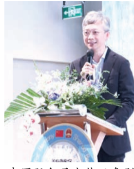
中国驻印尼大使王鲁彤致辞。

整场活动融传统古韵与现代科技于一体，内容丰富、精彩纷呈。现场开设《东方生活美学与和谐理念》茶文化讲座，深度解读中华茶文化蕴含的“和合”哲学；茗宝集与阿拉扎中文系学生带来的功夫茶艺与舞蹈融合表演，雅致灵动，惊艳全场。中印尼旋律同台交融，古筝、二胡演绎的中国经典《茉莉花》与印尼名曲《美丽的梭罗河》婉转悠扬，赢得阵阵掌声。智能机器人轮番呈现太极、武术、舞蹈表演，尽显科技活力；中印尼书法家与机器人携手挥毫，写下“茶和天