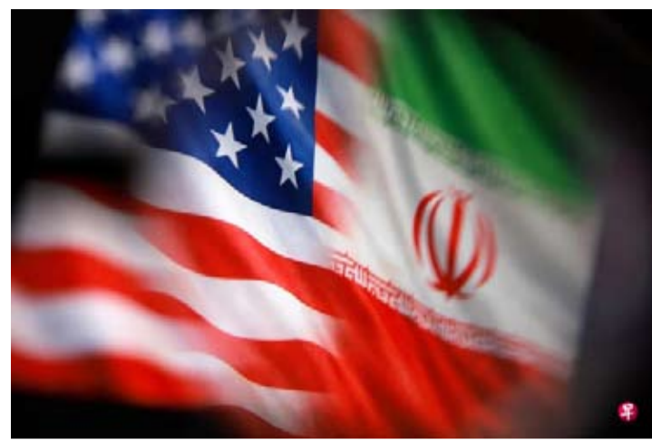
美国总统特朗普星期六(5月23日)在社交媒体发文, 称美国与伊朗已经基本谈成一份协议。这份协议内容包括开放霍尔木兹海峡。(路透社)

特朗普表示, 他刚刚与沙特、阿联酋、卡塔尔、土耳其、埃及、约旦、巴林领导人及巴基斯坦陆军参谋长通话, 讨论伊朗问题, 以及一份“和平谅解备忘录”相关的事项。特朗普称, 美国与伊朗的一份协议已基本谈成, 有待美伊双方及相关伊斯兰国家最终敲定。此外, 他还与以色列总理内塔尼亚胡进行了通话。协议的最后一个环节与细节目前正在商讨中, 将于近期公布。特朗普还说, 除协议中的诸多其他内容外, 霍尔木兹海峡也将随之开放。综合消息: 伊朗法尔