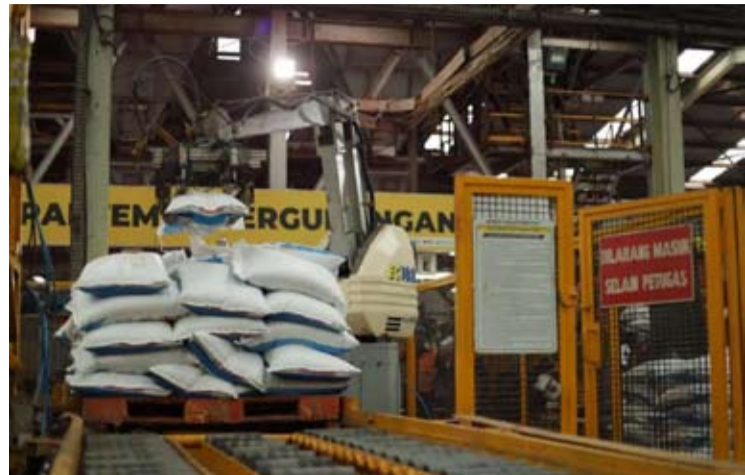
印尼化肥公司 (Pupuk Indonesia) 仓库里化肥装袋情景。

【本报讯】印尼化肥公司 (Pupuk Indonesia) 正通过一个指挥中心加强对补贴化肥分配的监管, 该指挥中心可实时监控从工厂到农户的分配流程。该系统旨在加快分配响应速度, 与此同时防止田间出现潜在的短缺情况。日前, 印尼化肥公司秘书Yehezkiel Adiperwira对记者表示, 该集成系统是维持化肥顺畅分配、保障国家粮食安全的关键。从生产到分配的整个过程, 现在都可在一个集成系统中进行监控。