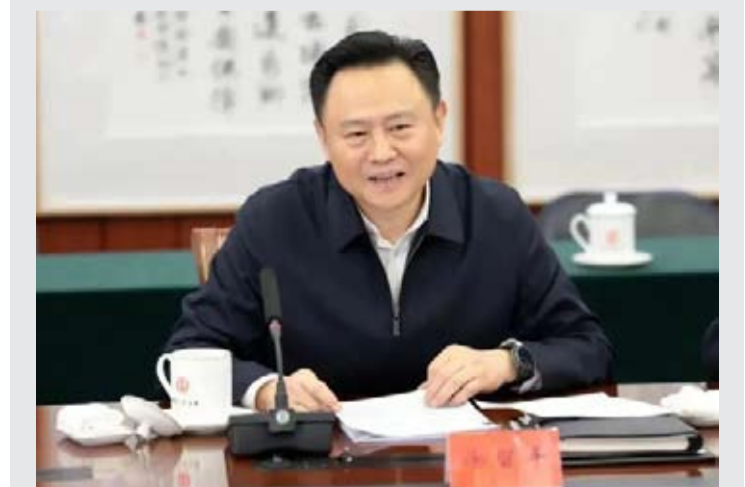
中华全国总工会党组书记、副主席、书记处第一书记徐留平涉嫌严重违纪违法, 目前正接受中央纪委国家监委纪律审查和监察调查。

【中新社北京5月23日电】中国官方23日通报, 中华全国总工会党组书记、副主席、书记处第一书记徐留平涉嫌严重违纪违法, 目前正接受中央纪委国家监委纪律审查和监察调查。公开资料显示, 徐留平, 1964年10月生, 江苏扬中人, 曾任中国兵器装备集团公司董事、总经理、党组副书记兼长安汽车董事长, 中国第一汽车集团公司董事长、党委书记等职, 2023年任中华全国总工会党组书记、副主席、书记处第一书记。