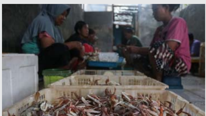
资料照片——2026年1月14日,工人在万丹省西冷市卡瑟曼地区Kebon Demang村进行梭子蟹拆壳取肉作业。

【本报讯】印尼海洋与渔业部(KKP)表示,印尼梭子蟹产品已正式达到美国市场监管标准。在获得有效期至2029年12月31日的“同等性认定”(comparability finding)后,印尼梭子蟹对美出口市场准入资格得以继续维持。