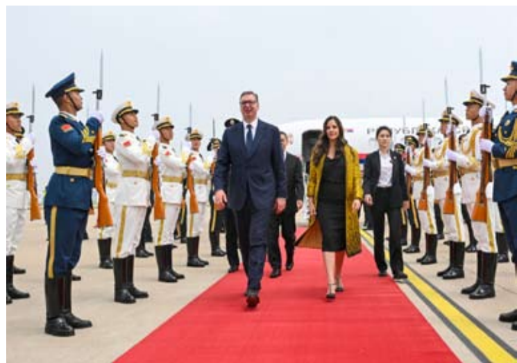
应国家主席习近平邀请, 塞尔维亚总统武契奇5月24日抵达北京, 开始对中国进行为期五天的国事访问。

【中新社北京5月24日电】应国家主席习近平邀请, 塞尔维亚总统武契奇24日抵达北京, 开始对中国进行为期五天的国事访问。武契奇是第一个同中国共同构建新时代命运共同体的欧洲国家, 是中国在东南欧地区的重要伙伴。此访是武契奇首次对中国进行国事访问。