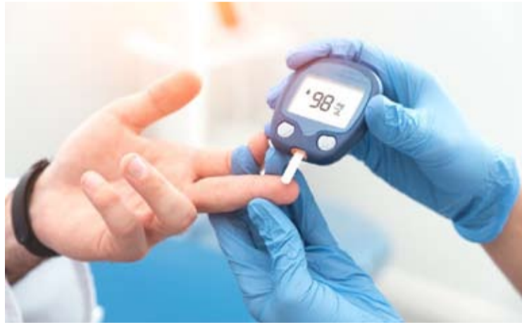
廖内群岛儿童糖尿病病例增加

【本报讯】廖内群岛省家庭赋权和福利运动小组(TP PKK)提醒公众, 对儿童糖尿病病例不断增加, 这已成为年轻一代健康的严重威胁。