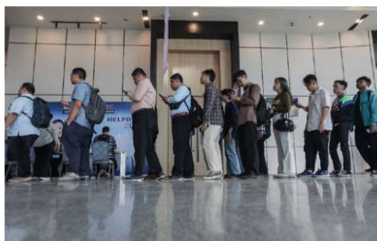
求职者在雅加达的大型招聘会上寻找职位空缺信息。

【本报讯】印尼经济改革中心 (CORE Indonesia) 预测, 随着印尼盾贬值和全球供应中断导致原材料进口成本持续承压, 2026年第二季度的裁员人数预计将增加至15,300至20,300人。