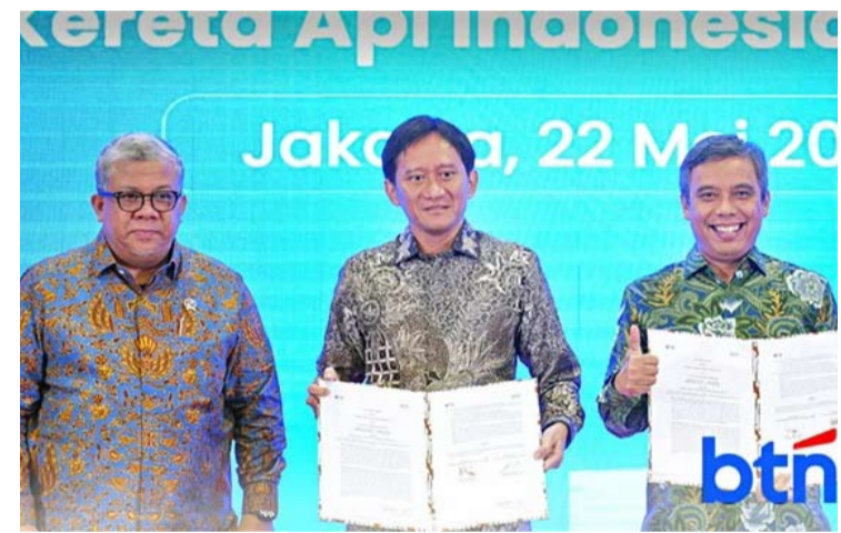
印尼国家储蓄银行与印尼铁路公司合作,为芒加莱、基拉孔东、古本和三宝壟地区提供按揭贷款和一体化垂直住宅,以支持“300万套住房计划”。

FLPP)下的房屋抵押贷款,固定年利率为6%,贷款期限最长30年。通过该方案,民众只需首付最低1%,对于一套售价5亿盾的单元,月供预估约290万盾,即可在市中心拥有垂直住宅。该贷款计划面向月收入最高1200万盾的单身人士和月收入最高1400万盾的已婚人士。