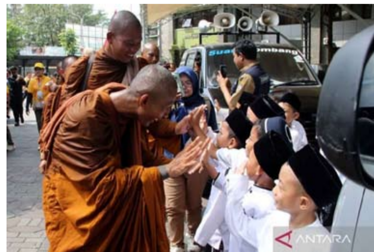
图为僧人在2026年印尼和平行脚活动中进行头陀仪式, 于5月19日路过东爪哇省宗班县特布伊伊斯兰寄宿学校向孩子们致意。

举办卫塞节不仅仅是常规的宗教活动, 也成为到场信众晋升修养的平台。他还提醒说, 根据现行