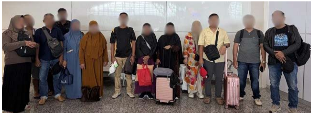
伍拉·赖移民局拘留了13名试图在没有合法证件的情况下前往麦加朝觐的印尼公民。

【雅加达讯】巴厘省伍拉·赖移民局于5月22日(周五)在伍拉·赖国际机场国际出发航站楼延迟了13名印尼公民的离境, 他们涉嫌计划非法前往麦加朝觐。