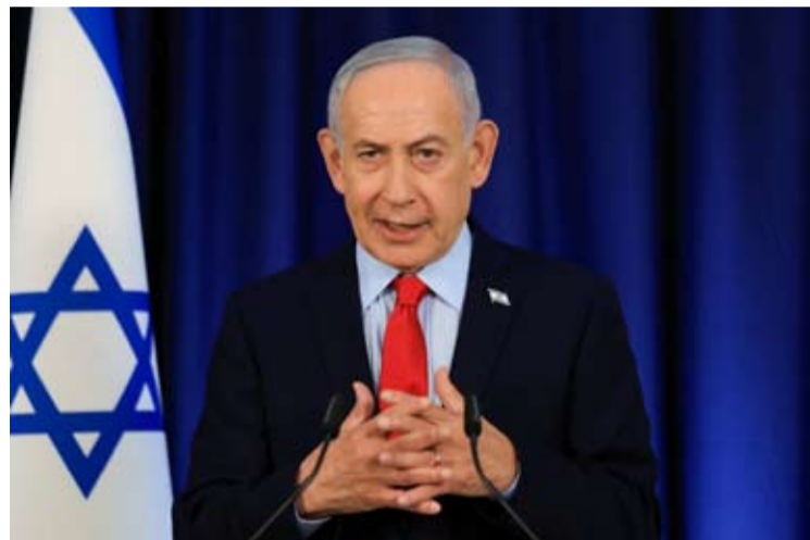
当地时间23日, 据以色列方面消息, 以总理内塔尼亚胡当晚召集执政联盟各党派领导人以及安全部门负责人开会, 讨论美国与伊朗正在协商中的协议。以方担心, 协议条款“对以色列非常不利”。

【中新网5月24日电】当地时间23日, 据以色列方面消息, 以总理内塔尼亚胡当晚召集执政联盟各党派领导人以及安全部门负责人开会, 讨论美国与伊朗正在协商中的协议。以方担心, 协议条款“对以色列非常不利”。据了解, 美伊双方正就一份谅解备忘录进行谈判, 如果这一临时协议达成, 将启动为期60天的终战谈判。以色列第12频道电视台以一名不愿公开姓名的美国官员为消息源报道, 美国总统特朗普的特使威特科夫正竭力劝说特朗普接受协议。以方认为威特科夫“几乎不惜一切代价也要达成协议, 并向特朗普施加巨大压力, 阻止战争重启”。报道称, 如果国际媒体披露的协议条款属实, 那么对以色列而言则“糟糕透顶”, “很难想象特朗