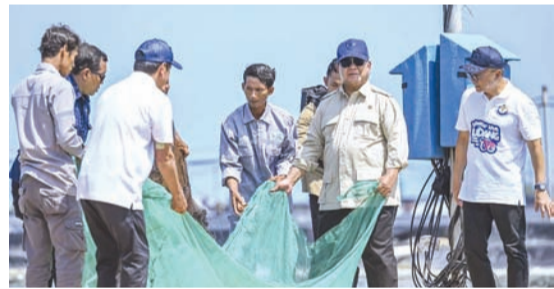
普拉博沃·苏比安托总统（右二）在食品统筹部长祖尔基弗利·哈桑（右）的陪同下，于5月23日在中爪哇省格布门的区域养殖塘收获现场捕捞虾产。

生产性”的定义有着明确的界限。具有生产性的项目必须能够为人民创造就业机会、提高附加值、增加印尼国家的财富，并广泛提高民众的收入。