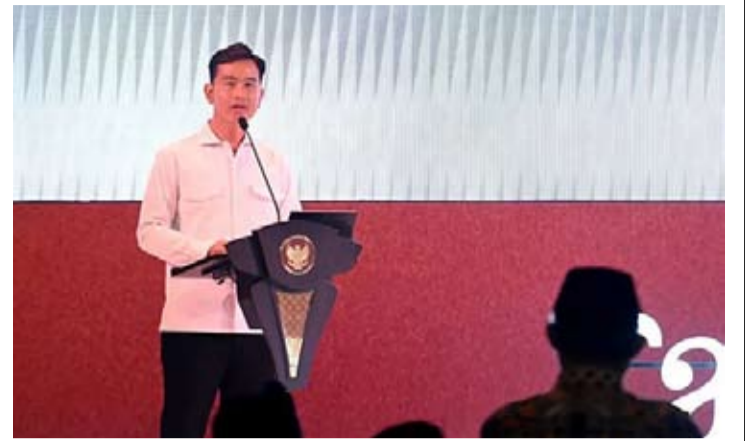
吉布兰·拉卡布明副总统于5月21日出席在巴厘省举行的穆罕默迪亚青年大会预备会议。

目前, 印尼中小小学教育部的工作重点聚焦于在落后、偏远和最边境地区(3T地区)推动数字化