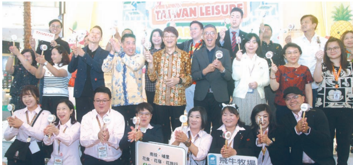
与会嘉宾在展会开幕时合影留念。