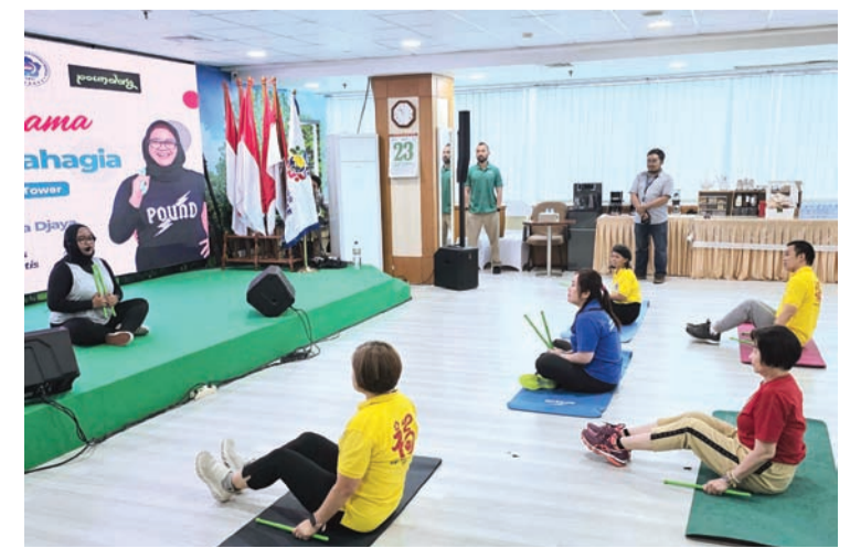
Poundfit健身热身运动一景。