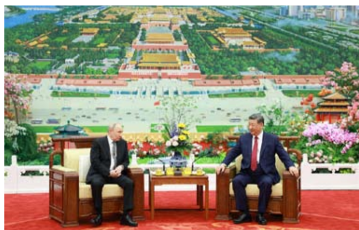
5月20日晚, 国家主席习近平在北京人民大会堂同俄罗斯总统普京举行茶叙。

【中新网5月24日电】孟夏时节, 密集开展的元首外交让世界感受着中国热度。5月20日, 习近平主席与俄罗斯总统普京在北京展开一系列互动。从隆重的欢迎仪式到大小范围会谈, 从签署重磅联合声明到共见记者, 从出席“中俄教育年”开幕式到临别茶叙, 习主席与普京总统深入沟通, 续写中俄友好合作新篇章。《时政新闻眼》带你关注。