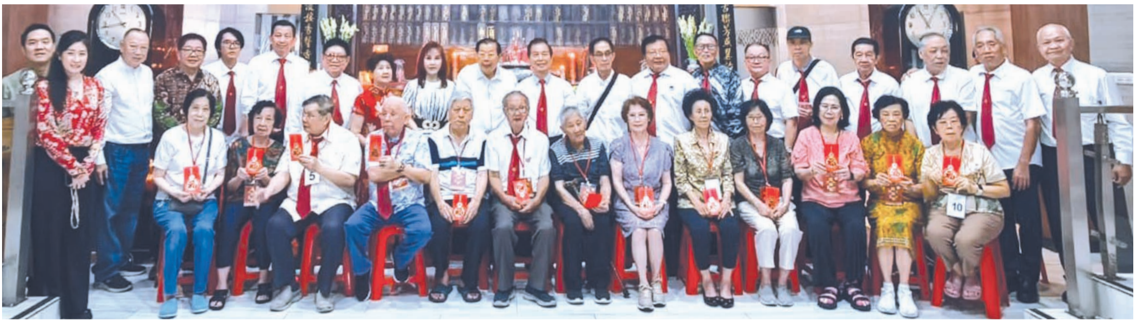
与会80岁以上长者领取敬老红包后与印尼叶氏宗亲总会暨雅加达叶氏宗亲会诸理事合影留念。