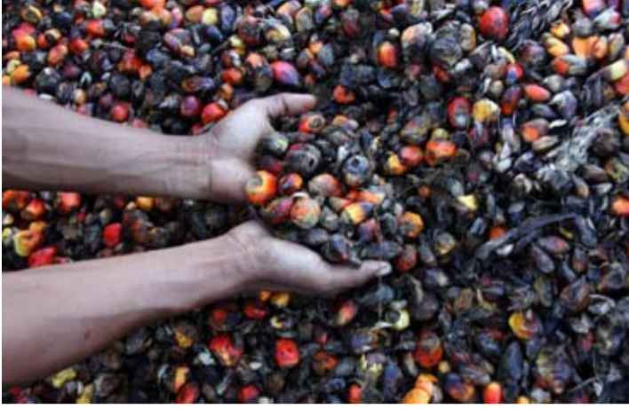
2026年5月13日,在印尼廖内省杜迈市普尔纳马村鲜果串交易点(RAM),工人检查从农户处收购的油棕散果质量。