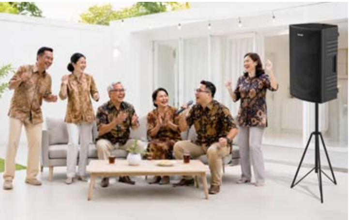
图为一个家庭正在使用SAS Pro系列产品, 这是一款由夏普推出的专业便携式扬声器, 为满足日益增长的音频设备需求。

【本报讯】电子产品制造商PT Sharp Electronics Indonesia推出专业便携音箱SASPro系列, 以满足日