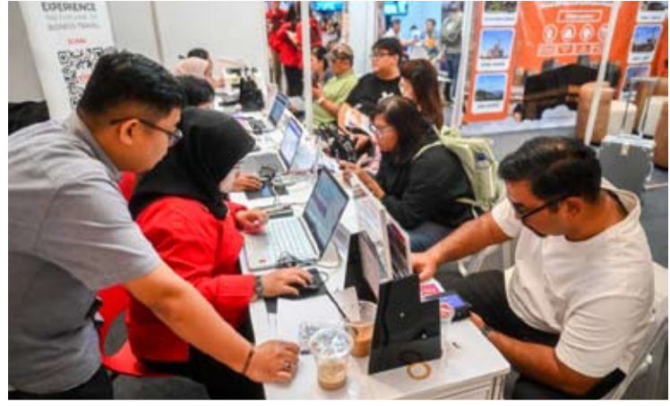
周五(5月29日), 许多游客在雅加达国际会议中心举办的2026年印尼旅游展览会上购买机票。

【本报讯】年度旅游展览会——第21届印尼旅游展览会(The 21st Indonesia Travel Fair, 简称ITF 2026)正准备以“世界大促回归”(The World on Sale is Back)的精神重返民众视野。该展览会成为印尼旅游业、航空业、酒店业以及健康旅游领域复苏的主要催化剂。