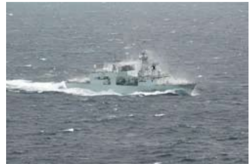
加拿大护卫舰“夏洛特敦”号(Charlottetown)。

船舶定位跟踪网站资料报道，截至星期四下午，夏洛特敦号正航经朝鲜海峡西侧航道，驶向日本海。