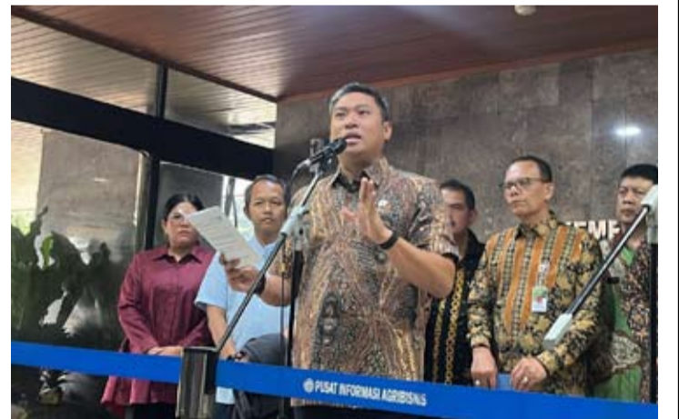
2026年5月29日, 印尼农业部副部长苏达里约诺 (Sudaryono) 在雅加达农业部办公室与农民协会、棕榈油加工企业及出口商举行新闻发布会。

据了解, 自2026年6月1日起实施的第一阶段政策, 将适用于3类大宗商品, 即毛棕榈油 (CPO)