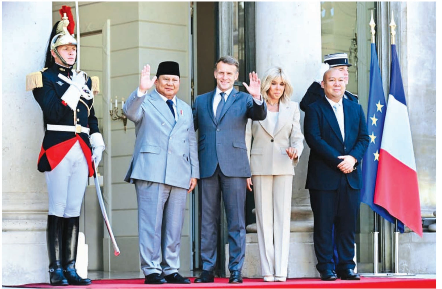
5月28日，普拉博沃·苏比安托总统(左二)与法兰西共和国总统埃马纽埃尔·马克龙在法国巴黎爱丽舍宫合影。

沃总统的国事访问得到了法国政府的正式接待，包括在巴黎荣军院举行的仪式，以及由法国总理塞巴斯蒂安·勒科尔努