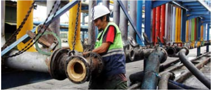
资料照片: 2026年5月13日, 一名工作人员在廖内省杜迈 Pelindo Multi Terminal公司 (SPMT) 杜迈分公司液体散货B码头安装输油管道接口, 用于将毛棕榈油 (CPO) 输送至油轮。

【本报讯】2026年初, 印尼棕榈油产业面临多重压力。印尼棕榈油协会 (GAPKI) 数据显示, 2026年3月, 印尼棕榈油产量、国内消费以及出口规模均较上月出现下降。