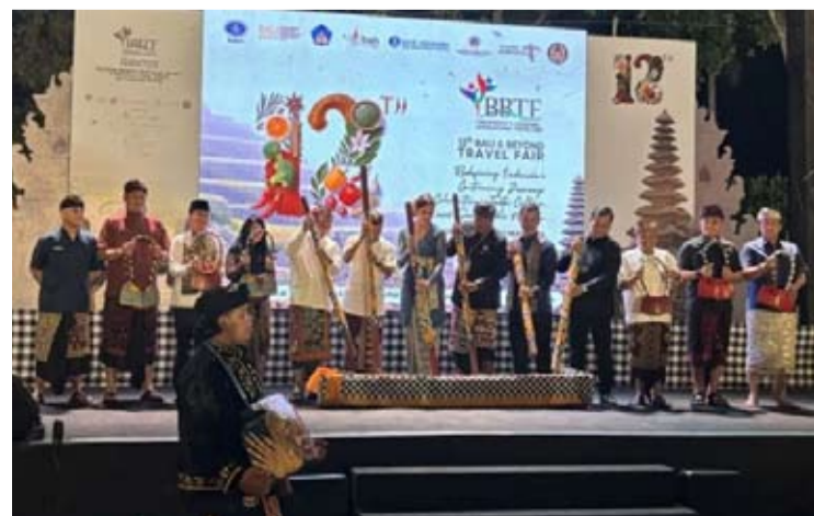
旅游部长维迪燕蒂·普特里·瓦尔达纳于5月28日在巴厘岛巴东县出席了2026年BBTF旅游展开幕式。

“通过BBTF, 我们希望确保巴厘岛和印尼不仅被视为一个美丽的旅游目的地, 更成为国际市场上值得信赖、具有竞争力且富有价值的旅游合作伙伴。” 他总结道。 (fd)