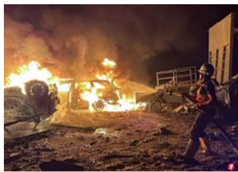
加沙南部汗尤尼斯一座仓库星期四(5月28日)在以军空袭后起火燃烧，消防人员忙着灭火。

【中新社北京5月29日电】综合消息：以色列近期对加沙地带和黎巴嫩的“双线”军事行动呈升级态势。黎以军方代表团定于29日在美国五角大楼举行会谈。以总理内塔尼亚胡28日称，已下令要求以军控制加沙地带70%区域。