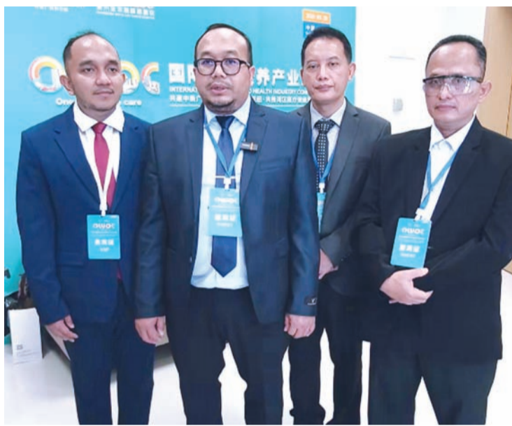
印尼穆罕马迪亚大学医院代表团接受采访。