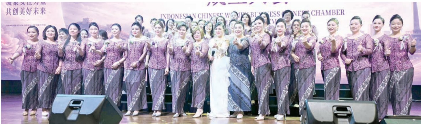
印尼华人女企业家商会首届全体理监事合影留念。

大会期间，主办方还安排交流联谊环节，与会嘉宾积极互动交流，现场洋溢着团结友好、积极向上的氛围。印尼华人女企业家商会的正式成立，也象征着在印尼发展的华人女性企业家迈向新的发展阶段。