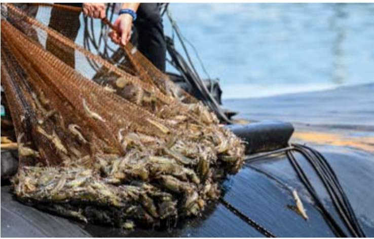
虾农在中爪哇省Kebumen区域养殖虾塘捞虾。

【本报讯】印尼总统普拉博沃·苏比安托于5月23日亲临位于中爪哇省Kebumen区域养殖虾塘(BUBK),参与对虾采收活