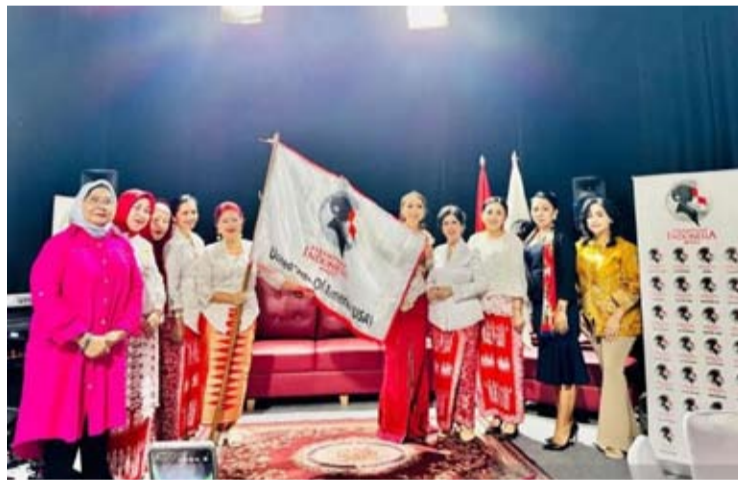
印尼前进女性组织总主席拉娜·T·昆托罗 (右四) 在雅加达为美国海外代表委员会成员主持就职仪式。

【本报讯】印尼前进女性 (PIM) 中央领导委员会持续加强国际网络与合作, 正式任命了PIM美国分会的管理委员, 以此作为扩大印尼女性在全球舞台上的作用而做出的努力之一。