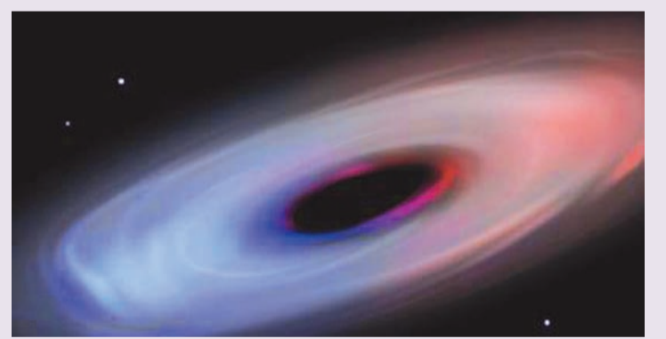
一幅关于Abell2744-QS01黑洞周围气体环境的艺术概念图(图片来自Jiarong Gu)。施普林格·自然 供图

论文作者总结称，这些发现是对如此早期的宇宙中黑洞质量的首批直接测量之一。他们表示，未来研究还需进一步完善模型和分析。