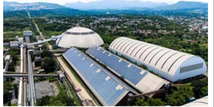
印多水泥公司(Indocement/INTP)建设印尼水泥行业最大太阳能发电厂。

(Heidelberg Materials Group)的成员,印多水泥公司在印尼的运营也遵循全球可持续发展标准。