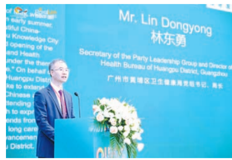
广州市黄埔区卫生健康局党组书记、局长林东勇致辞。