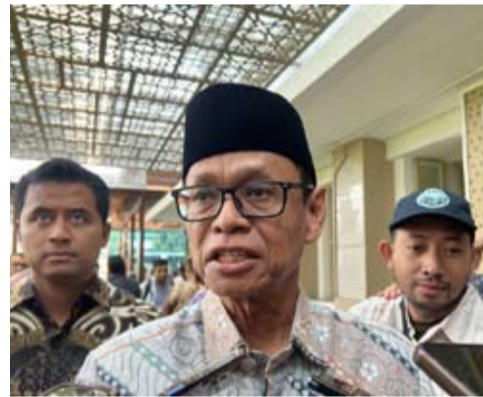
2026年5月29日, 印尼能源与矿产资源部副部长尤利奥特·丹绒 (Yuliot Tanjung) 在雅加达能源与矿产资源部办公室接受媒体采访时发表讲话。

柴油在内的多类燃油库存仍处于安全水平。与此同时, CN51柴油、Pertamax以及Pertamax Turbo等非补贴燃油供应亦能够满足国内市场需求。