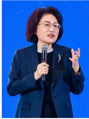
华为何庭波发表题为“半导体新路径探索与实践”的主旨演讲。

5月25日, 华为公司在上海电路与系统研讨会 (ISCAS) 上发布“ \tau 定律”, 提出以“时间缩微”替代“几何缩微”的新路径, 通过逻辑折叠构建器件—电路—芯片—系统四层协同优化体系, 目标到2031年实现等效1.4纳米水平。这是中国首次在全球半导体领域提出产业级底层演进定律, 被视为继摩尔定律之后芯片行业的又一次理论变革。 那么, 应该如何理解这一看似深奥的“ \tau 定律”及其意义呢?