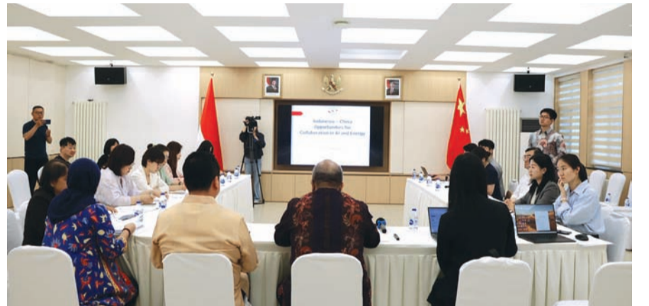
人工智能驱动的清洁能源解决方案会晤在北京举行。