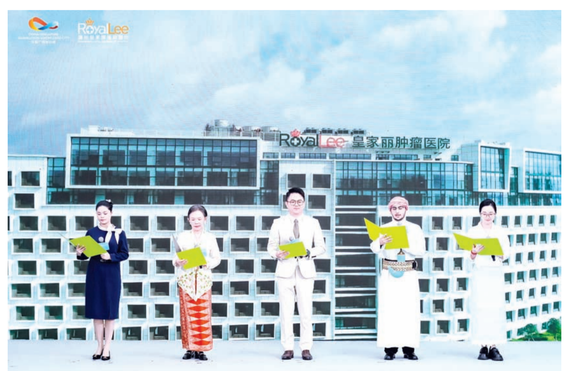
国际医疗中心员工多语种诗朗诵表演。