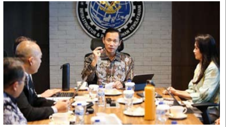
基础设施和区域发展统筹部长阿古斯与北马鲁古省省长谢莉·乔安达 (Sherly Tjoanda) 及其工作人员举行会议讨论加快北马鲁古省的基础设施建设和促进经济平等问题。

目前, 北马鲁古是世界镍产业中心之一, 发挥着重要的战略作用。全国166家冶炼厂中约有100家位于该地区, 贡献了全国高达50%的镍产量。由此产生的经济活动每年接