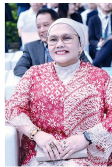
印度尼西亚驻广州总领事馆代总领事Ms. Andalusia T.T Dewi出席活动。