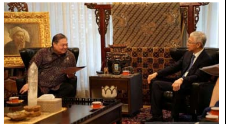
2026年5月26日, 印尼经济统筹部长艾尔朗加·哈尔塔托 (Airlangga Hartarto, 左) 在雅加达经济统筹部办公室会见中国河北省政府代表团、河北省副省长赵辰昕 (右)。

艾尔朗加特别提到印尼东部地区的发展潜力, 尤其是北苏拉威西省在国际数据互联领域具备重要战略价值。该地区凭借地理区位优势, 可直接连接通往美国的全球数据传输网络, 因此被视为建设数