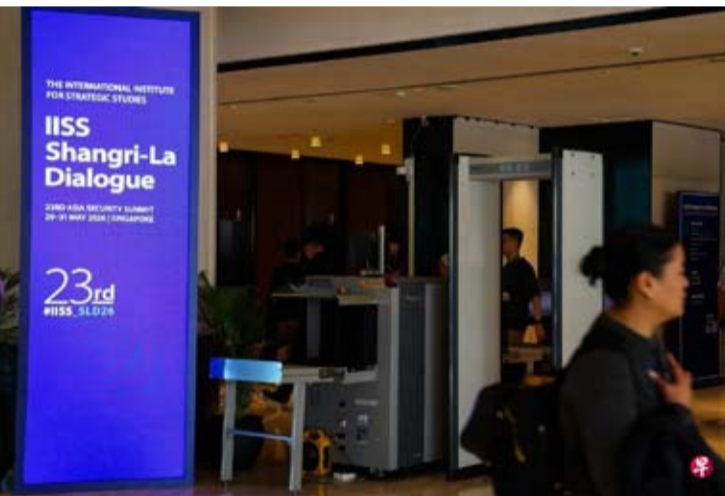
由英国智库国际战略研究所(IISS)主办的第23届香格里拉对话会，星期五(5月29日)至星期天在新加坡香格里拉大酒店举行。图为星期四下午(28日)在香格里拉大酒店外进行的安保准备工作。

【中新网5月29日电】第23届香格里拉对话会29日起至31日在新加坡举行，开幕式将于29日晚举行。来自全球40多个国家和地区的国防部长、高级军事官员、安全专家和学者，将围绕亚太安全局势等议题展开讨论。在中东局势持续紧张、全球供应链与能源安全风险上升背景下，本届对话会受到国际社会高度关注。