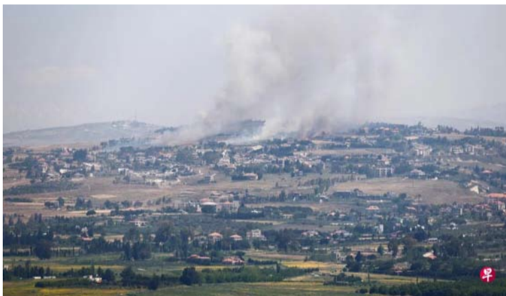
以色列总理内塔尼亚胡周一说，鉴于黎巴嫩真主党屡次违反停火协议，已下令以军对贝鲁特南郊达希耶发动空袭。图为从以色列边境一侧可见黎巴嫩上空升起白色烟雾。

的原因是黎巴嫩真主党一再违反停火协议。黎巴嫩真主党方面暂未予以回应。报道还援引黎巴嫩政府的消息称，以色列近期对黎巴嫩的袭击，已造成超过3370人死亡。