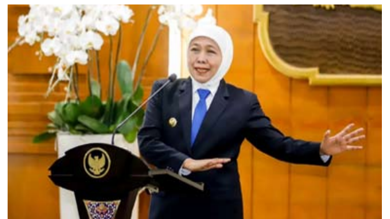
东爪哇省省长科菲法·因达尔·帕拉万萨发表讲话。