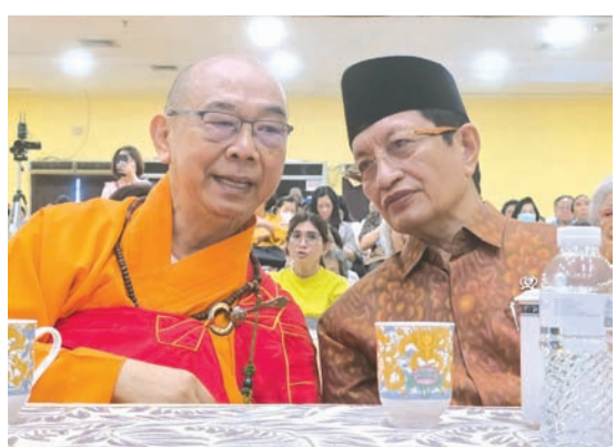
慧雄大和尚与纳萨鲁丁部长亲切交谈。