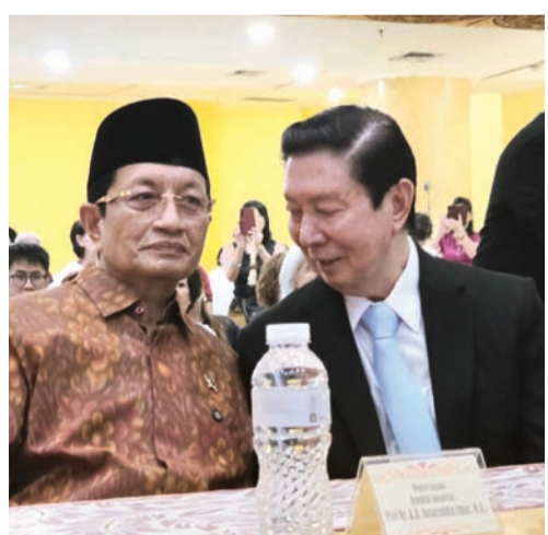
俞雨龄与纳萨鲁丁部长亲切交谈。