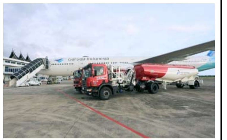
Pertamina Patra Niaga油罐车为鹰航飞机加注航空燃油。

【本报讯】自2026年6月1日起, Pertamina Patra Niaga公司将航空燃油价格下调至多10%, 以支持国家的航空运输互联互通。