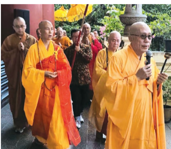
来自海内外高僧大德参与佛舍利绕境祈福仪式。