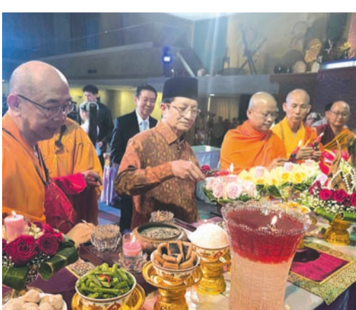
慧雄大和尚与纳萨鲁丁部长等燃灯卫塞祈福平安灯。