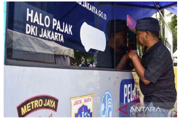
市民在雅加达中区国家纪念碑/莫纳斯(Monas)附近的流动车辆税办公室(Samsat Keliling)服务点缴纳机动车税。

号雅加达首都特区地方税务局局长决定书中,该决定书涉及针对机动车税和机动车转让登记费的行政处罚豁免事宜。(pl)