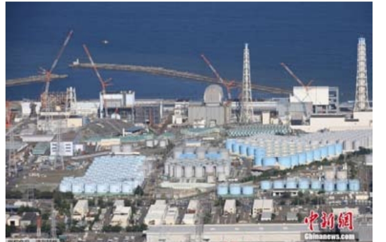
资料图为当地时间2023年8月24日，航拍福岛第一核电站。

2023年8月，日方无视国际社会的强烈质疑和反对，单方面强行启动福岛第一核电站核污染水排海。截至目前共完成19次核污染水排放，累计排放量近15万吨。