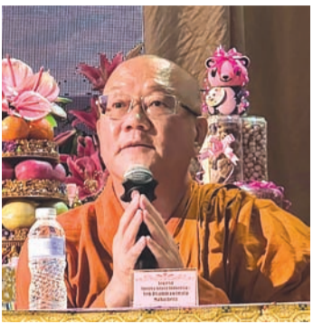
印尼佛乘僧伽联合会会长老会Dharma Wimala Mahathera大和尚作分享。

【本报周孙毅报道】5月30日，由印尼佛教中心协会（Asosiasi Buddhist Center Indonesia）与雅加达大丛山西禅寺（Vihara Mahavira Graha Pusat）联合主办的“全球卫塞节2570佛历庆典”，在雅加达大丛山西禅寺大礼堂隆重举行。来自海内外高僧大德、佛教领袖及广大佛教信众齐聚一堂，共庆佛陀圣诞，并祈愿世界和平、人民安乐。