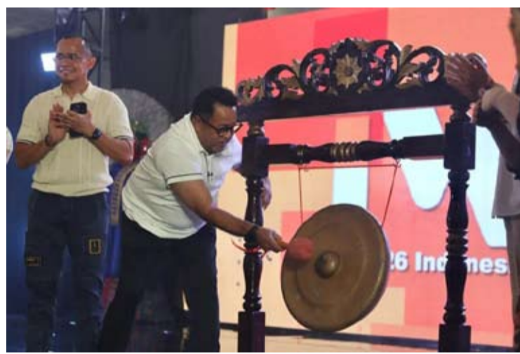
雅加达副省长拉诺·卡尔诺于5月30日在雅加达敲响象征印尼世界舞蹈节(IWDF)正式开幕。