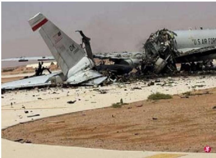
这张取自社媒的照片显示，3月27日，伊朗袭击沙特阿拉伯苏丹王子空军基地，击中一架美军E-3“哨兵”预警机。(路透社档案照片)

科威特方面表示，其防空系统于6月1日清晨开火，拦截来袭的无人机和导弹。伊朗伊斯兰革命卫队在伊朗国家通讯社发布的声明中称，美军袭击了一座通信塔，并表示已作出回应，但没有说明攻击地点。报道称，这可能指的是对科威特的袭击。科威特境内驻有美国陆