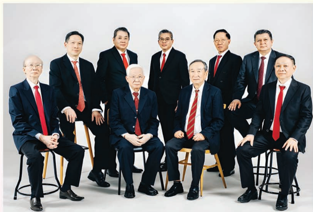
PT Niramas Utama Tbk. 董事部, 經理部合影