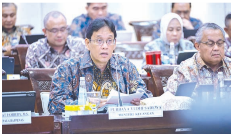
2026年6月10日, 印尼财政部长普尔巴亚 尤迪 萨德瓦 (Purbaya Yudhi Sadewa) 在雅加达出席与印尼国会第十一委员会举行的工作会议。

【本报讯】印尼财政部长普尔巴亚 尤迪 萨德瓦 (Purbaya Yudhi Sadewa) 表示, 此前出现上涨的非补贴燃油产品价格, 包括 Pertamina 和 Pertamina Green 95, 未来有望随着国际油价回落而下调。 普尔巴亚指出, 受中东地区地缘政治局势影响, 特别是国际原油价格大幅上涨所带来的外部压力正在逐步缓解, 印尼经济已