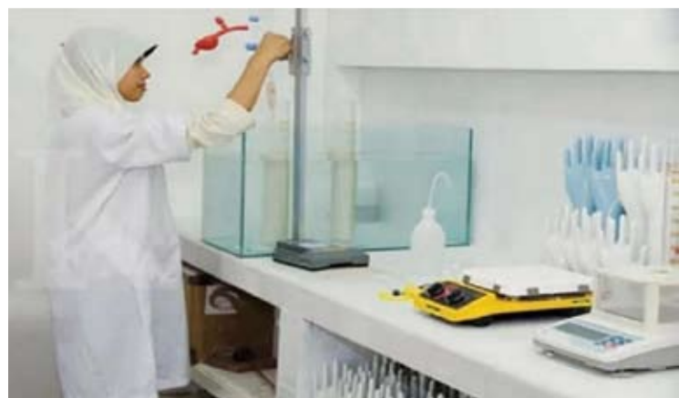
Mark Dynamics Indonesia公司(MARK)生产的产品。