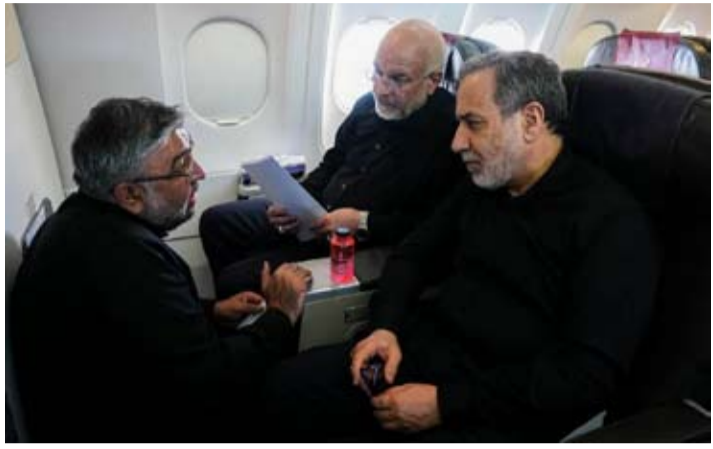
伊朗议长办公室发布的照片显示，6月21日，伊朗议长卡利巴夫（中）和伊朗外长阿拉格齐（右）在飞往苏黎世的飞机上与一名伊朗成员交谈。

【中新网6月22日电】据伊朗方面22日消息，伊朗和美国在瑞士的首轮谈判达成的协议包含5项要点。