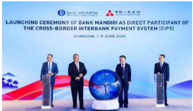
图为: 印尼万自立银行日前在中国上海正式成为跨境银行间支付系统 (CIPS) 直接参与者。

Timothy 表示: “我们相信, 更加紧密的金融互联互通将为企业和国民经济创造更多可持续增长机遇, 同时进一步推动印尼融入全球经济生态体系。” (asp)