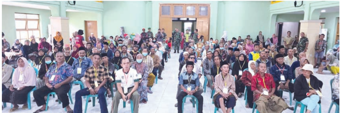
白内障患者在大厅等候。