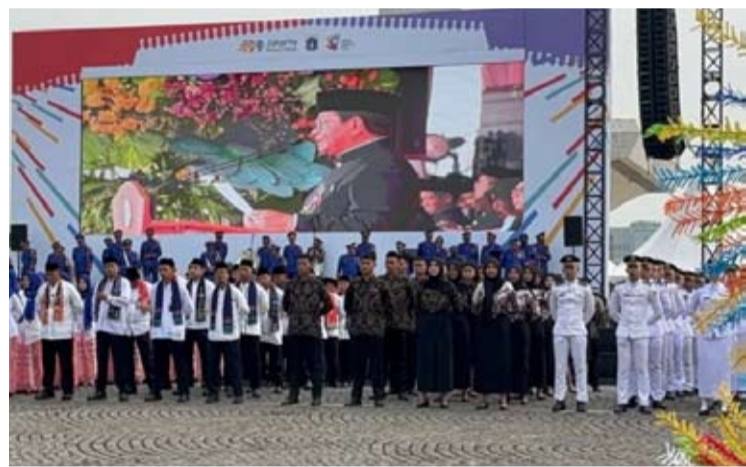
雅加达特区长普拉莫诺·阿农在雅加达中区的民族纪念碑广场,担任雅加达特区成立499周年庆典仪式的检阅官。

他指出当前的局面并不轻松。在地缘政治升级影响全球经济增长动态的情况下,雅加达2025年全年的通胀率仍控制在