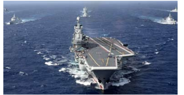
海军辽宁舰编队开展远海实战化训练。

【中新社北京6月22日电】据中国人民解放军北部战区海军社交平台官方账号22日消息，中国海军辽宁舰编队圆满完成远海实战化训练，安全顺利返回青岛母港。40余天的训练中，编队赴南海、西太平洋等海空域，深入开展实战运用验证，有力提升了航母编队履行使命任务能力。