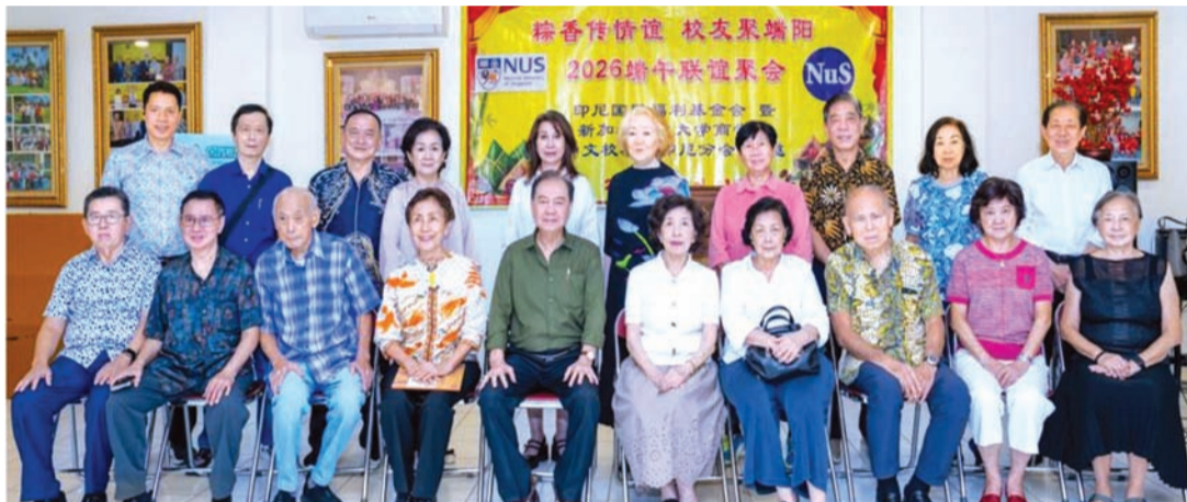
印尼国民福利基金会暨新加坡国立大学商学院中文校友会印尼分会举办2026年端午联谊聚会暨公益拍卖活动。