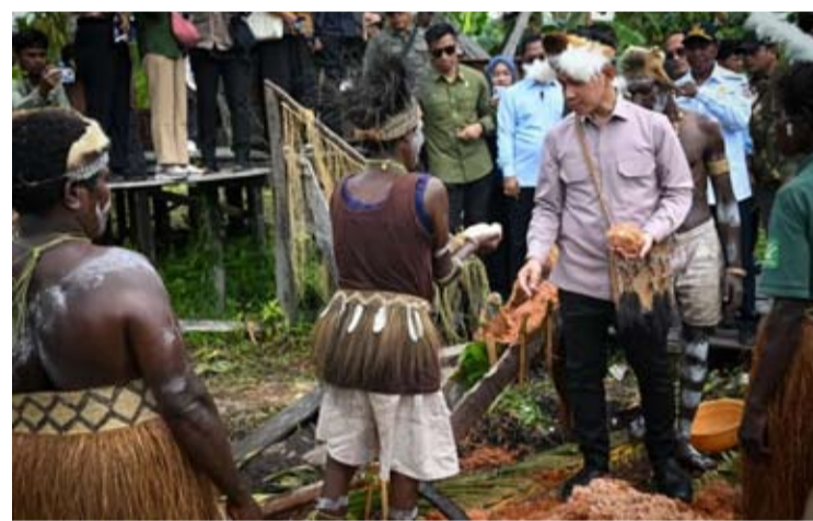
吉布兰·拉卡布明副总统于6月21日视察了南巴布亚省阿斯塔县Yepem村的阿加茨主教区西米田野学校。

地层面。所以,如果是在梅兰蒂(Meranti)那边,是面向大规模生产的西米工业技术。这边则是面向本地规模的,副总统阁下。所以,这里会有更多的文化方法。同时,这里也在发展下游加工。”安东说。