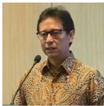
卫生部长布迪·古纳迪·萨迪金在雅加达发表讲话。