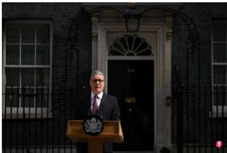
英国首相斯塔默星期一（6月22日）在唐宁街10号发表讲话，公布卸任计划。

【中新网6月22日电】英国首相基尔·斯塔默，终究还是未能打破英国频繁“换相”的魔咒。当地时间22日，斯塔默宣布辞职。一场高开低走的执政之路，正迎来终章。