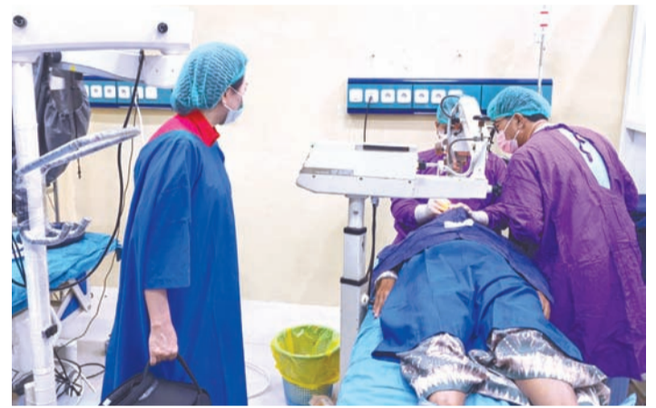
Esty 在观视医生进行白内障手术。