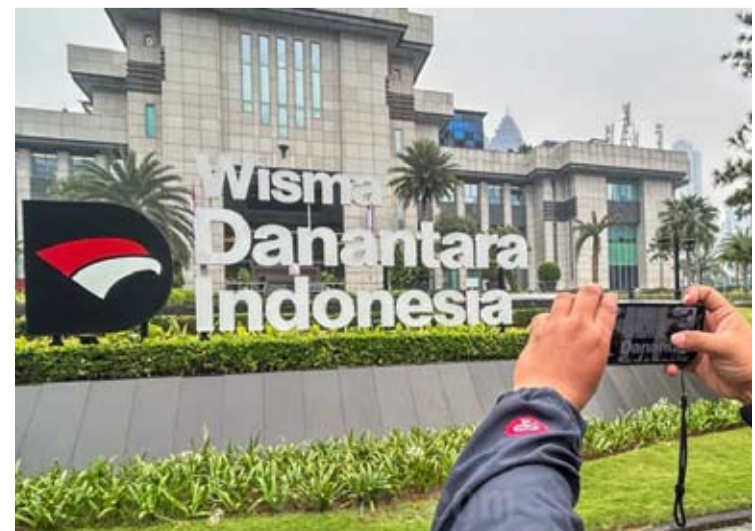
位于雅加达的Danantara Indonesia大厦的标志。

展望未来,SCG及其子公司Jayamix by SCG将继续推出创新产品,俾能满足不断变化的客户需求,与此同时支持建筑业向更可持续的未来转型。(sl)