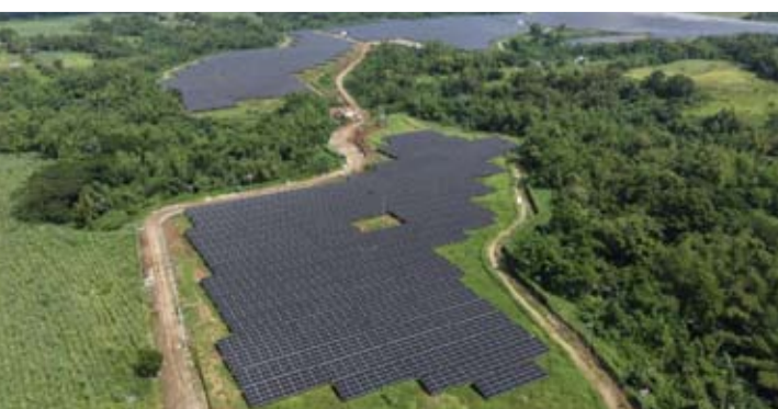
太阳能发电站(PLTS)示意图。

潘杜进一步表示:“例如,可推动Pertamina NRE旗下子公司生产的太阳能光伏组件(Solar PV)出口菲律宾,同时促进新能源技术交流,并推动更多印度尼西亚专业人才参与菲律宾快速发展的可再生能源产业,为双方深化绿色能源合作创造新的增长点。”(er)