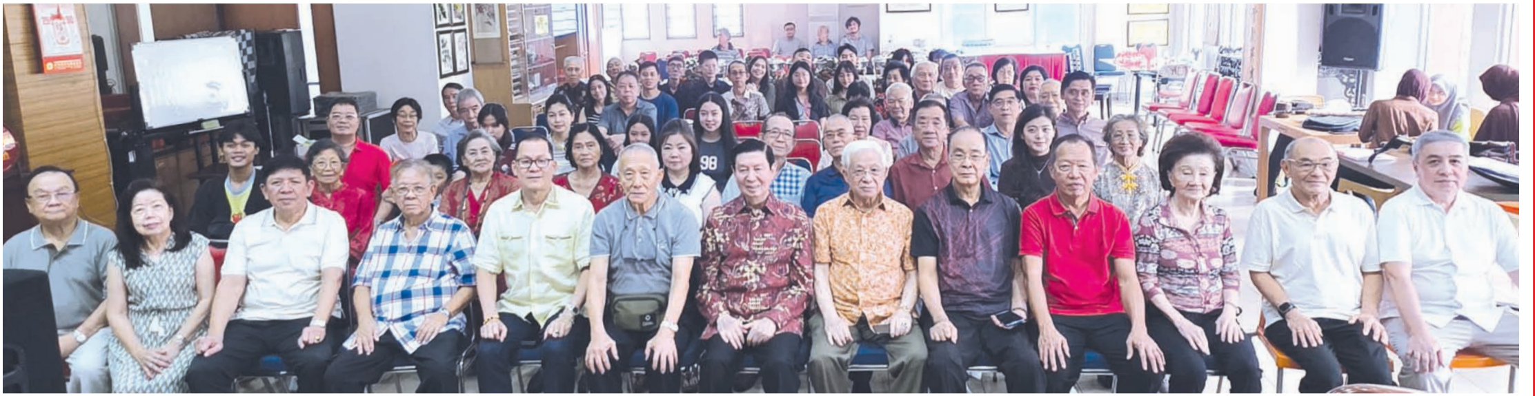
与会2026年度值年炉主和嘉宾们、信徒们及南音弦友们合影留念。

【本报周孙毅报道】6月27日(农历五月十三日),印尼东方音乐基金会在会址为其属下关帝宫隆重举行关圣帝君圣诞庆典。该基金会理事、华社领导及社会各界人士齐聚一堂,虔诚礼敬关圣帝君,共同祈愿国泰民安、风调雨顺、社会祥和、阖家安康,现场香火鼎盛,善心络绎不绝。