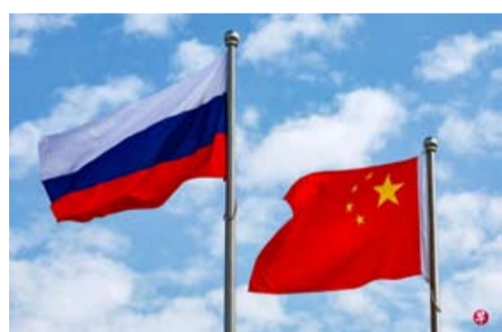
中国与俄罗斯空军星期六（6月27日）在日本海、东海、太平洋西部空域展开联合空中战略巡航。（路透社档案照片）

据日本朝日电视台报道，这是自去年12月以来，日本政府再次确认中俄军机执行联合战略巡航。日本已通过外交渠道向中国及俄罗斯政府表达严正关切。