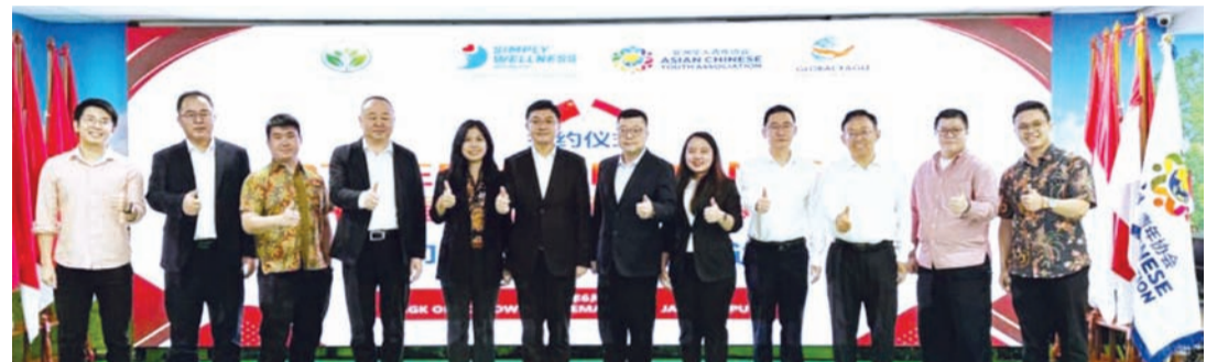
双方代表合影留念。