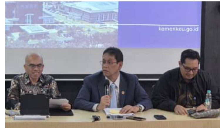
图为：6月26日（周五），财政部长普尔巴亚·尤迪·萨德瓦在雅加达办公室出席媒体吹风会。

步升温。一些大型基金管理公司和银行获悉消息较晚，因此希望我们适当推迟发行，以便他们有时间向各自的投资者委员会提交投资方案。”