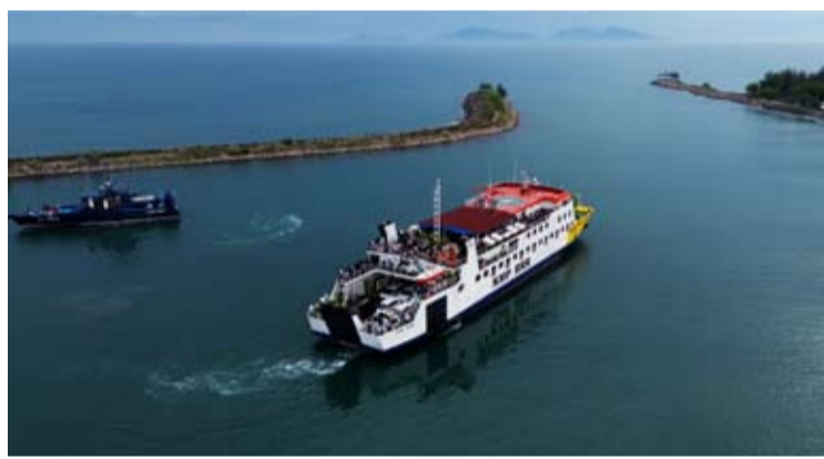
航拍照片显示, BRR号滚装渡轮从亚齐省班达亚齐市乌勒勒(Ulee Lheu)轮渡码头驶往沙塘市(Sabang)。(摄于2026年5月30日)

【本报讯】印尼交通部长杜迪·普尔瓦甘迪(Dudy Purwagandhi)表示,印尼政府正持续优化滚装船(Roll-on/Roll-off,简称RoRo)物流运输领域投资环境,通过破除市场准入障碍、降低企业制度性交易成本和运营成本,进一步吸引社会资本参与现代物流体系建设。