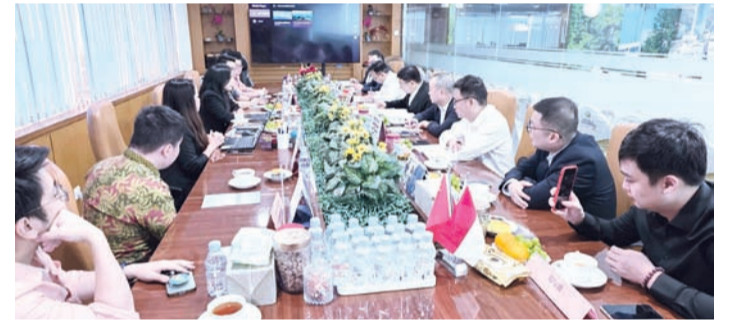
双方代表交流一景。