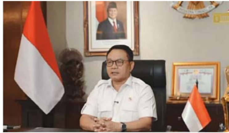
总统办公厅主任杜东·阿卜杜拉赫曼 (Dudung Abdurachman) 周五 (6月26日) 在国际禁毒日纪念活动上发表声明, 重申政府致力于根除毒品贩运。

杜东表示, 这一成就体现了政府致力于根除毒品贩运、保护社会, 特别是年轻一代免受毒品滥用威胁的决心。他在国际禁毒日纪念活动上说, “此次