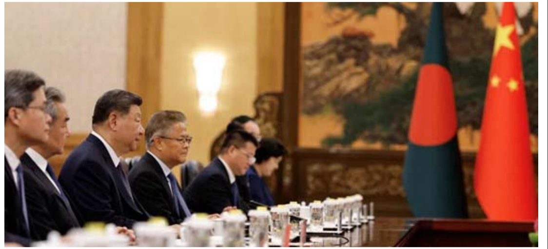
中国国家主席习近平（左三）星期五（6月26日）在北京人民大会堂会见到访的孟加拉国总理塔里克·拉赫曼（不在图内）。

展为周边国家提供新机遇、带来新动力。中方支持孟加拉国新政府顺利施政。愿同孟方高质量共建“一带一路”，深入对接发展战略，交流发展经验，有序规划重点合作，挖掘绿色低碳、数字经济、信息技术、人工智能等领域合作潜力，开展医