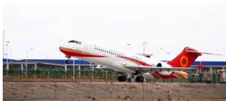
资料图：2024年6月7日，C909客机由中国新疆喀什起飞前往塔吉克斯坦胡占德，正式开通中亚航线。