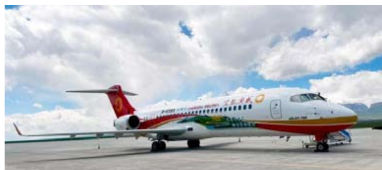
6月23日，C909飞机顺利开通第二条高原航线，成功首航新疆和静巴音布鲁克机场。中新网记者 孙自法 摄

中国商飞表示，站在C909飞机商业运营迈向下一个十年和更长远征程的新起点上，作为飞机制造商，将携手合作各方持续织密航线网络，加速国产客机规模化、系列化、产业化发展步伐，为中国加快建设航空强国、交通强国奠定坚实基础。