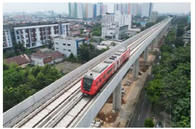
雅加达地产公司 (PT Jakarta Propertindo, 简称Jakpro) 于2026年4月30日启动雅加达轻轨一期B段 (Velodrome-Manggarai) 的测试和调试工作, 该线路全长3.6公里。

不仅如此, 雅加达省政府还计划将 Sumber Waras 医院升级为国际标准医院。在这些发展计划中, 普拉莫诺还概述了其