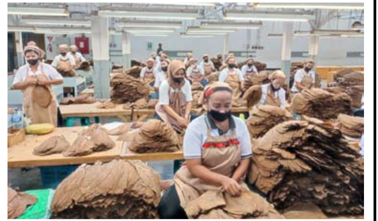
工人在PTPN I工厂进行优质烟草分拣和加工。

承诺通过保持其特有的品质特征来维护烟草质量,这些特征一直是其优势,也是与其他国家产品的区别所在。