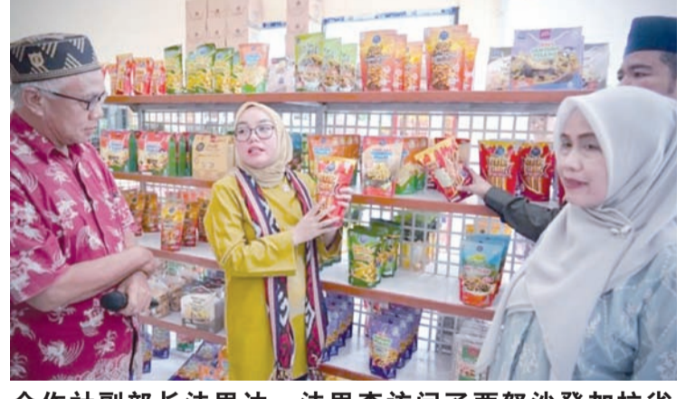
合作社副部长法里达·法里查访问了西努沙登加拉省(NTB)西龙目县的Sasak Maiq中小微企业。

除了作为本地产品的分销渠道外，KDKMP还承担着为农村社区提供基本生活必需品的功能，例如大米、食用油和化肥，并且由于缩短了冗长的分销链条，价格更加实惠。