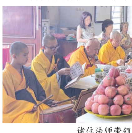
诸位法师带领信徒们诵经祈福。