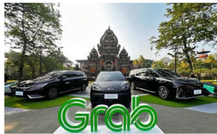
周一(6月29日),Grab的电动车队在雅加达的印尼缩影公园(Taman Mini Indonesia Indah,简称TMII)展出。

“因此,秉持‘明智用油’的精神,Grab推出更节能的服务选择。从Grab Car Electric, Grab Bike Electric, Grab Express Electric到Grab Food也可使