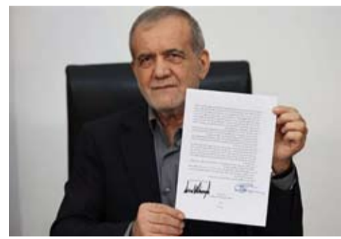
伊朗电视台6月18日发布照片，显示伊朗总统佩泽希齐扬手持美伊谅解备忘录，上面有他和美国总统特朗普的签名。

【中新网6月30日电】当地时间29日，伊朗总统佩泽希齐扬在社交媒体发文称，面对美方毫无根据的威胁，伊朗会毫不退缩地捍卫自身立场。