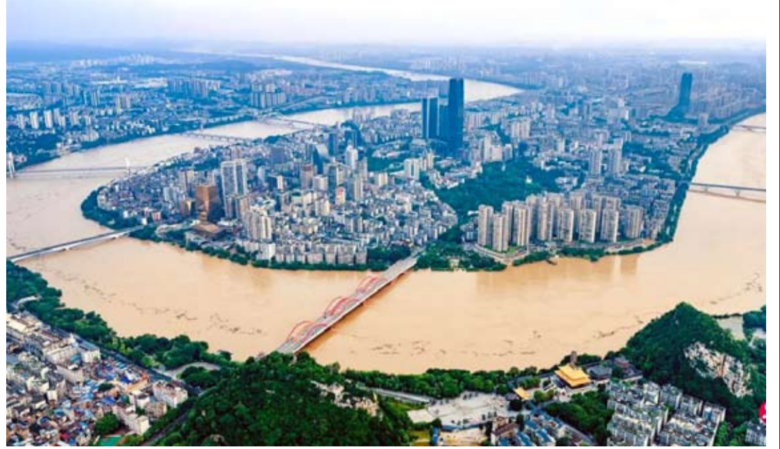
6月30日，中共中央政治局召开会议，研究部署防汛抗旱工作。图为今年6月22日，广西柳江洪峰通过柳州市区河段。

一线下沉，着力提升基层防汛减灾救灾能力。会议要求，各级党委和政府要认真贯彻落实党中央决策部署，严格落实防汛抗旱责任制。国家防总要强化统筹协调和指挥调度，各有关部门要履职尽责。各级领导干部要牢固树立和践行正确政绩观，加强值守、靠前指挥，组织发动群众全力做好防灾减灾救灾各项工作。基层党组织和广大党员要充分发挥战斗堡垒作用和先锋模范作用，在防汛抗旱、抢险救灾一线勇挑重担、冲锋在前，有力维护人民群众生命财产安全和社会大局稳定。