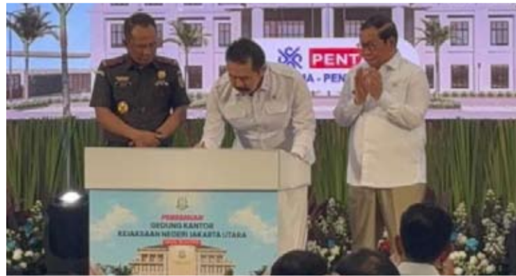
雅加达省长普拉莫诺·阿农于周二(6月30日)见证雅加达北区地方检察院办公楼的落成典礼。

已成功解决的几个问题包括: 拉苏纳·赛义德单轨铁路桩基的整顿(该项目已搁置21年); Sumber Waras医院土地征用的法律确定性(该项目已延误14年), 以及雅加达轻轨