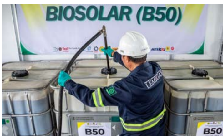
2026年6月7日，在印尼西爪哇省西万隆县冷邦（Lembang）B50道路测试燃料调配与加注站，工作人员将B50生物柴油注入存储桶。