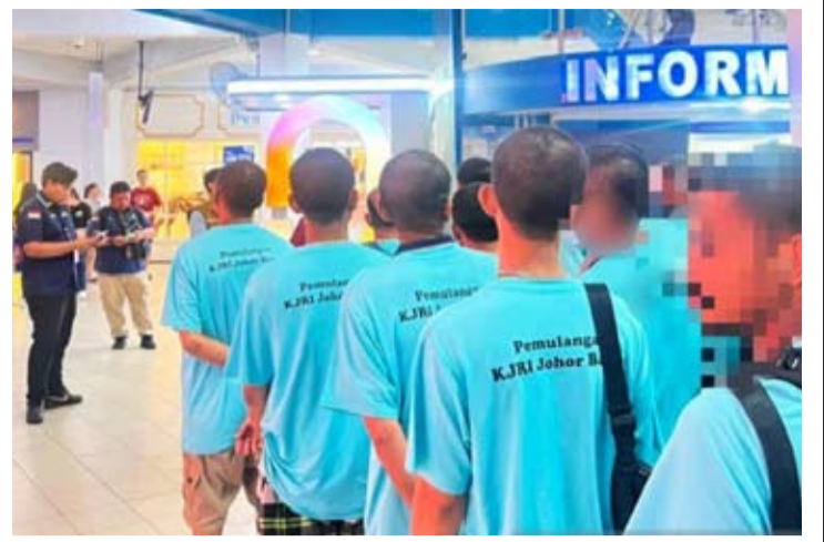
周二(6月30日)在马来西亚柔佛州, 印尼驻新山总领事馆协助多名印尼公民/印尼移民工返回祖国。

他们此前因违反移民法被拘留, 在马来西亚服刑期满后, 被临时安置在柔佛州北干那那斯(Pekan Nenas)地区办事处和吉隆坡武吉·加里