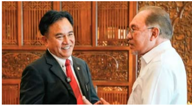
印尼法律、人权、移民和惩教统筹部长尤斯里·伊赫扎·马亨德拉于周一(29/6)在马来西亚布城与马来西亚总理安瓦尔·易卜拉欣举行会晤。

【本报讯】法律、人权、移民和惩教统筹部长尤斯里·伊赫扎·马亨德拉认为, 印尼与马来西亚领导人之间的良好关系是两国在各领域合作日益紧密的重要基础。