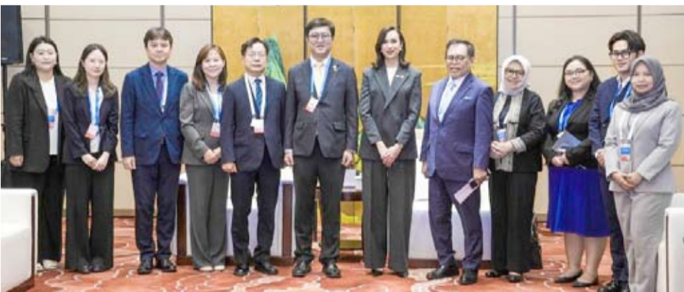
印尼旅游部长Widiyanti Putri Wardhana和其他官员于周六(6月27日)在中国澳门特别行政区举行的第13届APEC,与韩国文化体育旅游部长崔辉永举行会晤后合影。