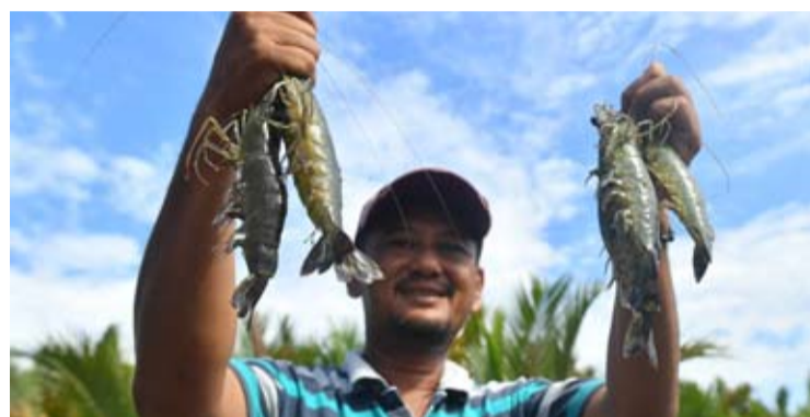
2026年6月3日，养殖户在东加里曼丹省贝旁县沿海地区的虾塘收获时展示虾只。

【本报讯】沙特食品药品监督管理局（SFDA）自2026年5月24日起，正式撤销对印尼多家鱼类加工单位虾产品的出口暂停状态。