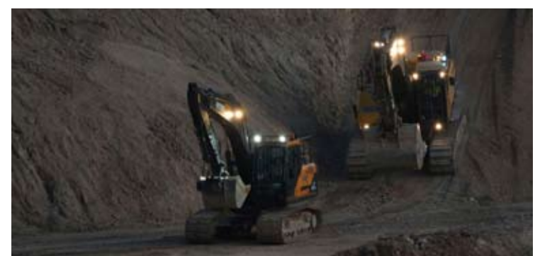
哈利达镍业旗下Trimegah Bangun Persada Tbk公司（NCKL）位于印尼北马鲁古省奥比岛的镍矿矿区。

拉赫马特表示，本届展会得到印尼工业部的大力支持，是政府推动汽车产业国际化发展、提升印尼在全球汽车产业链和供应链中地位的重要举措，也是推动汽车零部件出口持续增长的重要平台。（er）