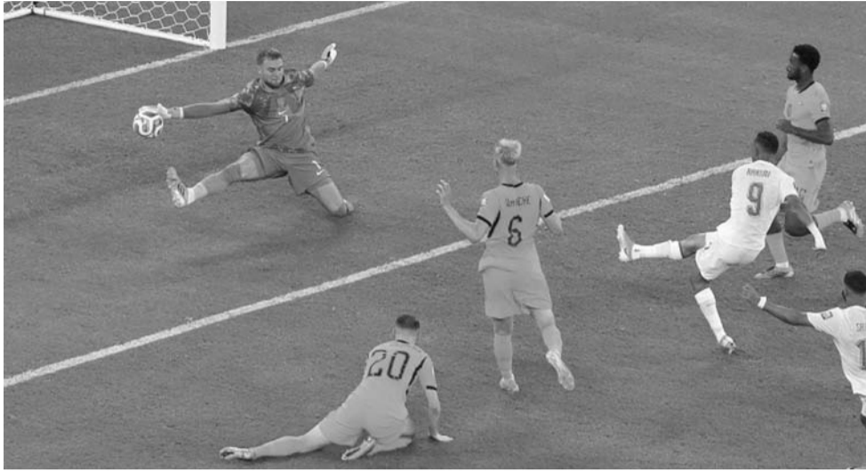
荷兰vs摩洛哥。

第72分钟，荷兰反击机会，萨默维尔推进到禁区前，在马兹拉维的干扰下倒地！在倒地的最后时刻，萨默维尔将球横传，加克波拍马赶到抽射破门！进球后的加克波泪洒赛场！荷兰1-0领先摩洛哥。