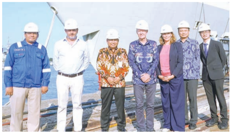
丹麦驻印尼大使H.E. Sten Fridmodt Nielsen访问了东爪哇省泗水的PT PAL Indonesia公司。

【本报讯】PT PAL Indonesia与丹麦通过海洋工业技术的开发与实施合作，加强双边关系。