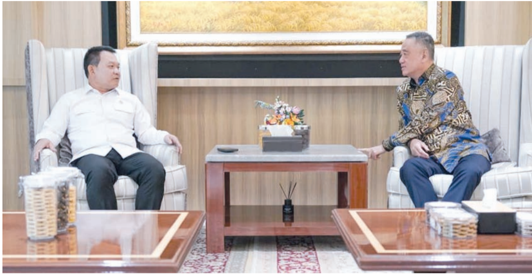
陈荣光与印尼总统办公厅主任Dudung Abdurachman退役陆军上将亲切交流。