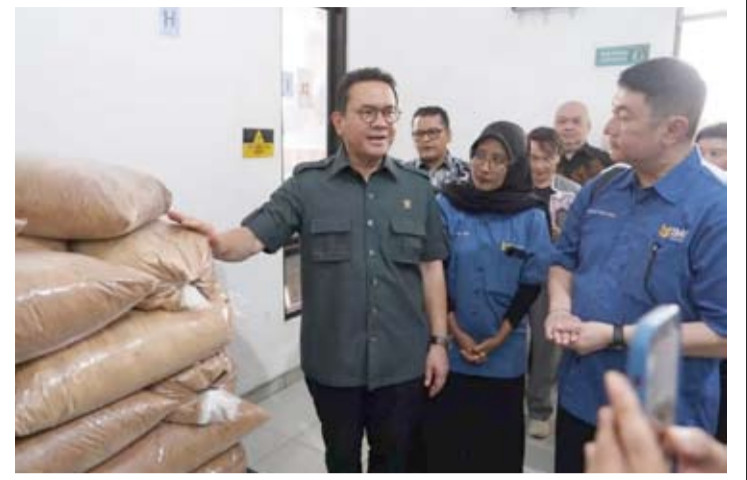
贸易部促进贸易便利化,椰糖出口拓展至全球市场。

为加强出口服务,贸易部也启用了七个新的原产地证书签发机构(IPSKA),其中一个位于满由马史。