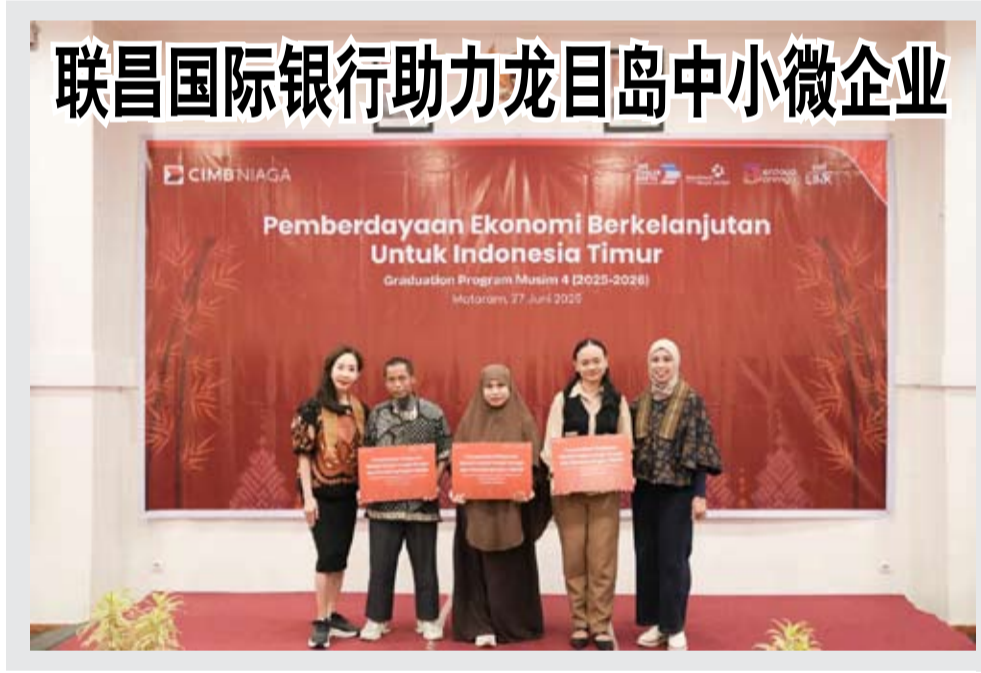
联昌国际银行助力龙目岛中小微企业

除IPO外,通过债务证券及伊斯兰债券(EBUS)募集资金达217.4万亿盾;通过优先认购权发行(HMETD)及认股权证募集资金达43.7万亿盾。(asp)