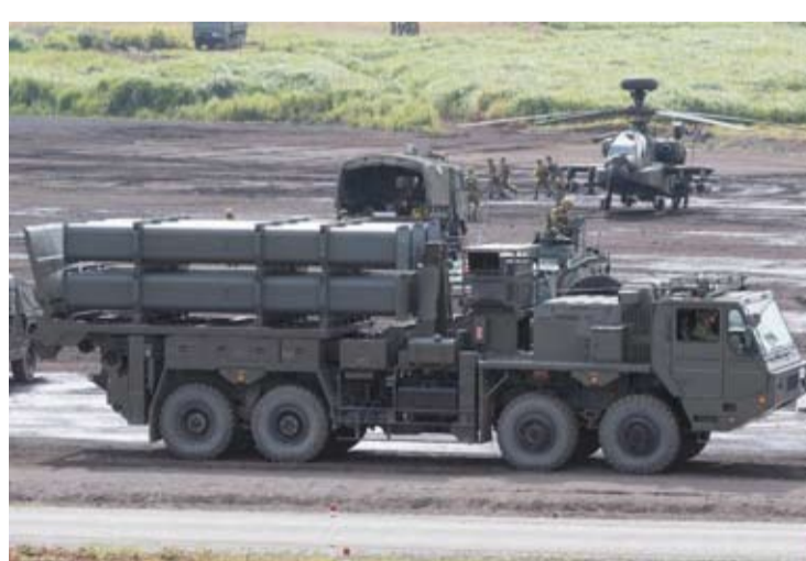
日本陆上自卫队6月28日通过社交媒体公布，已将“12式岸舰导弹”发射装置等装备部署至东京都小笠原诸岛的南鸟岛。这是日本陆上自卫队首次在南鸟岛——这一最东端离岛部署岸舰导弹相关装备。

【中新网6月30日电】日本陆上自卫队6月28日通过社交媒体公布，已将“12式岸舰导弹”发射装置等装备部署至东京都小笠原诸岛的南鸟岛。这是日本陆上自卫队首次在南鸟岛——这一最东端离岛部署岸舰导弹相关装备。