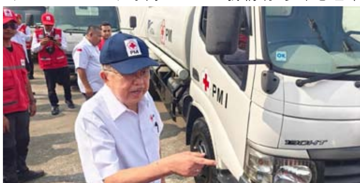
印尼红十字会(PMI)总主席优素福·卡拉在雅加达举行的2026年厄尔尼诺极端干旱影响应对行动集结仪式上, 视察清洁水卡车车队。

“在各地实际上已经开始运行了, 因为这些行动运力从上个月起就已经准备好并处于待命状态, 以应对极端干旱天气的影响。”他如是说。(fd)