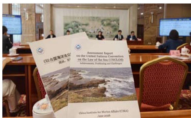
2026年6月30日，中国自然资源部通过新闻发布会发布了《联合国海洋法公约》评估报告：成就、定位与挑战》。(环球时报)

【中新社北京6月30日电】中国自然资源部海洋发展战略研究所编制的《〈联合国海洋法公约〉评估报告：成就、定位与挑战》(《报告》)中英文版6月30日对外发布。