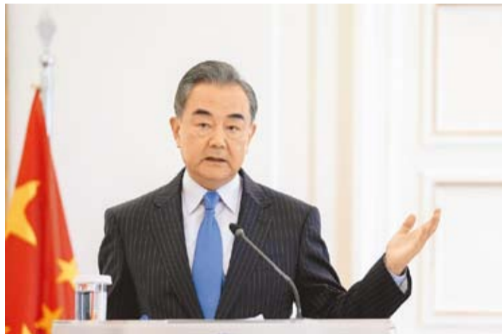
应丹麦外交大臣拉斯穆森、瑞典外交大臣斯蒂纳加德、芬兰外交部长瓦尔托宁、挪威外交大臣艾德邀请，中共中央政治局委员、外交部长王毅将于7月2日至8日访问丹麦、瑞典、芬兰、挪威。(美联社)