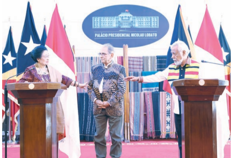
2026年7月9日，印尼共和国第五任总统，印尼斗争民主党中央领导委员会总主席梅加瓦蒂(左)在东帝汶总统拉莫斯-奥尔塔(中)和总理夏纳纳(右)的陪同下，在帝力尼古劳·洛巴托总统府举行新闻发布会。

【本报讯】印尼第五任总统、印尼斗争民主党中央主席梅加瓦蒂·苏加诺普特丽，在东帝汶首都帝力尼古劳·洛巴托总统府举行的国家仪式上，正式接受了东帝汶政府授予的最高荣誉——东帝汶大项圈勋章。仪式于周四(7月9日)举行。