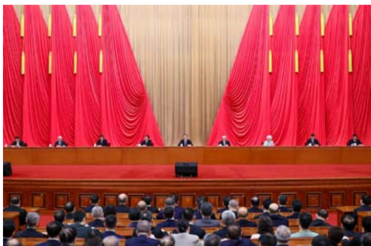
2026年7月9日 7月9日下午,两院院士大会第二次全体会议在北京举行。中共中央政治局常委、国务院副总理丁薛祥出席会议并讲话。

全力抓好党中央关于科技事业各项部署的落实,加快推进高水平科技自立自强。要加强基础研究,持续产出重大原创性、颠覆性科技