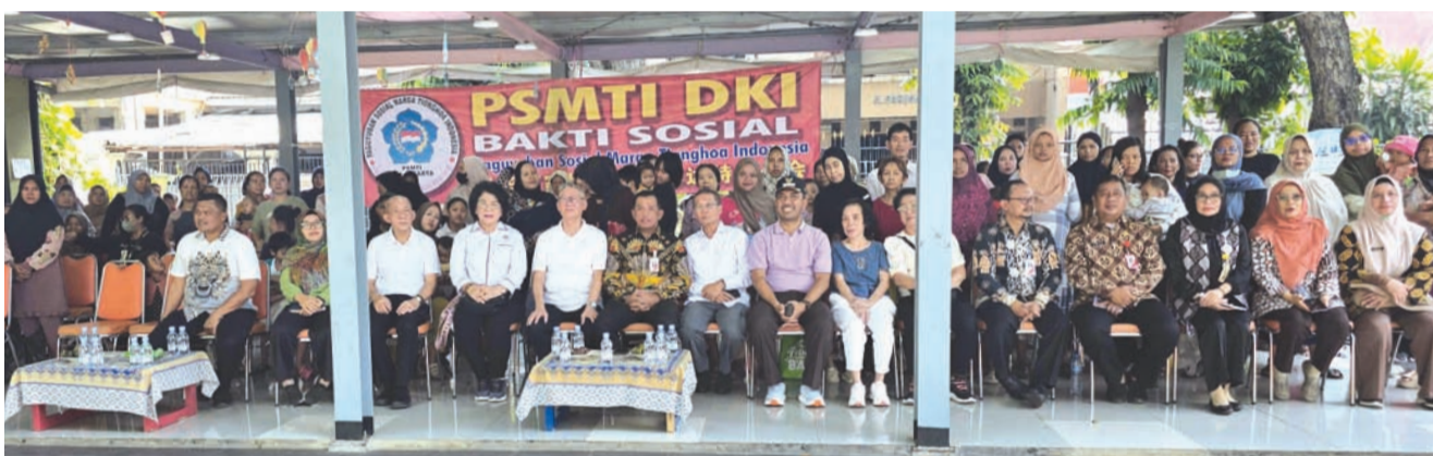
PSMTI雅加达特区分会诸理事与市长代表Nurhidayat等妇女和儿童们合影。