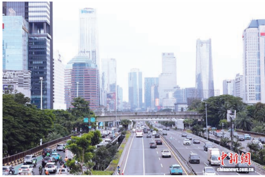
印度尼西亚雅加达市区一景。(资料图)