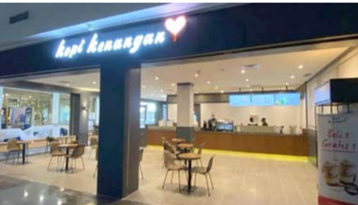
至今年底, Kopi Kenangan 将在巴淡岛和万鸦老开设新店。

【本报讯】今年, Kopi Kenangan将加大扩张力度, 作为其保持业绩增长战略部分。 Kopi Kenangan 法律和企业事务主管 Inneke Lestari 表示, 今年定下的指标, 是至年底增加 300-400 家商店。在2026年1月至6月期间, 该公司已增设178家门店。 Inneke在雅加达举行的Kopi Kenangan 2025年环境、社会和治理(ESG)报告发布会后对记者称, “截至去年底, 我们共有1173家门店。加上2026年1月至6月期间新增的178家, 我们的门店总数将达到1351家。” 据她介绍, 该目标符合