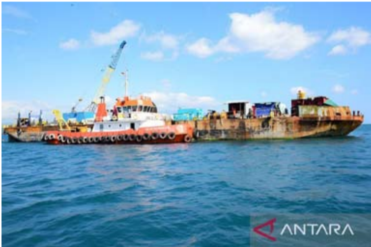
7月9日(星期四), 一艘驳船载着连接北哥伦打洛(Gorontalo Utara)县昂格雷克(Anggrek)镇伊兰加塔(Ilangata)村和杜德波(Dudepo)岛的海底电缆。