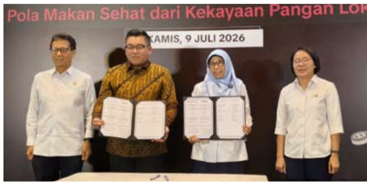
2026年7月9日，TikTok印尼公司在雅加达启动“健康饮食·美好生活” (Makan dengan Makna) 项目。这是其全球公益倡议“The Main Ingredient”在印尼的本土化实践，旨在倡导公众养成更加健康的饮食习惯。该项目得到印尼卫生部支持，并联合内容创作者、社区组织和公益机构共同推进。

据了解，“健康饮食·美好生活”项目是TikTok全球公益倡议“The Main Ingredient”在印尼的本土化实践，旨在倡导公众更多消费健康、优质的本地食品，推广科学膳食理念，助力提升全民健康水平。(er)