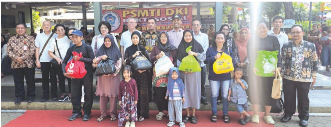
PSMTI雅加达特区分会诸理事与市长代表Nurhidayat向妇女们捐赠爱心礼包后合影。