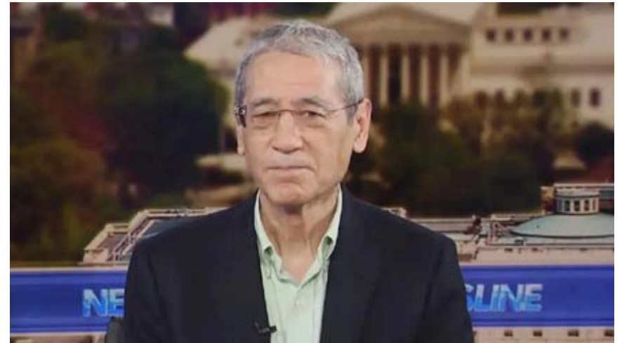
美国“反华专家”章家敦

表演下去。今年5月，中美元首在北京会晤中达成构建中美建设性战略稳定关系等一系列重要共识。构建建设性战略稳定关系是两国民心所向、国际社会所盼，也是中美根本利益之所系。美方需要进一步将元首共识落到实处，在言行上与那些想借“反华”提升自身话语权的政客和投机者保持距离。美国社会终会发现，恐慌叙事不能解决产业竞争问题，意识形态喊话不能弥补自身治理短板，打压中国也不能让美国自动变得更强大。美国商界、地方政府、普通消费者，乃至美国政