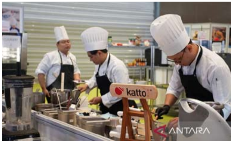
2026年印尼食品与酒店业展览会(FHI)将再度在雅加达举办, 以强化国内消费增长趋势。

【本报讯】2026年, 东南亚地区最大的餐饮服务市场——印尼食品与酒店展览会(FHI)将再度在雅加达举办, 以强化国内消费增长趋势及改变印尼食品、饮料及酒店业的社会生活方式。该行业在2024年的规模已达290亿美元。