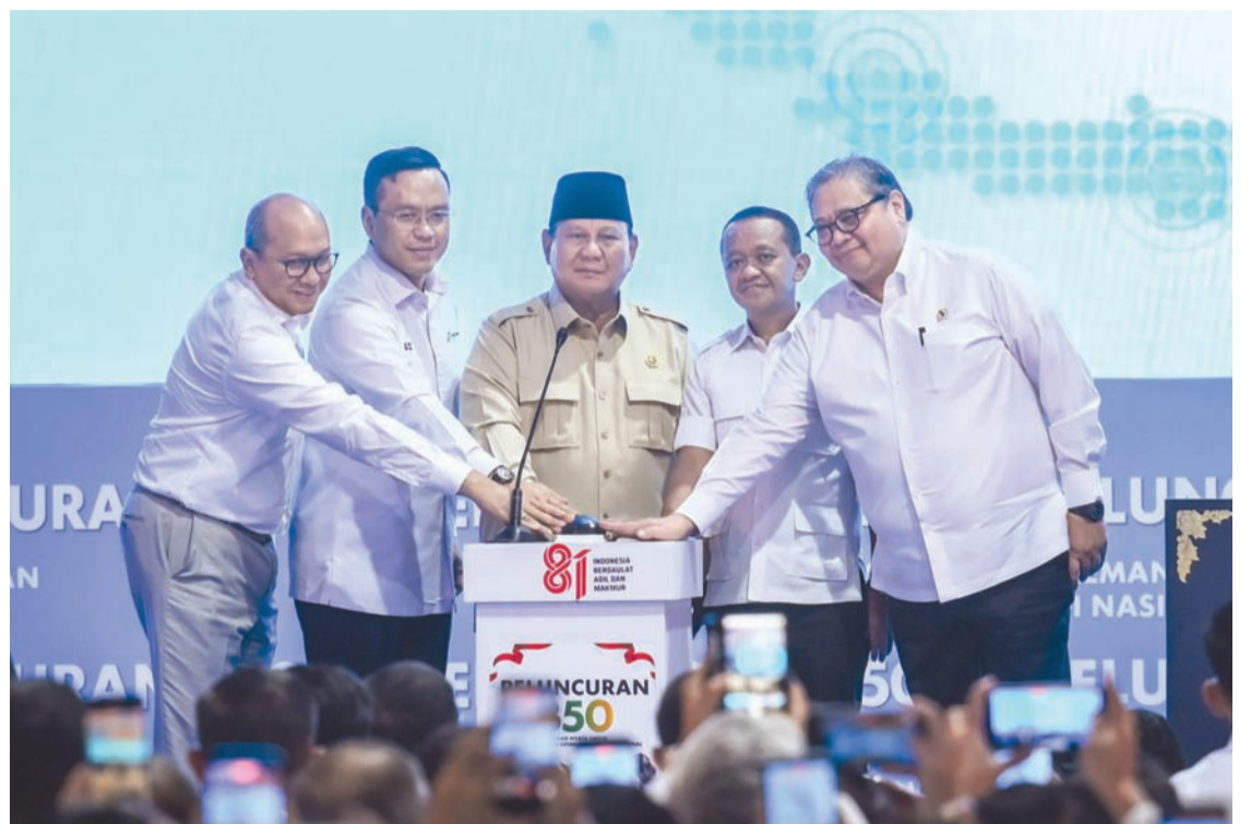
普拉博沃·苏比安托总统(中)与经济统筹部长艾尔朗卡·哈尔塔托(右)、能源与矿产资源部长巴赫利尔·拉哈达利亚(右二)、投资与下游化部长兼投资协调委员会(BKPM)主席、同时担任达南塔拉投资管理机构首席执行官罗桑·罗斯拉尼(左)以及国家石油公司总裁西蒙·阿洛伊修斯·曼蒂里(左二)，共同象征性按下按钮，启动B50生物柴油强制计划。

“不仅丰田测试过，奔驰也没问题。所以，从亚洲到欧洲，我们都测试过了。”巴赫利尔在西爪哇省加拉璜县KM 57休息区举行的