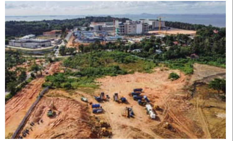
资料图片：印尼政府正研究将经济特区 (KEK) 作为印尼国际金融中心 (PFII) 的选址方案之一。

低税制度必须得到严格遵守。印尼将在遵循国际规则的基础上保持政策竞争力，相关激励政策方案目前仍在与国会进一步研究和完善。