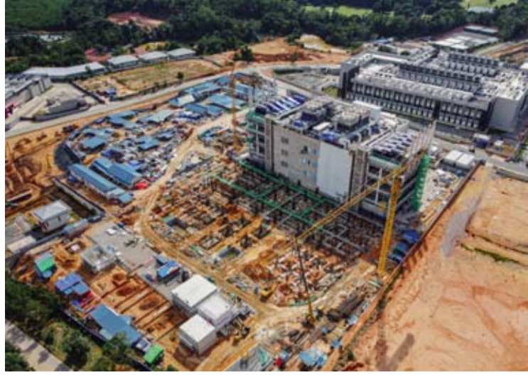
2026年6月16日航拍的印尼廖内群岛省巴淡市农沙数字园经济特区 (Nongsa Digital Park) 数据中心建设现场。

【本报讯】当前，地缘政治格局持续演变、全球贸易碎片化趋势加剧、国际供应链体系深度调整，为印尼培育东南亚新兴物流枢纽带来新的发展机遇。其中，巴淡凭借毗邻新加坡和马来西亚的区位优势，被视为印尼连接东盟及国际市场的重要门户。