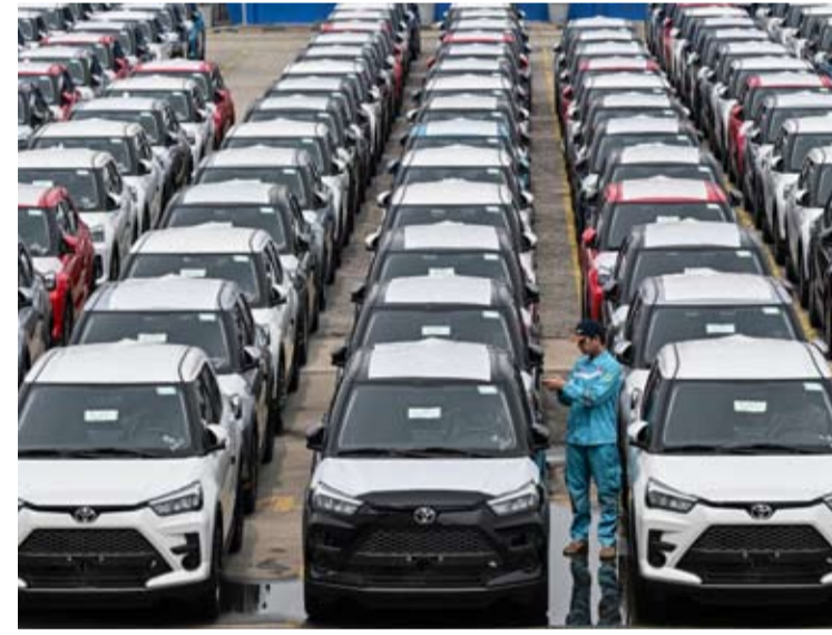
2026年6月23日，工作人员在雅加达丹戎不碌港印尼汽车码头公司检查出口汽车。

菲特拉强调，提高劳动者技能水平和产业适应能力，是推动再工业化战略顺利实施的关键。只有不断提升本国人力资源质