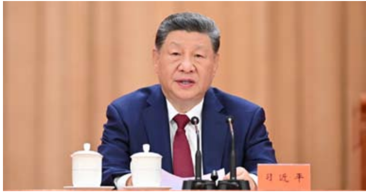
7月9日12时许,福建泉州晋江市一鞋厂发生火灾,造成重大人员伤亡。中共中央总书记、国家主席、中央军委主席习近平发表重要讲话。

根据习近平重要指示和李强要求,应急管理部已派出工作组赶赴现场指导。福建省已组织力量全力做好伤员救治和现场处置等工作。7月9日12时许,福建泉州晋江市辉腾鞋业有限公司厂房发生火灾,造成人员伤亡。