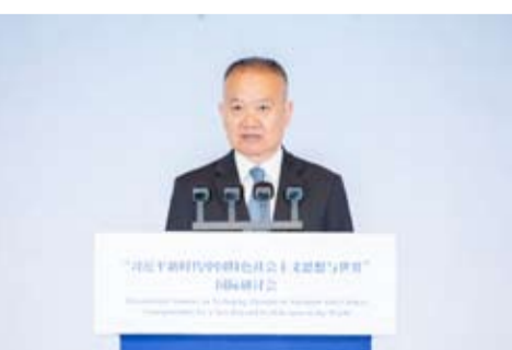
中共中央对外联络部部长刘海星在主旨讲话中表示,在迈向现代化道路上,摆脱贫困是各国面临的共同挑战。

中共中央对外联络部部长刘海星在主旨讲话中表示,中共十八大以来,以习近平同志为核心的中共中央把脱贫攻坚摆在治国理政的突出位置,团结带领中国人民历史性解