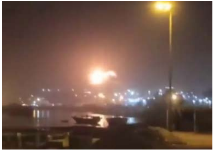
7月9日发布的一段社交媒体视频截图显示,在恰巴哈尔(Chabahar)一座海上交通管制塔遭到袭击后,现场升起浓烟。

【中新社北京7月9日电】综合消息:美军8日夜继续对伊朗发动军事打击。伊朗伊斯兰革命卫队9日通报称,作为回应,伊朗对科威特、巴林的美军基地实施打击,并警告可能扩大打击范围。